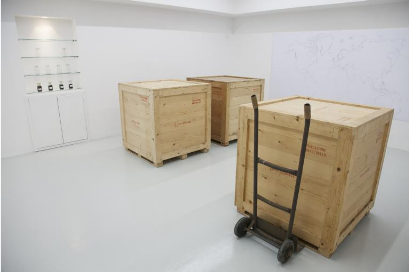
Gianfranco Baruchello, Earth Exchange. Veduta dell'installazione.

a una seconda azienda, da cui usciranno entrambe riempite per metà del terreno di una tenuta e per l'altra metà di quello della seconda tenuta con cui è avvenuto lo scambio. Entrambe le tenute diverranno a loro volta custodi di una delle due casse contenenti il terreno condiviso.