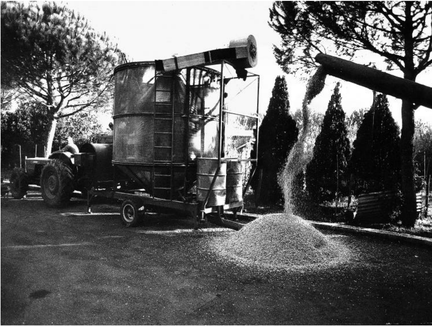
Gianfranco Baruchello, Bonifica del campo sud (Agricola Cornelia S.p.A), 1974; Nascita, crescita e raccolto del mais (Agricola Cornelia S.p.A), 1974-1975; Un raccolto di mais dopo l'essiccamento (Agricola Cornelia S.p.A), 1975. Documentazione fotografica.