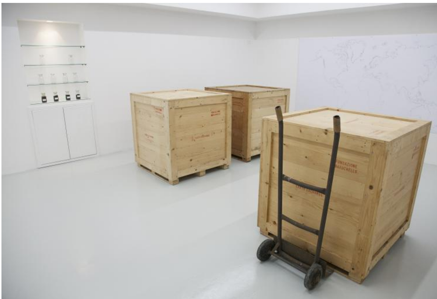
Gianfranco Baruchello, Earth Exchange. Veduta dell'installazione.

Anche per questa agenzia il luogo di partenza è la tenuta di via Cornelia. Dall'allevamento del bestiame alla coltivazione della terra, la seconda agenzia riguarda un progetto inaugurato nel 2008: uno scambio di terreno tra aziende agricole. In tempi di sharing economy , cioè economia generata non dall'impresa, ma dalla condivisione di azioni quotidiane che svolgeremmo comunque – come dare un passaggio a qualcuno mentre andiamo al lavoro in auto o ospitare chi ne ha bisogno a casa nostra in cambio di un rimborso spese –, qui si parla di condivisione dei terreni, con la particolarità che in questo caso per essere scambiati questi devono corrispondere a determinate caratteristiche chimiche. «Custode dei valori antichi e patrimonio del vivente», la terra può generare o meno la vita. Le due casse dentro la stanza custodiscono a loro volta lo scambio di terreni. Una piena del terreno di via Cornelia, l'altra vuota sono inviate entrambe a una seconda azienda, da cui usciranno entrambe riempite per metà del terreno di una tenuta e per l'altra metà di quello della seconda tenuta con cui è avvenuto lo scambio. Entrambe le tenute diverranno a loro volta custodi di una delle due casse contenenti il terreno condiviso.