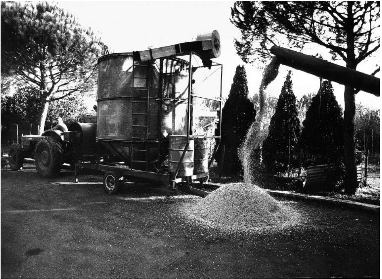
Gianfranco Baruchello, Bonifica del campo sud (Agricola Cornelia S.p.A), 1974; Nascita, crescita e raccolto del mais (Agricola Cornelia S.p.A), 1974-1975; Un raccolto di mais dopo l'essiccamento (Agricola Cornelia S.p.A), 1975. Documentazione fotografica.