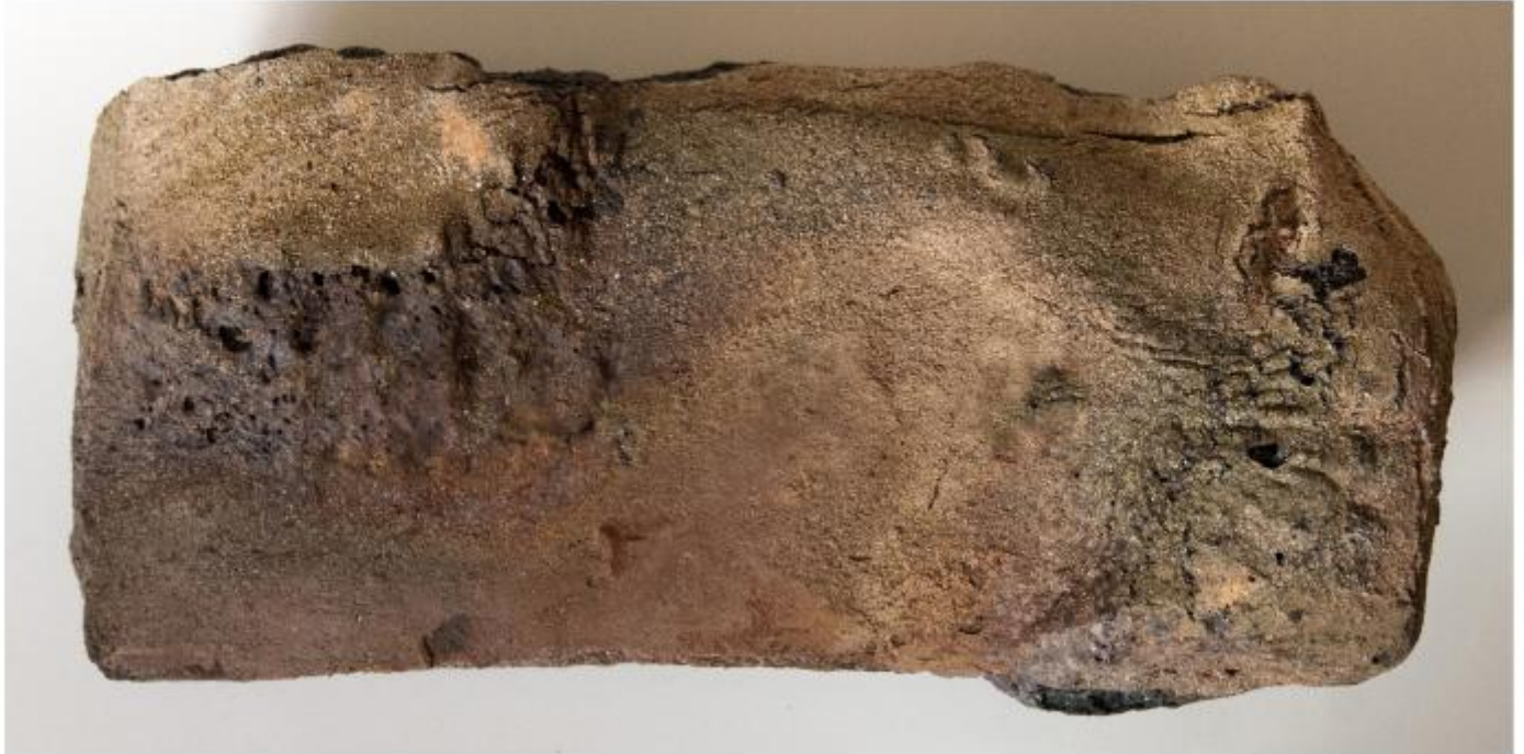
Mattone storto deformatosi al contatto con l'atmosfera