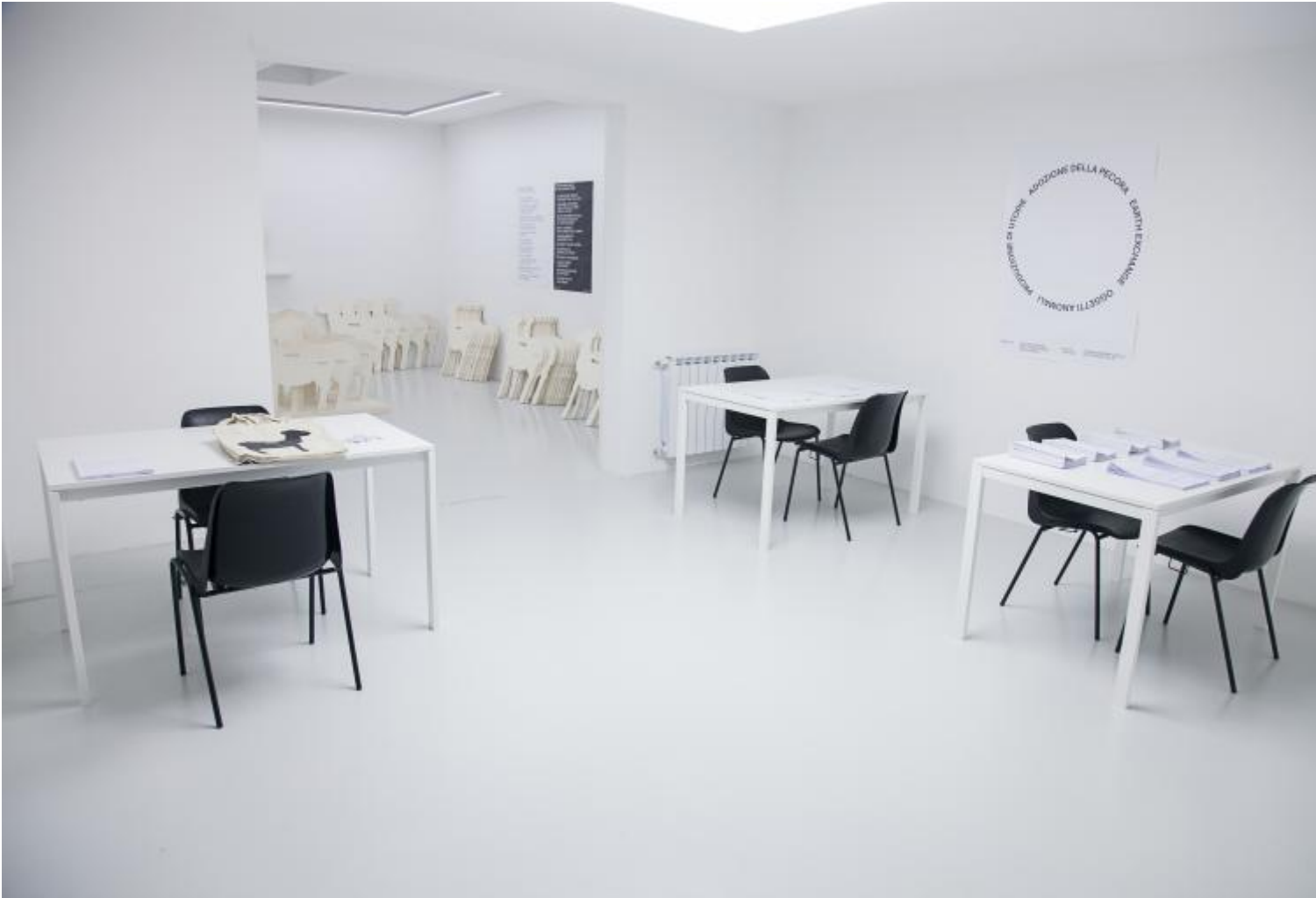
Start Up. Quattro agenzie per la produzione del possibile. Veduta della mostra.

termini sono a volte soggetti a interpretazioni e usi diversi non sempre uniformi, tanto da lasciare lo spazio per qualche dubbio più o meno dichiarato in chiunque non sia un economista di nuova generazione o non abbia nel suo curriculum professionale almeno uno di questi progetti. La confusione è tale che persino sulla corretta scrittura ci sono diverse scuole di pensiero. Chi abusa della maiuscola, chi separa i diversi termini, chi li unisce con il trattino e chi opta per una forma minuscola e tutta attaccata a sottolineare il neologismo e l'accezione comune del termine .