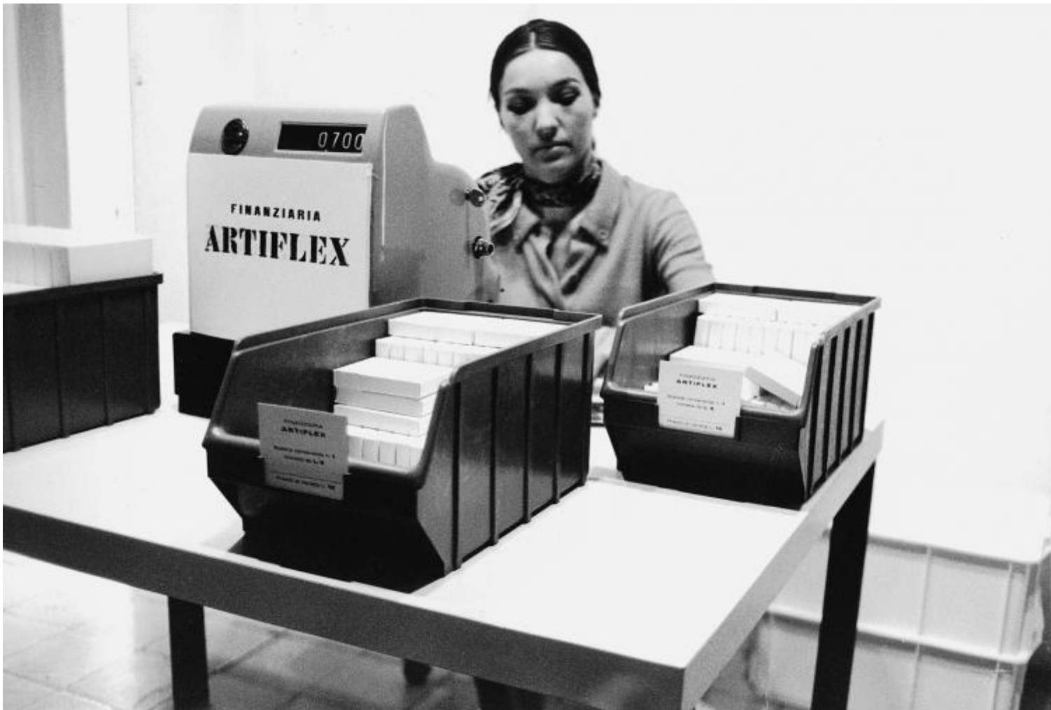
Gianfranco Baruchello, Artiflex (Finanziaria Artiflex) , 1968. Documentazione fotografica.

Questa seconda vita dura almeno fino al 1973, quando si trasferisce nella campagna romana, a Nord di Prima Porta. Qui fonda Agricola Cornelia S.p.A. , un progetto artistico, economico, produttivo e agricolo. Ancora una volta l'arte si presta a rappresentare la produzione, questa volta però nella materialità del prodotto agricolo e terriero. La coltivazione della terra, il mantenimento di una destinazione agricola anziché edilizia, sono i tratti alla base di questo progetto che dura fino al 1981. Senza abbandonare i linguaggi già sperimentati, le sue opere come il film Il grano (1974-75), o i suoi plexiglass e allumini, le sue scatole e i suoi oggetti si ispirano all'esperienza della produzione agricola. Nel 1978 un elicottero della polizia atterra nel suo giardino durante le ricerche di Aldo Moro, sequestrato dalle Brigate Rosse. Nel 1982 Francois Lyotard gli dedica il libro La pittura del segreto nell'epoca postmoderna (Feltrinelli, Milano 1982). How to imagine. A narrative on art and agriculture (McPherson & Company, New York 1983) è il libro tratto dalla conversazione tra Baruchello e il musicista Henry Martin sull'esperienza conclusa due anni prima e durata otto anni. Come ogni cosa fatta da Baruchello non viene però superata e accantonata ma i suoi echi si ritrovano successivamente non solo in questa recente mostra ma in libri come ad esempio Bellissimo il giardino (Exit, Lugo 1989).