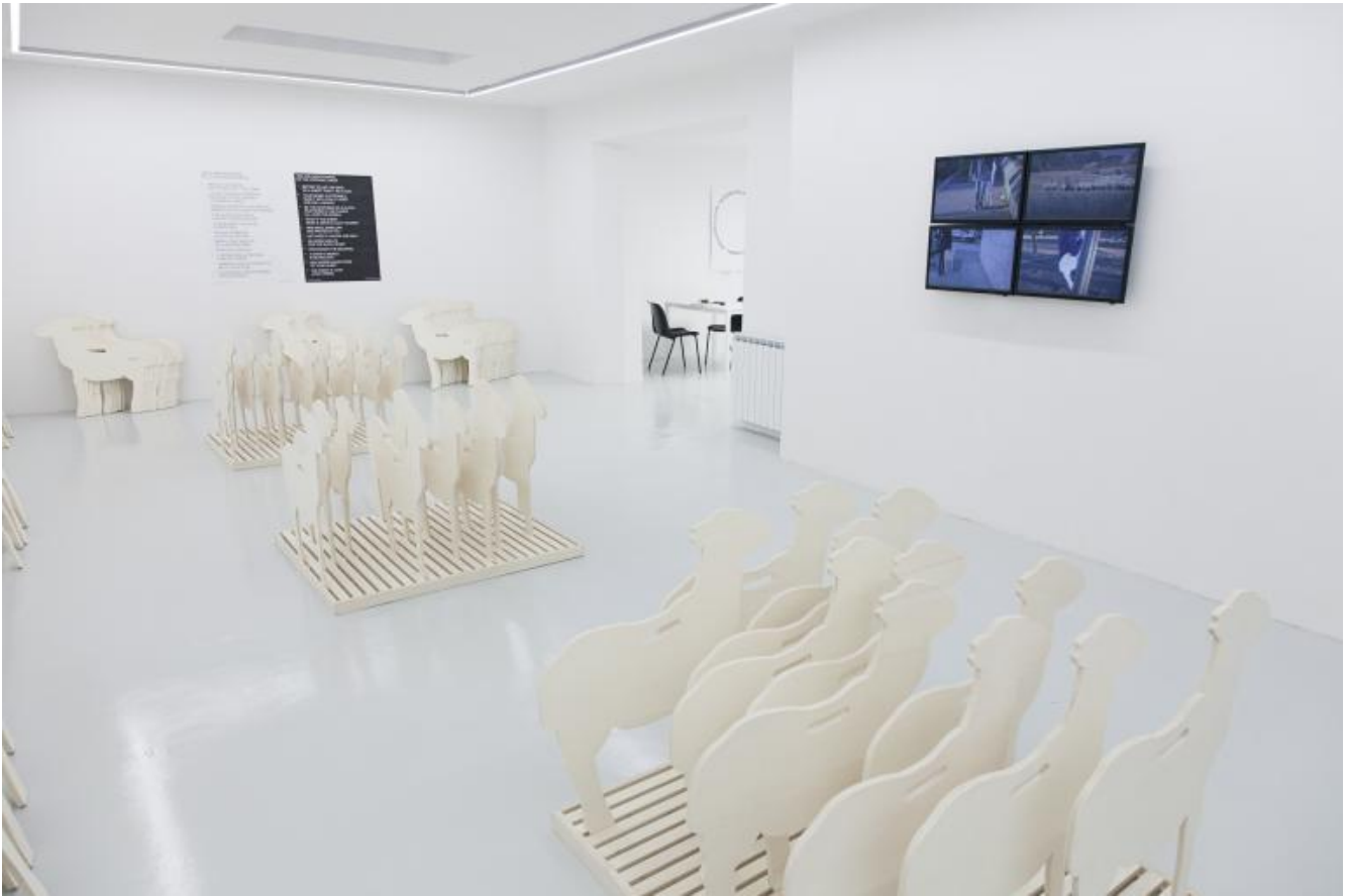
Gianfranco Baruchello, Adozione della pecora . Veduta dell'installazione.