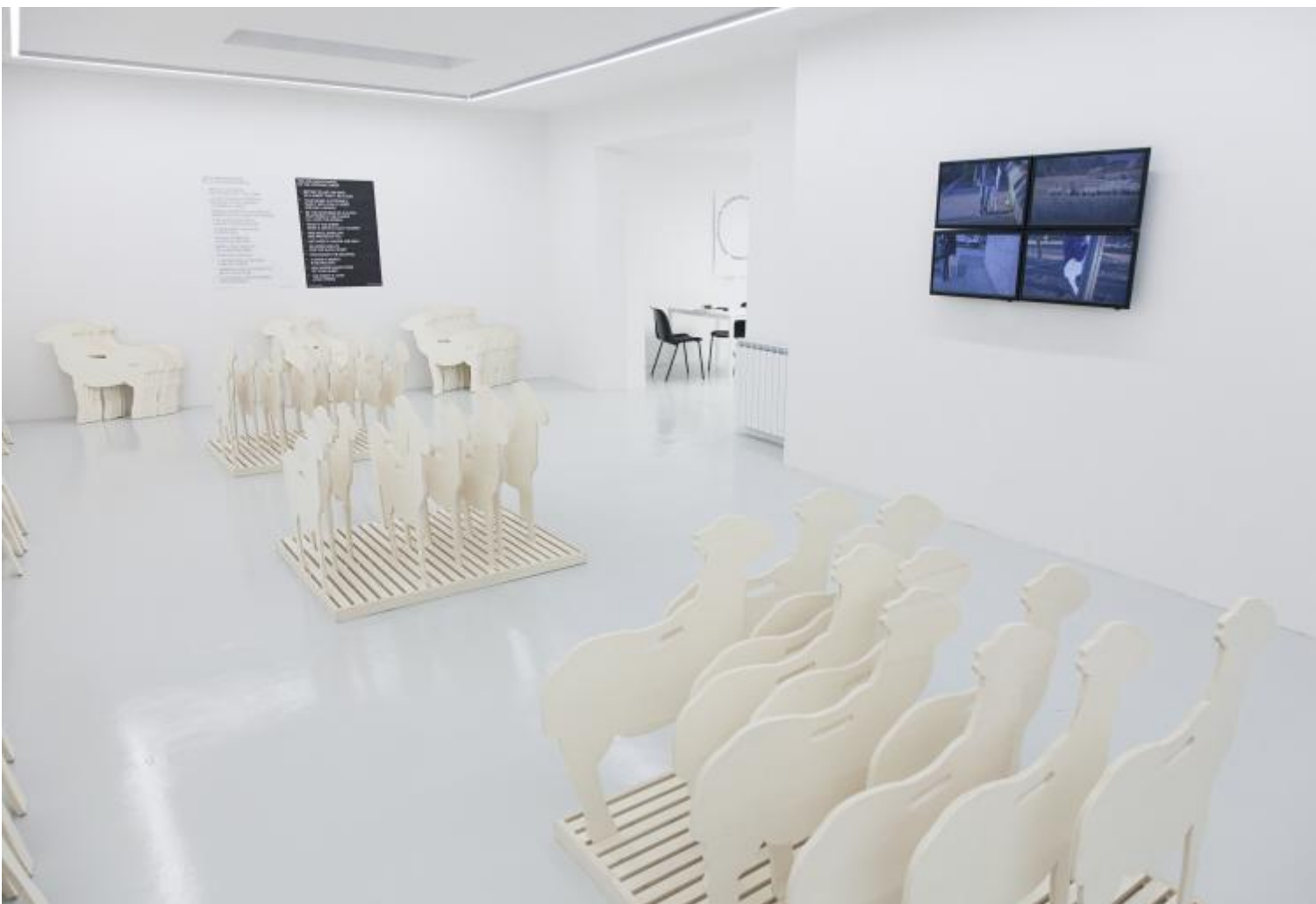
Gianfranco Baruchello, Adozione della pecora. Veduta dell’installazione.

Adozione della pecora è il nome della prima “agenzia”. «Sull’importanza, oggi, di ripensare la pecora» è in sintesi la chiave di volta su cui si sostiene l’operazione. Cento pecore sono esposte come in una showroom. Disposte sopra appositi espositori, griglie e mensole, le pecore sono sagome di legno compresso. Ognuna è timbrata, firmata e numerata. Ognuna è un’opera multipla, con la surreale e mistificatoria funzione di accompagnarci nelle nostre giornate, al parco, alla posta, al supermercato. Video promozionali ne illustrano i possibili usi. Altre immagini si riferiscono all’originale, che ne ha ispirato il surrogato. Compreso nell’acquisto un decalogo di buone maniere ad uso e consumo del collezionista per una nuova consapevolezza del mite animale in attesa di qualcuno che lo acquisti. Pardon: che lo adotti.