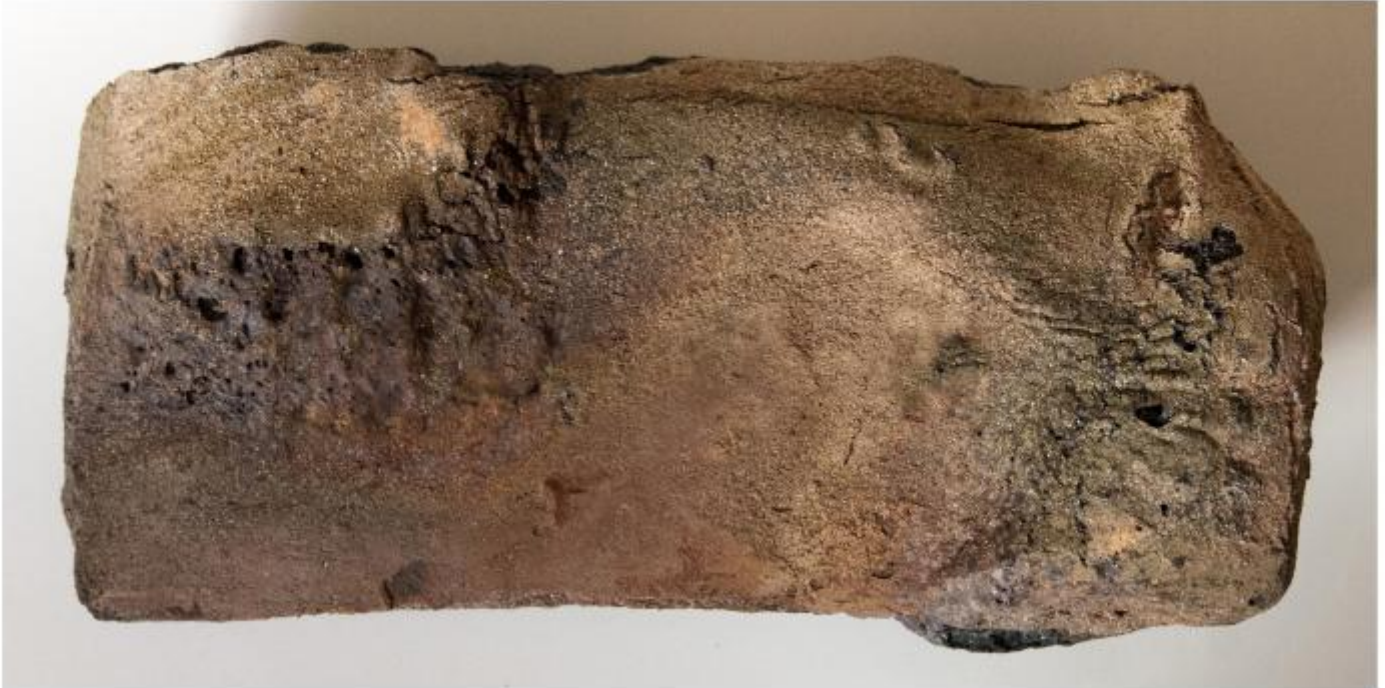
Mattone storto deformatosi al contatto con l'atmosfera