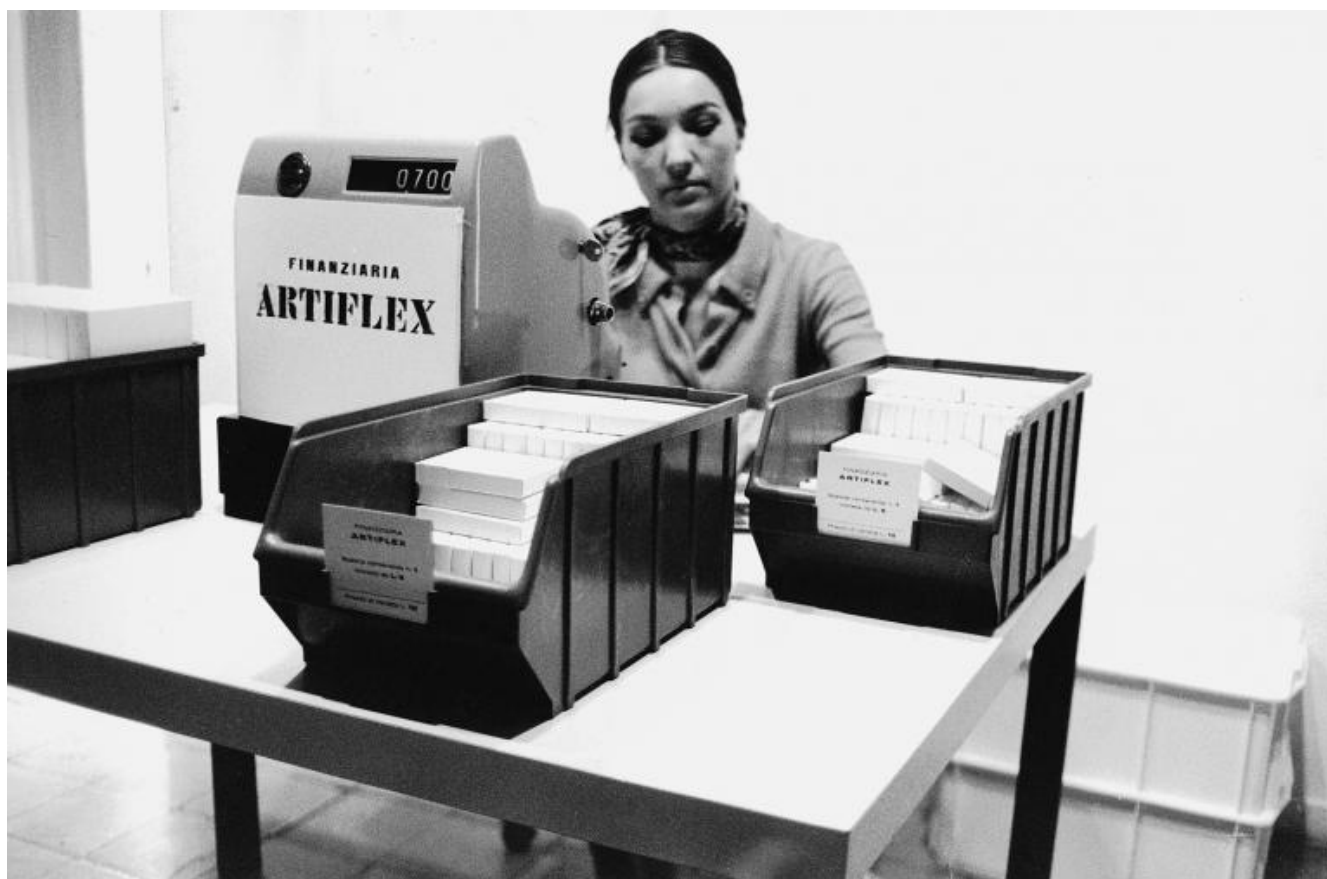
Gianfranco Baruchello, Artiflex (Finanziaria Artiflex), 1968. Documentazione fotografica.

Questa seconda vita dura almeno fino al 1973, quando si trasferisce nella campagna romana, a Nord di Prima Porta. Qui fonda Agricola Cornelia S.p.A. , un progetto artistico, economico, produttivo e agricolo. Ancora una volta l'arte si presta a rappresentare la produzione, questa volta però nella materialità del prodotto agricolo e terriero. La coltivazione della terra, il mantenimento di una destinazione agricola anziché edilizia, sono i tratti alla base di questo progetto che dura fino al 1981. Senza abbandonare i linguaggi già sperimentati, le sue opere come il film Il grano (1974-75), o i suoi plexiglass e allumini, le sue scatole e i suoi oggetti si ispirano all'esperienza della produzione agricola. Nel 1978 un elicottero della polizia atterra nel suo giardino durante le ricerche di Aldo Moro, sequestrato dalle Brigate Rosse. Nel 1982 Francois Lyotard gli dedica il libro La pittura del segreto nell'epoca postmoderna (Feltrinelli, Milano 1982). How to imagine. A narrative on art and agriculture (McPherson & Company, New York 1983) è il libro tratto dalla conversazione tra Baruchello e il musicista Henry Martin sull'esperienza conclusa due anni prima e durata otto anni. Come ogni cosa fatta da Baruchello non viene però superata e accantonata ma i suoi echi si ritrovano successivamente non solo in questa recente mostra ma in libri come ad