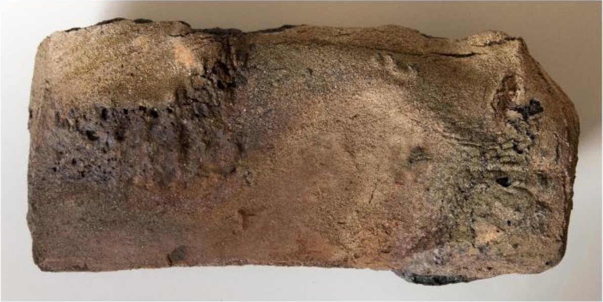
Mattone storto deformatosi al contatto con l'atmosfera