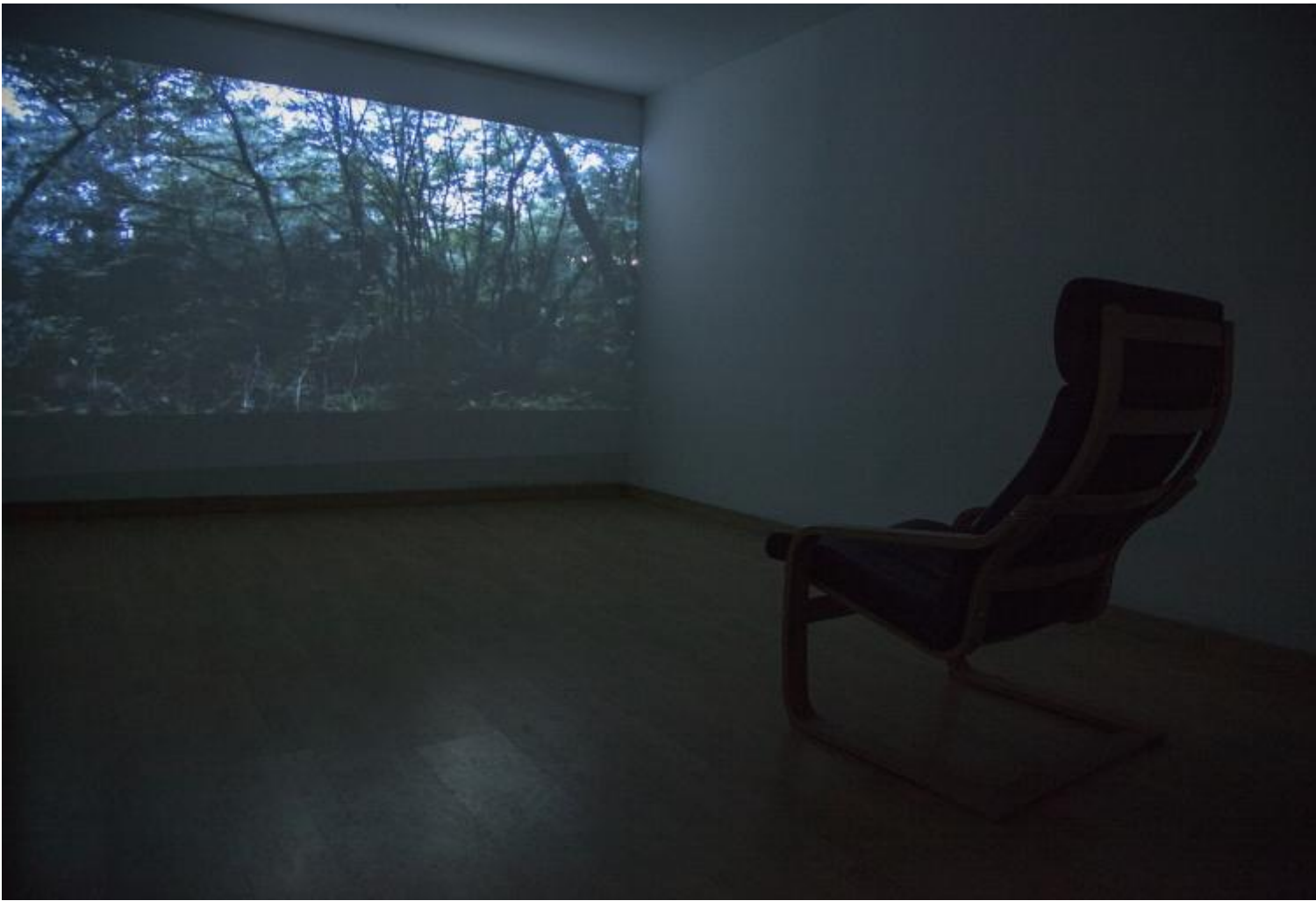
Gianfranco Baruchello, Earth Exchange.

Chiude il giro di giostra l'immersione dentro un bosco simulato, «possibile attivatore di pensieri e immaginazione». La visione di un bosco è proiettata in una sala dove l'ospite scende in solitaria alla ricerca di un'emozione «offerta» dall'artista e in cambio della quale dovrà donare una parola che la riassume.