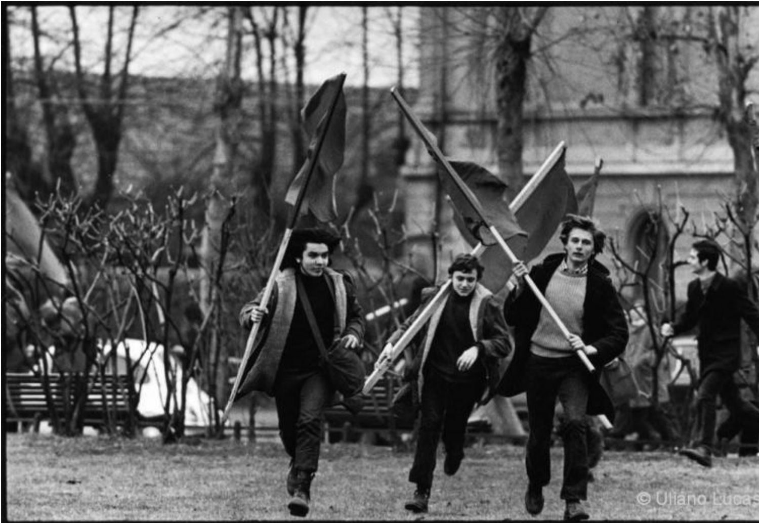
Uliano Lucas, Piazzale Accursio, Milano 1971.