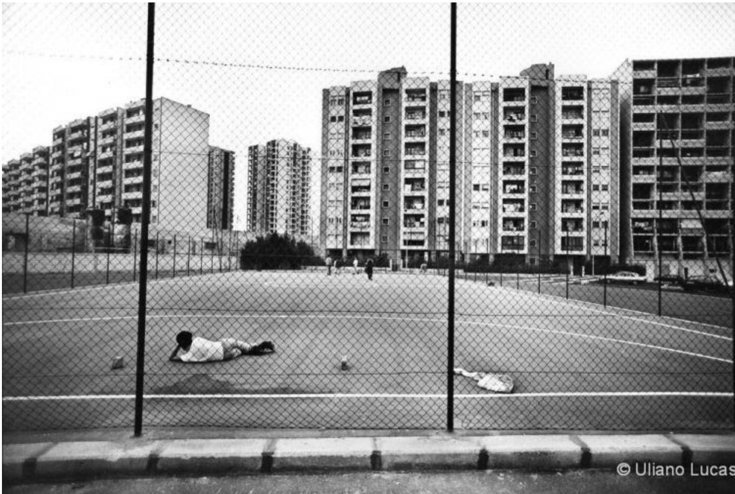
Uliano Lucas, Quartiere Paolo VI, Taranto, 1995 ca.

E poi chiediti una cosa, mi suggerisce: “Perché uno dopo aver visto delle atrocità deve fare una fotografia?”, “Che tipo di fotografia deve fare”?