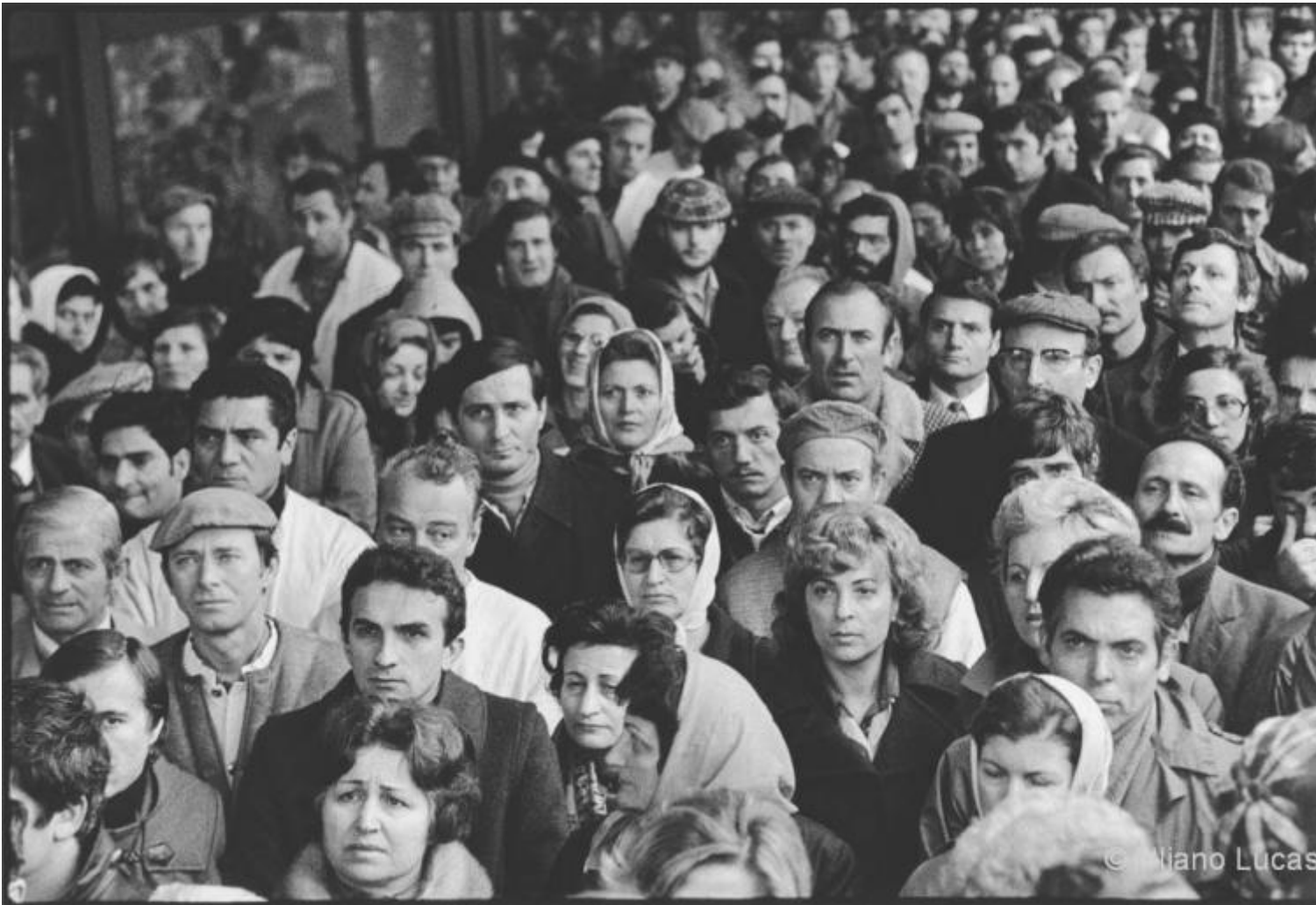
Uliano Lucas, Comizio sindacale degli operai della Pirelli, Milano, 1977.