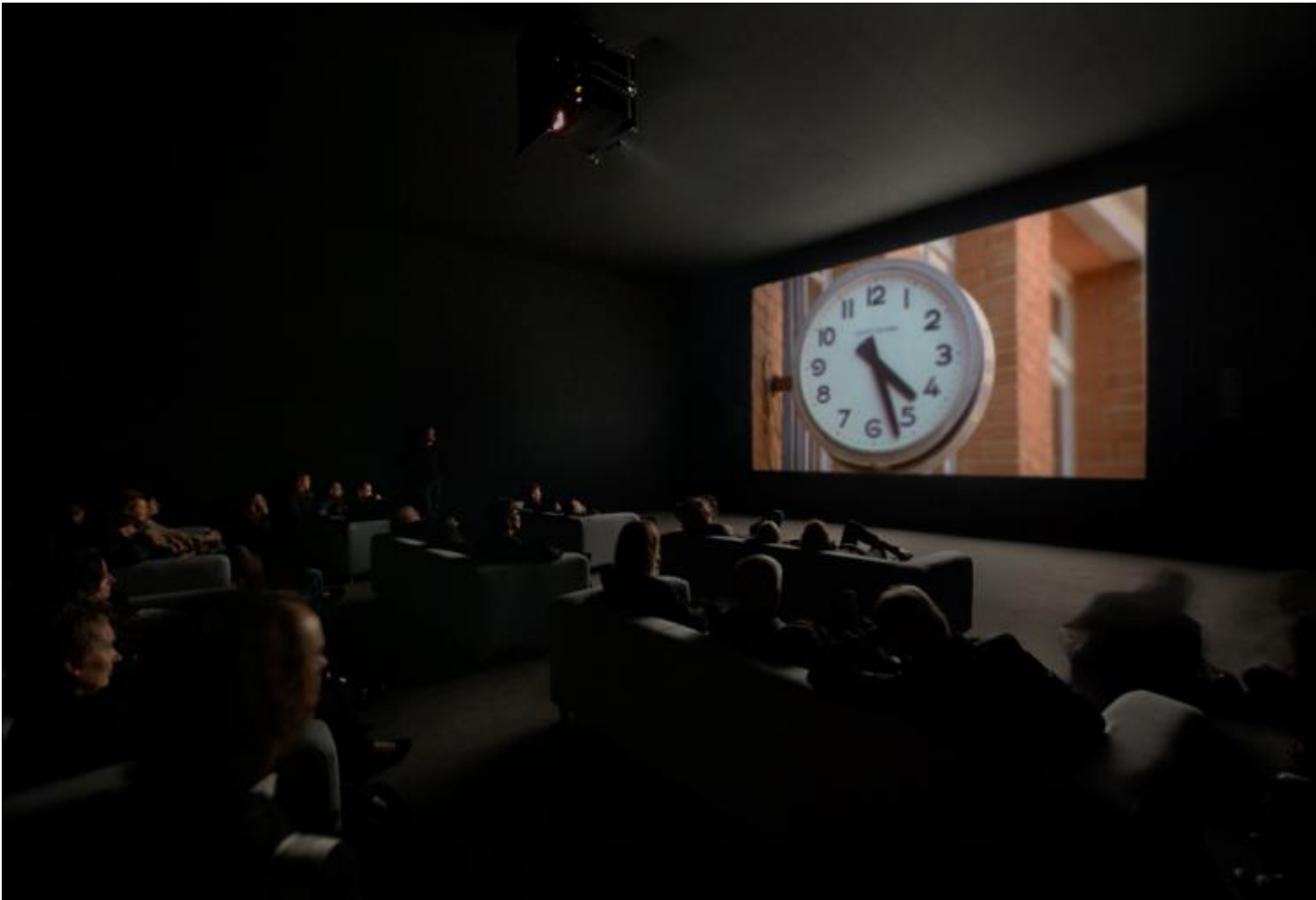
Schermo e finestra

Uno schermo è tutto tranne che invisibile, come aveva ben intuito l’avanguardia degli anni venti, da Kiesler quando concepisce lo “screen-o-scope” nel 1928 a Moholy-Nagy con le sue idee visionarie sulla geometria dello schermo, prima che qualsiasi immagine vi sia proiettata. Limitandoci alle immagini che scorrono sullo schermo ignoriamo la presenza fisica di quest’interfaccia, che è poi anche quella dei nostri computer, cellulari, palmari e così via.