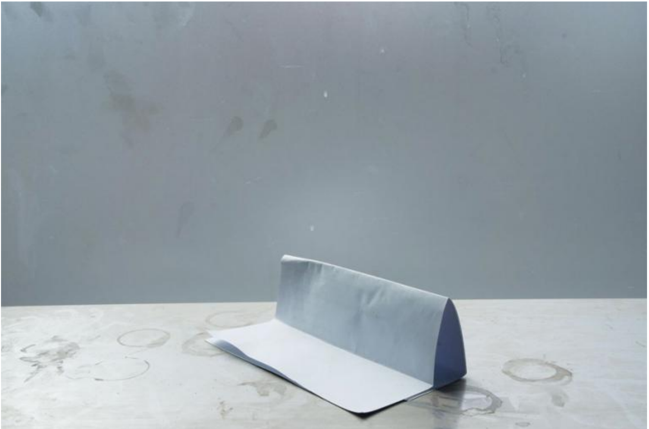
Jessica Backhaus, like the wind, 2013, da six degrees of freedom, Kehrer Verlag Heidelberg Berlin, 2015, p.3.

Così le immagini di Jessica Backhaus costituiscono una sorta di mappa psicogeografica della sua memoria. Il libro da cui sono tratte si intitola six degrees of freedom (Kehrer Verlag Heidelberg Berlin, 2015). La tecnica adottata le viene in soccorso: il tutto-a-fuoco che avvicina e rende in senso tattile gli oggetti, avvicina anche gli istanti perduti nello scorrere del tempo, consentendole di abbandonarsi – insieme allo spettatore – ad un’intima forma di “astrazione contemplativa”, e nello stesso tempo rivelano l’ombra insieme reale e metaforica del fotografo, trattenuta al suo interno.