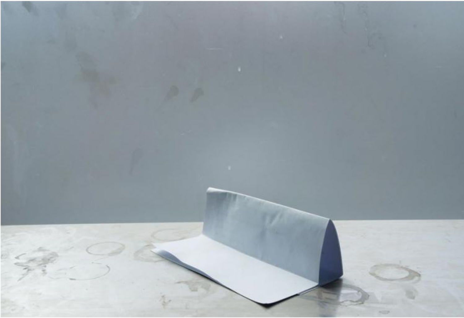
Jessica Backhaus, like the wind, 2013, da six degrees of freedom, Kehrer Verlag Heidelberg Berlin, 2015, p.3.

Il libro si apre – in una sorta di inversione semantica – con l’immagine di un foglio chiuso, piegato e posto su una superficie: “like the wind”, si legge nella didascalia. E da qui è un dispiegarsi di immagini-oggetto: un filo, una pietra, delle biglie, una corda, una scala, uno skateboard, delle strisce di carta colorata, un nastro di Möbius. Ci sono anche alcuni paesaggi, visti come attraverso superfici trasparenti, o da dietro una tenda: alberi, edifici, una strada.