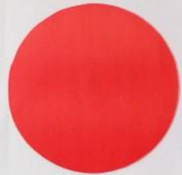
Grito en la noche