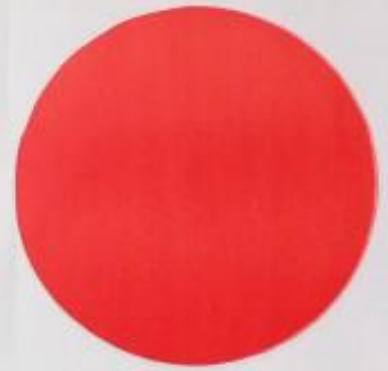
Grito en la noche