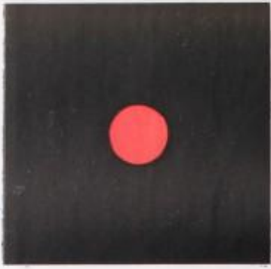
Hueco en el techo