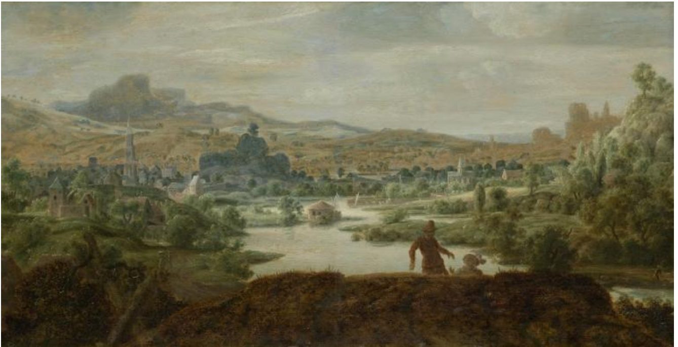
Hercules Segers, Paesaggio sul fiume con figure, olio su tela su tavola, ca. 1625-1630, collezione privata.