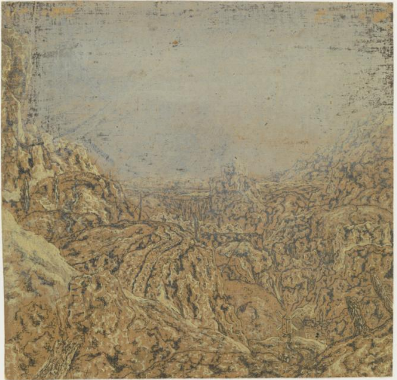
Hercules Segers, Paesaggio roccioso con una strada che costeggia una gola, ca. 1615-1630, Amsterdam, Rijksmuseum.

Presi dalla bellezza di questi paesaggi non ci si rende conto che in alcuni casi siamo veramente di fronte a “dipinti stampati”, come giustamente scrisse Van Hoogstraten nel 1678. Infatti non c’è solo la natura atipica del suo lavoro non seriale a entrare in gioco, con interventi a mano che conferiscono al tutto una qualità pittorica. Non è solo questo. Segers stampava anche su stoffa. Su lino, o su cotone, come per questa piccola opera, un Paesaggio roccioso con una strada che costeggia una gola (fig. 6, cm 15 x 16). La strada, appena percettibile, si snoda sulla sinistra.