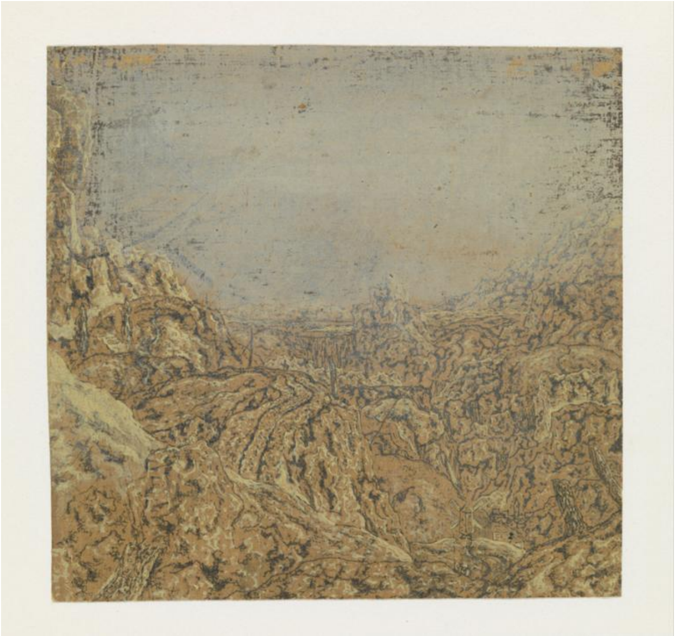
Hercules Segers, Paesaggio roccioso con una strada che costeggia una gola, ca. 1615-1630, Amsterdam, Rijksmuseum.