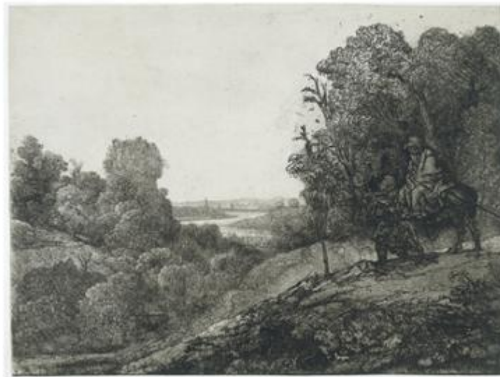
Hercules Segers, Tobiolo e l'angelo; Rembrandt van Rijn, La fuga in Egitto (da Segers), Amsterdam, Rijksmuseum.

Abbiamo qui una singolare catena di grandi autori: Segers si era infatti basato su di un' incisione di Endrick Goudt, un d'après dal dipinto Tobiolo e l'angelo di un artista anonimo (olio su rame, conservato a Londra, alla National Gallery), la copia di un'opera perduta di Adam Elsheimer, Tobiolo e l'angelo .