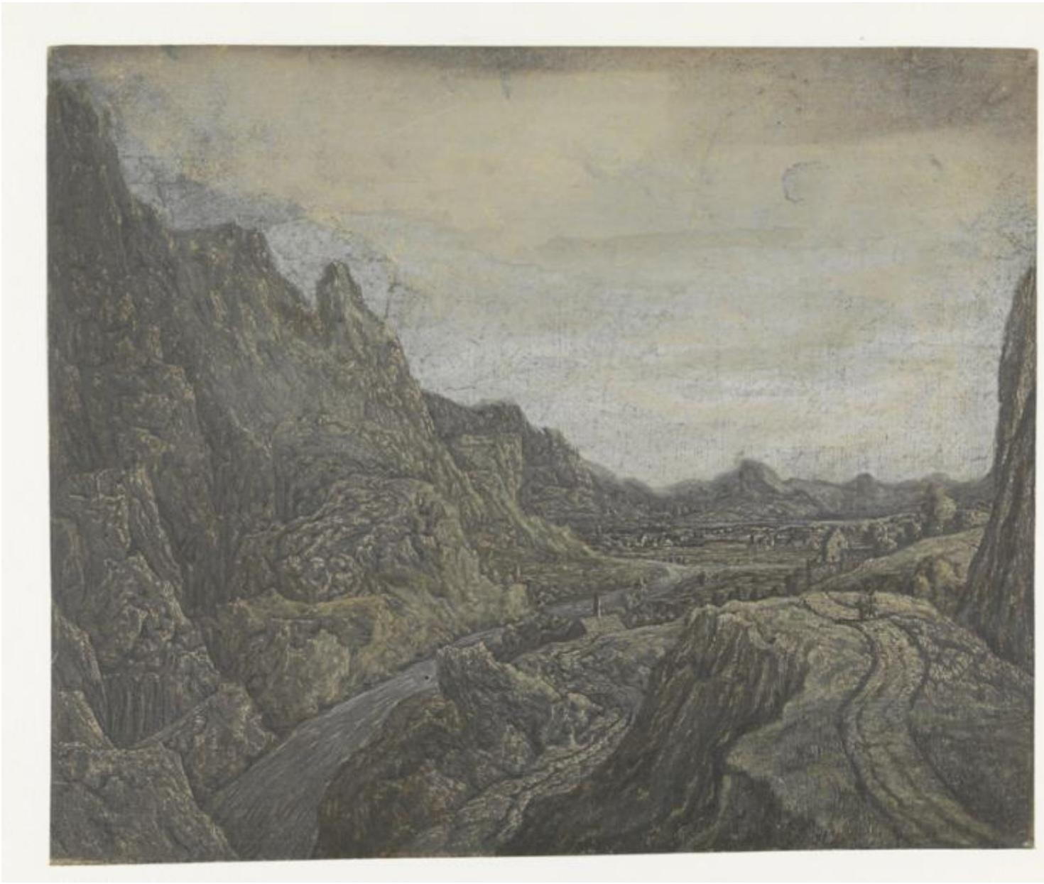
Hercules Segers, Paesaggio roccioso con strada e fiume, ca. 1615-1630, Amsterdam, Rijksmuseum.

Vedute alpine e vallate rocciose di desolante bellezza, popolate da ombre. Rare presenze umane, così piccole che amplificano il senso di vuoto della scena. Tronchi stecchiti e nudi sono a volte descritti in primo piano a fissare il luogo dello spettatore. Alpi svizzere, Tirolo, Appennini o Dalmazia? Vari tentativi sono stati fatti per trovare un legame visivo, varie le ipotesi di viaggi, ma senza successo. Non è come per Pieter Bruegel il Vecchio (1525-1569) che aveva stupito Karel van Mander perché, viaggiando in Italia, seppe poi riprodurre con grande maestria i paesaggi visti: “nell’attraversare le Alpi [Bruegel] si era nutrito di montagne e rocce al punto da riversarle più tardi sulla tela con una fedeltà addirittura sorprendente”. No, oggi si ritiene che Hercules Segers non andò mai più in là di Bruxelles.