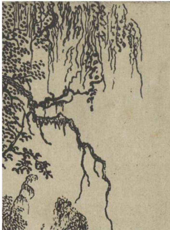
Hercules Segers, Strada con alberi, una città sullo sfondo, e dettaglio, ca. 1622-1625, Amsterdam, Rijksmuseum.

Una strada con alberi a sinistra, una cittadina in lontananza, tutto sembra apparentemente molto normale. Ma il segno è immediato e fluido come un disegno a pennino, non vi sono chiaroscuri, sfumature o toni. Non può essere un segno nato da bulino, puntasecca o acquaforte... siamo di fronte a qualcosa di totalmente nuovo.