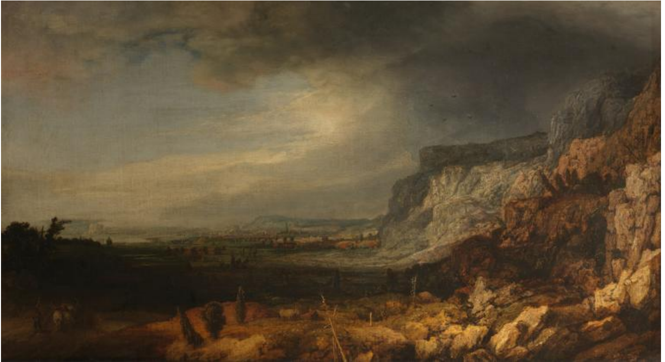
Hercules Segers, Paesaggio di montagna, olio su tela su tavola, ca. 1620-1625, Firenze, Galleria degli Uffizi.

Sembra che sia proprio grazie a questo dipinto “roccioso” che Segers pittore, dopo esser stato dimenticato per più di un secolo, sia tornato ad attirare l’attenzione dei critici, intorno al 1870. Molto mal conservato dopo la sua morte, il quadro presentava un buco al centro e molti ritocchi in un’ampia zona a destra, nel cielo. Si pensava che fossero di mano di Rembrandt, ma oggi sappiamo che non è così.