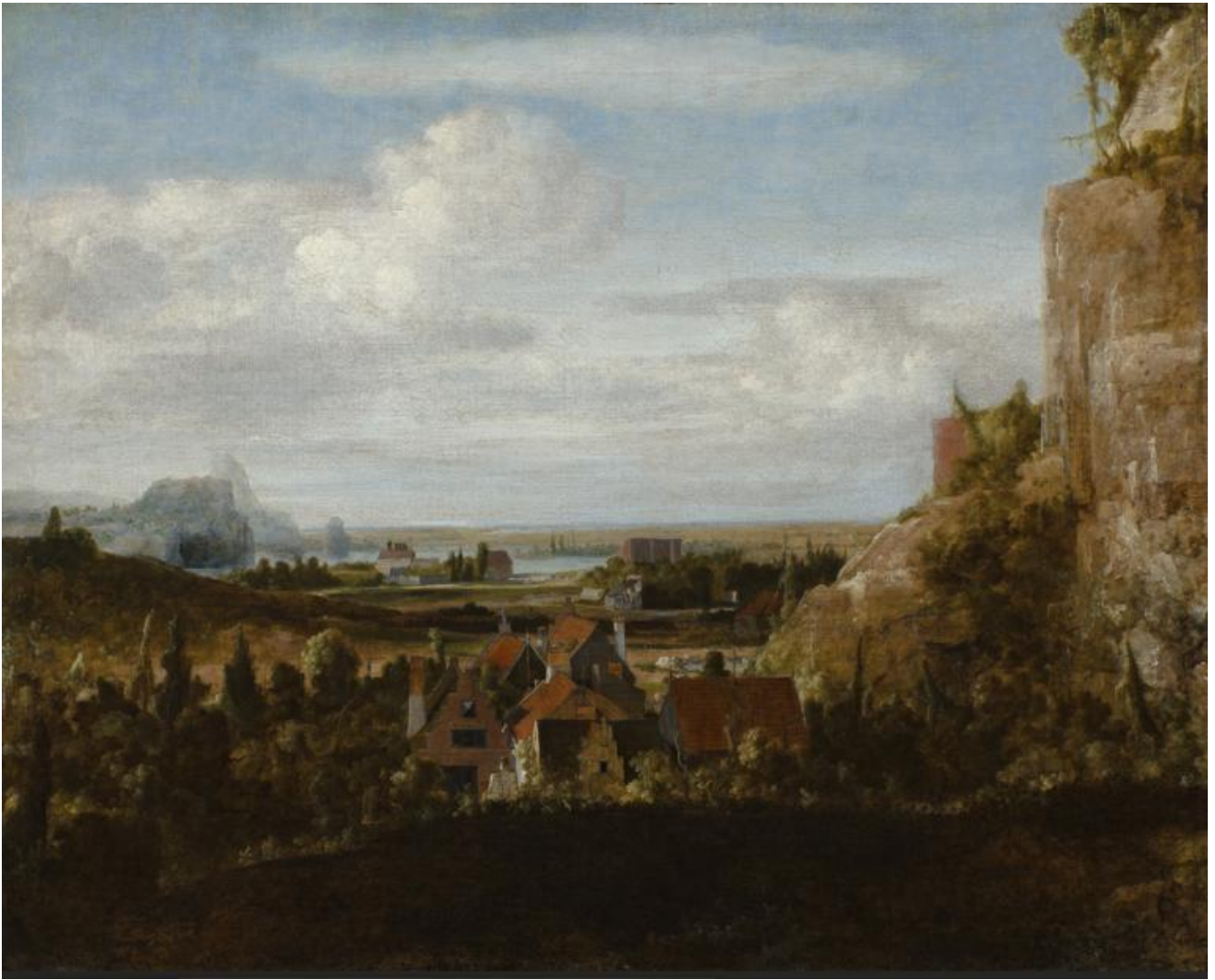
Hercules Segers, Case vicino a dirupo, olio su tela, ca.1619-1623, Rotterdam, Museum Boijmans Van Beuningen.

Ma la tela più suggestiva e più grande ad oggi conosciuta, e conservata a Firenze agli Uffizi, ci mette di fronte a una parete rocciosa di pura invenzione, sassi di varia natura tra terra e cielo, che sovrastano una veduta, una valle, dell'acqua, una cittadina all'orizzonte (fig. 10, cm 55 x 99). È come se stessi per arrivare da un tortuoso viaggio nella natura selvaggia e ci accogliesse una visione. Anche in pittura, nel descrivere le rocce, egli mantiene un andamento a volte rapido e spezzato, a volte mimetico, quasi ad indagare e mostrare la natura stessa delle cose. Rocce immaginate, ma studiate intimamente e da vicino, forse partendo da comuni sassi, antico trucco già nei consigli di Cennino Cennini che intorno al 1400 suggeriva Il modo del ritrarre una montagna del naturale : "se vuoi pigliare buona maniera di montagne e che paino naturali, toglì di pietre grandi che siano scogliose e non pulite, e ritra'ne del naturale, dando i lumi e scuro, secondo che la ragione t'acconsente".