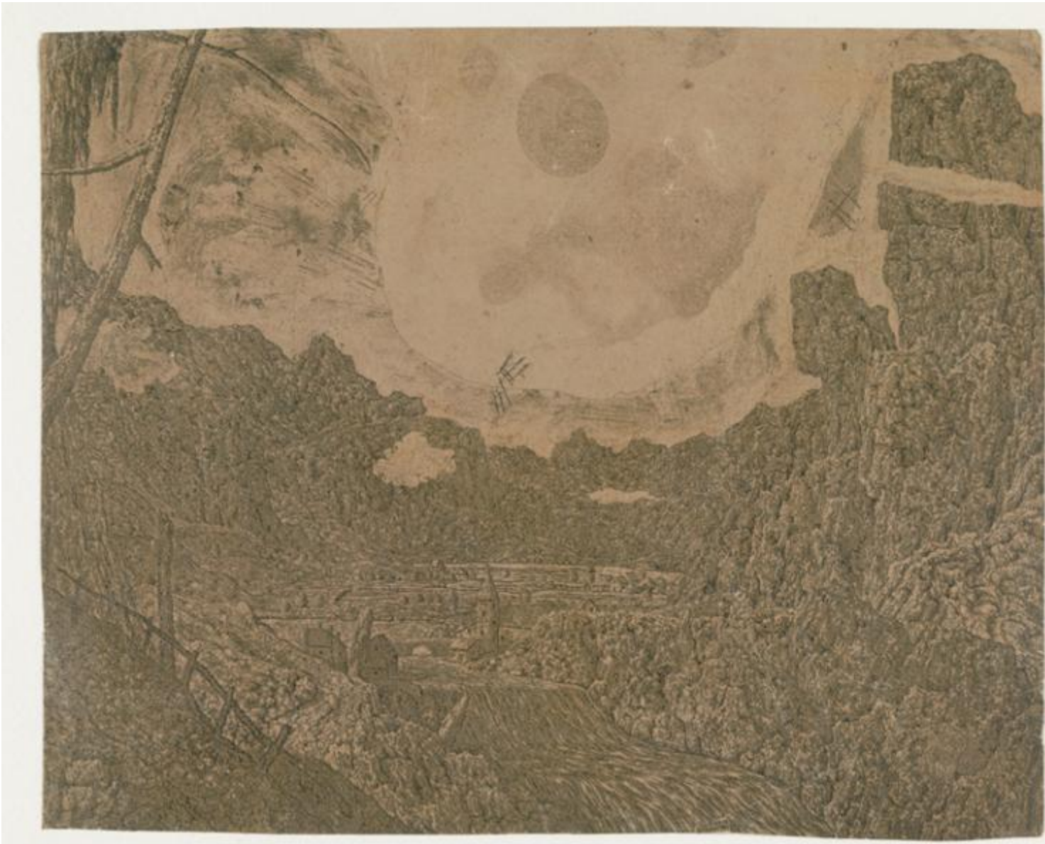
Hercules Segers, Paesaggio con cascata, ca.1615-1630, Amsterdam, Rijksmuseum.

Si è chiusa in gennaio al Rijksmuseum di Amsterdam Hercules Segers , la prima grande retrospettiva a lui dedicata, organizzata in collaborazione con il Metropolitan Museum di New York, dove prosegue a partire dal 13 febbraio ( The mysterious landscapes of Hercules Segers , fino al 21 maggio 2017).