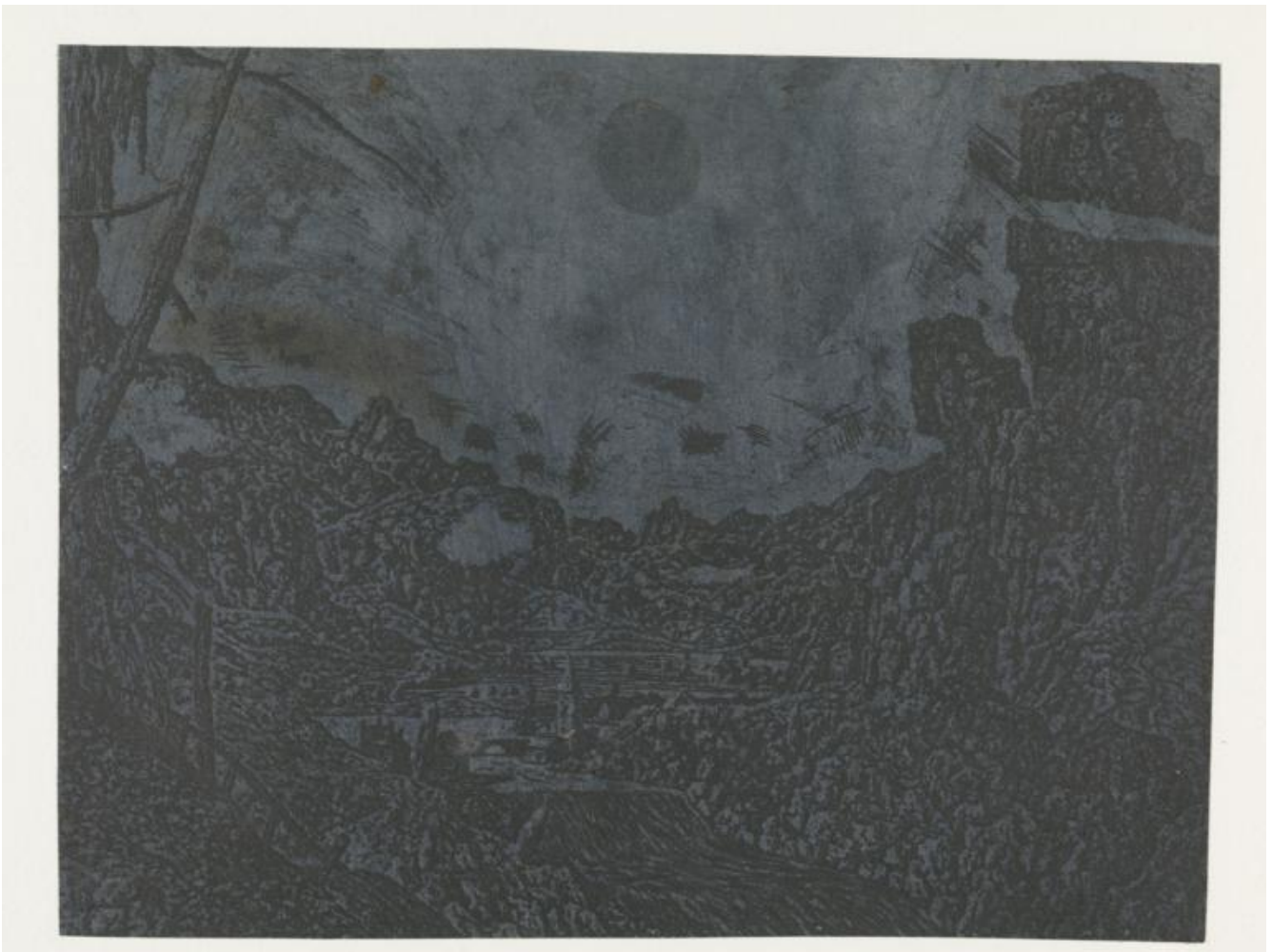
Hercules Segers, Paesaggio con cascata, ca.1615-1630, Amsterdam, Rijksmuseum.

La ricerca di Segers sembra guidata anche da un'indagine percettiva. L'impressione che si ha passando da una carta all'altra è proprio questa, il desiderio continuo e costante di far vivere lo stesso panorama non nelle stagioni della natura, ma nell'atmosfera del tempo che scorre, dall'alba al crepuscolo, al buio profondo. E così, il paesaggio roccioso, ma rosato con fiabesca cascata (fig.1) - e con luna o sole ? A trionfare in cielo - muta aspetto in tante varianti che raccontano il tempo, il giorno, la notte (fig. 8), gli umori, le solitudini. La notte trasforma le cose del mondo, tutto si avvicina, s'appiattisce, diventa astratto.