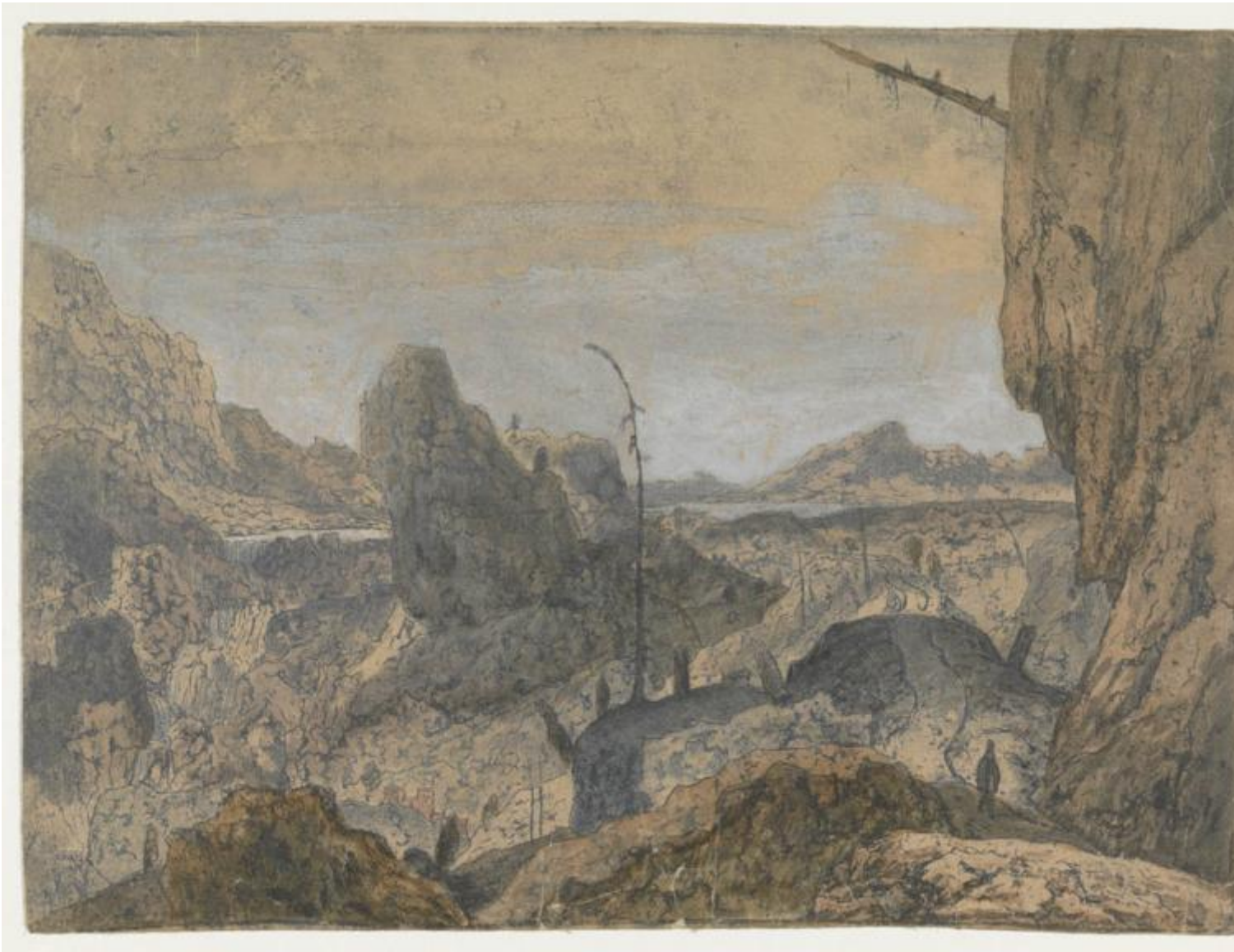
Hercules Segers, Paesaggio roccioso con uomo che cammina, ca. 1615-1630, Amsterdam, Rijksmuseum.

Dell'opera incisa abbiamo oggi catalogate 184 stampe in tutto (due appena ritrovate), e sono le impressioni ottenute dalle 54 matrici perdute. Quasi sempre opere uniche, in totale controtendenza con quello che succedeva nel suo tempo, un tempo in cui quel medium serviva agli incisori e agli editori per produrre multipli, fedeli, anzi fedelissimi. Pensiamo per esempio a Hieronymus Cock che, verso il 1550, iniziò un'attività di editore di stampe e fondò ad Anversa la famosa bottega "Ai quattro venti" contornandosi dei migliori maestri incisori di traduzione. Il suo fiore all'occhiello era Pieter Bruegel il Vecchio che disegnò per lui ben oltre cento soggetti, tradotti su lastra dai più abili incisori di Anversa, a soddisfare il pubblico più esigente.