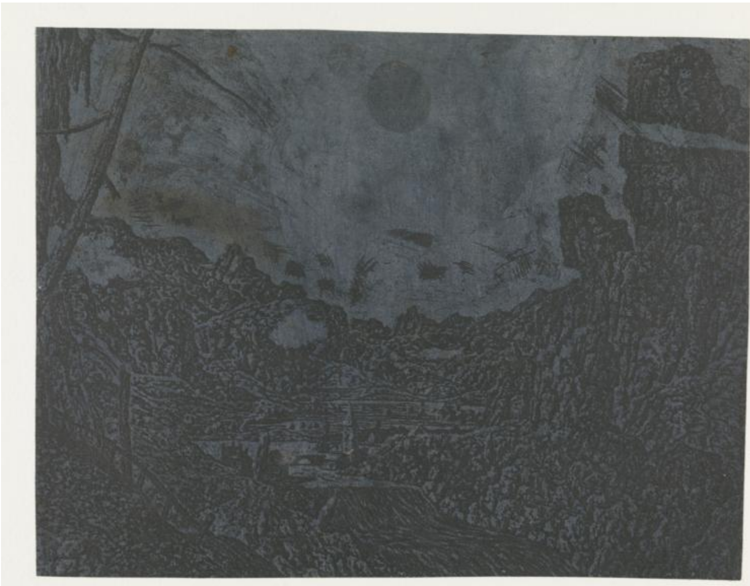
Hercules Segers, Paesaggio con cascata, ca.1615-1630, Amsterdam, Rijksmuseum.

La ricerca di Segers sembra guidata anche da un'indagine percettiva. L'impressione che si ha passando da una carta all'altra è proprio questa, il desiderio continuo e costante di far vivere lo stesso panorama non nelle stagioni della natura, ma nell'atmosfera del tempo che scorre, dall'alba al crepuscolo, al buio profondo. E così, il paesaggio roccioso, ma rosato con fiabesca cascata (fig.1) – e con luna o sole ? A trionfare in cielo – muta aspetto in tante varianti che raccontano il tempo, il giorno, la notte (fig. 8), gli umori, le solitudini. La notte trasforma le cose del mondo, tutto si avvicina, s'appiattisce, diventa astratto.