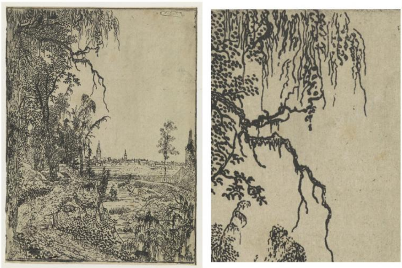
Hercules Segers, Strada con alberi, una città sullo sfondo, e dettaglio, ca. 1622-1625, Amsterdam, Rijksmuseum.

Una strada con alberi a sinistra, una cittadina in lontananza, tutto sembra apparentemente molto normale. Ma il segno è immediato e fluido come un disegno a pennino, non vi sono chiaroscuri, sfumature o toni. Non può essere un segno nato da bulino, puntasecca o acquaforte... siamo di fronte a qualcosa di totalmente nuovo.