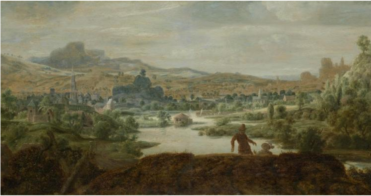
Hercules Segers, Paesaggio sul fiume con figure, olio su tela su tavola, ca. 1625-1630, collezione privata.