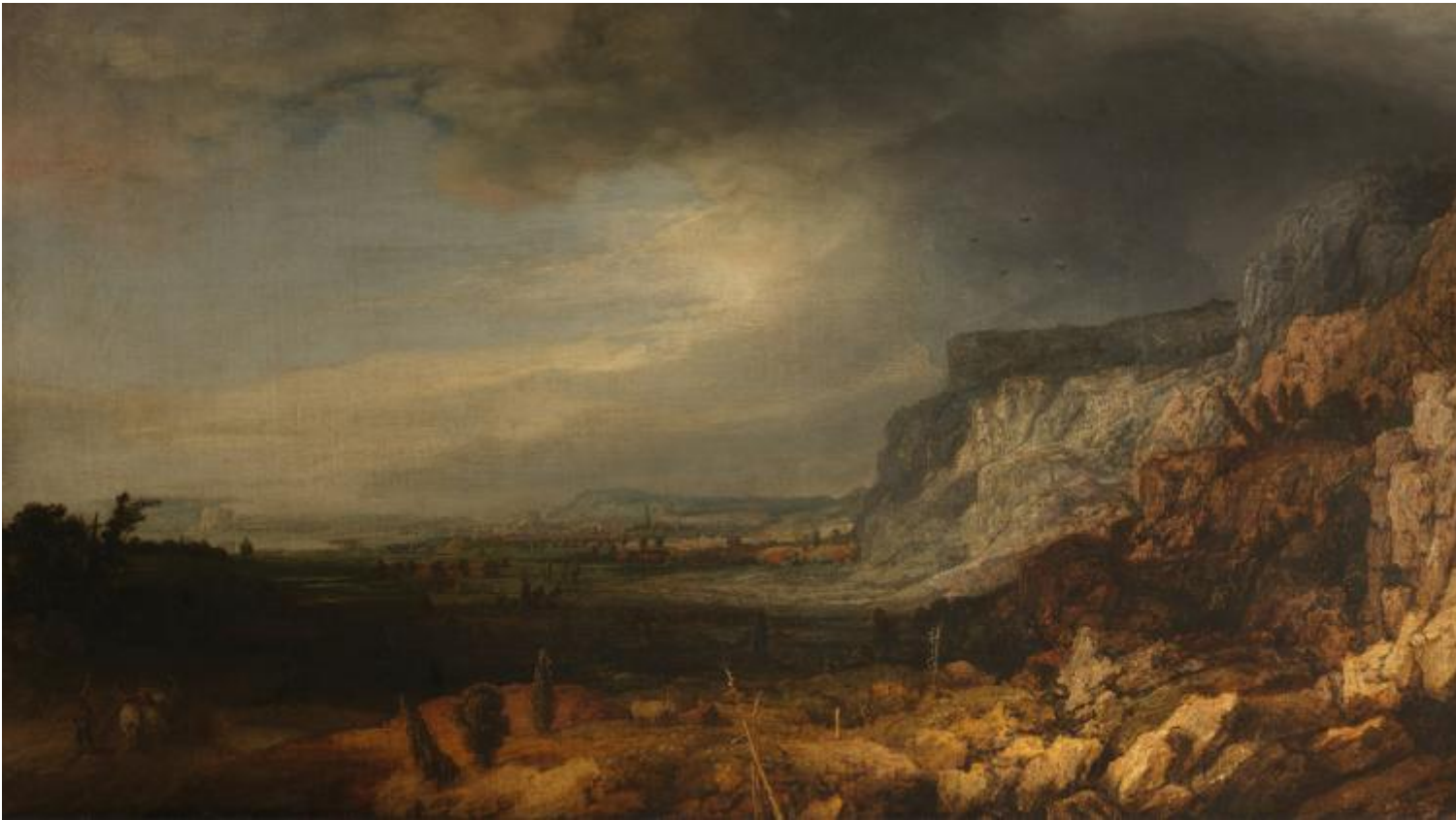
Hercules Segers, Paesaggio di montagna, olio su tela su tavola, ca. 1620-1625, Firenze, Galleria degli Uffizi.

Sembra che sia proprio grazie a questo dipinto “roccioso” che Segers pittore, dopo esser stato dimenticato per più di un secolo, sia tornato ad attirare l’attenzione dei critici, intorno al 1870. Molto mal conservato dopo la sua morte, il quadro presentava un buco al centro e molti ritocchi in un’ampia zona a destra, nel cielo. Si pensava che fossero di mano di Rembrandt, ma oggi sappiamo che non è così.