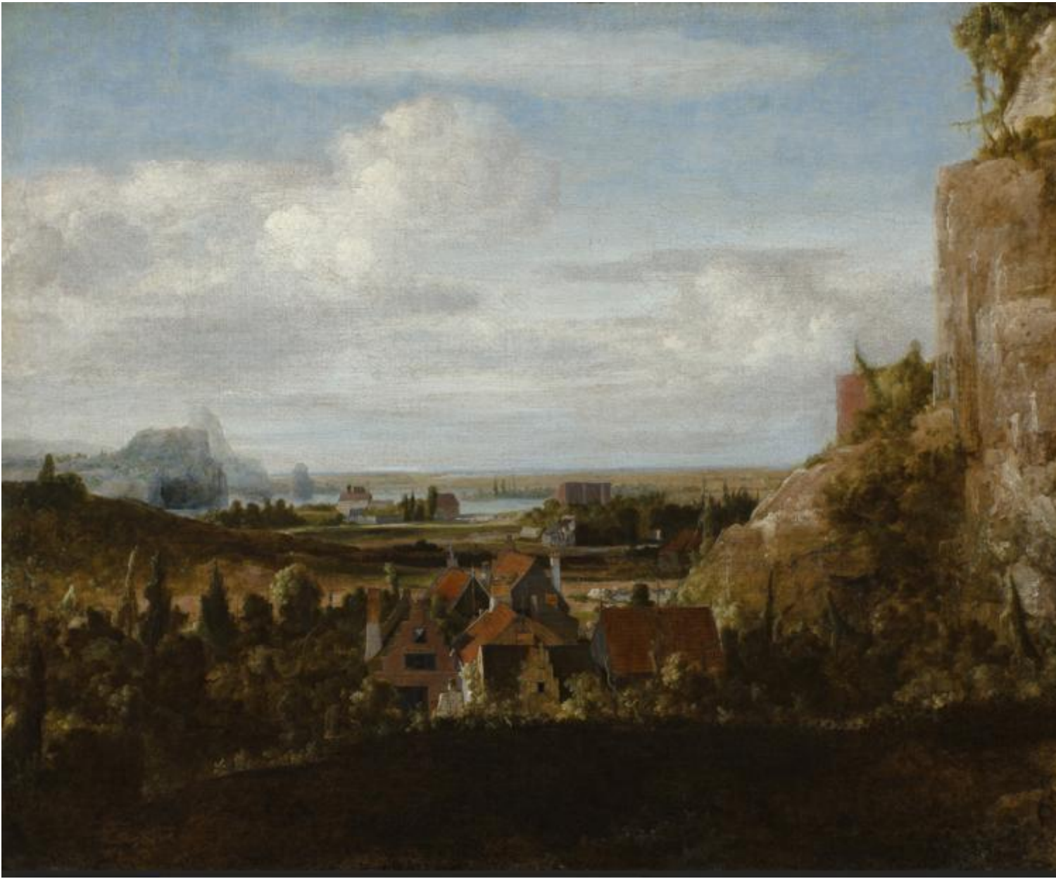
Hercules Segers, Case vicino a dirupo, olio su tela, ca.1619-1623, Rotterdam, Museum Boijmans Van Beuningen.

Ma la tela più suggestiva e più grande ad oggi conosciuta, e conservata a Firenze agli Uffizi, ci mette di fronte a una parete rocciosa di pura invenzione, sassi di varia natura tra terra e cielo, che sovrastano una veduta, una valle, dell'acqua, una cittadina all'orizzonte (fig. 10, cm 55 x 99). È come se stessimo per arrivare da un tortuoso viaggio nella natura selvaggia e ci accogliesse una visione. Anche in pittura, nel descrivere le rocce, egli mantiene un andamento a volte rapido e spezzato, a volte mimetico, quasi ad indagare e mostrare la natura stessa delle cose. Rocce immaginate, ma studiate intimamente e da vicino, forse partendo da comuni sassi, antico trucco già nei consigli di Cennino Cennini che intorno al 1400 suggeriva Il modo del ritrarre una montagna del naturale : “se vuoi pigliare buona maniera di montagne e che paino naturali, togli di pietre grandi che siano scogliose e non pulite, e ritra'ne del naturale, dando i lumi e scuro, secondo che la ragione t'acconsente”.