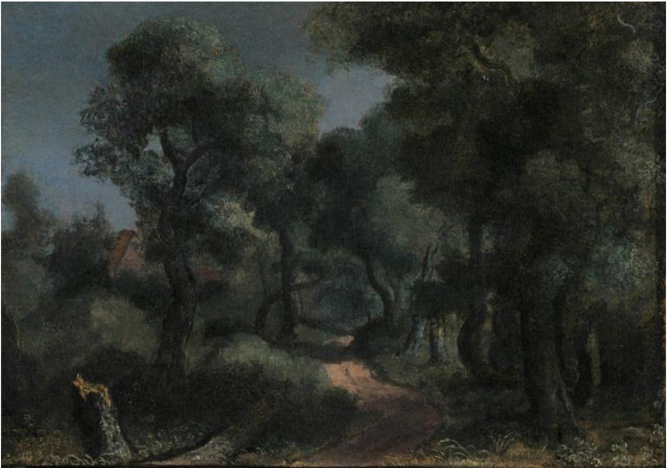
Hercules Segers, Sentiero nel bosco, olio su tela su tavola, ca. 1618-1620, collezione privata.

Per la prima volta l'opera di Segers è esposta quasi al completo, con 110 stampe, ricercatissime varianti ottenute da 54 matrici (tutte perdute), e 18 dipinti a olio (di cui due schizzi): un grande passo avanti nella ricerca se pensiamo che fino alla metà del Novecento gli storici dell'arte concordavano nell'attribuire a Segers (spesso indicato con Seghers) dai dieci ai dodici dipinti. Grazie agli studi sulle tecniche e sui materiali sono qui presentate tre nuove attribuzioni (da collezioni private) mai esposte al pubblico, come Woodland Path , un bosco fiabesco attraversato da un sentiero, un capolavoro in una spanna (16 x 22 cm) di rara intimità, quasi un sogno.