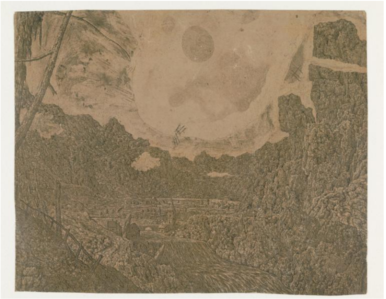
Hercules Segers, Paesaggio con cascata, ca.1615-1630, Amsterdam, Rijksmuseum.

Si è chiusa in gennaio al Rijksmuseum di Amsterdam Hercules Segers , la prima grande retrospettiva a lui dedicata, organizzata in collaborazione con il Metropolitan Museum di New York, dove prosegue a partire dal 13 febbraio ( The mysterious landscapes of Hercules Segers , fino al 21 maggio 2017).