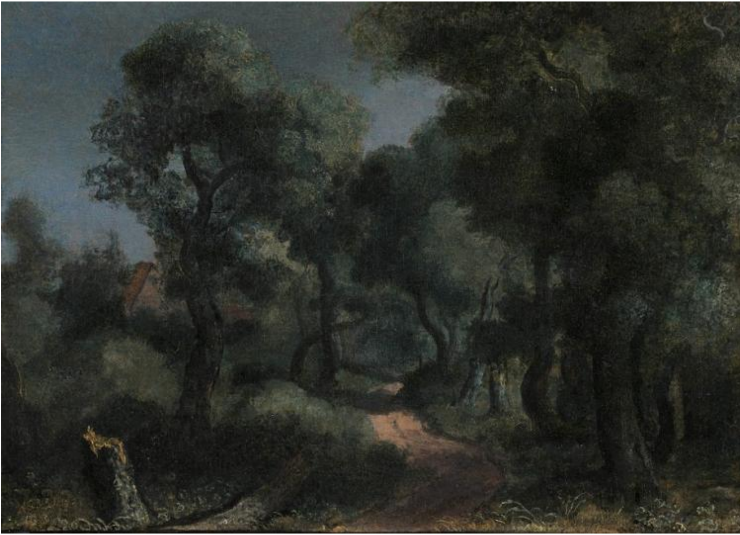
Hercules Segers, Sentiero nel bosco, olio su tela su tavola, ca. 1618-1620, collezione privata.

Per la prima volta l'opera di Segers è esposta quasi al completo, con 110 stampe, ricercatissime varianti ottenute da 54 matrici (tutte perdute), e 18 dipinti a olio (di cui due schizzi): un grande passo avanti nella ricerca se pensiamo che fino alla metà del Novecento gli storici dell'arte concordavano nell'attribuire a Segers (spesso indicato con Seghers) dai dieci ai dodici dipinti. Grazie agli studi sulle tecniche e sui materiali sono qui presentate tre nuove attribuzioni (da collezioni private) mai esposte al pubblico, come Woodland Path , un bosco fiabesco attraversato da un sentiero, un capolavoro in una spanna (16 x 22 cm) di rara intimità, quasi un sogno.