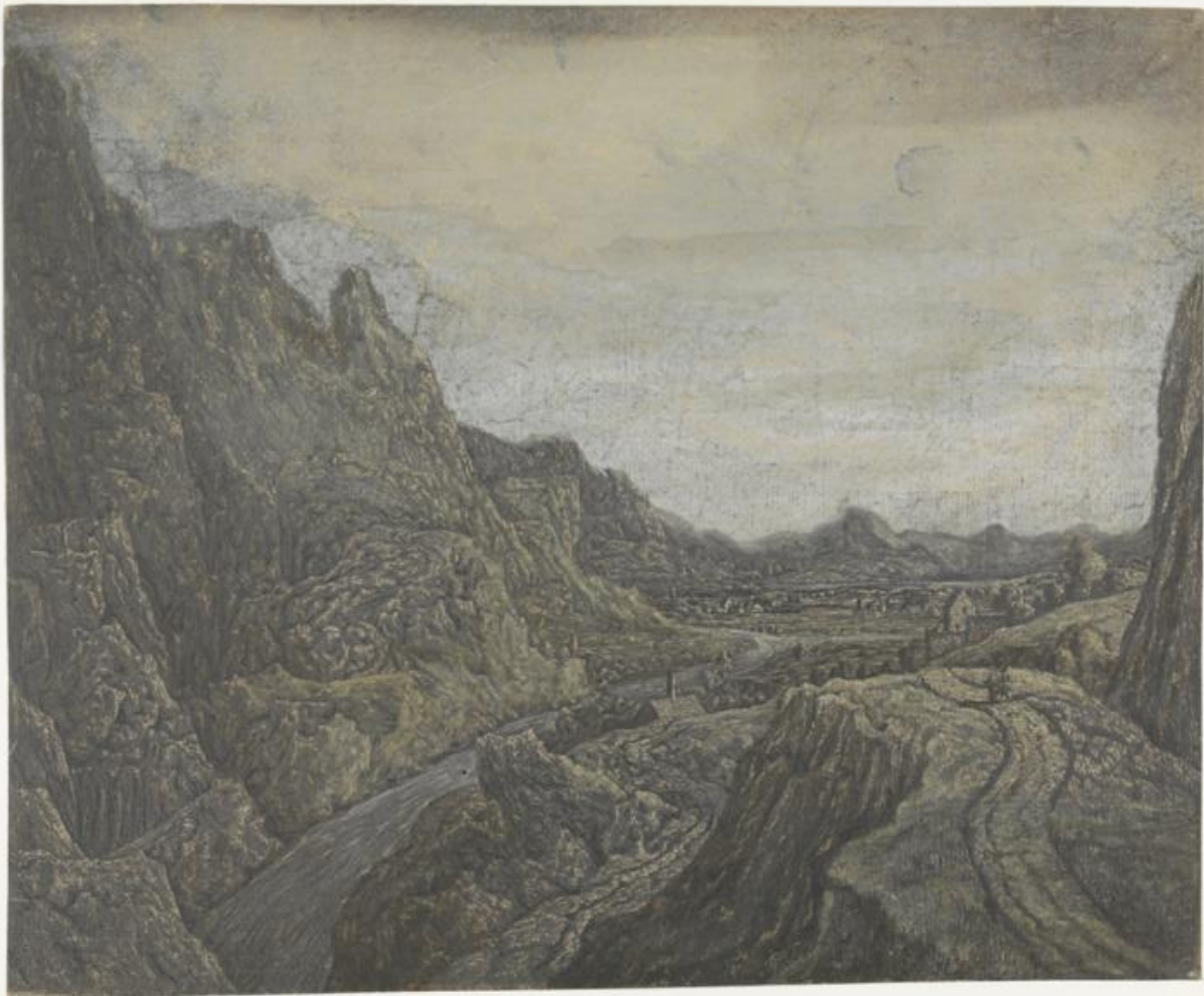
Hercules Segers, Paesaggio roccioso con strada e fiume, ca. 1615-1630, Amsterdam, Rijksmuseum.

Vedute alpine e vallate rocciose di desolante bellezza, popolate da ombre. Rare presenze umane, così piccole che amplificano il senso di vuoto della scena. Tronchi stecchiti e nudi sono a volte descritti in primo piano a fissare il luogo dello spettatore. Alpi svizzere, Tirolo, Appennini o Dalmazia? Vari tentativi sono stati fatti per trovare un legame visivo, varie le ipotesi di viaggi, ma senza successo. Non è come per Pieter Bruegel il Vecchio (1525-1569) che aveva stupito Karel van Mander perché, viaggiando in Italia, seppe poi riprodurre con grande maestria i paesaggi visti: “nell’attraversare le Alpi [Bruegel] si era nutrito di montagne e rocce al punto da riversarle più tardi sulla tela con una fedeltà addirittura sorprendente”. No, oggi si ritiene che Hercules Segers non andò mai più in là di Bruxelles.