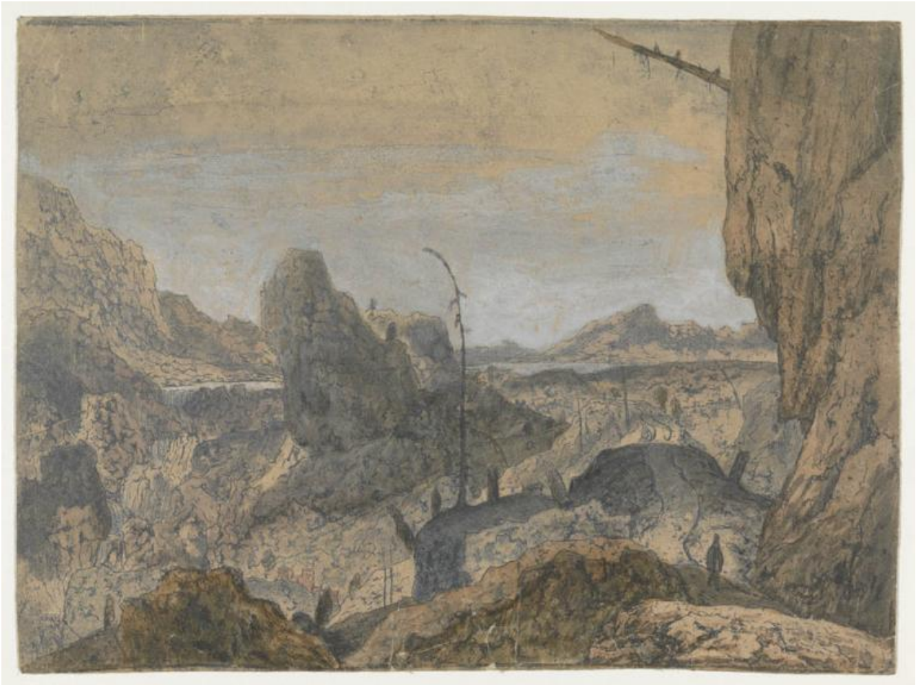
Hercules Segers, Paesaggio roccioso con uomo che cammina, ca. 1615-1630, Amsterdam, Rijksmuseum.

tradizione dei paesaggi fiamminghi di Pieter Bruegel il Vecchio, Lucas van Valkenborch, Joos de Momper.