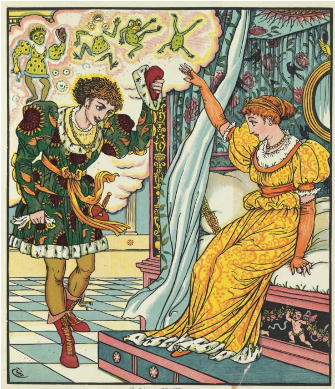
Illustration by G. P. ...