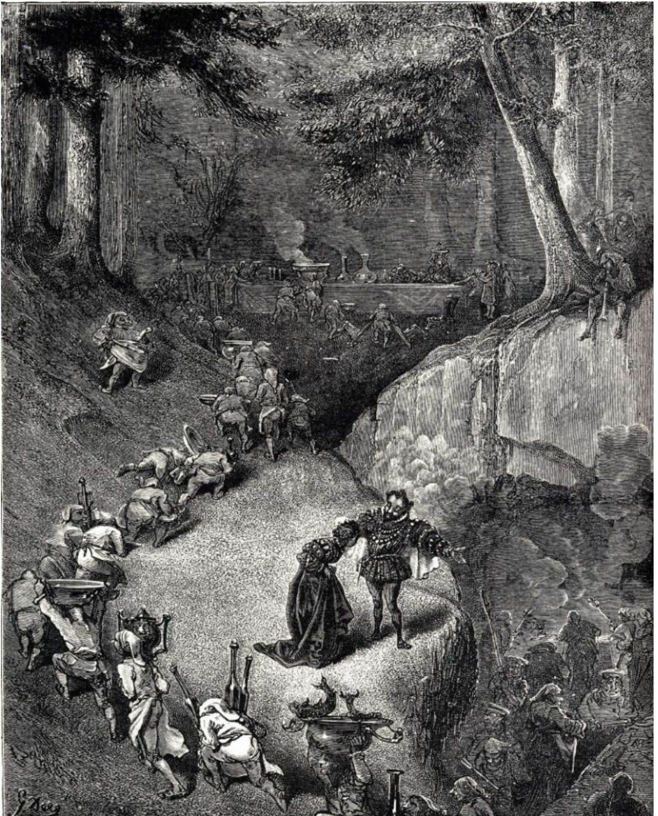
Charles Perrault, Enrichetto dal ciuffo. Illustrazioni di Henry Morin, Gustave Doré.

La compresenza di bellezza e bruttezza nella fiaba, come sistema simmetrico che ordina per opposizione tutto ciò che entra nel racconto, che siano figure di primo