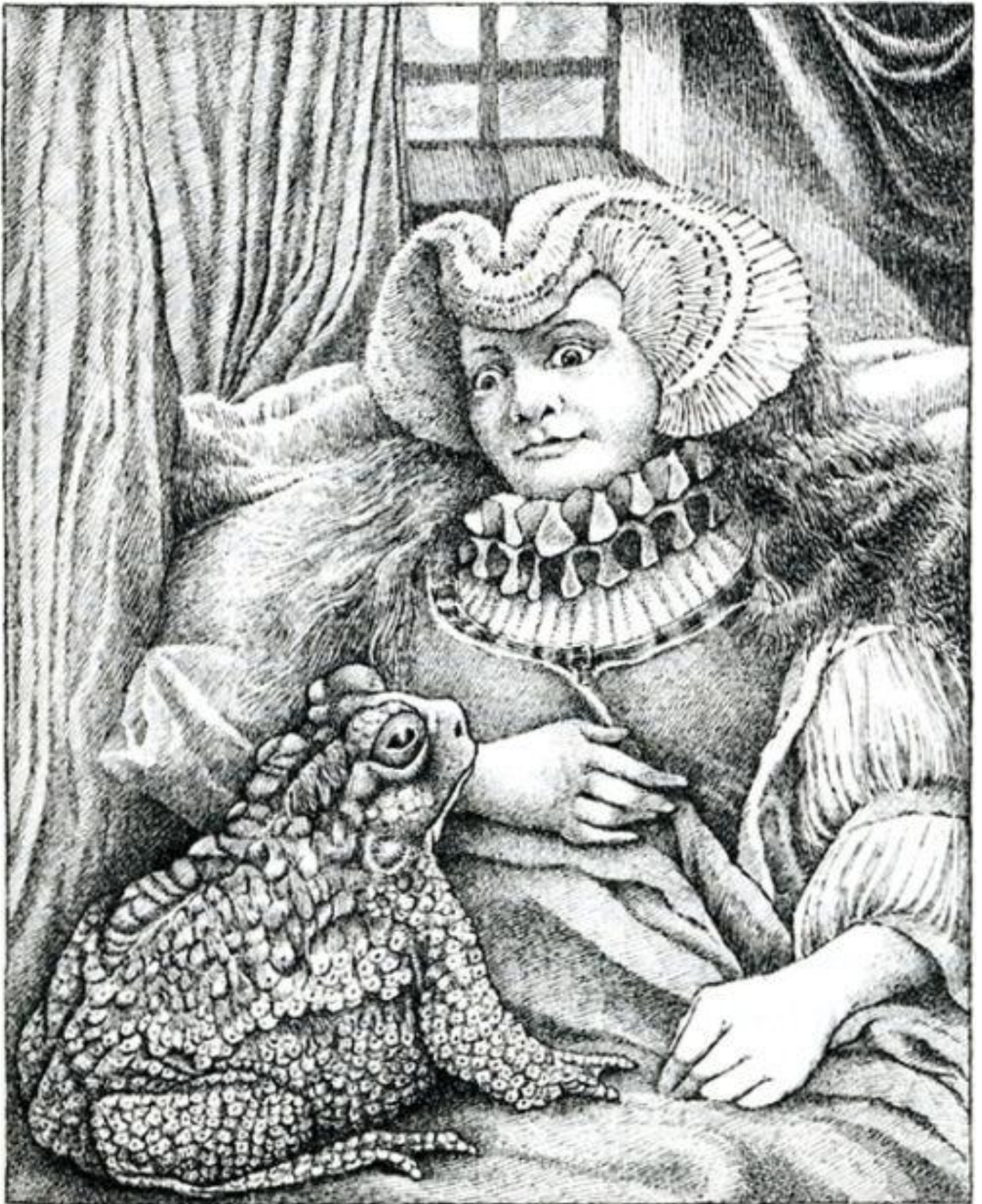
Fratelli Grimm, Il Principe Ranocchio o Enrico di Ferro. Illustrazioni di P.J. Lynch, Walter Crane, Maurice Sendak.