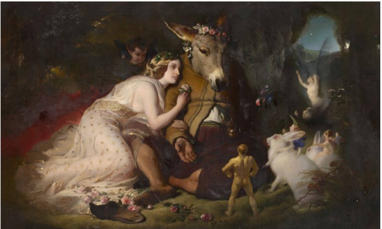
Edwin Landseer, Scene from A Midsummer Night's Dream. Titania and Bottom, 1851.

sono principesse belle e stupide. E allora? Bisogna credere alla bellezza? E alla bruttezza? Biancaneve, si fida della bruttezza della strega, scambiandola per quella, accettabile, di una decrepita vecchina, e non si accorge che quel che vede è il volto vero e turpe della sua malvagia, ma splendida, matrigna. Insomma il gioco è dinamico, la bellezza e la bruttezza nella fiaba non rispondono a una regola unica, ma cambiano continuamente le carte in tavola, così come nell'esistenza umana soggetti a mutamento sono i volti e i corpi, che dalla nascita alla morte cambiano di continuo, e di noi danno agli altri immagini sempre diverse, e ambigue, di quel che siamo.