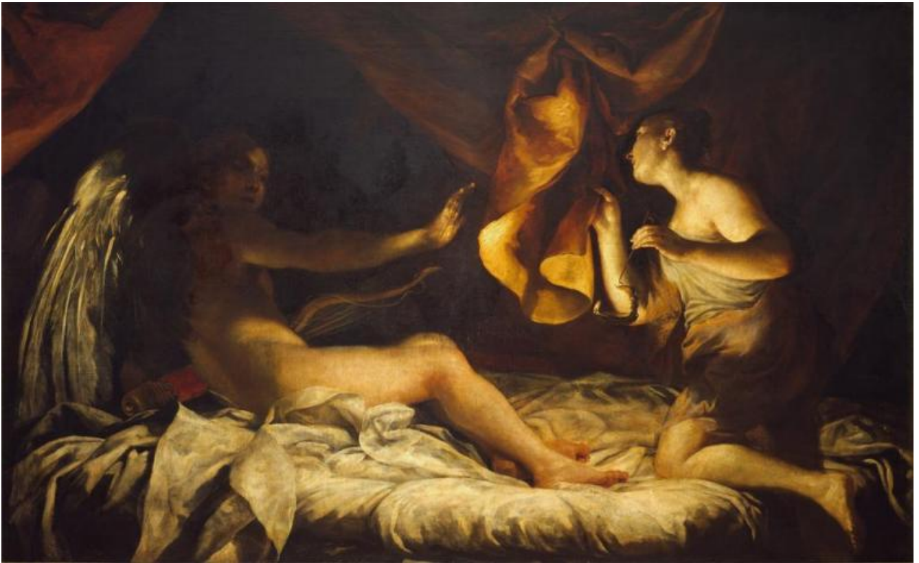
Giuseppe Maria Crespi, Amore e Psiche, 1707.

La contrapposizione fra bellezza e mostruosità, fra le quali si stende una zona di oscurità cieca e gravida di segreti, è un tema cardine in alcune tipologie di fiaba. Nella capostipite delle fiabe letterarie - Amore e Psiche di Apuleio - il sembiante del protagonista maschile tocca tutti e tre i gradi della trasformazione: dapprima annunciato come mostruoso, poi sfuggente e invisibile, quindi divinamente bello. Nelle fiabe sullo sposo misterioso accade spesso che il principe sia un mostro, come per esempio nelle innumerevoli versioni di La Bella e la Bestia. Nelle fiabe sullo sposo animale, invece, il principe, per un maleficio, vive nel corpo di una bestia, secondo le versioni: rana, porcospino, orso, serpente, uccello... In queste fiabe, la protagonista, spesso presentata come la minore e più bella di tre principesse sorelle, riscatta la mostruosità o bestialità del futuro sposo sottoponendosi con umiltà e pazienza a diverse prove che supera con successo, la più celebre delle quali consiste nel bacio alla forma orrenda sotto cui si presenta l'identità maschile.