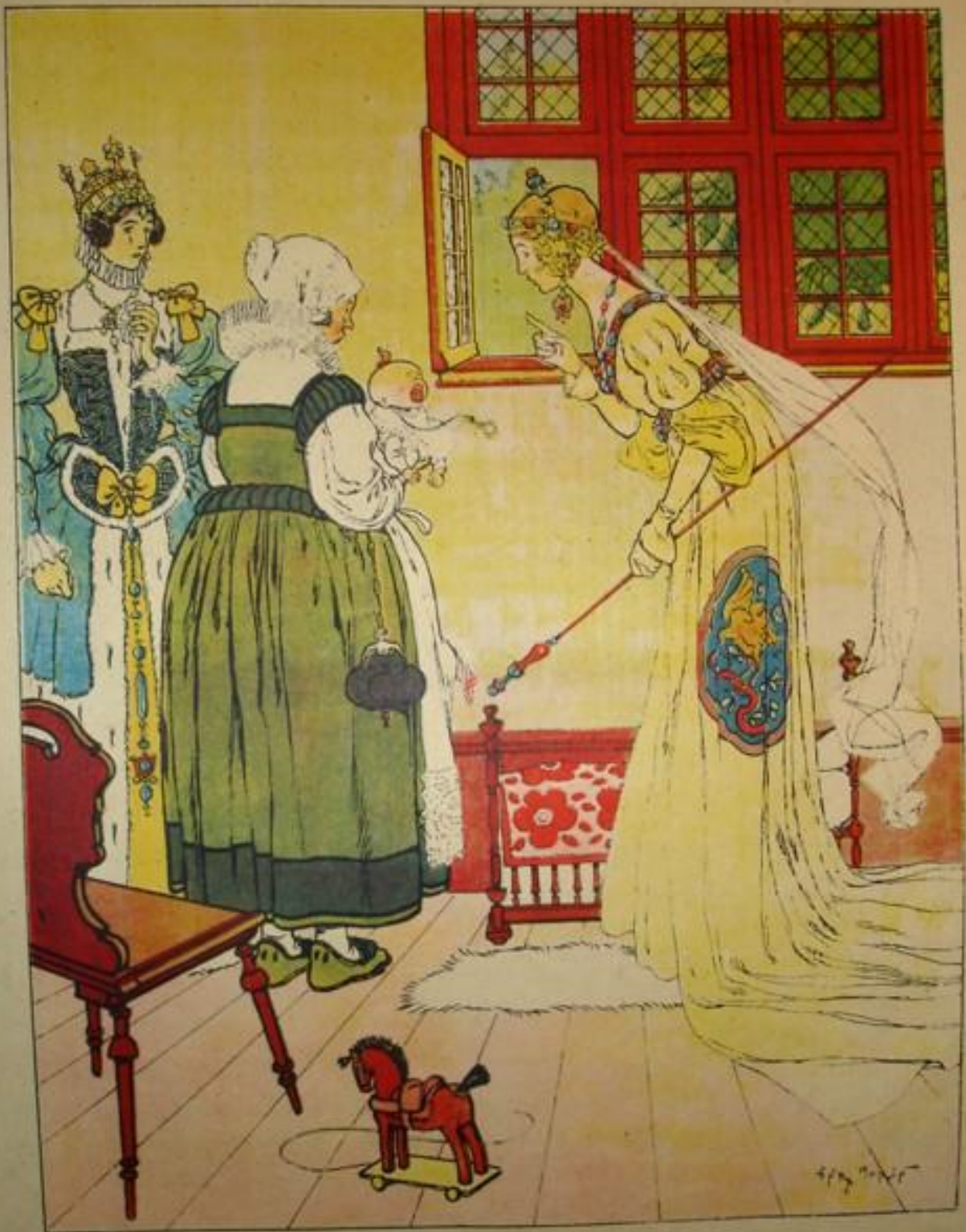
UNE FÉE. PRÉSENTE À SA NAISSANCE. ASSURA QU'IL AURAIT BEAUCOUP D'ESPRIT.