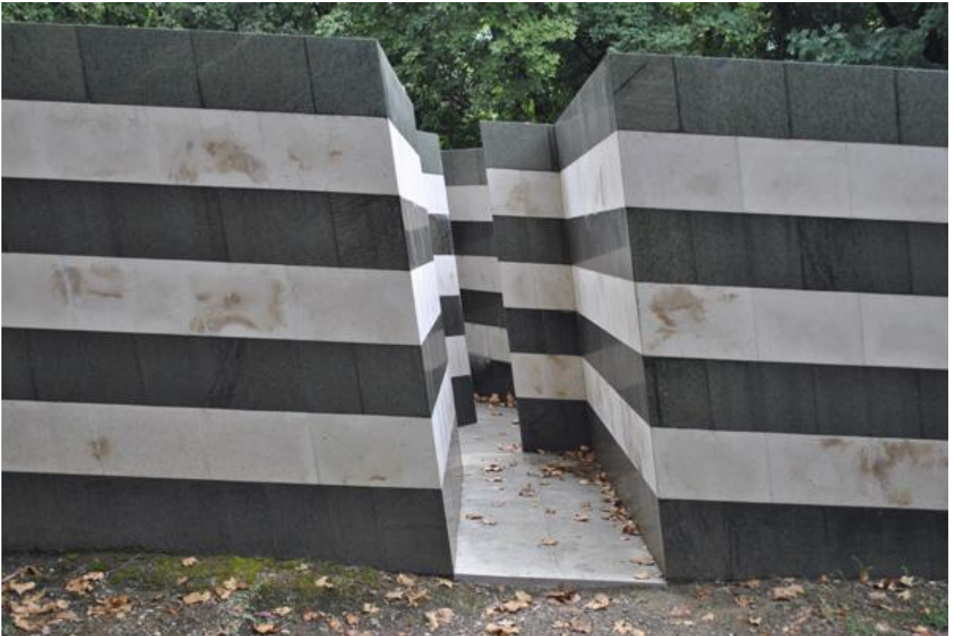
Robert Morris, Labirinto, 1982, serpentino, trani, cemento, h 200 cm.

E invece Lei come definirebbe la sua idea?