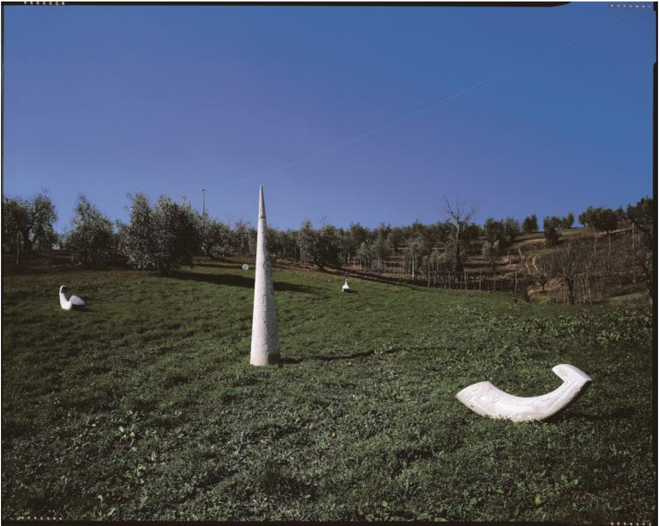
Frank Breidenbruch & A. R. Penck, Centro spirituale, 1995-97, marmo, acciaio inox.

Infine, cosa consiglierebbe a un giovane che volesse diventare collezionista?