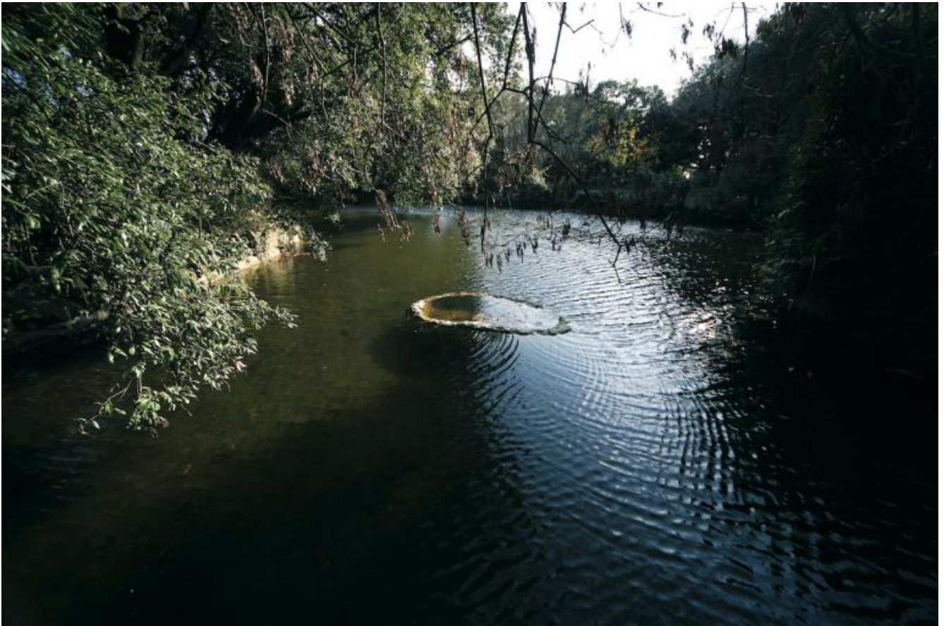
Luciano Massari, Isola di Identità, 2005, marmo.

Quali sono le fasi necessarie per realizzarne una a Villa Celle?