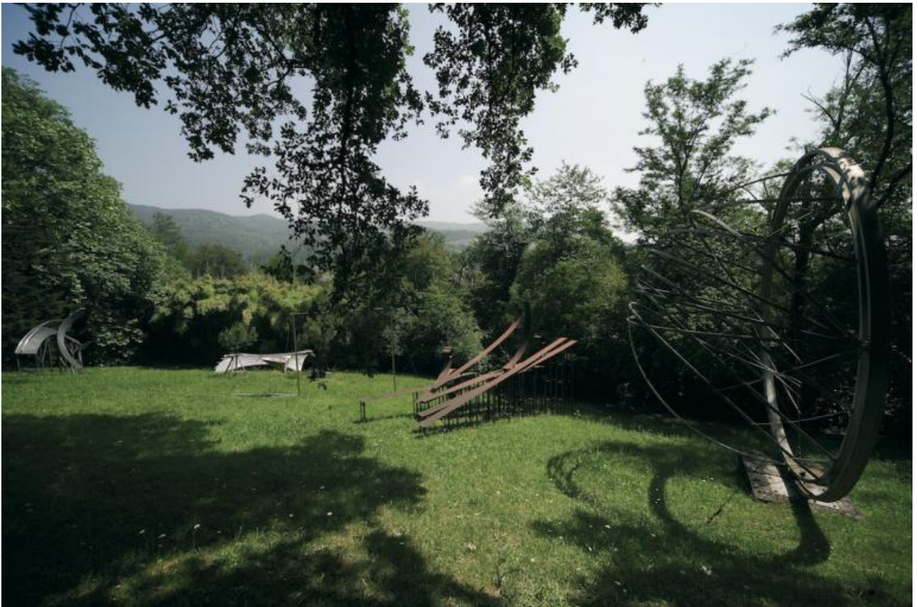
Alice Aycock, Le reti di Solomone, 1982, acciaio, cemento.

Il primo a essere stato terminato, nel 1981, è stato quello di Fausto Melotti, ma in realtà non ricordo se altri siano stati commissionati prima perché parallelamente detti il via a molte opere per la villa e per il parco. Quella è stata l’unica occasione in cui a Celle hanno lavorato contemporaneamente così tanti artisti.