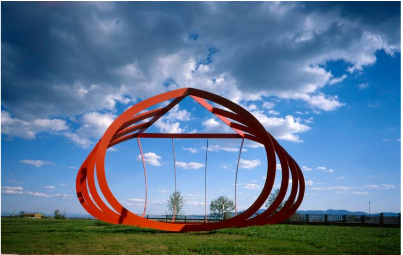
Alberto Burri, Grande ferro Celle, 1986, acciaio verniciato, h 525 x 650 cm.

Esiste quindi un nucleo di opere (quadri e sculture) da Lei acquistate, precedenti alle grandi installazioni di Villa Celle?