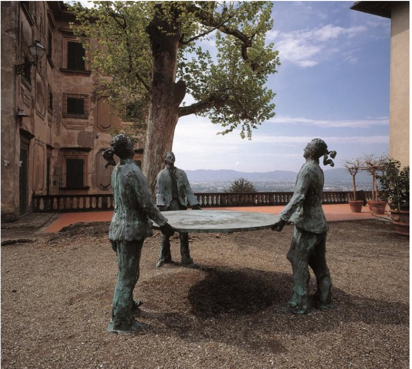
Roberto Barni, Servi muti, 1988, bronzo, h 170 cm.

L'idea di commissionare opere ambientali è quindi nata attorno al 1970?