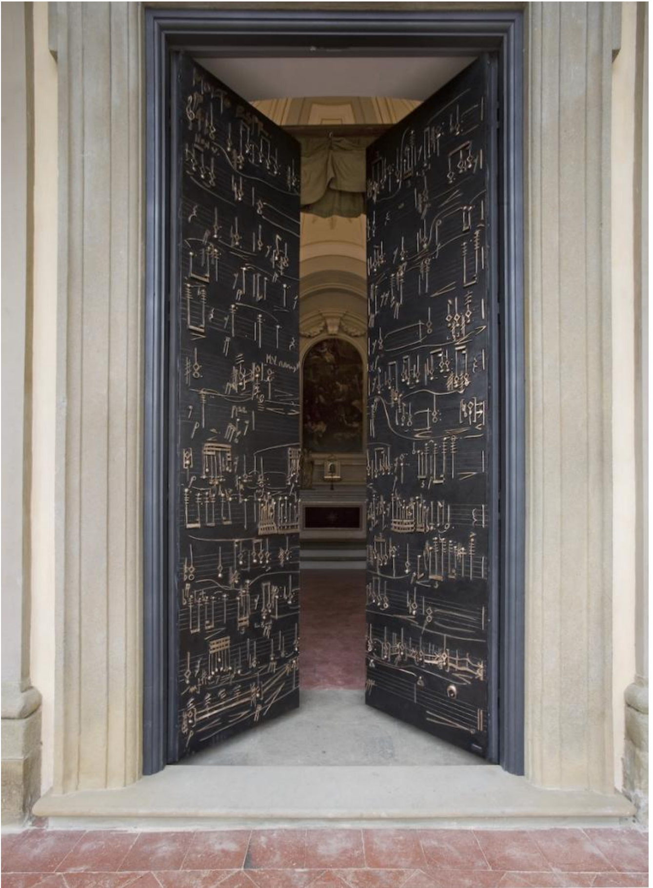
Daniele Lombardi, Porta Sonora, 2016, bronzo.