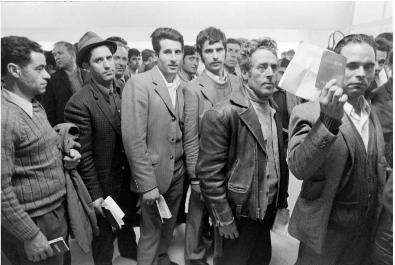
© Jean Mohr, Controllo passaporti, Ginevra.

foto di quarant'anni fa, e tuttavia non sono foto archeologiche, perché le donne e gli uomini che ritraggono hanno una loro durata temporale nel nostro presente. Berger possiede un tocco particolare nel raccontare. Da narratore vero entra nella testa delle persone, senza trasformarle in personaggi, presta loro la propria voce. A tratti sembra persino che le voci lo abitino.