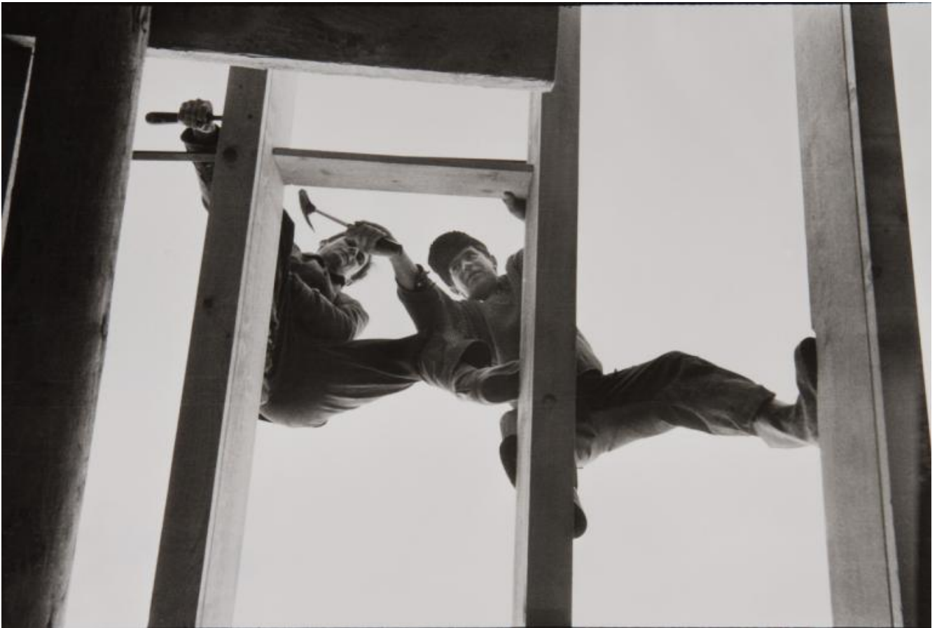
Operai edili migranti che costruiscono una fabbrica in Svizzera.

Vi parla del proprio libro come di “un album di famiglia”. Siamo noi, noi europei, è il nostro recente passato, a figurare in questo volume, che è come uno specchio girato alle nostre spalle, che ci mostra com’eravamo e come saremo. È un libro per l’oggi, come ogni libro di storia che si rispetti. Maria Nadotti parlando del volume ha detto una cosa importante: serve a non far sentire soli i migranti di oggi. Non sembrerebbe molto, e invece è tantissimo. Restituisce una prospettiva temporale al presente, restituisce memoria a chi sembra non averne. Noi compresi.