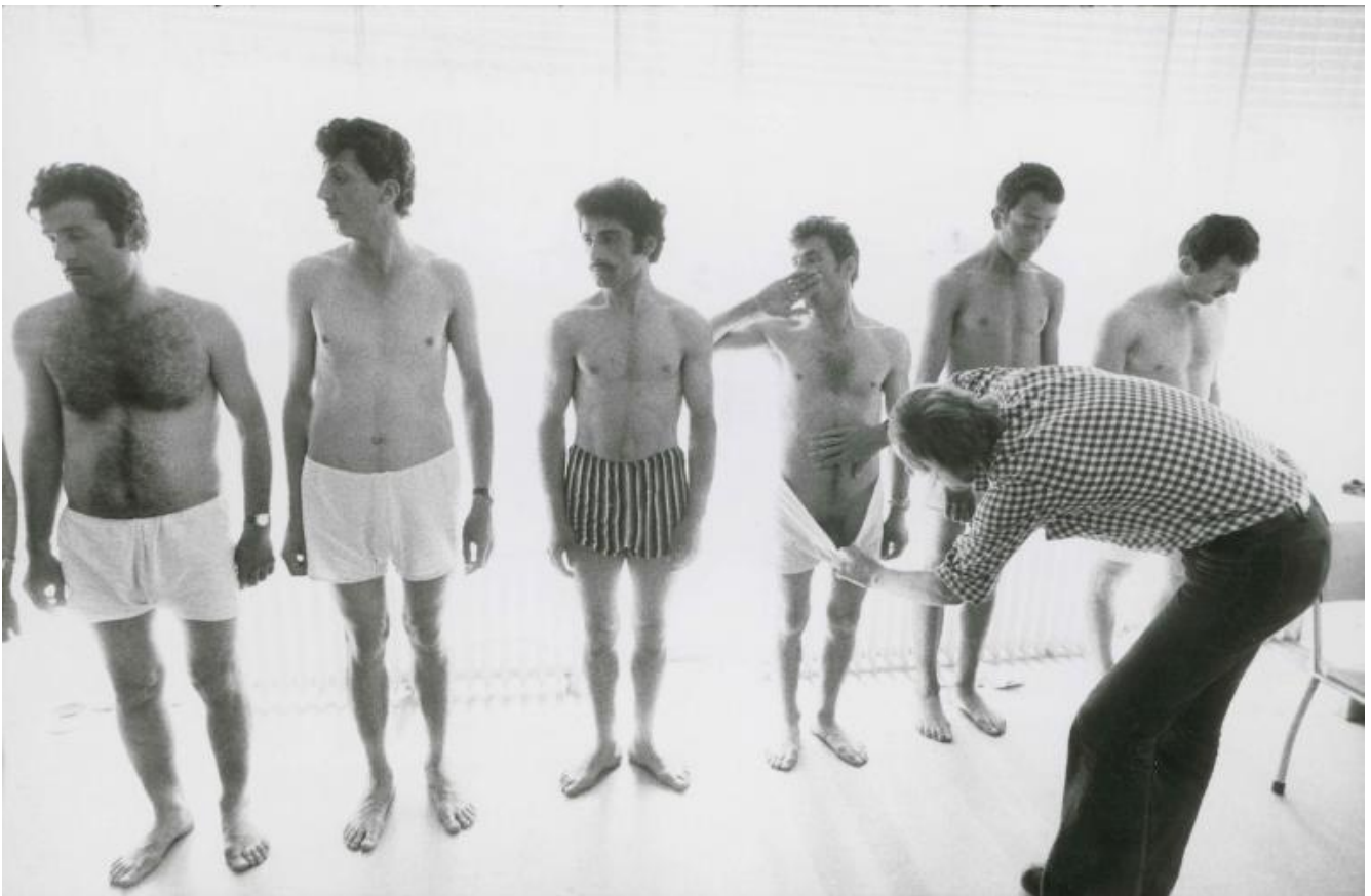
© Jean Mohr, Accertamento sanitario, Istanbul.

umanità, e misura con le parole e le immagini la disumanità, cui la condizione di emigrante espone le singole persone. Rispettoso e attento, è un libro che spiega come funzionava il capitalismo europeo in quegli anni Settanta. Presenta dati, solo quelli necessari. Pagina per pagina ha la forma delle vecchie mappe appese nelle aule, con l'immagine geografica dei paesi e del Continente, e i dati scritti in basso: popolazione, percentuali di migranti, luoghi di origine, destinazione. Per questo è anche un atlante. Le foto in bianco e nero di Jean Mohr possiedono la medesima poesia delle parole di Berger: guardano, osservano, ma sono sempre molto rispettose. Colgono l'umanità di chi è raffigurato, degli individui come dei paesaggi.