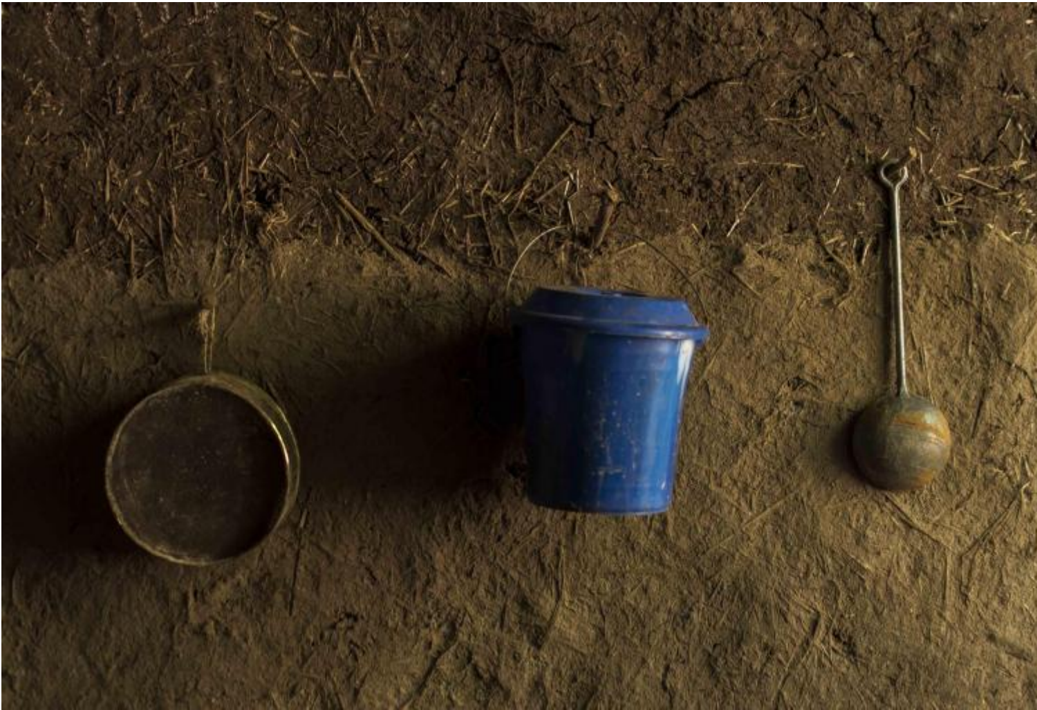
Distanze di Luna Solomon.

Lo scorso luglio anche il quotidiano inglese The Guardian ha dato spazio al suo reportage sulle azioni della charity etiopica Awsad, che si occupa di supportare e assistere donne vittime di violenza.