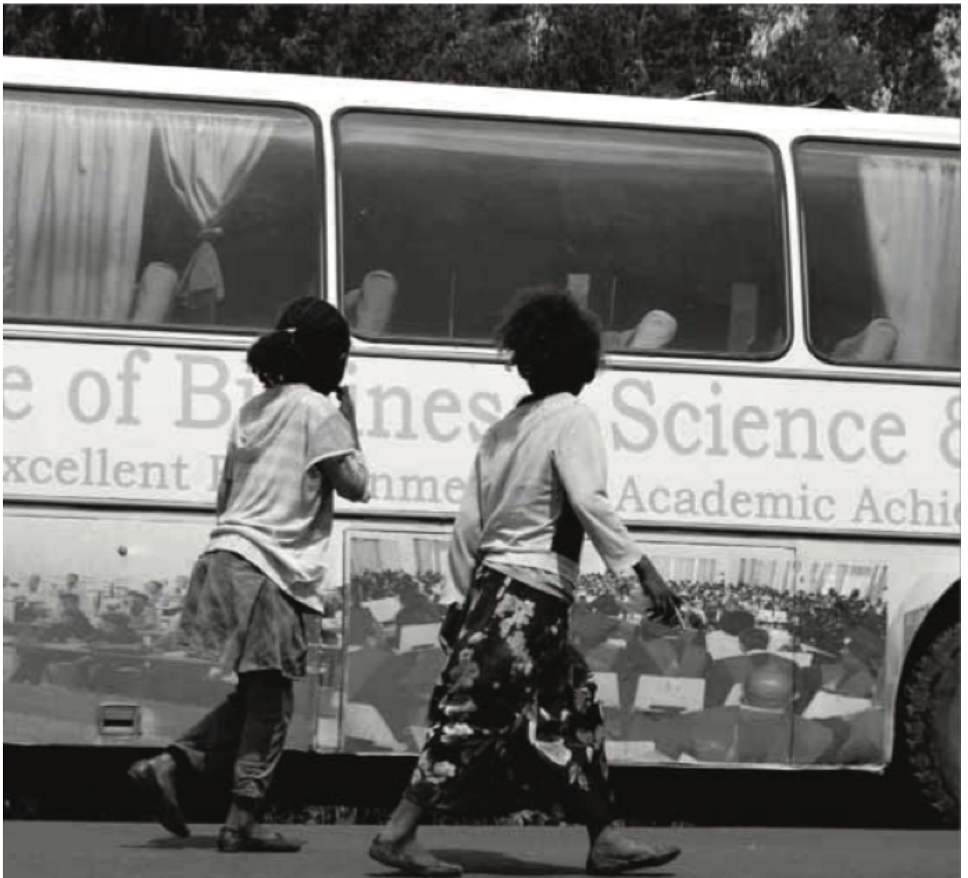
Distances by Hymanot Honelgn.

La distanza, perché? «Da un punto di vista formale la distanza è misura, è il risultato di un processo che per essere determinato necessita di convenzioni, di strumenti e calcoli – spiega Marco Milan, ideatore e curatore di Tales-on . Ma non tutte le distanze sono misurabili o necessariamente quantificabili.