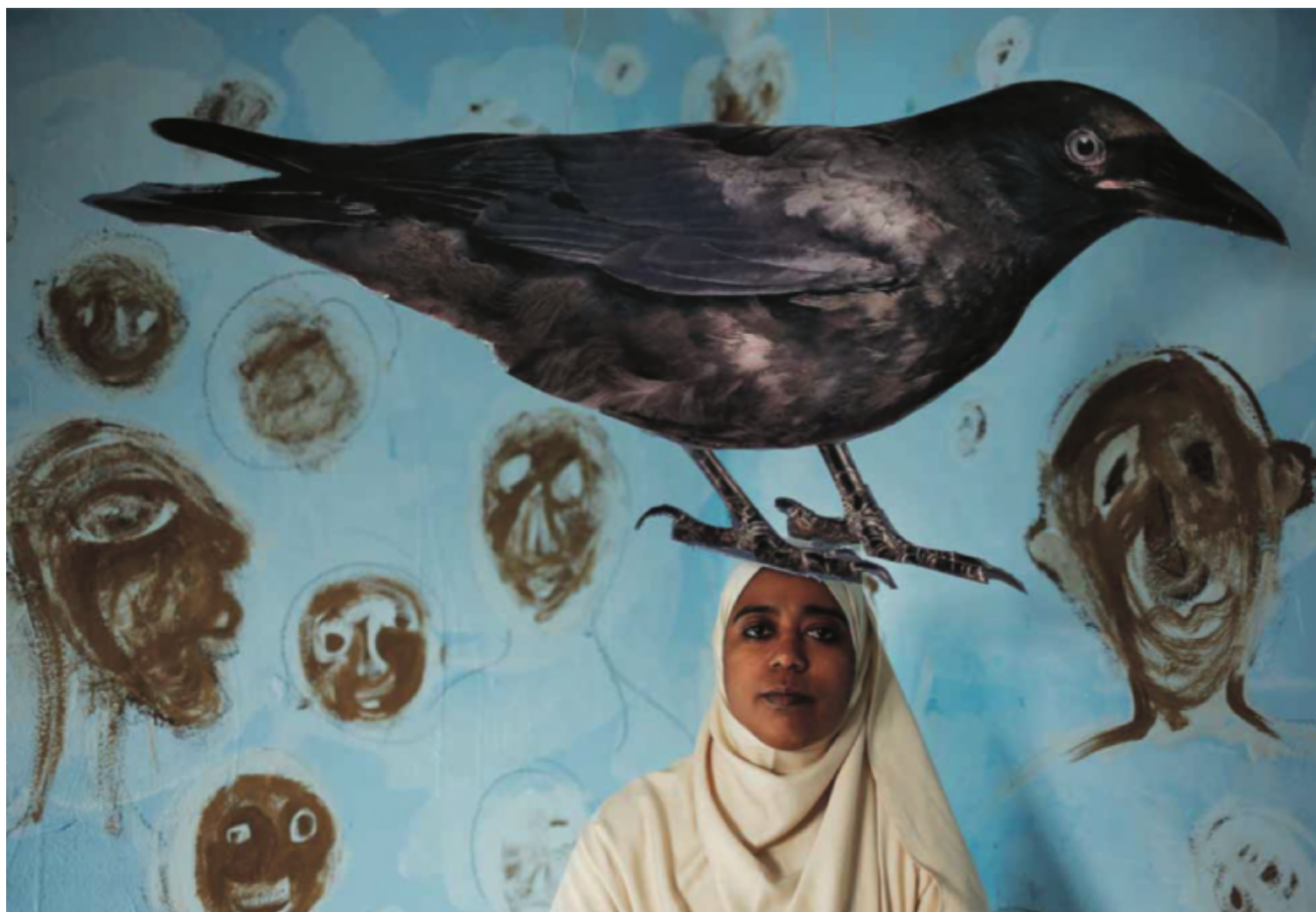
Headache by Heba Khalifa, Egyptian.

È un rischio implicito in ogni narrazione, ma specialmente in quella fotografica: l'appropriazione indebita della vita altrui, del dolore e della sofferenza. L'assunzione del proprio punto di vista e d'interpretazione come diaframma oggettivante: ecco allora la nostra pena attribuita a qualcun altro, la nostra meraviglia cucita addosso a un volto che resta anonimo, ma diventa pubblico e viene messo a servizio di questo o quel messaggio.