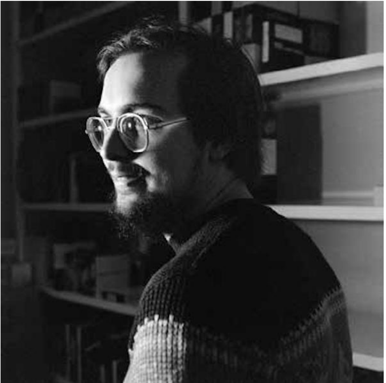
Bill Viola ai tempi di Art Tapes 22, Firenze, 1974.

E in effetti, a considerare con più attenzione le sue pratiche concrete, se ne ricava una lezione di dialettica iconica ben distante dai proclami un po' corrivi, sull'Eternità e l'Intemporalità dell'Arte. In un'intervista rilasciata due anni fa a Bruno Di Marino su Alias , aveva detto Viola che «l'essere umano contempla la dimensione duplice del temporale e dell'eterno»: e non c'è dubbio che la pratica di "mettere in movimento" e narrativizzare le icone della tradizione, in precedenza sacralizzate nella loro fissità, pertenga assai più alla dimensione temporale che a quella dell' eterno . La frase è citata nell'introduzione, appunto di