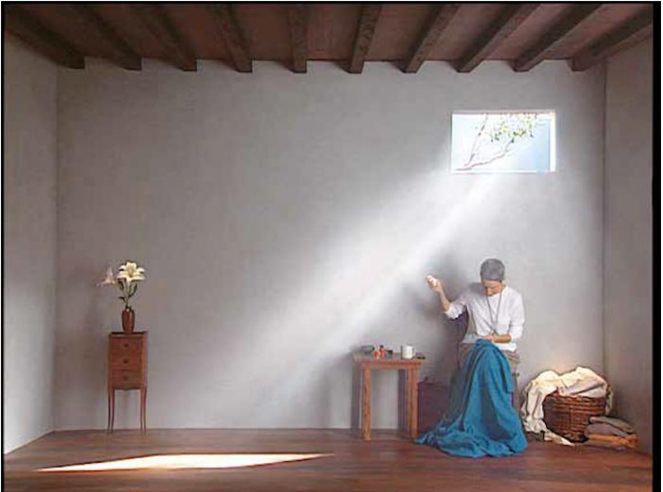
Bill Viola, Catherine's room, 2001, seconda anta.

Una versione più breve di questo testo è uscita su Alias domenica 19 marzo 2017.