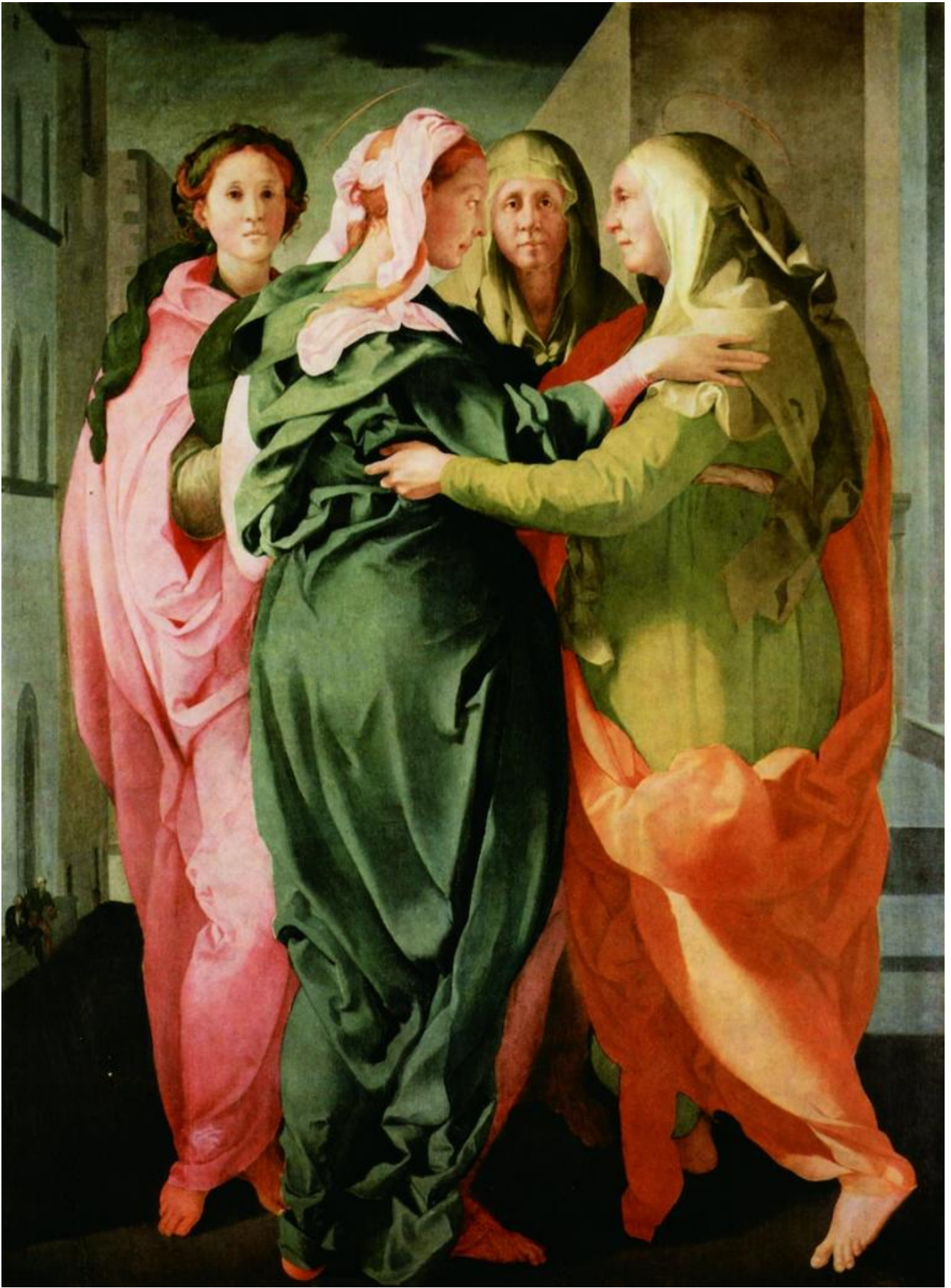
Pontormo, Visitazione, 1528-1529.