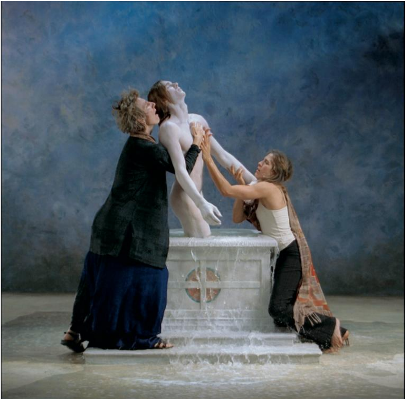
Bill Viola, Emergence, 2002.