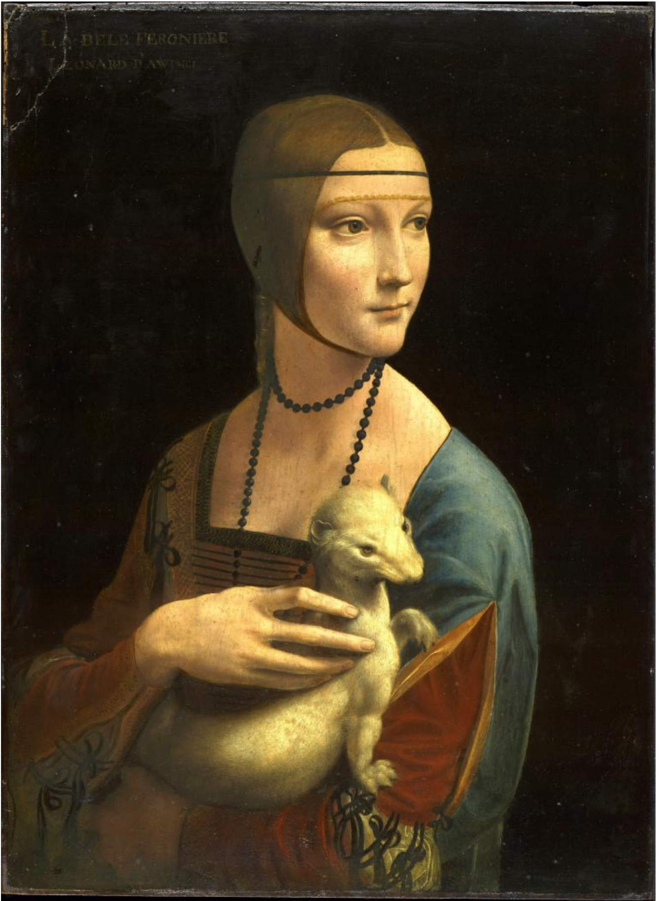
Leonardo Da Vinci, La dama con l'ermellino , 1488-1490, Museo Czartoryski di Cracovia.