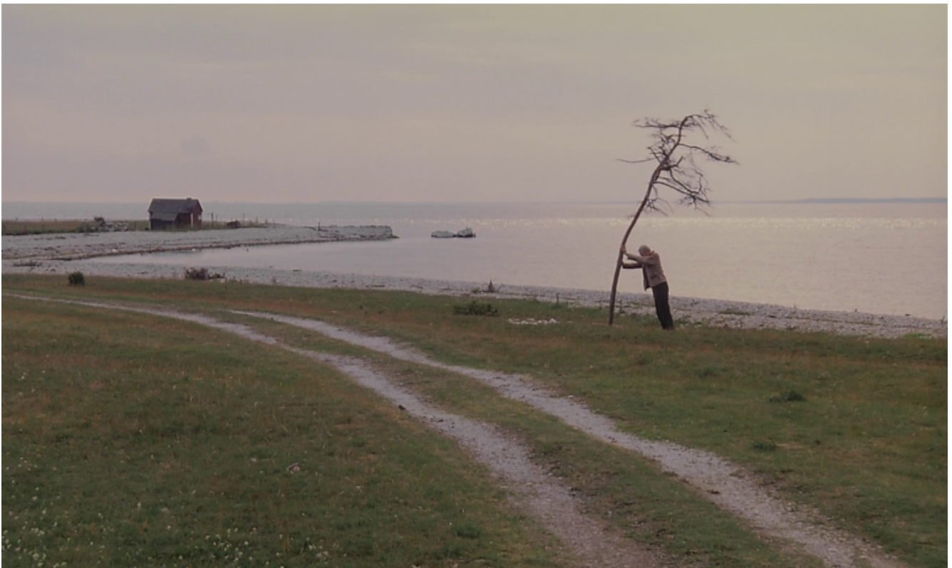
Andrej Tarkovskij, Sacrificio, 1986.

Il regista eredita dall'umanista italiano la consapevolezza che l'anima dell'uomo e quella del mondo sono costituite della stessa sostanza. Il ruolo dell'uomo d'arte è quello di fungere da profeta, da medium, per far sì che l'anima individuale e il mondo diventino una cosa sola, e per fare in modo che la verità attingibile diventi comprensibile e concreta: "[...] l'uomo, in un certo senso, subisce una scissione, si sente responsabile per gli altri, egli è uno strumento, un medium, obbligato a vivere per gli altri e ad influire su di loro. In questo senso aveva ragione Puškin a ritenere che il poeta (e io mi sono sempre ritenuto più un poeta che un cineasta), aldilà della sua stessa volontà, è un profeta.