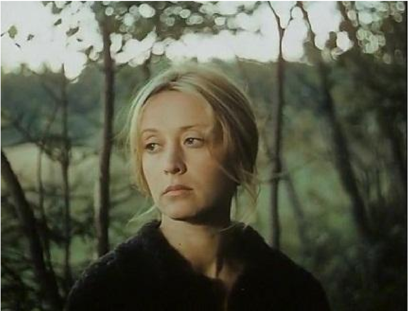
Un'inquadratura di Margarita Terekhova nel film Lo specchio, 1975.

ripugnante” (A. Tarkovskij, Scolpire il tempo , Milano 1995, p 100).