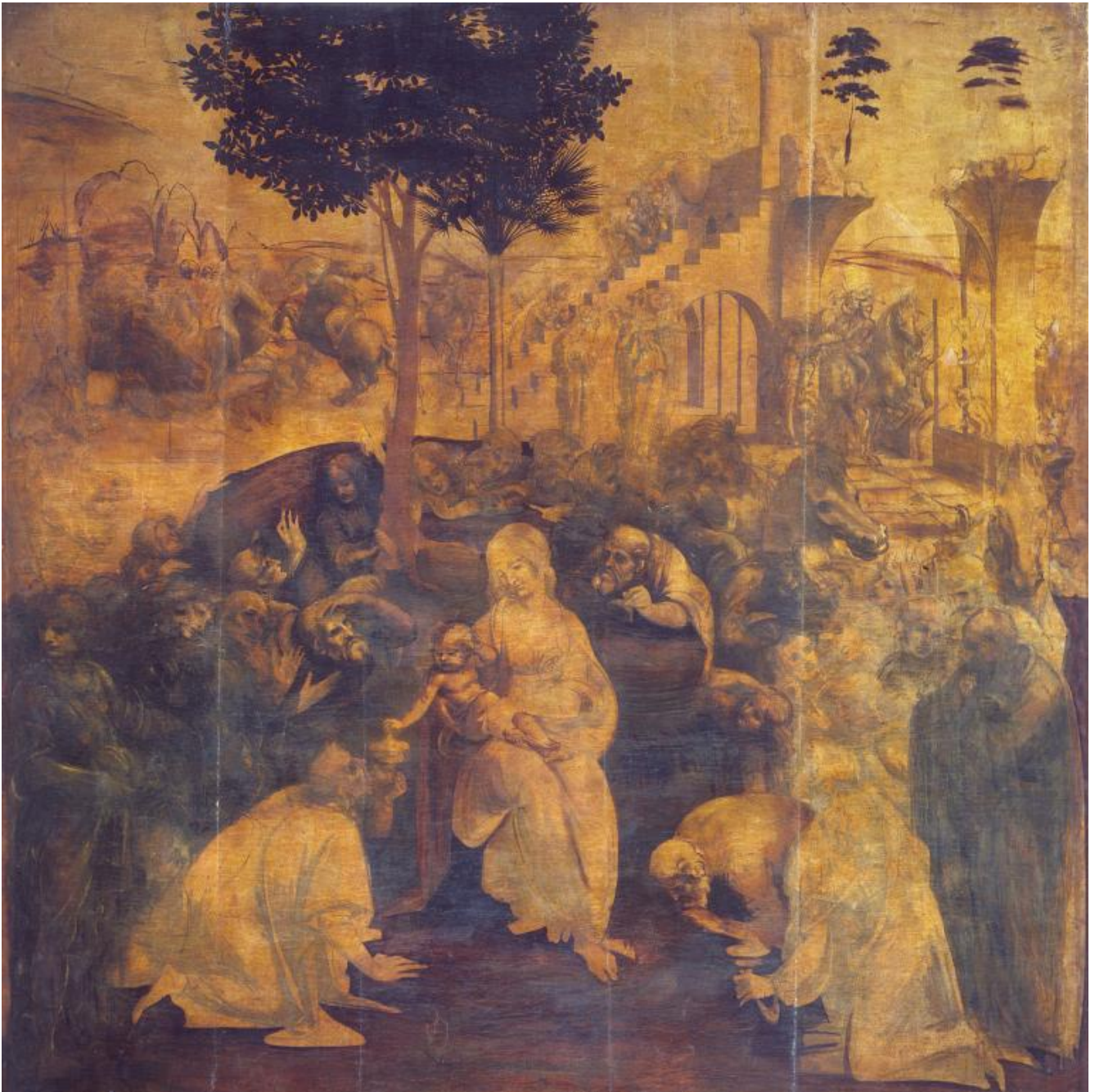
Leonardo Da Vinci, Adorazione dei magi, 1481 - 1482 circa, Galleria degli Uffizi.

Il comune interesse per il contrasto che mette in chiaro i termini opposti ha dato luogo a opere dove il chiaroscuro e lo sfumato evocativo sono un mezzo funzionale per dare rilievo alle forme celate tra la conoscenza scientifica e l'apparenza illusoria. Ne emerge un'armonia in cui il paesaggio colloquia con l'uomo. La natura si esprime per mezzo del linguaggio concreto: il suono dell'acqua, la presenza tangibile della terra, il respiro dell'aria, il movimento flessuoso delle fiamme, il mistero palpabile di uno spirito quintessenziale.