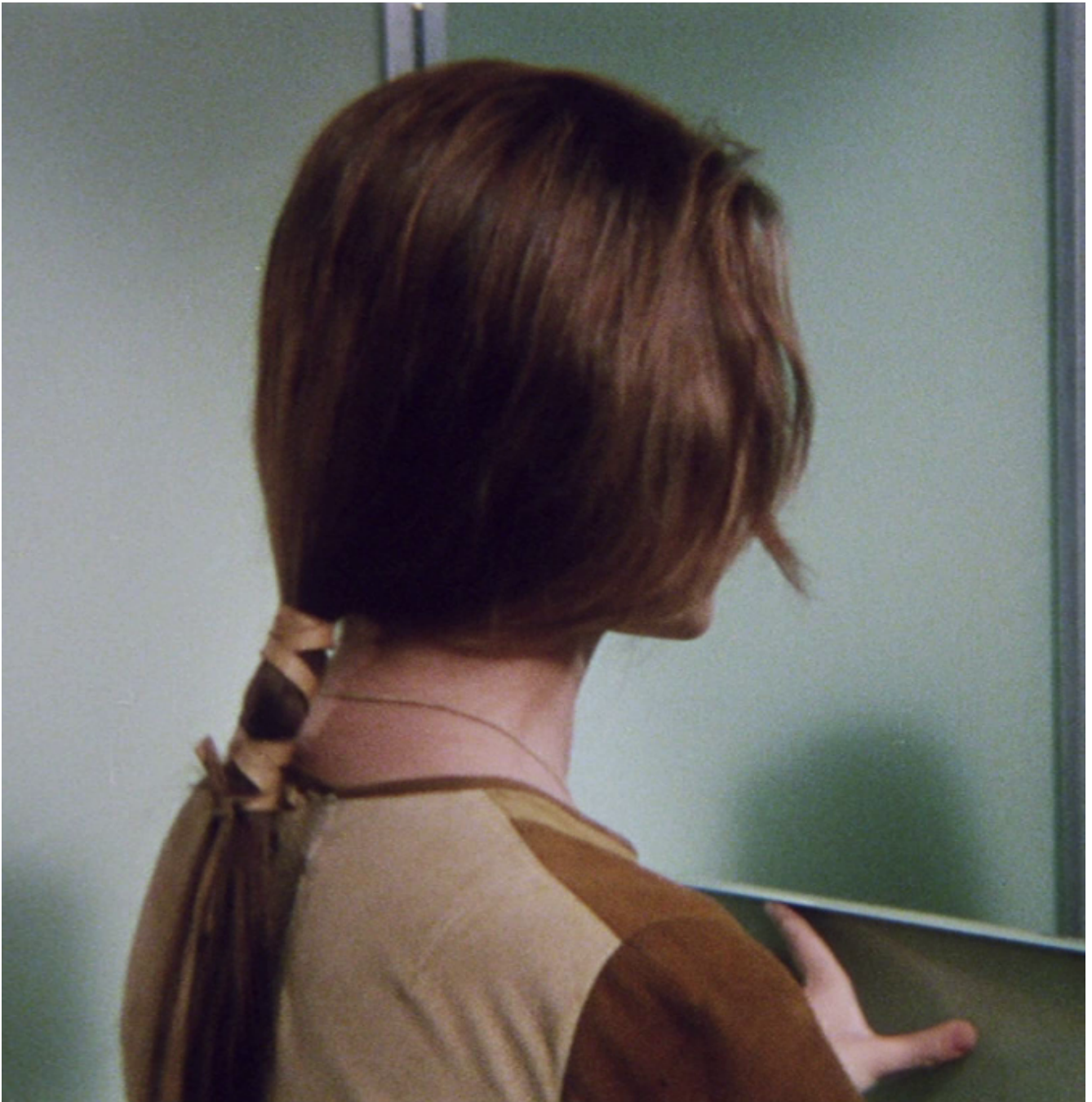
Andrej Tarkovskij, Solaris, 1972, Hari di profilo.

Come Leonardo, Tarkovskij elabora, nella sua ricerca formale, visioni che, contemporaneamente, fermano quel passaggio fra la definizione precisa del dettaglio e la percezione dello sfumato che apre a realtà altre dell'invisibile, a dimensioni evocative e a emersioni dell'occulta trama psicologica delle persone. Le sue immagini incarnano il desiderio di tendere verso l'assoluto, l'ideale e l'infinito, sono impressioni di ciò che esprime la verità: "È difficile pensare che il concetto di immagine artistica possa essere espresso con una formula chiara, precisa e comprensibile. Questo al tempo stesso non è né possibile, né