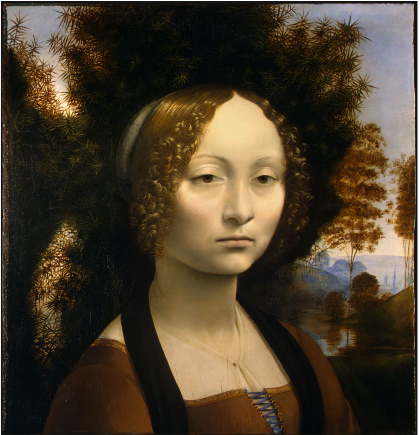
Leonardo Da Vinci, Ritratto di Ginevra De Benci, 1474 circa, Washington national gallery of art.

Semplicemente qualcosa che è aldilà del bene e del male. Si tratta di un fascino col segno negativo: in lei c'è quasi un che di degenerare e... di stupendo. Nello Specchio questo ritratto ci occorreva, da un lato, per trovare la misura dell'eterno negli istanti che scorrevano innanzi a noi, e dall'altro, per mettere a confronto questo ritratto con la protagonista: per sottolineare così in lei, come nell'attrice Terechova, quella stessa capacità di essere al contempo incantevole e