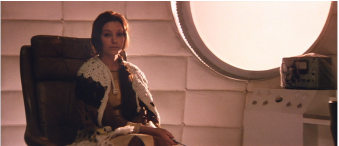
Andrej Tarkovskij, Solaris, 1972, Hari.

E indugiano sulla presenza fisica delle situazioni atmosferiche, sulla capacità meteorologica di influire sulla percezione e sulle emozioni delle persone. Entrano nell'atmosfera, nel tempo, nella penombra, nel turbinio degli agenti atmosferici, nella vibrazione ininterrotta che avvolge i vari campi della realtà. Entrano nell'inconscio, rallentano il corso del tempo, fanno affiorare immagini. Poi tutto ritorna nella trama sequenziale della narrazione, fino alla prossima riflessione, che apre di nuovo a un'altra dimensione della coscienza. Stanze della memoria, dunque, ma anche stato di sospensione nei vari livelli della coscienza. Dialogo tra qualcosa che sta dentro e qualcos'altro che sta fuori. Dialogo spesso silente, quasi un monologo esteriore che si decanta, posando lo sguardo sulle cose o sull'invisibilità di qualcosa che si intuisce, ma che non si coglie completamente. Il soggetto cerca la compenetrazione assoluta con l'oggetto percepito dal pensiero.