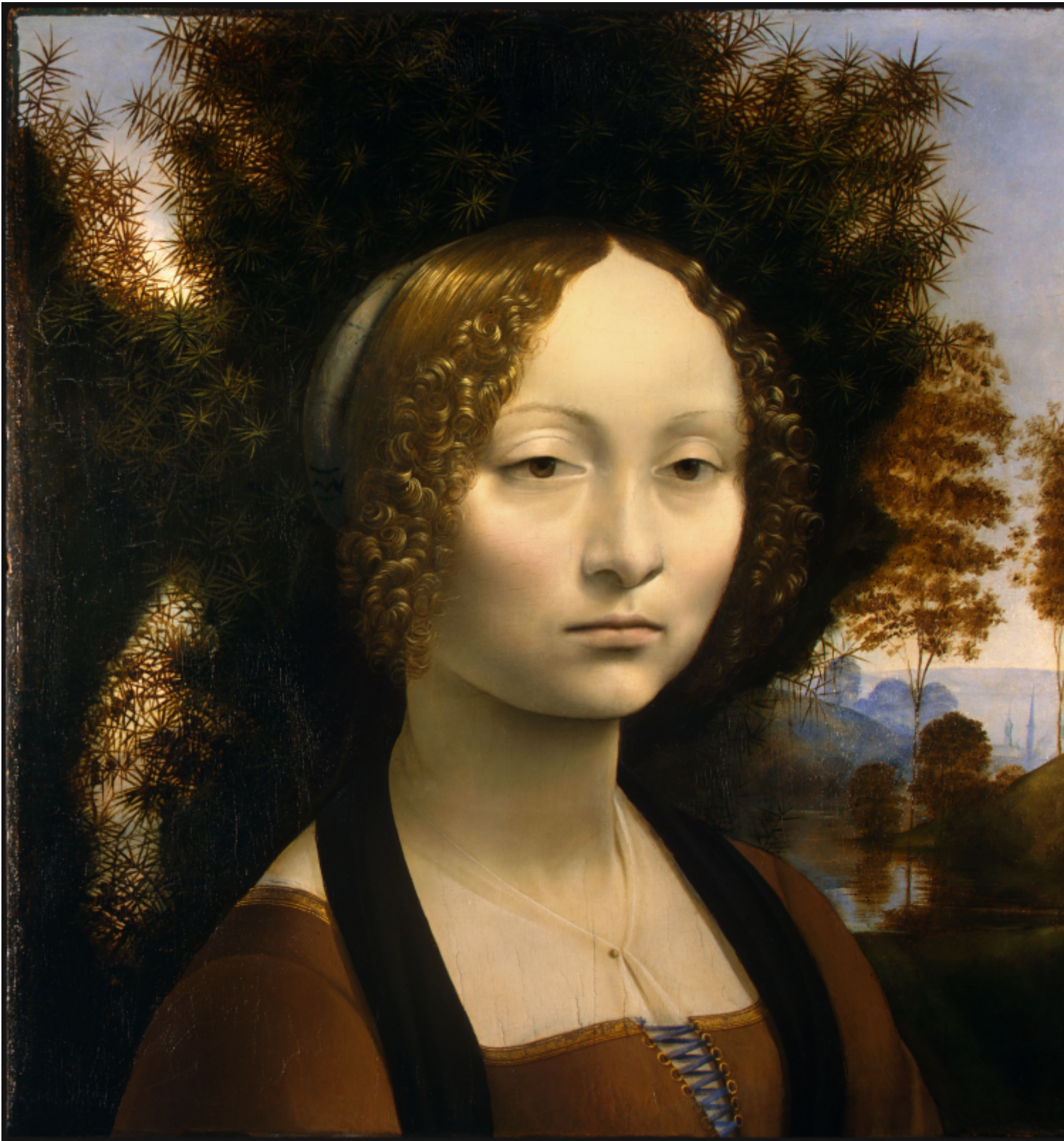
Leonardo Da Vinci, Ritratto di Ginevra De Benci, 1474 circa, Washingtonnational gallery of art.

Semplicemente qualcosa che è aldilà del bene e del male. Si tratta di un fascino col segno negativo: in lei c'è quasi un che di degenerare e... di stupendo. Nello Specchio questo ritratto ci occorreva, da un lato, per trovare la misura dell'eterno negli istanti che scorrevano innanzi a noi, e dall'altro, per mettere a confronto questo ritratto con la protagonista: per sottolineare così in lei, come nell'attrice Terechova, quella stessa capacità di essere al contempo incantevole e ripugnante" (A. Tarkovskij, Scolpire il tempo , Milano 1995, p 100).