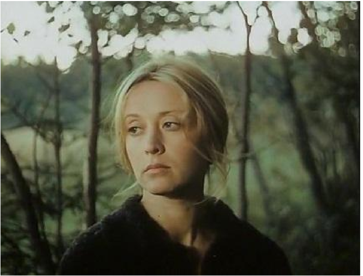
Un'inquadratura di Margarita Terekhova nel film Lo specchio, 1975.

In Solaris , il volto del fantasma di Hari, la tipologia e l'acconciatura della donna richiamano alla memoria i ritratti di Cecilia Gallerani ( La dama con l'ermellino ), della Belle Ferronnière e il ritratto di una Sforza. Mentre il volto della protagonista di Lo specchio ricorda a volte il ritratto di "Ginevra de' Benci" (citato direttamente da Tarkovskij nel film, in un libro dedicato a Leonardo). Quando si sofferma sui volti dei suoi personaggi, Tarkovskij lascia agire la macchina della fisiognomica introspettiva, si addentra alla scoperta di forze che agitano gli individui, vola nella coscienza per piantare un sismografo cinematografico. Entra nel soggetto, facendo parlare le cose su cui posa lo sguardo, va oltre l'apparenza, nei misteri dell'anima, nei suoi abissi, nelle sue sensazioni di solitudine, nel teatro delle passioni implose. Come Leonardo, Tarkovskij non vuol somigliare "ai belli parlatori senza alcuna sententia" e cerca un procedimento stilistico capace di far emergere il valore della vita dei "figli della natura". Questa via percorre i campi dell'ambiguità, entro i quali l'uomo si muove tra la precarietà e la ricerca del sublime e dell'eterno. Tarkovskij è sedotto dalla theorica dell'intelletto, che Leonardo ha reso tangibile con la sua ricerca artistica.