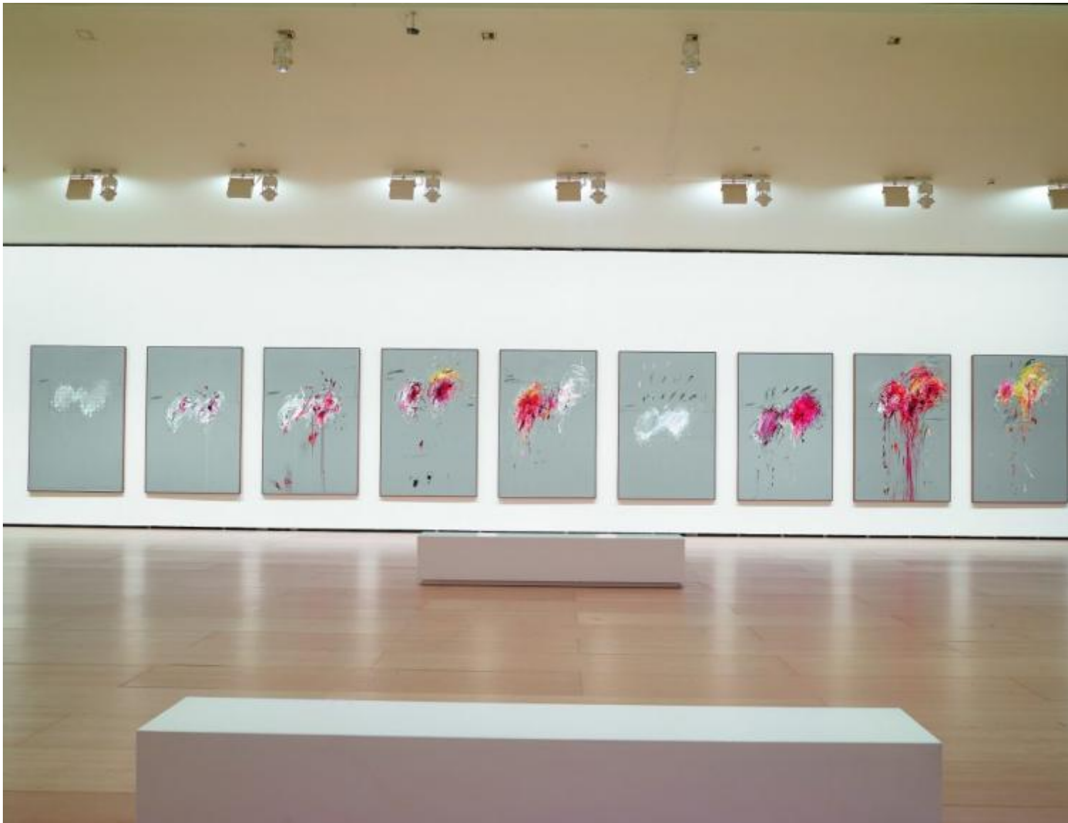
Cy Twombly, Nine discourses on commodus, 1963 insieme.

Dove sugli scudi, a quell'altezza, erano la Pop Art da una parte e il Minimalismo dall'altra: due indirizzi da lui parimenti distanti (al netto della stima reciproca con figure come Andy Warhol e Richard Serra).