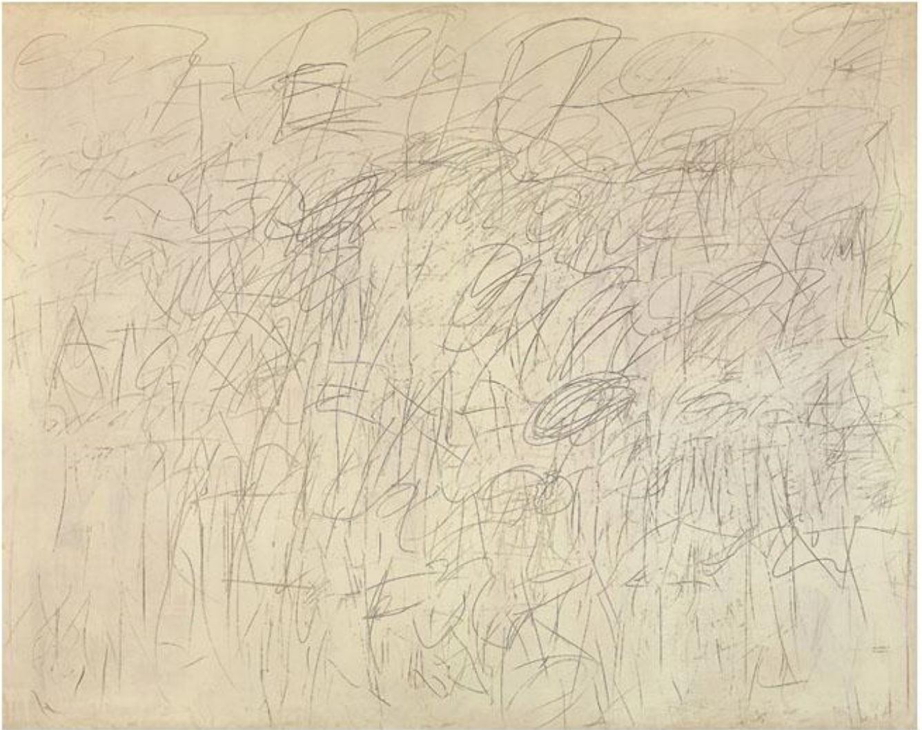
Cy Twombly, Academy , 1955.

È in questo atteggiamento che lo aveva ritratto Rauschenberg, nel '52, in un'altra foto celebre: di profilo – lo stesso sguardo serio e intento, un quaderno di appunti nella mano stesa su un fianco – a contemplare il gigantesco dito alzato, unico ammonitorio resto della Statua colossale di Costantino nel cortile dei Musei Capitolini. Ed è proprio questo, direi, a fare dello sguardo di Twombly quanto di più fraterno e contemporaneo si possa oggi immaginare. Quello che aveva fatto spendere una parola profetica al mentore Charles Olson, al Black College nel '51, quando aveva definito il poco più che ventenne Cy un «archaic postmodern».