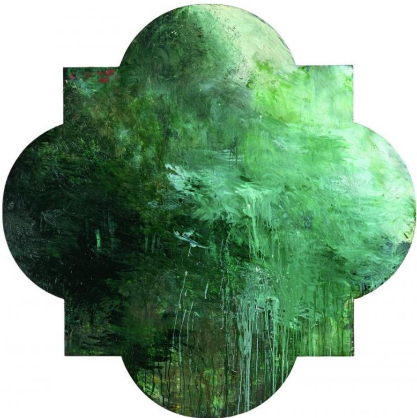
Cy Twombly, senza titolo, Bassano in Teverina, 1985.