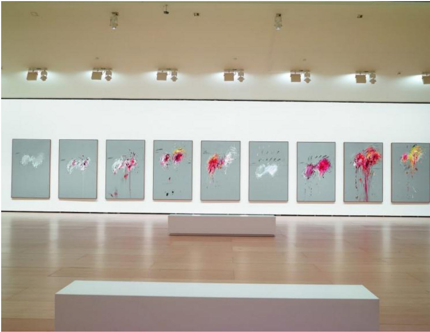
Cy Twombly, Nine discourses on commodus, 1963 insieme.

Dove sugli scudi, a quell'altezza, erano la Pop Art da una parte e il Minimalismo dall'altra: due indirizzi da lui parimenti distanti (al netto della stima reciproca con figure come Andy Warhol e Richard Serra).