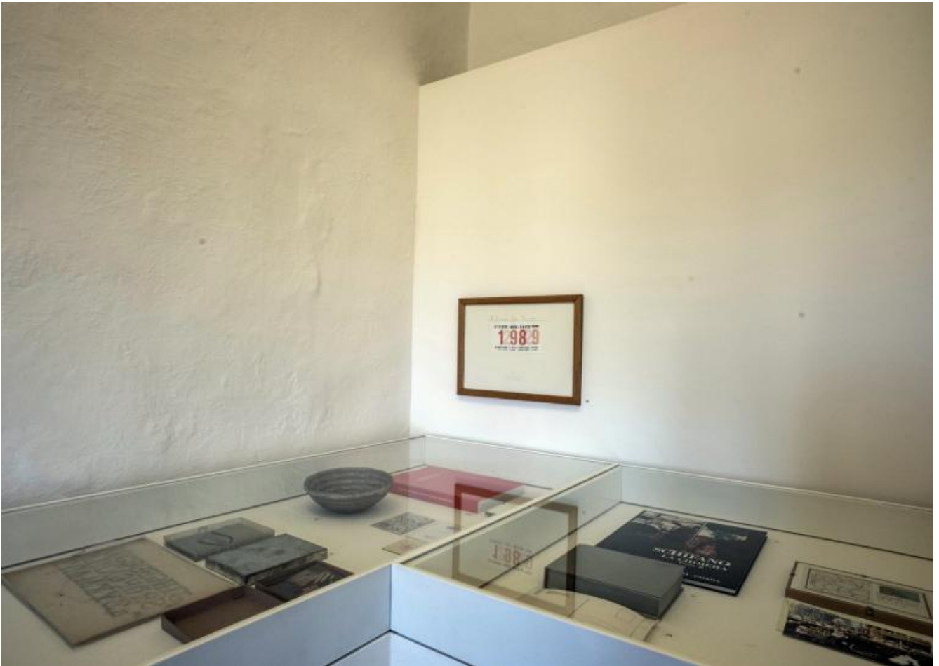
Luca Pancrazzi Io. Noi. Voi..., veduta della mostra, 4 febbraio-25 marzo 2017.

Per l'occasione abbiamo restaurato una piccola botola preesistente sul pavimento del museo e che si apre su un vuoto tecnico sovrastante le volte a sesto acuto di Fonte Nuova. Luca Pancrazzi ha progettato il vetro di chiusura della botola facendovi satinare sopra la scritta "SPACE AVAILABLE" dichiarando così anche lo spazio sottostante come 'disponibile' per le mostre future.