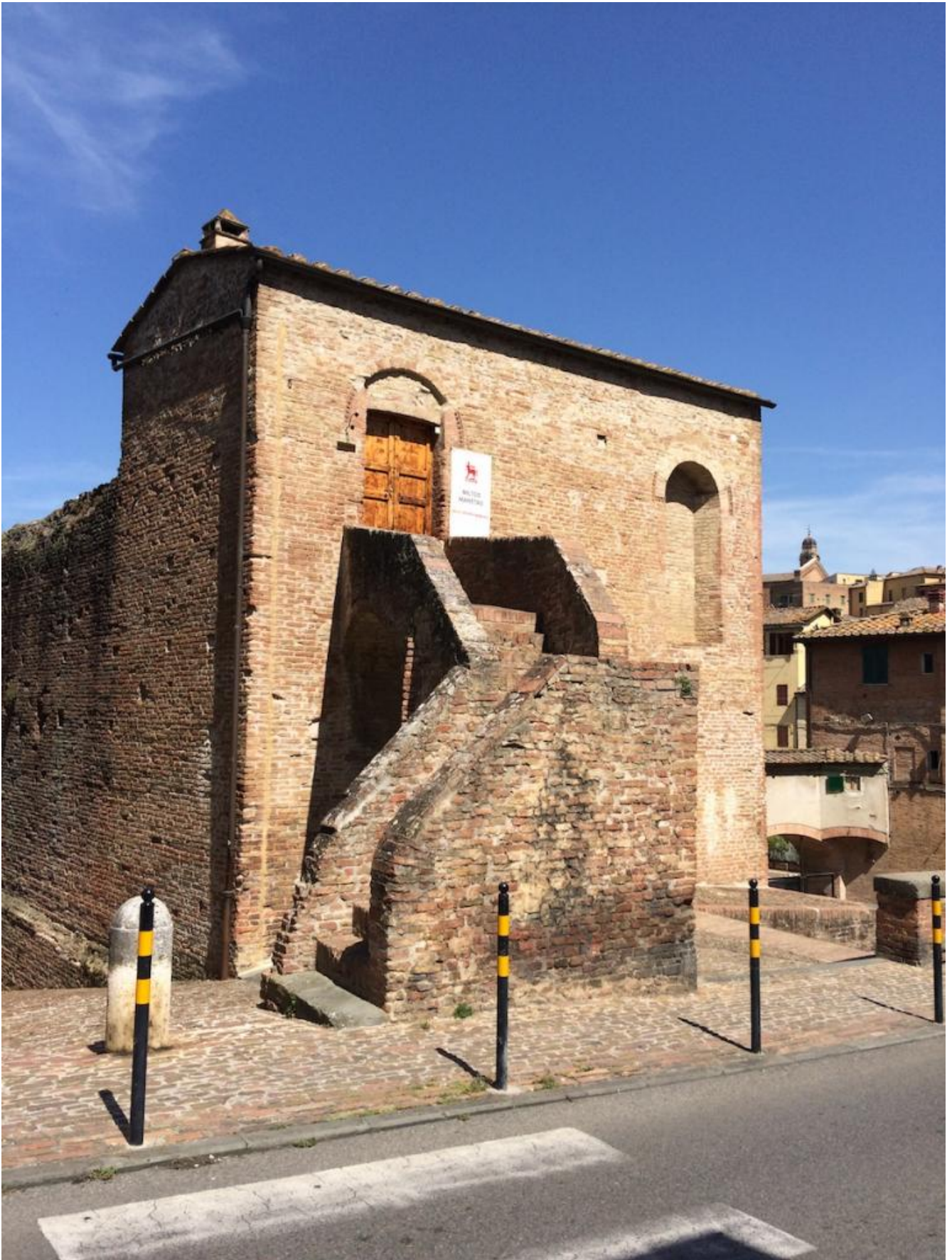
Ingresso del Museo d'Inverno.