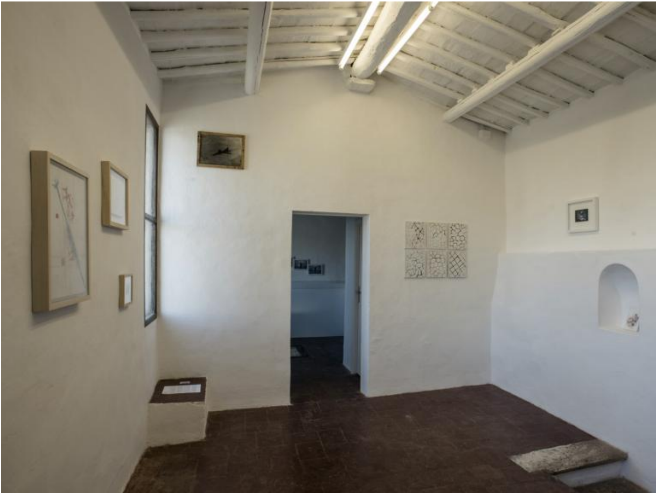
Luca Pancrazzi Io. Noi. Voi..., veduta della mostra, 4 febbraio-25 marzo 2017.