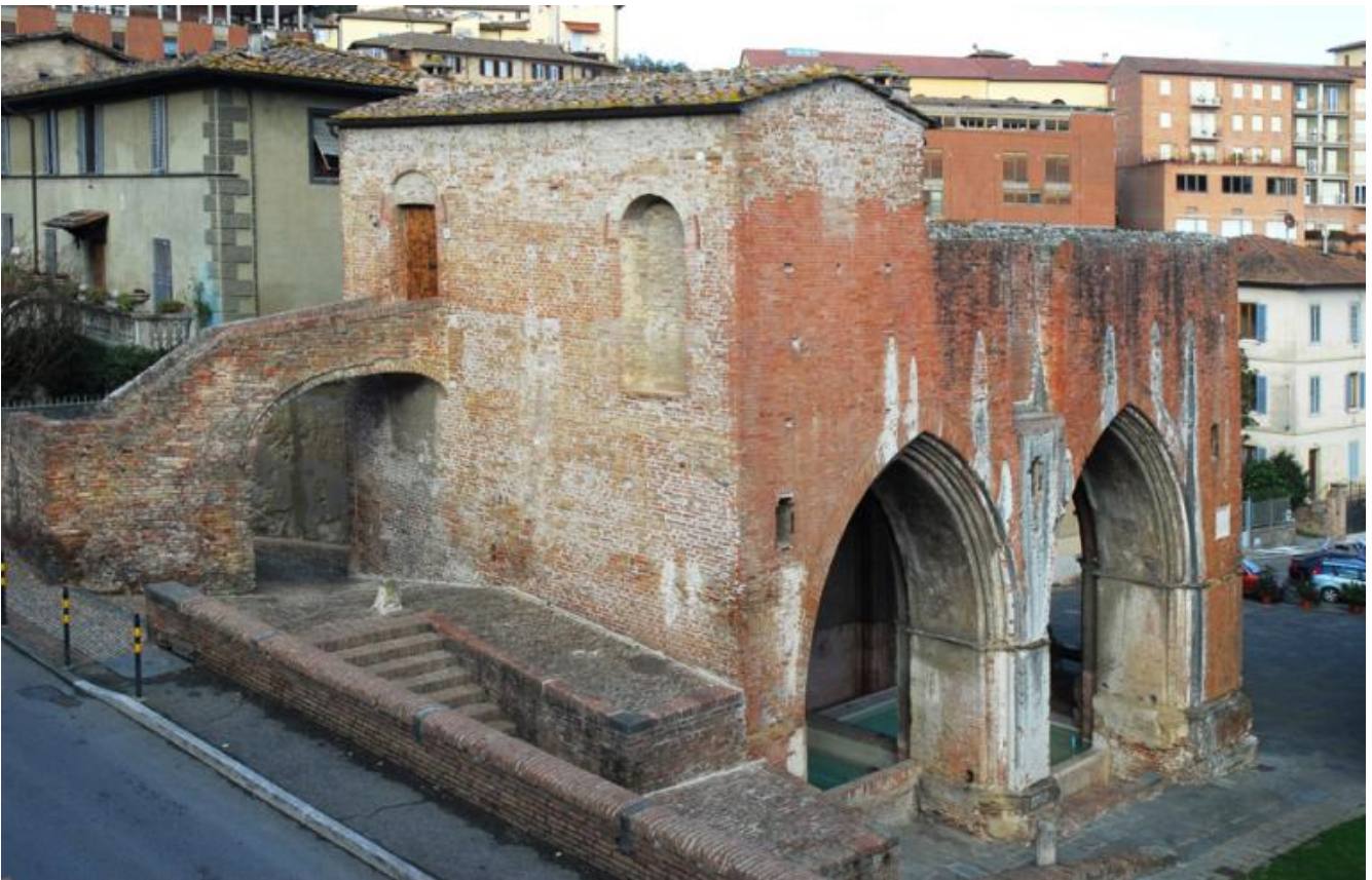
Fonte Nuova / Museo d'Inverno.

Ubicato sopra il bacino idrico trecentesco di Fonte Nuova, nella Contrada della Lupa (uno dei diciassette rioni della città), il Museo d'Inverno, con la sua programmazione stagionale (da qui il nome "d'Inverno"), invita di volta in volta un artista nazionale o internazionale a presentare le opere di altri autori presenti nella sua collezione personale, chiedendogli così di raccontare la propria storia attraverso i lavori da lui ricevuti in dono o frutto di scambi reciproci.