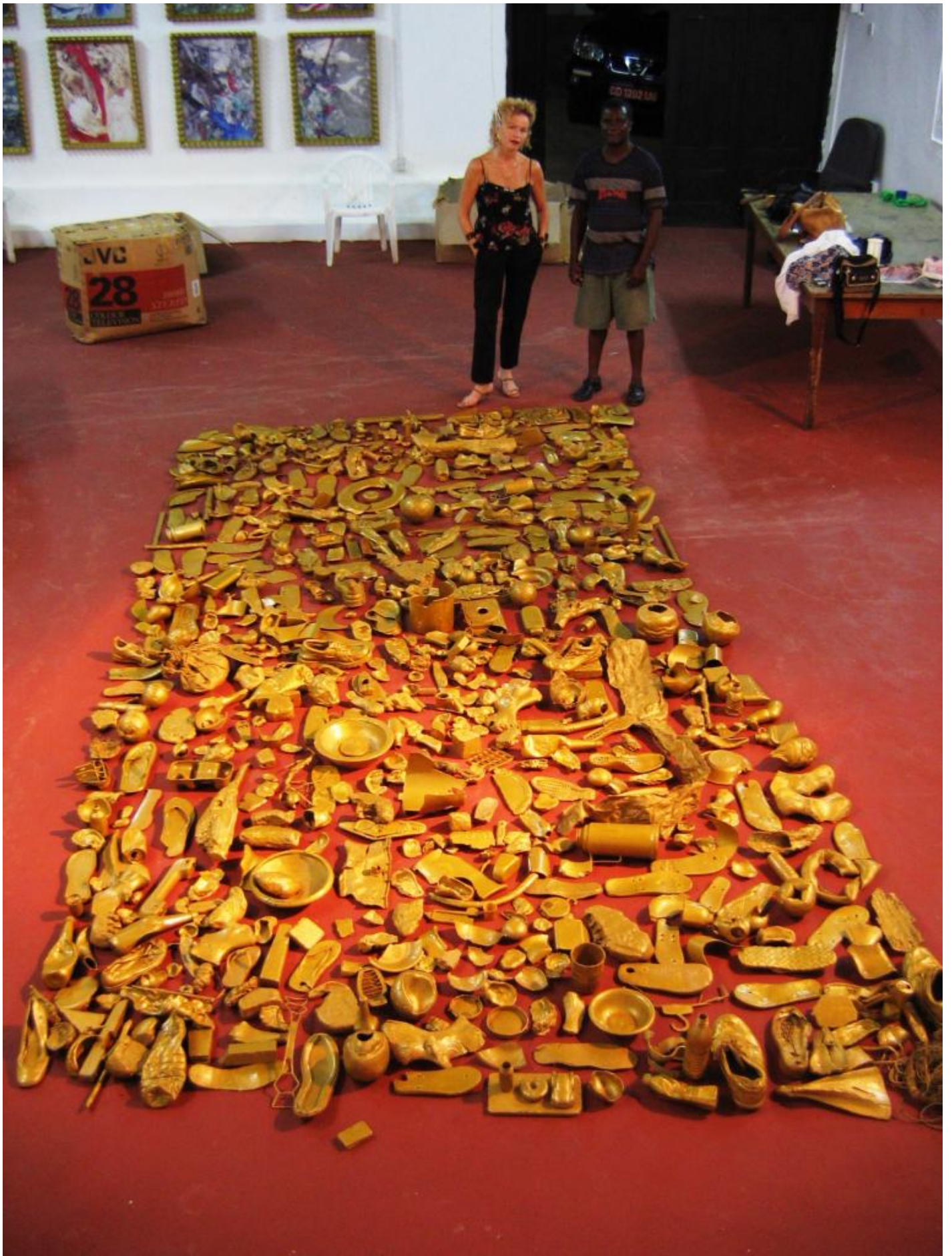
Ph: Virginia Ryan, Goldfield, Kumasi 2002, courtesy of the artist.