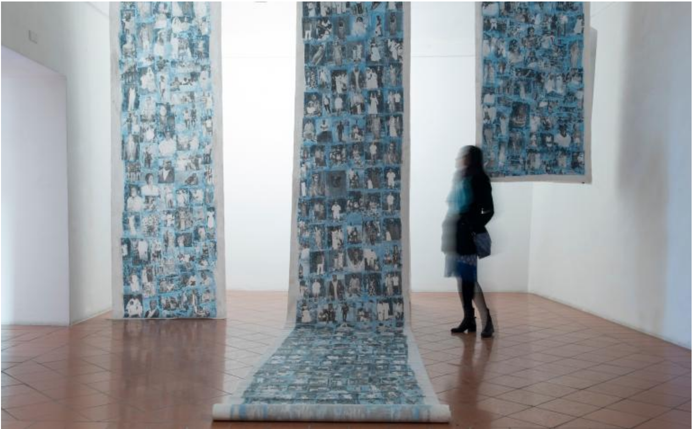
Ph: Virginia Ryan, Installation view, Palazzo Lucarini 2017, courtesy of the artist.

La sua predilezione per gli assemblaggi e i fotomontaggi, per gli objet trouvé e i materiali deperibili e riciclati, dialoga con la storia dell'arte, ma muove da un'esigenza interiore e dalle esperienze del suo periodo africano. Davanti alla fragilità della vita, alle lacerazioni che attraversano la realtà, al tempo che tutto inghiotte e cancella, il lavoro di Virginia Ryan prende la forma della raccolta paziente, della ricucitura che non nasconde le cicatrici, di un'arte della memoria che altera, con strappi e cancellature, ciò che vuol salvare.