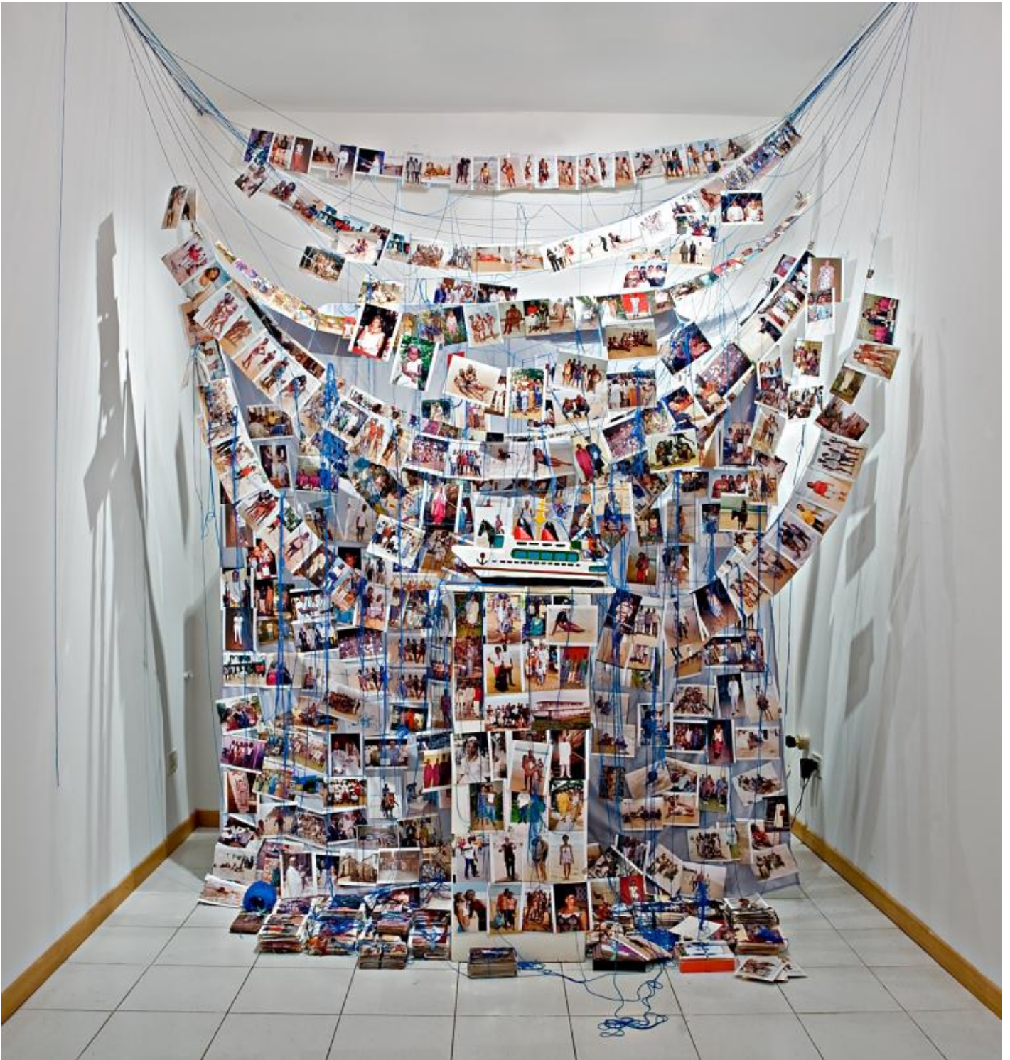
Ph: Virginia Ryan, Found photographs from Grand Bassam, installation Spoleto, courtesy of the artist.

L'opera di Virginia assume così il carattere di un lavoro intermediale, fatto attraverso le cose e le immagini che tessono la trama della realtà. Qui i confini fra il reale e l'immaginario, il proprio e l'altrui, l'individuale e il collettivo, tendono a confondersi, ma non a svanire: da un lato questo lavoro di ri-mediazione autoriale indebolisce il nesso con il contesto di partenza, ma dall'altra non arriva mai a cancellare l'intenzione comunicativa che era alla base dell'artefatto originario. È questo il motivo per cui accade che con le opere di Virginia Ryan non solo sentiamo di guardare, ma anche di essere guardati, di poter guardare non solo all'arte ma anche attraverso l'arte.