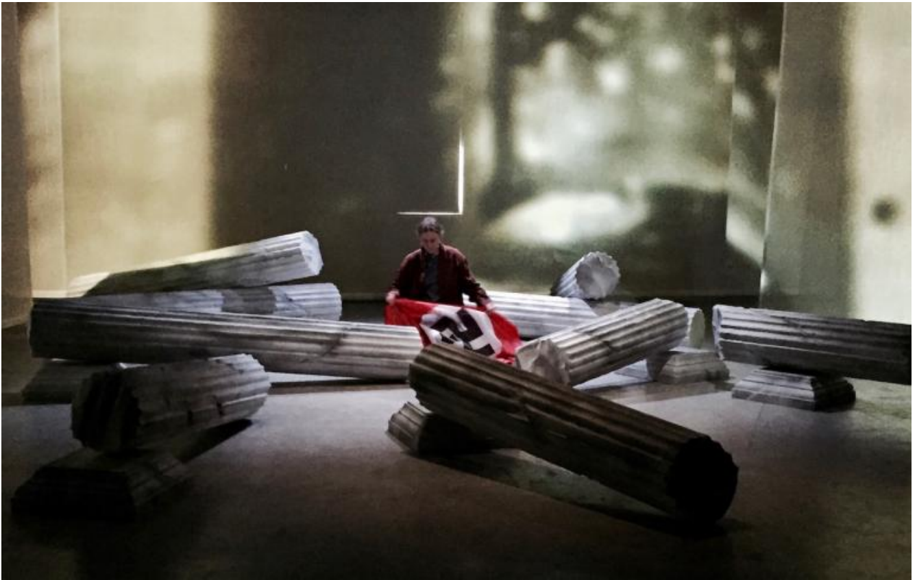
AKTION T4, Lenz Fondazione, ph. Francesco Pititto.

Si tratta della manifestazione della teoria del “valore delle rovine” di Alfred Speer, l’architetto di Hitler: tutti i nuovi edifici del regime sarebbero stati costruiti in modo da lasciare resti grandiosi, quanto quelli dell’antica Grecia o dell’Impero Romano, per testimoniare nei secoli a venire la grandezza del Terzo Reich. La potente idea di accostare ruderi da preservare, fondati sul polistirolo e quindi sulla finzione, sull’inganno della propaganda, a corpi ‘rovinati’, invece, da distruggere, si rivela solo un ornamento, per giunta d’impedimento quando si spostano le colonne e si cambia scena (senza, peraltro, mutare davvero l’atmosfera).