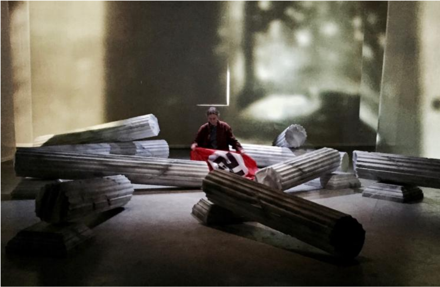
AKTION T4, Lenz Fondazione, ph. Francesco Pititto.

che non restituisce e incoraggia stati d'animo, riflessioni o visioni altre, ma soltanto la teatralizzazione (d'occasione, commemorativa) del pensiero stesso degli autori e dei loro collegamenti letterari intorno al tema. Aktion T4 , quindi, non ci trasporta da nessuna parte, eccetto che qui, in teatro, davanti a una selva di colonne di polistirolo abbattute.