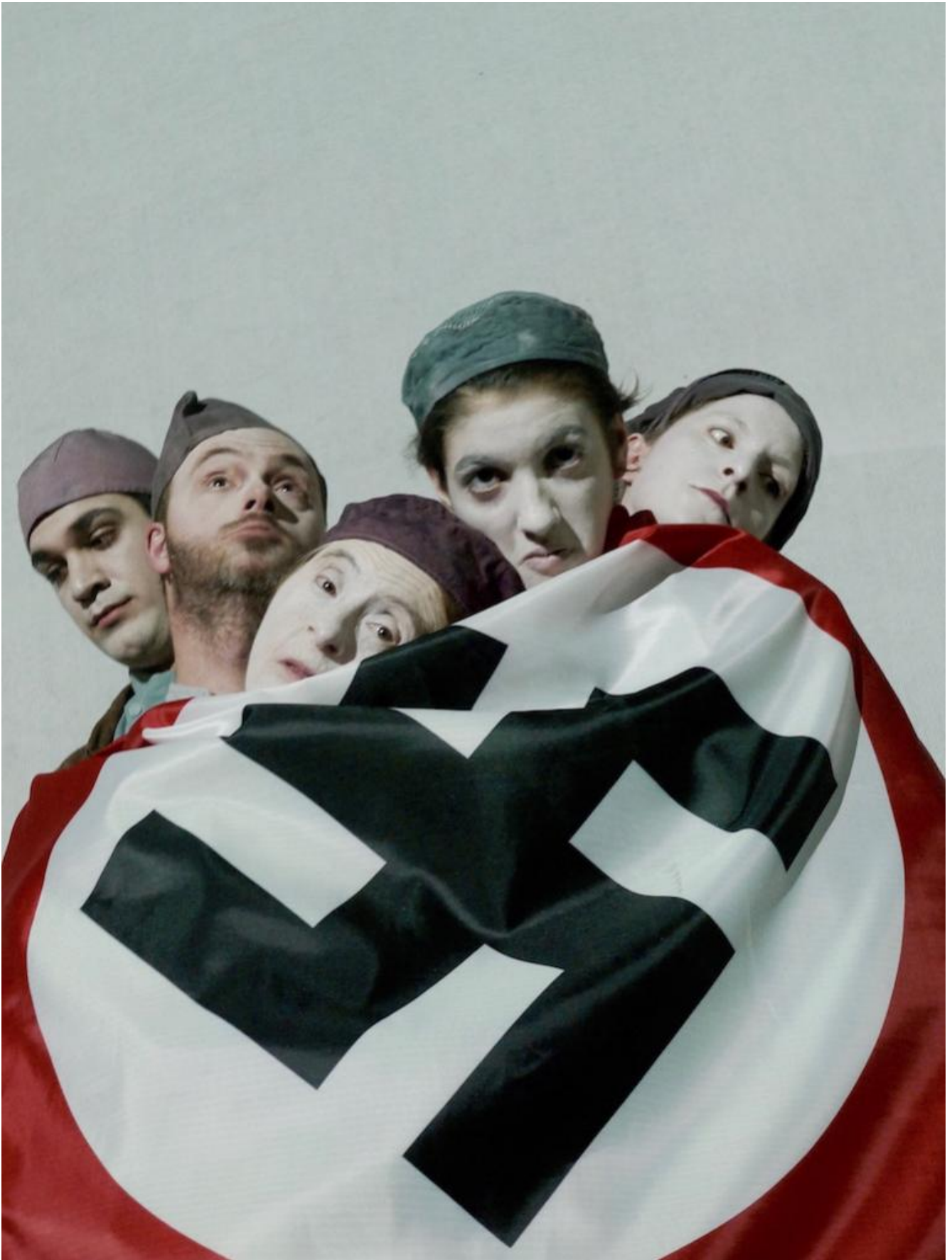
AKTION T4, Lenz Fondazione, ph. Maria Federica Maestri.