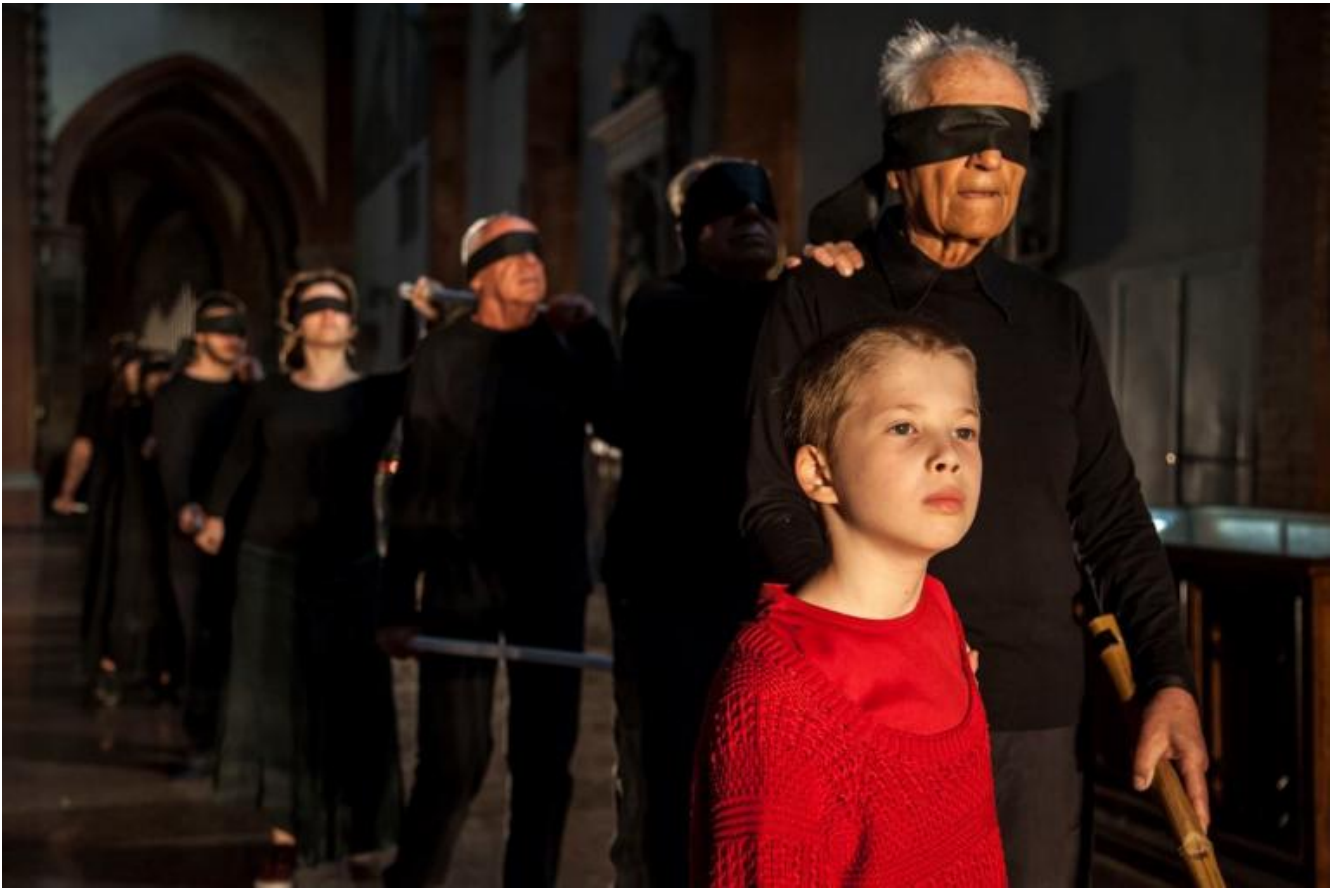
Bombs Away!, Teatro del Pratello, ph. Malì Erotico.

Polvere, detriti, squarci di buio e piccole luci, cose senza forma definita trascorrono sugli schermi, come rottami nella chiesa due volte bombardata. Descrizioni di cosa restava, tra i pilastri gotici squarci verso la città. Un gruppo carnevalesco, un corteo con due grandi barelle, uomini e donne ingabbiati da un filo mentre qualcuno agita rami d'ulivo, una fila di bendati guidati da un bambino vestito di rosso, uomini e donne che spolverano il terreno, un corteo mestamente festoso con bandiere passano nelle navate laterali. Intanto la musica, composta dalla classe di musica applicata di Aurelio Zarrelli del Conservatorio di Bologna gocciola, invade, crea attesa, propaga ansia, esplode nel lamento della grande sirena a mano, si fa materia astratta, percussione, stato d'animo, come le immagini mai descrittive di Manuela Tommarelli, Simone Tacconelli, Fabio Maggi.