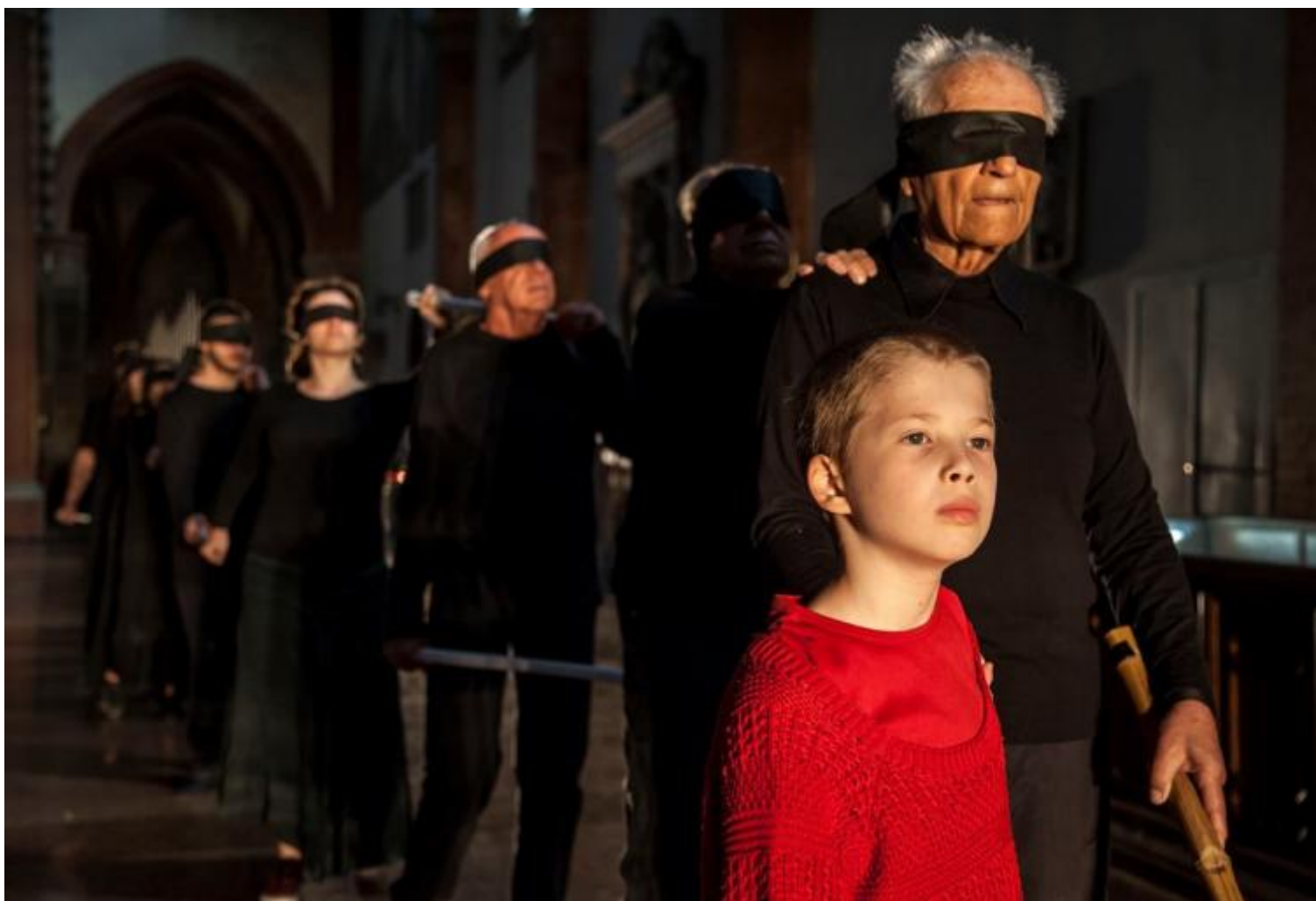
Bombs Away!, Teatro del Pratello, ph. Malì Erotico.

Altre parole più misteriose, silenti, vengono recitate tra i banchi, nel buio, da ragazzi e da signori e signore di una certa età, ombre illuminate solo da mozziconi di candela tenuti sul palmo della mano. Parole di lutto, di preghiera forse.