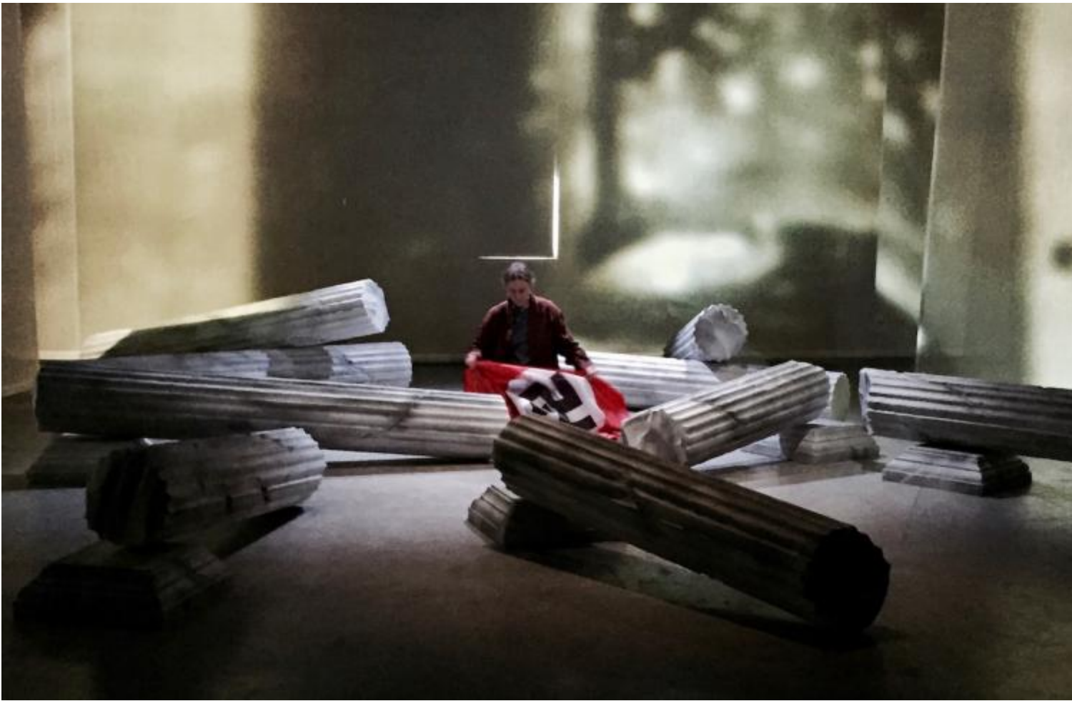
AKTION T4, Lenz Fondazione, ph. Francesco Pititto.

che non restituisce e incoraggia stati d'animo, riflessioni o visioni altre, ma soltanto la teatralizzazione (d'occasione, commemorativa) del pensiero stesso degli autori e dei loro collegamenti letterari intorno al tema. Aktion T4 , quindi, non ci trasporta da nessuna parte, eccetto che qui, in teatro, davanti a una selva di colonne di polistirolo abbattute.