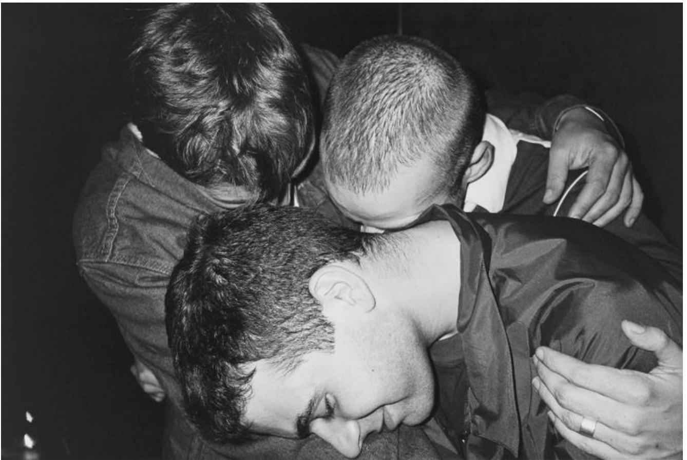
Wolfgang Tillmans, Arkadia I, 1996.

Gli esplosivi lavori astratti chiariscono una cosa: nel mondo di Tillmans anche l'esplorazione della luce ha un aspetto corporeo. La sua opera è sempre quella di un soggetto incarnato, anche quando gli oggetti rappresentati sono celestiali. Un'eclissi solare, il passaggio di Venere del 2004 o la notte stellata non sono mai rese in un modo che pretende di essere oggettivo e distaccato.