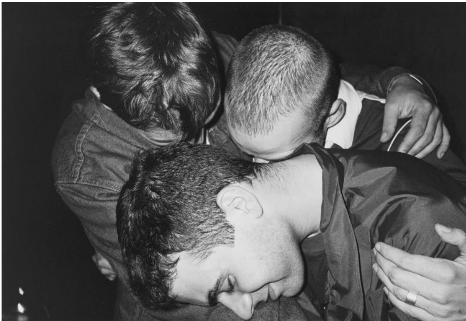
Wolfgang Tillmans, Arkadia I , 1996.

Gli esplosivi lavori astratti chiariscono una cosa: nel mondo di Tillmans anche l'esplorazione della luce ha un aspetto corporeo. La sua opera è sempre quella di un soggetto incarnato, anche quando gli oggetti rappresentati sono celestiali. Un'eclissi solare, il passaggio di Venere del 2004 o la notte stellata non sono mai rese in un modo che pretende di essere oggettivo e distaccato.