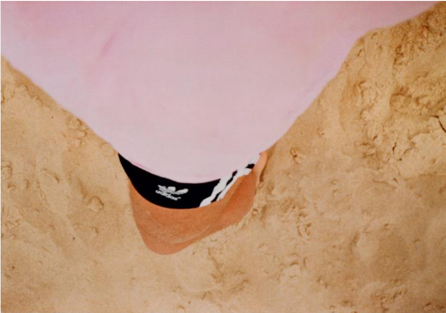
Wolfgang Tillmans, Lacanau (sé), 1986.

Questo artista infatti se ne è stato notevolmente lontano dall'industria della moda e non ha mai accettato offerte lucrative.