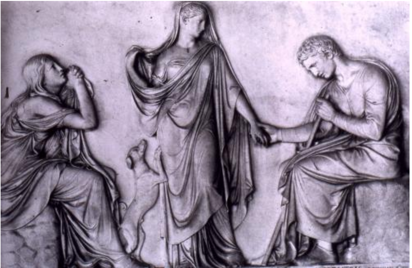
Pietro Tenerani, Bassorilievo funebre per Clelia Severini , 1825 (Roma, San Lorenzo in Lucina).

Nella sua formidabile (quanto accademicamente svillaneggiata) produzione saggistica, spesso Gabriele Frasca ha ragionato sul rapporto di emulazione – ma anche spettrale sostituzione – fra la trasmissione della memoria genetica e quella, non genetica, operata mediante parole e immagini. Un'ambivalenza profonda appartiene in qualche misura a chiunque rimembri e assembri , in forma di simulacro, la beltà vivente : da un lato attraverso tali simulacri – non importa se materiati di parole, o di cera o terra o pietra – serbiamo la memoria di quei corpi, di chi magari è presente nel momento in cui lo ritraiamo ma la cui vita, sappiamo, avrà una durata mortale; ma questa sopravvivenza si produce a costo di una trasmutazione, una transcodificazione non genetica che in qualche misura è il doppio speculare, il revênant dello stesso processo col quale il corpo invecchia e muore. Nel sostituirsi alla materia vivente – anche con la migliore delle intenzioni, quella appunto di farla sopravvivere nella memoria – il simulacro inorganico corrisponde all'azione del tempo sulle fibre viventi che esso in qualche modo vorrebbe riparare, o contraddire. A questa dialettica ineludibile pare alludere già Michelangelo, quando parla del tormento di rendere il corpo umano in cera, terra o pietra : quelle più vive membra sono più vive, s'è detto, in quanto più resistenti