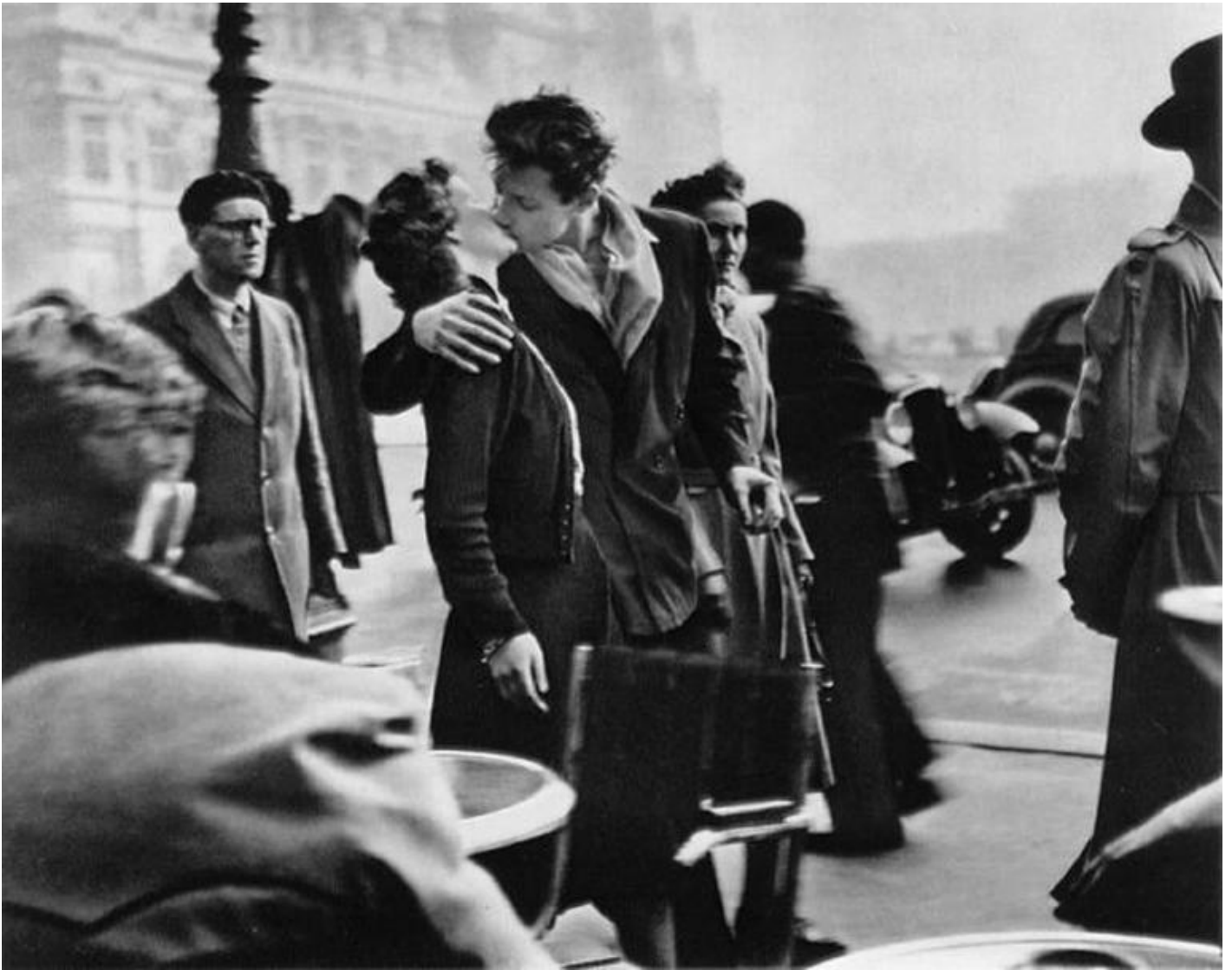
Robert Doisneau, Baiser de l'Hotel de Ville, 1950.

Nel descrivere queste immagini, come abbiamo ascoltato, Frasca parla di «un unico affiorare di relitti, da riportare in secco e giustapporre». Relitti , appunto, sono le impressioni che degli oggetti visti serbiamo nella nostra memoria genetica per poi riprodurli con strumenti inorganici, verbali o iconici che siano. Questa doppia articolazione della memoria, diciamo, è stata messa a tema da Frasca sin dalle origini della sua opera in versi: nella prima raccolta poetica, Rame , pubblicata in due diverse versioni nel 1984 e nel 1999 (e ora rifiuta, insieme al successivo Lime , nel volume Lame, con postfazioni di Giancarlo Alfano e Riccardo Donati, fuoriformato L'orma 2016 : già da questi titoli – che “ruotano” attorno all’innominato «Rime» – è facile capire quanto quello dei simulacri sia tema decisivo nel suo immaginario) si trova un dittico di testi brevissimi – sonetti ridotti ancora più crudelmente di quello michelangiolesco – rispettivamente intitolati Calcicare e Ricalcare :