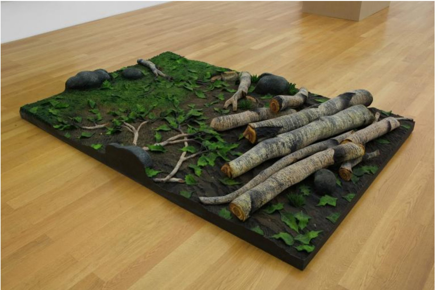
Piero Gilardi, Tappeto natura , 1966.

All'esordio del nuovo millennio la natura simulata dei tappeti, ancora legata all'umanesimo modernista, cede il passo a una ricostruzione più accattivante, in forma ambientale e quasi incantata. Qui il pubblico, spettatore e attore, riscopre un nuovo modello esperienziale fondato sulla comunità e sull'ascolto del contesto, un modello quindi alternativo, sul piano macropolitico, a quello sociale dominante, lo stesso che Gilardi contesta con l'ideazione e realizzazione del PAV, il Parco d'Arte Vivente (2008) di Torino.