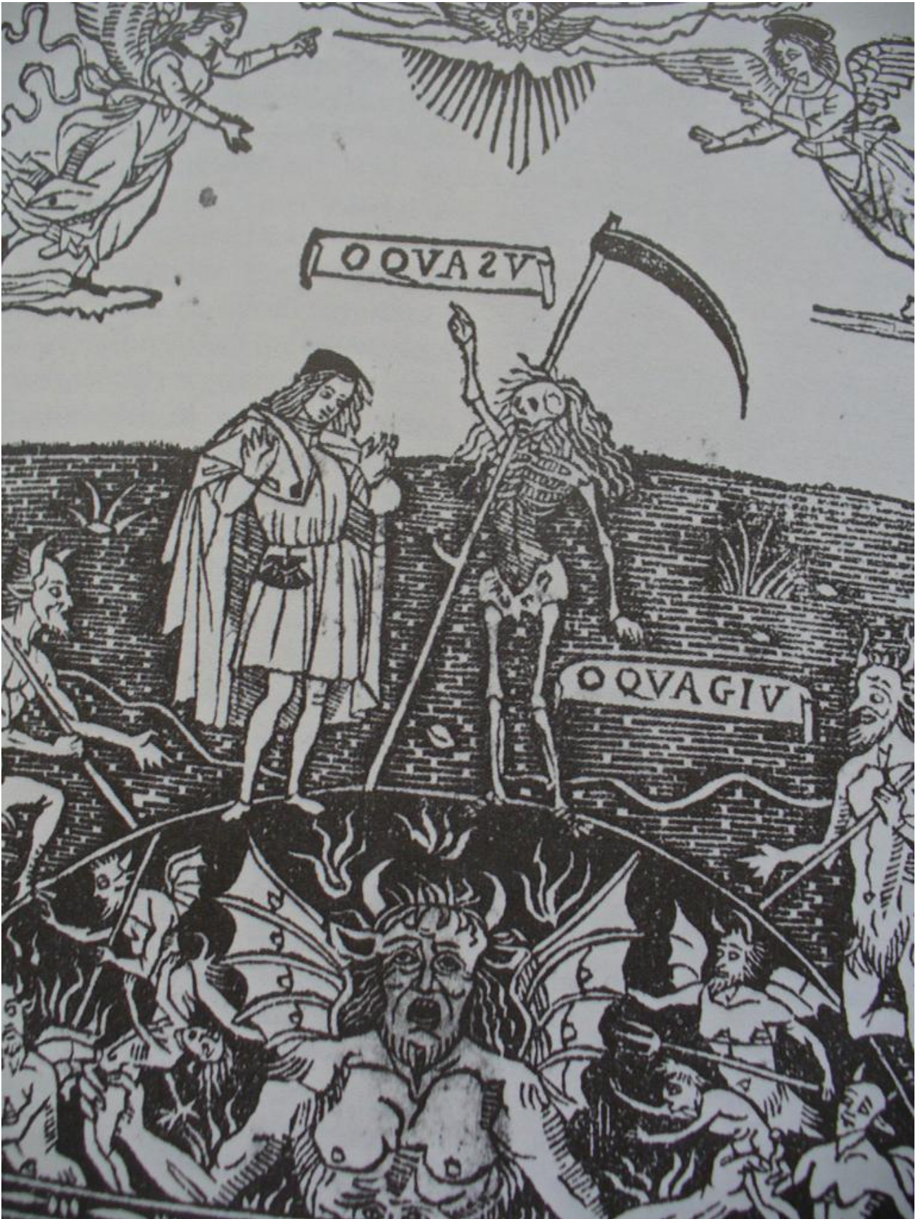
O qua su o qua giù, particolare della morta con Lucifero e i diavoli.