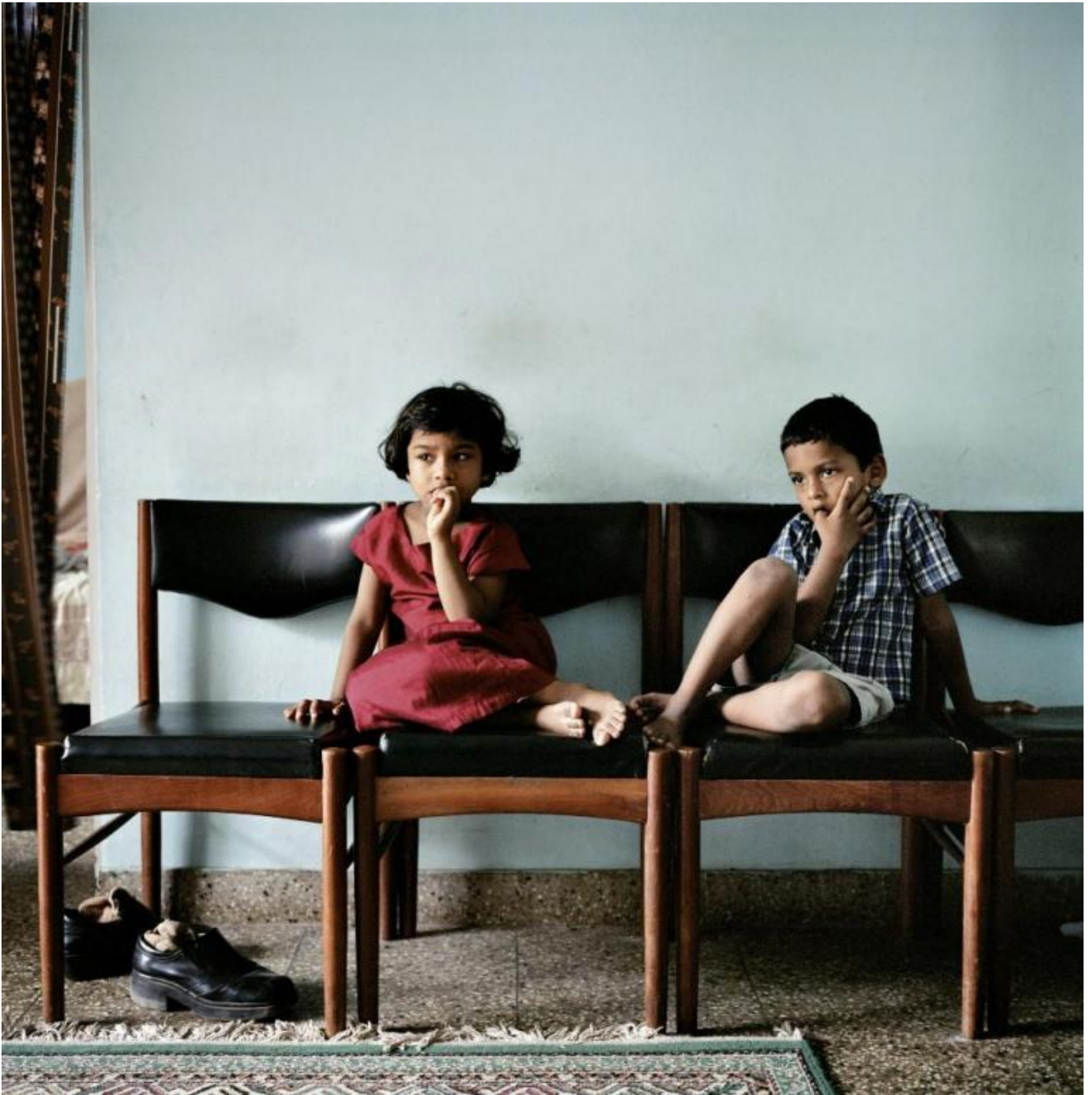
Watching Tv series, 2004-2007.