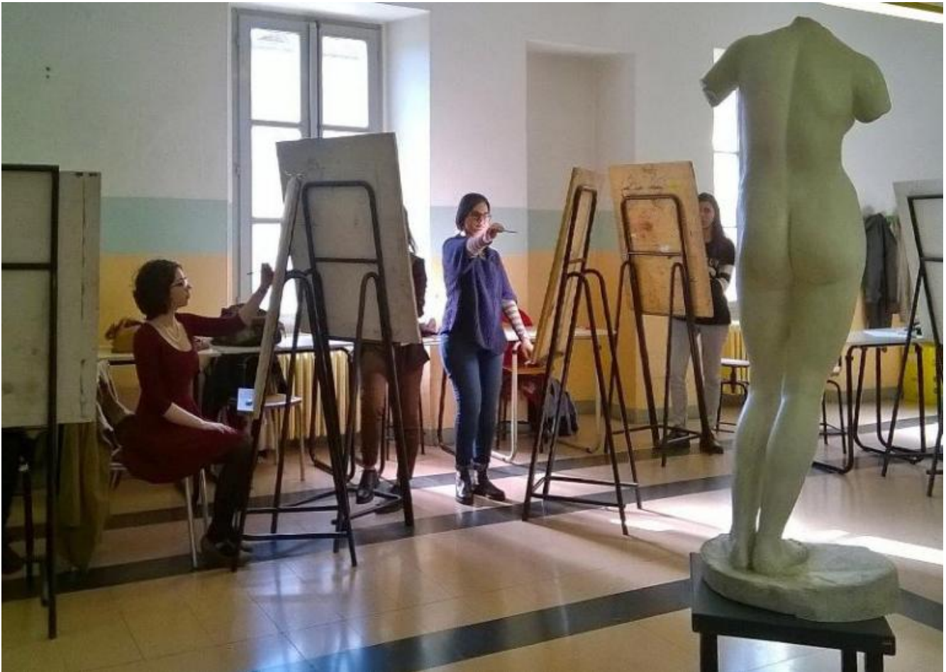
Studenti impegnati nella copia della Venere di Cirene, calco in gesso tratto dall'originale del IV secolo a.C. conservato presso il Museo Archeologico di Tripoli.

Alla luce di quanto si è detto, tornando alle riflessioni sulla metrica del comporre che sviluppa competenze trasversali oltre che d'indirizzo, è auspicabile che lo scambio tra l'area artistica, umanistica e scientifica nella didattica dei licei artistici italiani non si concretizzi in un collage di discipline incollate tra loro da un prodotto , ma in un'esplorazione critica dei processi percettivi e insieme cognitivi messi in atto dallo studente nel suo muoversi verso un'idea. Tutto ciò allo scopo di favorire lo sviluppo delle competenze trasversali o soft skills richieste dal nuovo sistema d'istruzione e dal mondo del lavoro, tra le quali quella logico-matematica, il problem solving, l'approccio critico, la creatività e la flessibilità mentale, alle quali è indispensabile aggiungere anche quella di cogliere il rapporto tra le singole parti e l'intera figura, la capacità di cogliere una simmetria innestando così la razionalità metrica in quella logica.