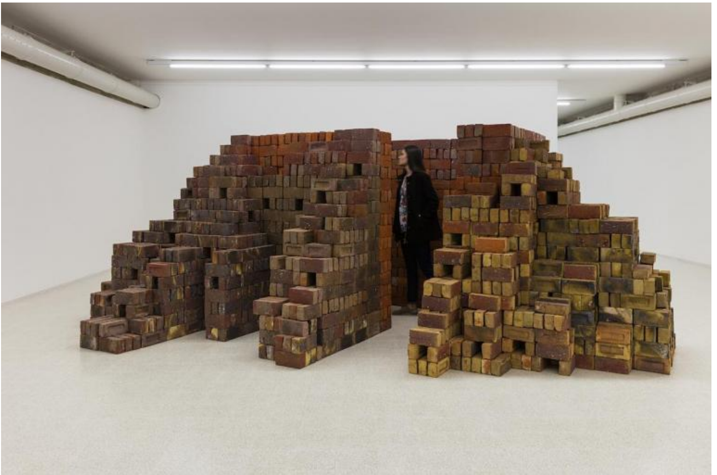
Elisabetta Benassi. Zeitnot, 2017. Cinquemila mattoni refrattari inglesi / five thousand English firebricks, 175 x 500 x 380 cm. Courtesy Collezione Maramotti © Elisabetta Benassi. Ph. Andrea Rossetti.

Affrontando il corpus delle sue opere spesso si è scomodata la categoria degli spettri, ma bisognerebbe forse chiamare in causa la figura del revenant , con tutta la sua forza archetipica. La ri-messa in scena di elementi cristallizzati in una forma e in un significato assodati nel tempo pone lo spettatore di fronte a quella condizione di spaesamento che assomiglia molto a quel perturbante che si insinua in colui che accoglie il ritorno a casa del “ritornante”: un senso di angoscia legata alla certezza del conosciuto che si sgretola, la paura di affrontare una estraneità in ciò che è più familiare, il timore della sostituzione dell’oggetto affettivo con un feticcio maligno. Non ultima, la paura del ritorno da una zona d’ombra – la morte come paradigma di stasi a cui solo la memoria ha diritto di accesso – e il timore della trasfigurazione di un oggetto (o soggetto) in un agente estraneo e incontrollabile.