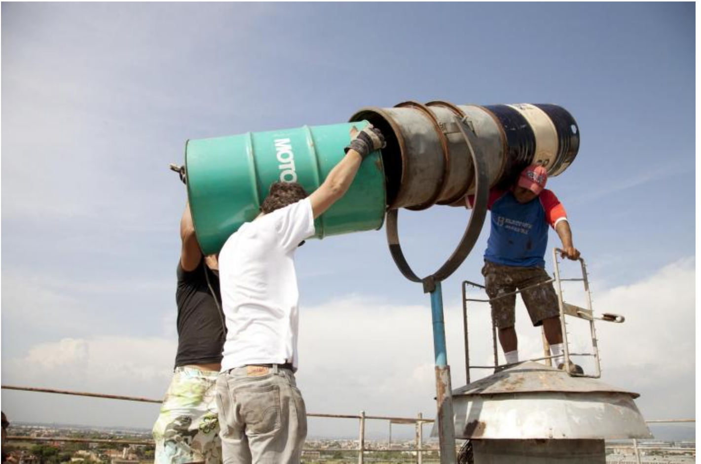
Gian Maria Tosatti, Hotel sur la lune, 2011.

Nessuna cultura, nessuna civiltà, è stata catturata dalla mania di conservare e «monumentalizzare» il passato tanto quanto la nostra. Quando poi la modernità si è esaurita, o meglio si è esaurita la sua spinta «futurologica», della trama stessa del moderno sono rimasti solo il presente, vissuto come eterna ripetizione dell'identico, e il passato esploso come «revival», ed è allora che la memoria inizia a occupare il centro della scena culturale diventando industria. Ecco quindi che la mania conservativa e collezionistica si diffonde ancora di più, e nell'epoca postmoderna – ovvero una modernità senza le speranze e i sogni che avevano reso tollerabile la modernità – il museo sussunto dal capitale globale si moltiplica, diventa spettacolo, giostra luminosa a uso e consumo del turismo culturale. Quando poi il capitalismo finanziario è attraversato da crisi di assestamento, in alcune province dell'impero è costretto a dismettere gli investimenti pubblici nel settore culturale, allora i musei spengono le luci e si arenano come tristi relitti ai bordi della metropoli.