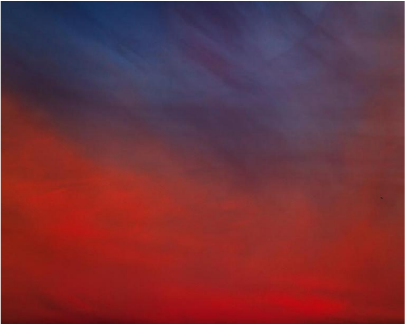
Paglen, Untitled (Reaper Drone) , 2010.