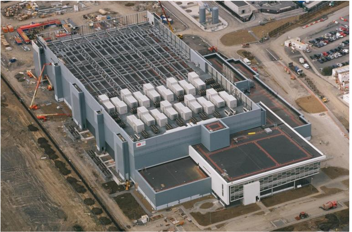
Data center della Microsoft, Dublino.

Come funziona esattamente Internet? e soprattutto, se non è una nuvola, dove è? Questi e altri sono gli interrogativi che da tempo assillano Trevor Paglen (1974), uno degli artisti più interessanti attivi in America dopo l'11 settembre, ancora poco conosciuto in Italia. Paglen, che non ama attardarsi sulla sua biografia, ha trascorso l'adolescenza nelle basi militari in Germania e Stati Uniti seguendo il padre, oculista per l'air force americana. Senza mai dimenticare la sua cultura punk DIY e l'esperienza in un gruppo di noise rock (Noisegate) in cui suonava il basso e il sampler, ha una doppia formazione, come artista (Art Institute of Chicago) e come geografo. A Berkeley infatti s'interessa alla sorveglianza digitale, su cui scrive un dottorato, poi pubblicato ( Blank Spots on the Map. The Dark Geography of the Pentagon's Secret World , Dutton 2009).