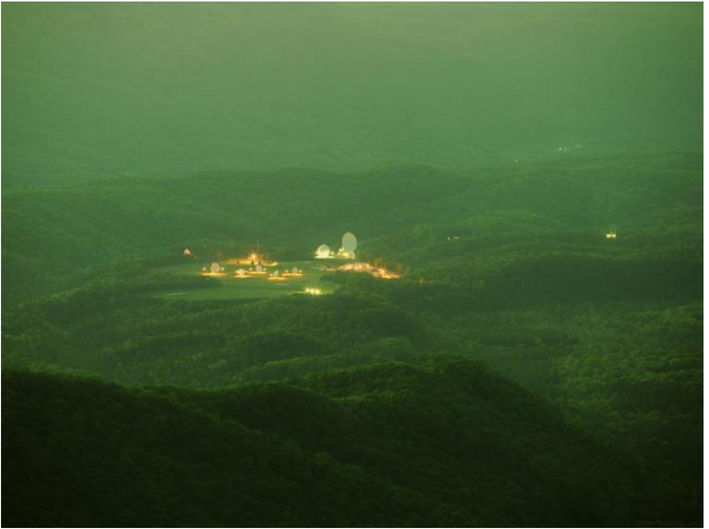
Paglen, They Watch the Moon , 2010.