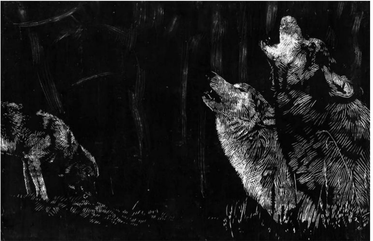
Illustrazioni di Simone Massi, da Chiara Guidi, Buchettino , Orecchio Acerbo 2015.

Molto prima dei moderni studi antropologici, peraltro, nell'antica Grecia, filosofi e pensatori, a proposito di Poesia e Tragedia, interpretavano lo straordinario potere della finzione letteraria come catarsi . Ciò che avveniva durante la lettura di versi o sul palcoscenico induceva il pubblico a purificarsi, elaborando in profondità dilemmi etici, e vivendo intensamente come spettatori vicende che a tutt'oggi, nei teatri antichi di Siracusa, Taormina, Segesta, Epidauro, muovono le nostre coscienze e ci educano alla necessità della ricerca di senso.