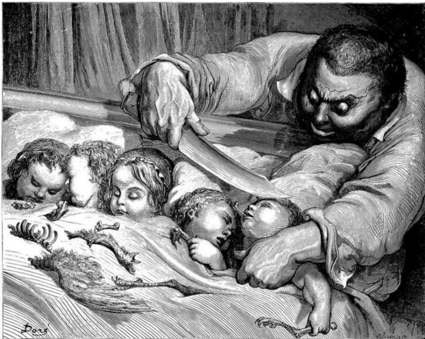
Illustrazione di Gustave Doré, da Le contes de Perrault, J. Hetzel, Libraire-Editeur 1862.

La fiaba di Pollicino di Perrault ha numerosi punti di contatto con quella di Hänsel e Gretel dei Grimm, in particolare nella parte iniziale che procede identica: la decisione dei genitori di abbandonare i figli a causa della miseria, l'abbandono nel bosco, lo stratagemma dei sassolini bianchi per ritrovare la strada di casa, e poi quello, fallimentare delle briciole mangiate dagli uccelli, che decreta lo smarrimento dei bambini e il pericolo di essere mangiati nel primo caso dalla strega, nel secondo dall'orco. Silvia Vecchini nella poesia in cui riscrive Hänsel e Gretel mette al centro della scena il vincolo di salvezza che stringe fratello e sorella: