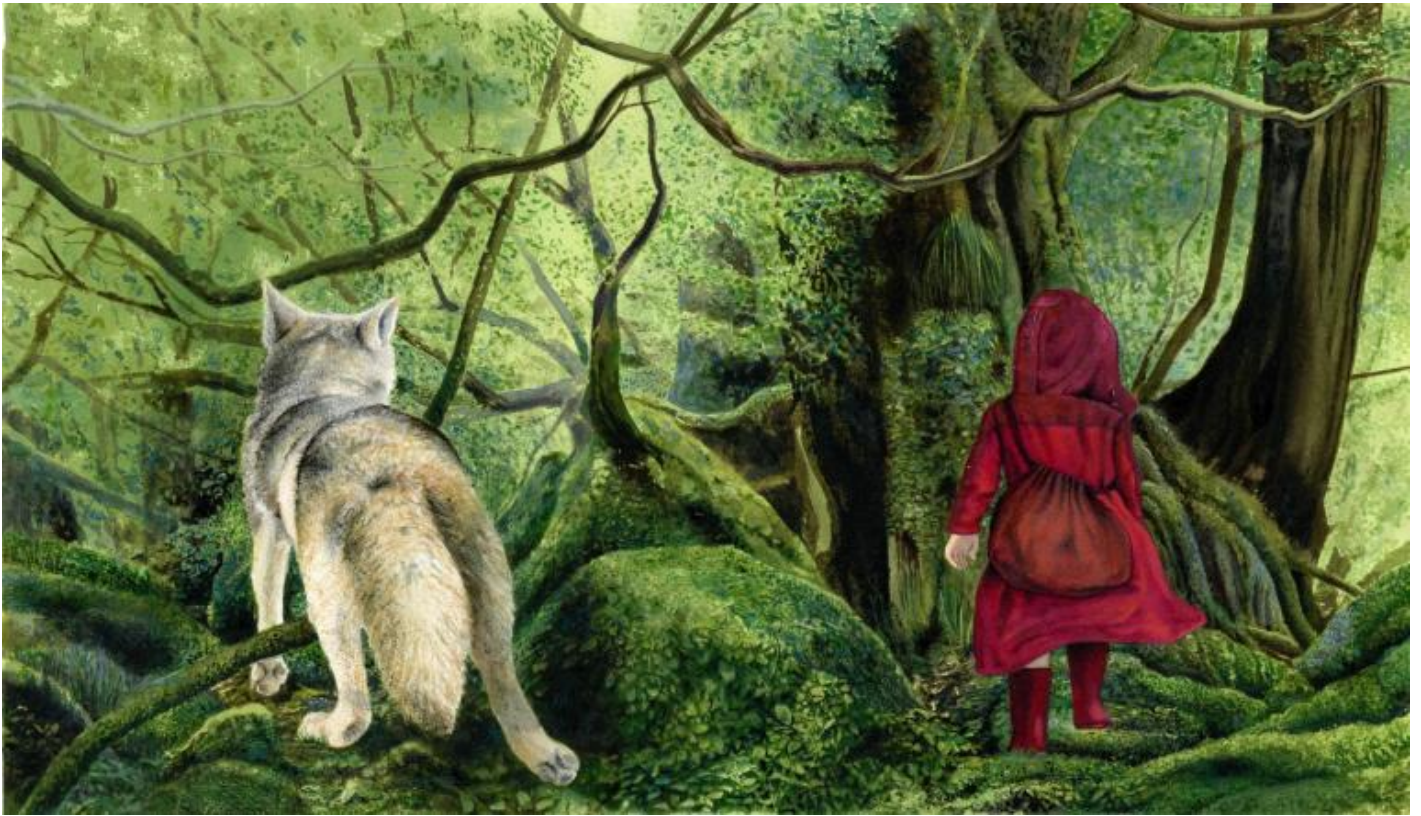
Illustrazione di Fabian Negrin, da Grimm, Tutte le fiabe , Donzelli 2105

Già i Fratelli Grimm, a stare ai loro carteggi, si lamentavano del problema, osservando che il perbenismo dei lettori li costringeva a sistematiche ripuliture dei testi orali raccolti durante il loro lavoro di ricerca. E in effetti le loro Fiabe o Märchen , come le leggiamo oggi, sono il risultato di ben sei edizioni nelle quali si procedette a successive riscritture per adeguarle al gusto del pubblico borghese, disturbato dal perturbante delle narrazioni popolari.