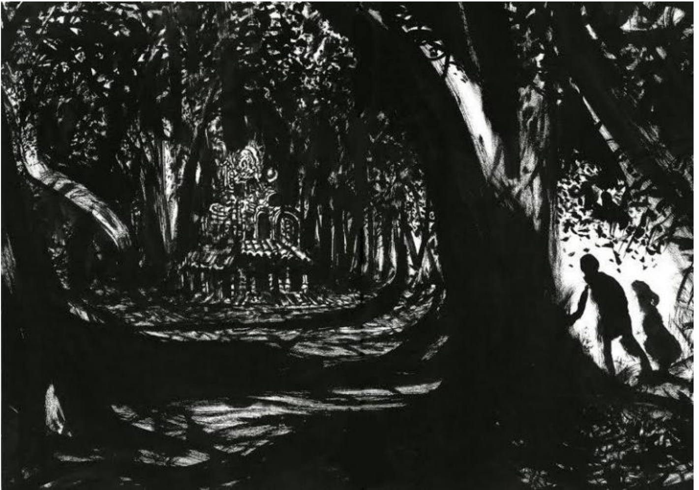
Illustrazioni di Lorenzo Mattotti, da Hänsel e Gretel, Gallimard Jeunesse 2009 .

Uscita nel 2009 per Gallimard Jeunesse e in Italia edita da Orecchio Acerbo, Hänsel e Gretel, attraverso le insuperabili illustrazioni di Lorenzo Mattotti, che tocca qui uno dei suoi punti più alti, è davvero “la fiaba per eccellenza” come l’ha definita Chiara Guidi: un percorso attraverso il buio e la luce che segna la crescita come capacità di riconoscere e opporsi al Male e superare il pericolo con le proprie forze. Dev’essere questa eccellenza la ragione per cui questa fiaba non smette di esercitare il suo fascino su disegnatori e illustratori.