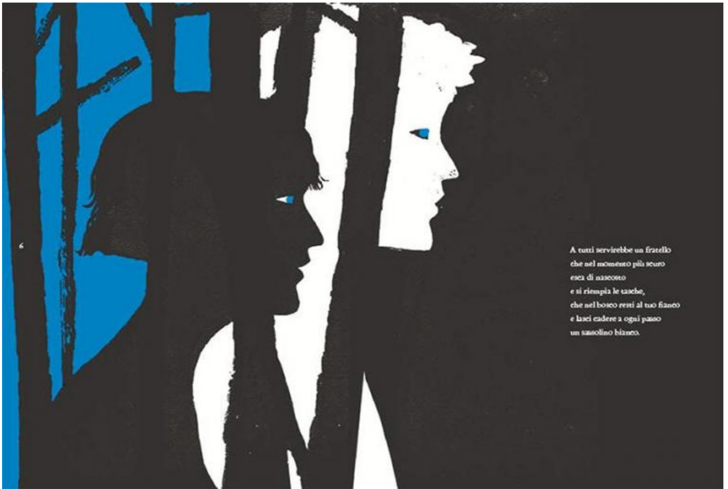
Illustrazione di Arianna Vairo, da Silvia Vecchini, In mezzo alla fiaba, Topipittori 2015.

Al cuore di questa vicenda, Vecchini mette, anziché l'abbandono dei figli nel bosco da parte dei genitori afflitti da una miseria senza scampo, l'eccidio delle orchessine uccise dal padre-orco al posto di Pollicino e dei suoi fratelli che scambiano i loro cappelli con le corone delle bambine, condannandole a morte e ingannando l'orco. Nell'illustrazione che Gustave Doré dedicò a questo momento della fiaba vediamo le orchessine che dormono tutte insieme in un grande letto cosparso di ossa. Accanto a questo, specularmente, il lettore immagina il letto in cui dormono Pollicino e i suoi fratelli. È certo che in questa fiaba lo stare a letto di bambini e bambine è fortemente implicato con il tessuto stesso della storia, ed è certamente anche questo che rende la messa in scena di Chiara Guidi così potente e liberatoria.