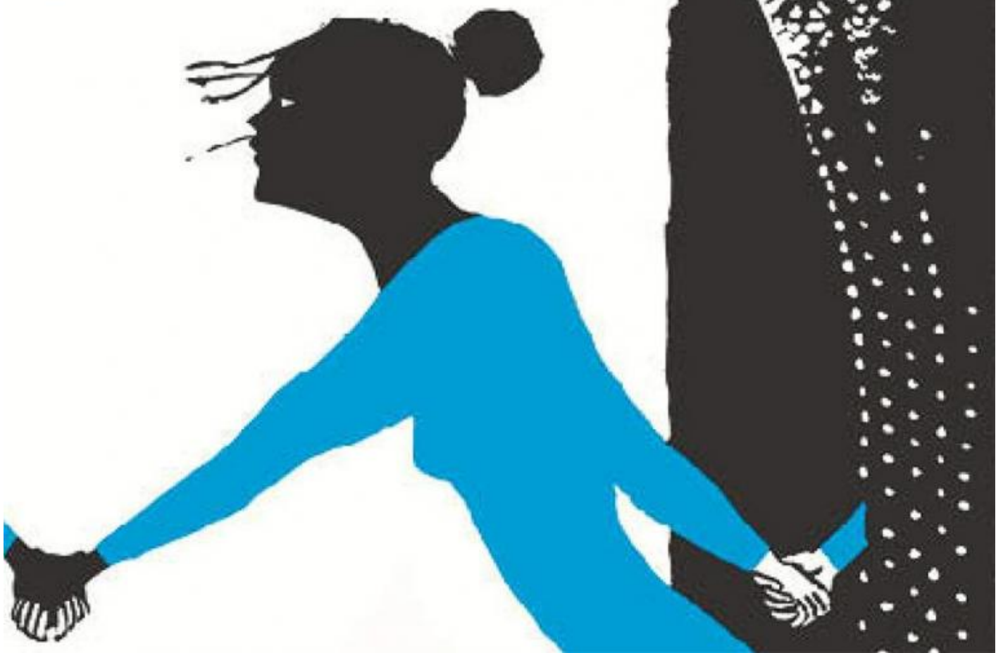
Illustrazione di Arianna Vairo, da Silvia Vecchini, In mezzo alla fiaba, Topipittori 2105.