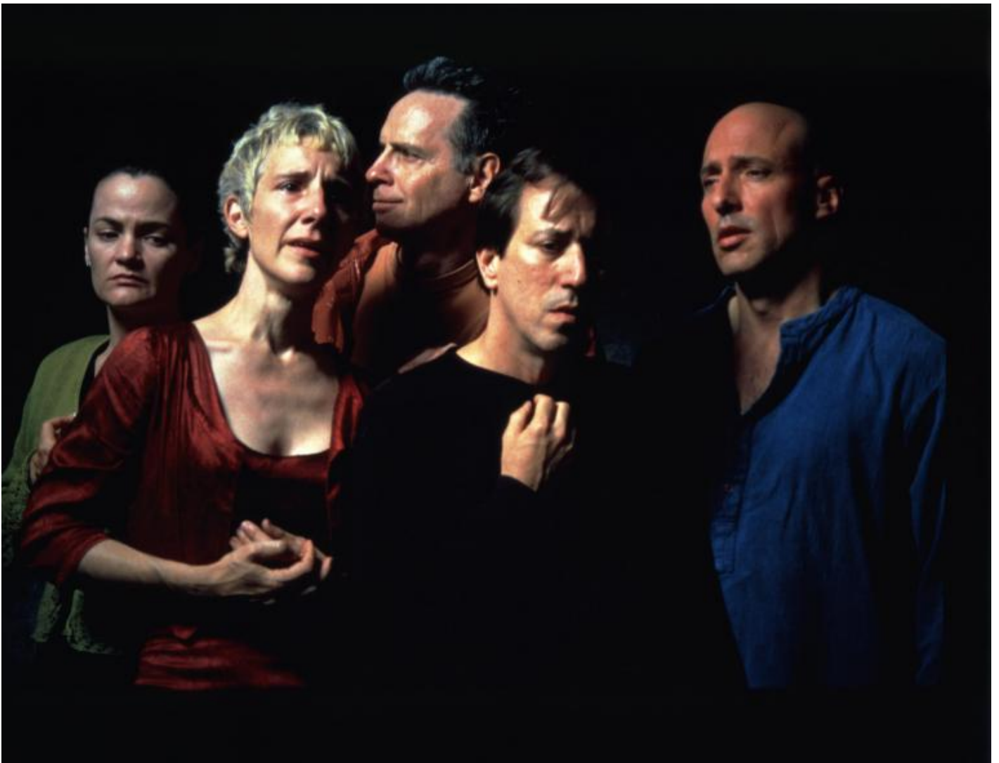
Bill Viola, The Quintet of the Astonished

Quello di Bill Viola, dalle opere degli anni '90 all'interpretazione caravaggesca di The Quintet of the Astonished , è un'espressione originaria dell'infinito contenere e dell'infinita scoperta, mano a mano che l'artista si affida, con una formidabile fusione tra tecnica e poetica, alla creazione di opportunità di estensione dell'esperienza estetica come via per la riappropriazione dell'esperienza tout-court , attraverso la narrazione del tempo esteso, che non è né la fissità di un quadro né la fugacità di un film, ma la simultaneità del tempo.