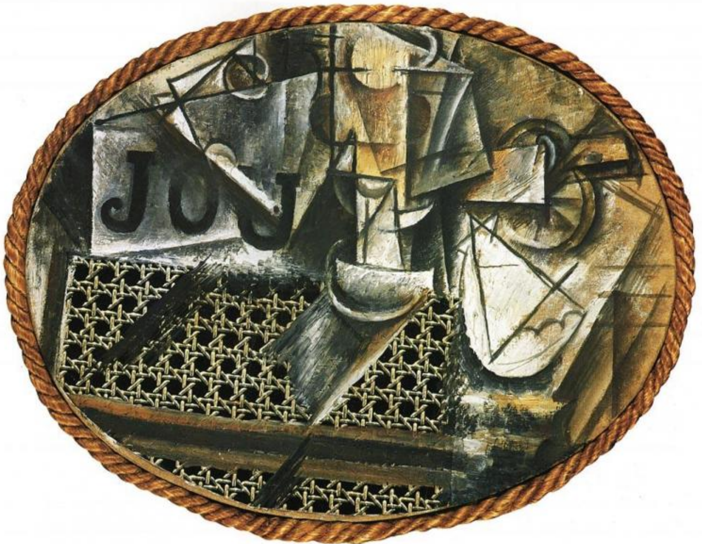
Pablo Picasso, Nature morte à la chaise cannée, 1912.

Sarebbe stato scontato attendersi come punto di partenza di un simile percorso la figura di Marcel Duchamp, la cui invenzione maggiore, il ready-made (il più famoso dei quali, l'orinatoio di porcellana ribattezzato Fountain , ha appena compiuto cento anni: doppiopzero gli dedica lo speciale Duchamp 100 ), è all'origine della radicale trasformazione del campo artistico a partire dagli anni cinquanta dello scorso secolo. Invenzione grazie alla quale un'opera può fare a meno di ogni apporto manuale da parte dell'artista e condensarsi in un atto di natura mentale – nel puro enunciato “questo è arte” –, aprendo una nuova, illimitata prospettiva di riconfigurazione estetica dell'esperienza quotidiana. È invece con Pablo Picasso che Guercio decide di misurarsi, il Picasso sfacciatamente eclettico, smodato nel suo inventare e reinventare stili, complice della propria trasformazione in figura di culto – l'Artista geniale – ad uso dell'immaginario mediatico, in apparenza disponibile a ogni sorta di travestimento, esibizione o autoparodia, ma anche tenacemente dedito a inseguire il prodigio di una creazione assoluta, che si misura alla pari con la creatività generica ma è qualitativamente differente da essa.