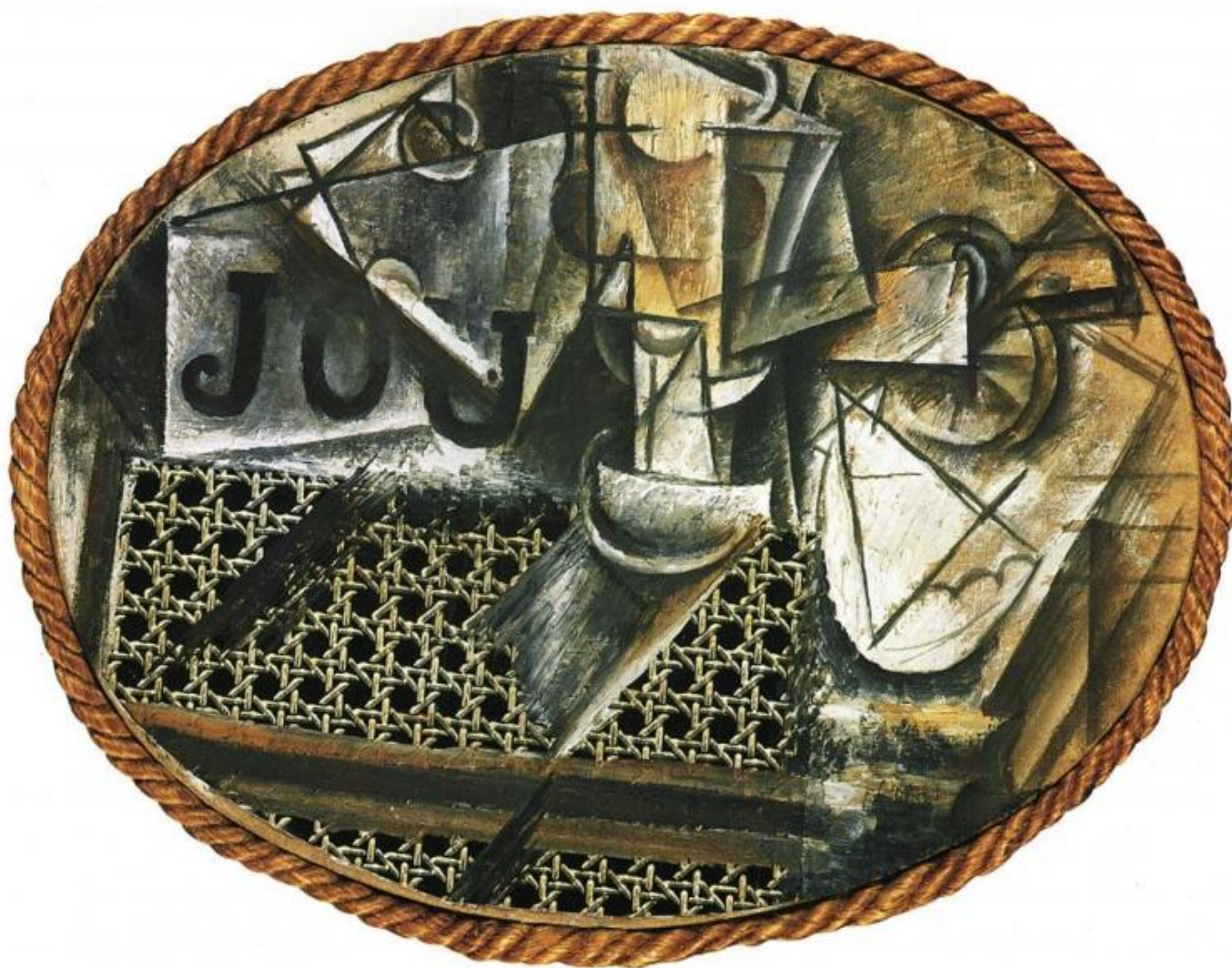
Pablo Picasso, Nature morte à la chaise cannée, 1912.

Sarebbe stato scontato attendersi come punto di partenza di un simile percorso la figura di Marcel Duchamp, la cui invenzione maggiore, il ready-made (il più famoso dei quali, l'orinatoio di porcellana ribattezzato Fountain , ha appena compiuto cento anni: doppiopzero gli dedica lo speciale Duchamp 100 ), è all'origine della radicale trasformazione del campo artistico a partire dagli anni cinquanta dello scorso secolo. Invenzione grazie alla quale un'opera può fare a meno di ogni apporto manuale da parte dell'artista e condensarsi in un atto di natura mentale – nel puro enunciato “questo è arte” –, aprendo una nuova, illimitata prospettiva di riconfigurazione estetica dell'esperienza quotidiana. È invece con Pablo Picasso che Guercio decide di misurarsi, il Picasso sfacciatamente eclettico, smodato nel suo inventare e reinventare stili, complice della propria trasformazione in figura di culto – l'Artista geniale – ad uso dell'immaginario mediatico, in apparenza disponibile a ogni sorta di travestimento, esibizione o autoparodia, ma anche tenacemente dedito a inseguire il prodigio di una creazione assoluta, che si misura alla pari con la creatività generica ma è qualitativamente differente da essa.