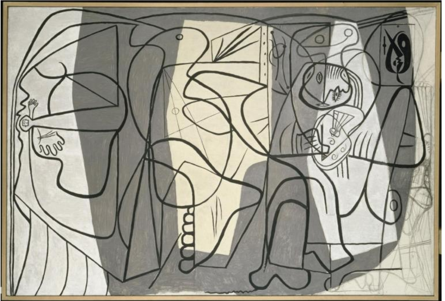
Pablo Picasso, Le peintre et son modèle, 1926.

di attingere oltre, o sotto , l'attività consapevole. Ciò che nasce, che viene contemplato da artista e modella – e si riflette dapprima nello sguardo dell'artista-spettatore che abbraccia dall'esterno, facendola apparire, tutta la scena e alla fine in quello di tutti noi –, è invece una “certa quantità di non essere”, qualcosa che sfugge, che si sospende nel quadro. Qualcosa che esiste sul confine tra rappresentato e rappresentazione, ma partecipa di un'origine esterna, il corpo naturale della modella, vicinissimo e insieme già inafferrabile, perché già metamorfosato sulla superficie pittorica. Nella scena primaria dell'atelier l'introspezione di Picasso rivela in altre parole la distanza, la separatezza insanabile che si apre tra i corpi e le loro immagini, tra desiderio scopico e carnale, ma al tempo stesso dichiara l'arte come forza in grado di abitare questo iato, di percorrere il regresso infinito che si apre tra individuo e mondo, tra creazione e materia, tra artista e opera.