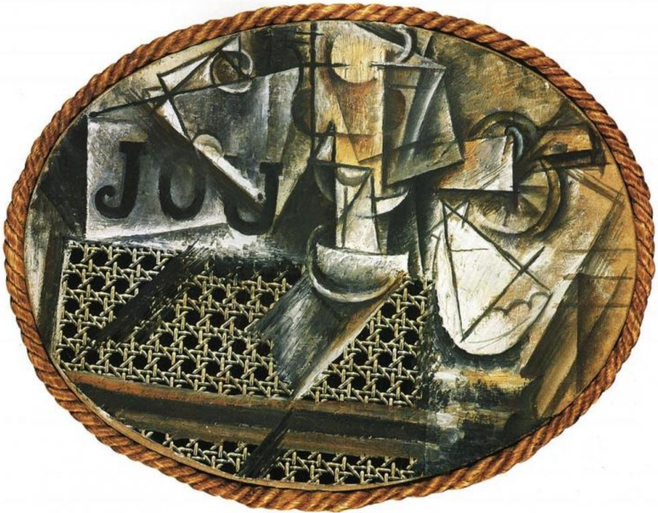
Pablo Picasso, Nature morte à la chaise cannée, 1912.

Nel libro, l'opera di Picasso è analizzata anzitutto in un episodio marginale ma rivelatore, una fotografia del 1913 di un effimero assemblage realizzato nell'atelier al 242 di Boulevard Raspail, in cui i confini tra realtà e finzione, tra "dato" e "creato" sono consapevolmente violati e rimescolati, così da produrre una sorta di perpetua, caotica oscillazione: di fronte a una grande tela o un foglio bianco sul quale è abbozzata una figura umana che sembra reggere una chitarra vera con "braccia" realizzate con ritagli di giornale, compaiono un tavolino, una bottiglia, una pipa, ecc. anch'essi veri . In questa precoce "installazione", che dal piano pittorico si espande nello spazio reale, sembra così dichiararsi una vera e propria impossibilità di stabilire un netto confine tra segni e cose, tra spazio reale e spazio della rappresentazione. Come pure accade nei collage cubisti dello stesso periodo -"macchine per vedere", come le chiamò Jean Paulhan-, nella fotografia si afferma l'impossibilità di stabilire a priori una differenza tra dimensione artistica e non artistica. C'è però in tutto questo, scrive Guercio, un