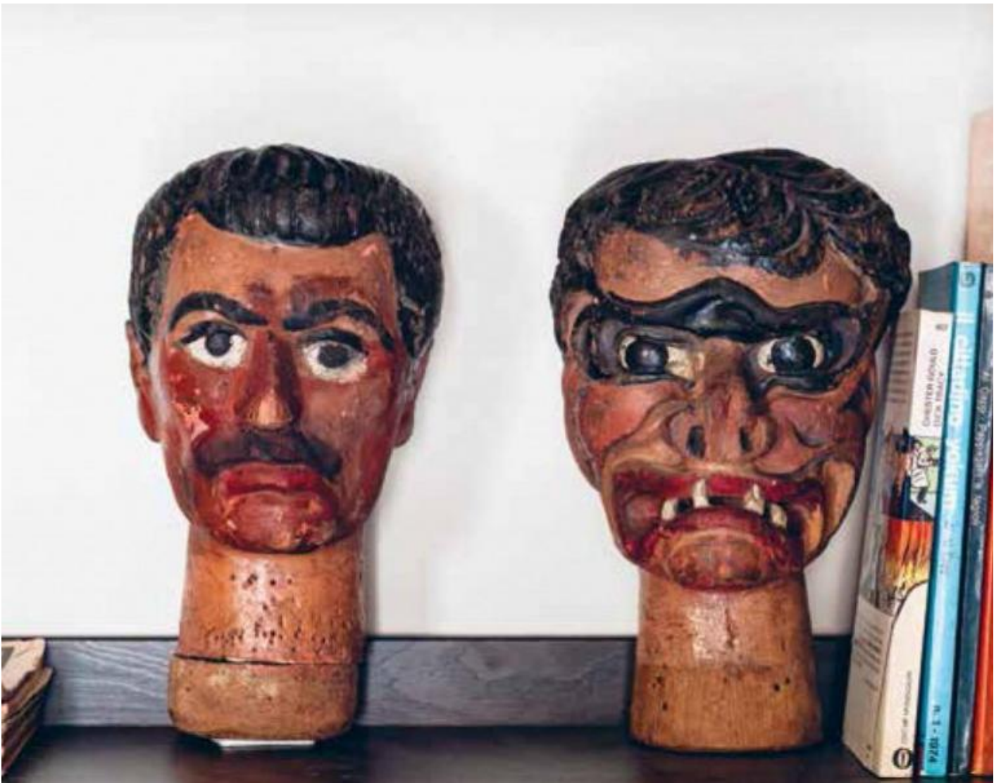
Asterusher , I due signori.

L'immagine sta in copertina alla splendida autoantologia d'autore impaginata da Mari assieme alle immagini del fotografo Francesco Pernigo e pubblicata due anni fa, nei sempre suggestivi tipi di Corraini, col titolo Asterusher. Autobiografia per feticci . Asterusher è un titolo doppio, la crasi di due universi narrativi sotto molti punti di vista remoti – quello del Poe del Crollo della casa di Usher e quello del Borges della Casa di Asterione – ma congiunti, appunto, dall'elemento comune della casa. La casa come emblema, come impresa araldica, la «casa-libro». La stessa che la fa da protagonista nell'altro bellissimo libro d'artista (pubblicato da un'altra eccellenza dell'editoria italiana, la Humboldt Books), Sogni , che associa una serie di oneirogrammi di Mari («oniroschediasmi», anzi, come lui preferisce definirli), risalenti agli anni Novanta, alle “case” d'invenzione sognate da Gianfranco Baruchello. Sintomaticamente, per Mari da sempre ossessionato dal tema del doppio (pervasivo sin dal suo romanzo d'esordio, Di bestia in bestia , pubblicato nel 1989 da Longanesi e riscritto per Einaudi nel 2013), la Casa di Asterusher è una e bina: la casa di campagna sul Lago Maggiore, a Nasca (toponimo-origine, nome- ómphalos ), come in uno specchio oscuro si giustappone a quella di città, a Milano.