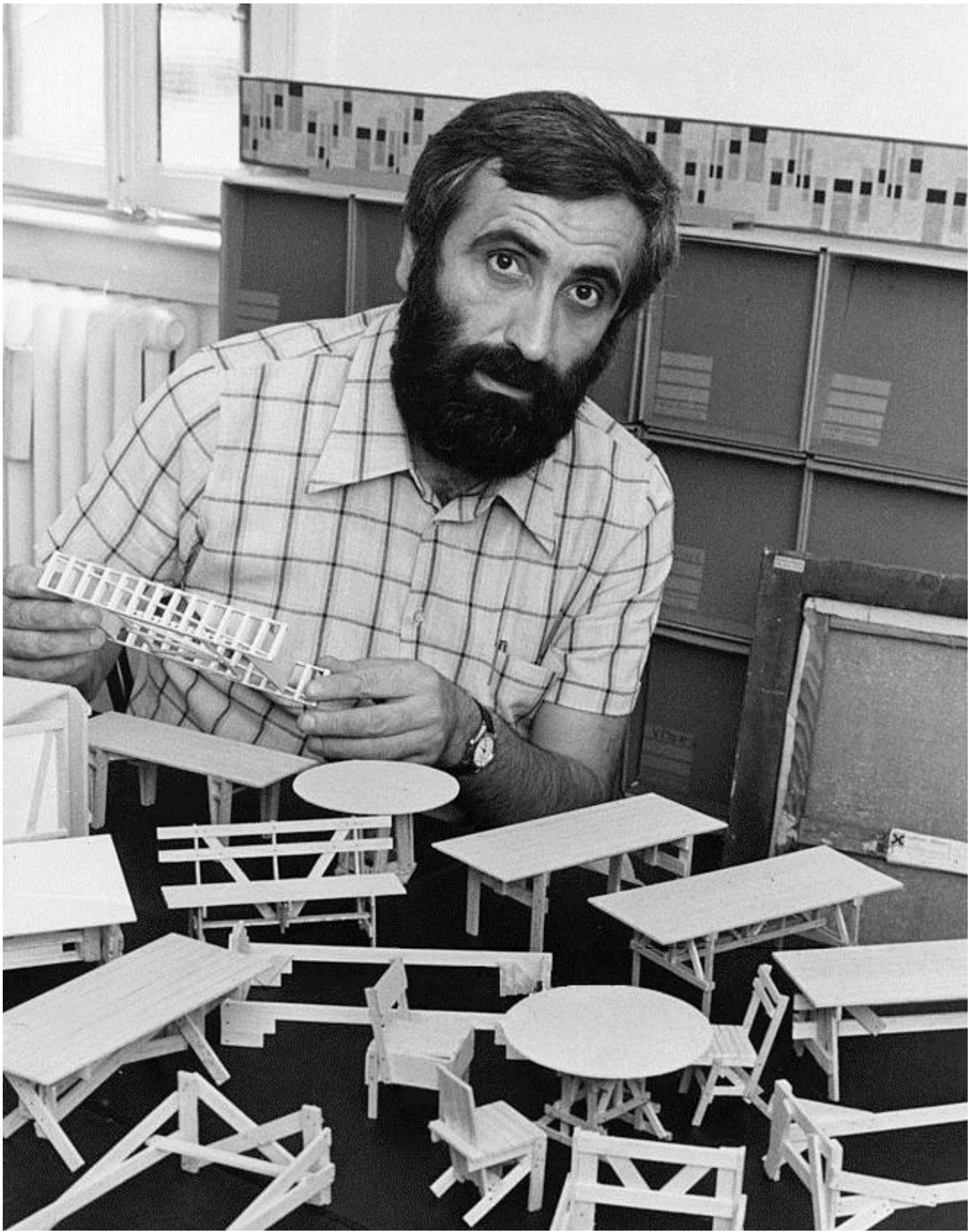
Enzo Mari nel 1974.