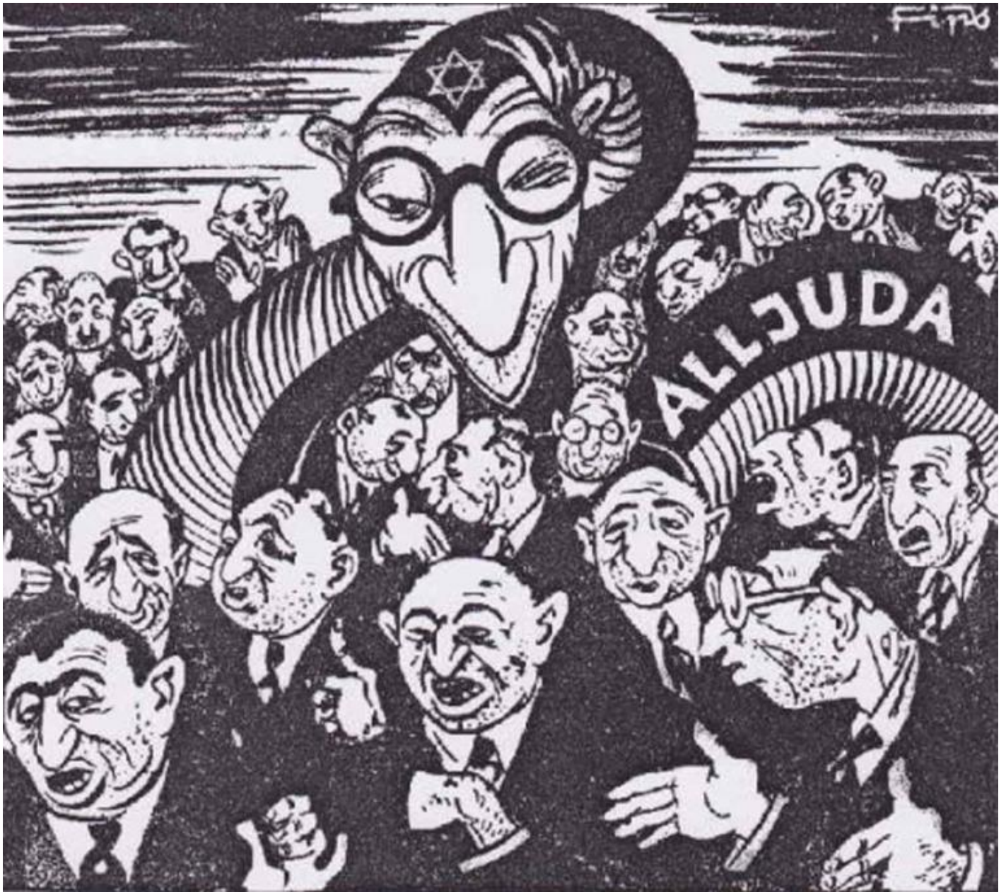
Una copertina antisemita di "Der Stürmer", settimanale nazista, 1934.

ossia di ribaltamenti ideologici, dove il dato comune rimane l'incapacità di cogliere la mutevole morfologia delle nostre società, a favore di un essenzialismo, nel quale gli individui sono incapsulati dentro fittizie appartenenze.