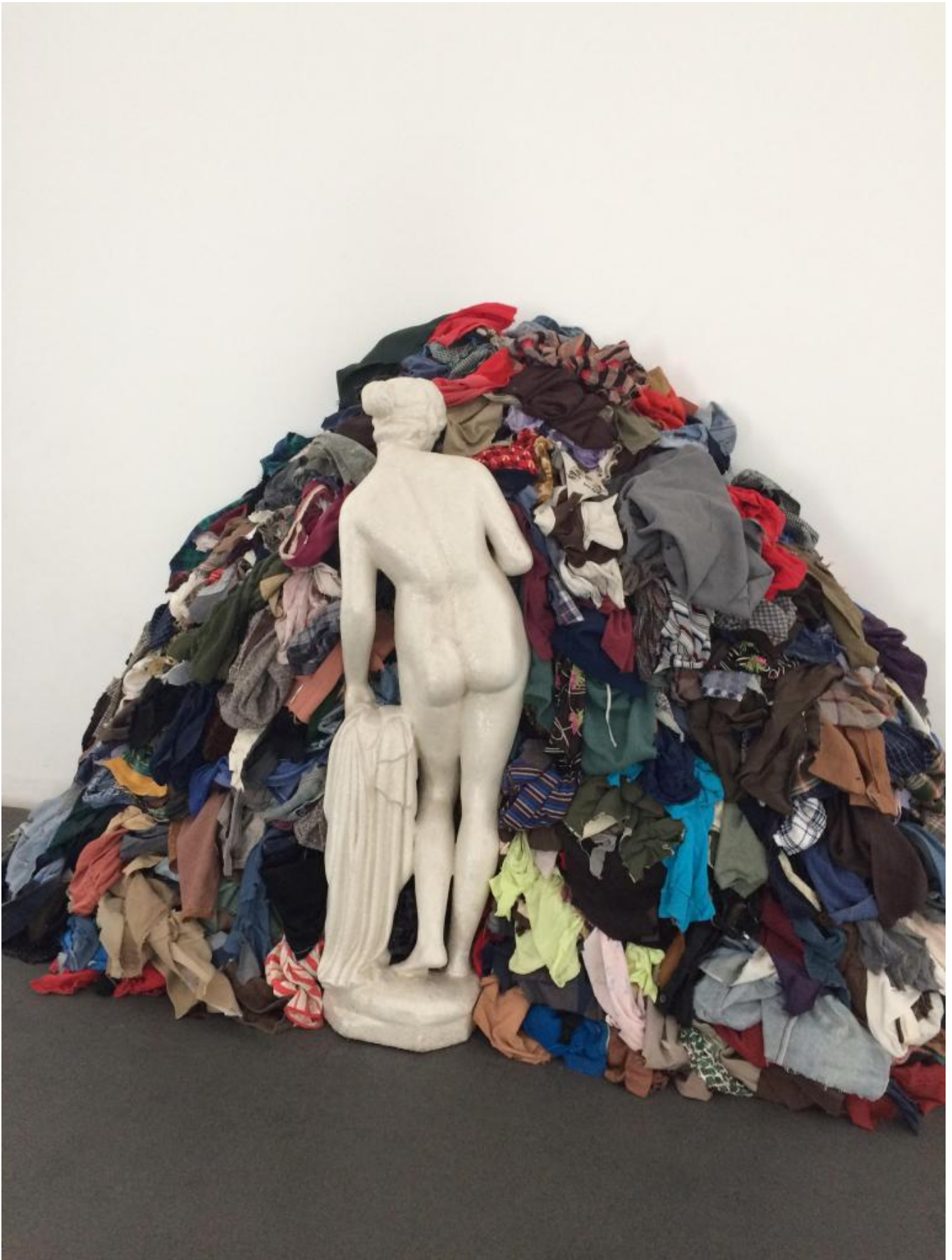
Michelangelo Pistoletto, Venere degli stracci (1967).