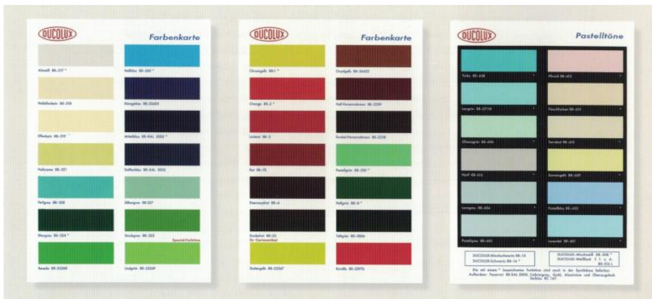
Damien Hirst, Durolux Farbenkarte und Pastelltöne (2015).

In genere però fa parte essenziale del lavoro artistico la ricerca sui pigmenti, sulle mescolanze, sul materiale del supporto, elementi che danno al colore consistenza e capacità, che Michele Cometa chiama «aptiche», quasi tattili. Oppurtunamente i due neuroscienziati Vittorio Gallese e Martina Ardizzi citano nel loro saggio un'osservazione di Maurice Merleau-Ponty a proposito di Cézanne: «noi vediamo la profondità, il vellutato, la morbidezza, la durezza degli oggetti – Cézanne dice perfino: il loro odore» (cit. p. 25).