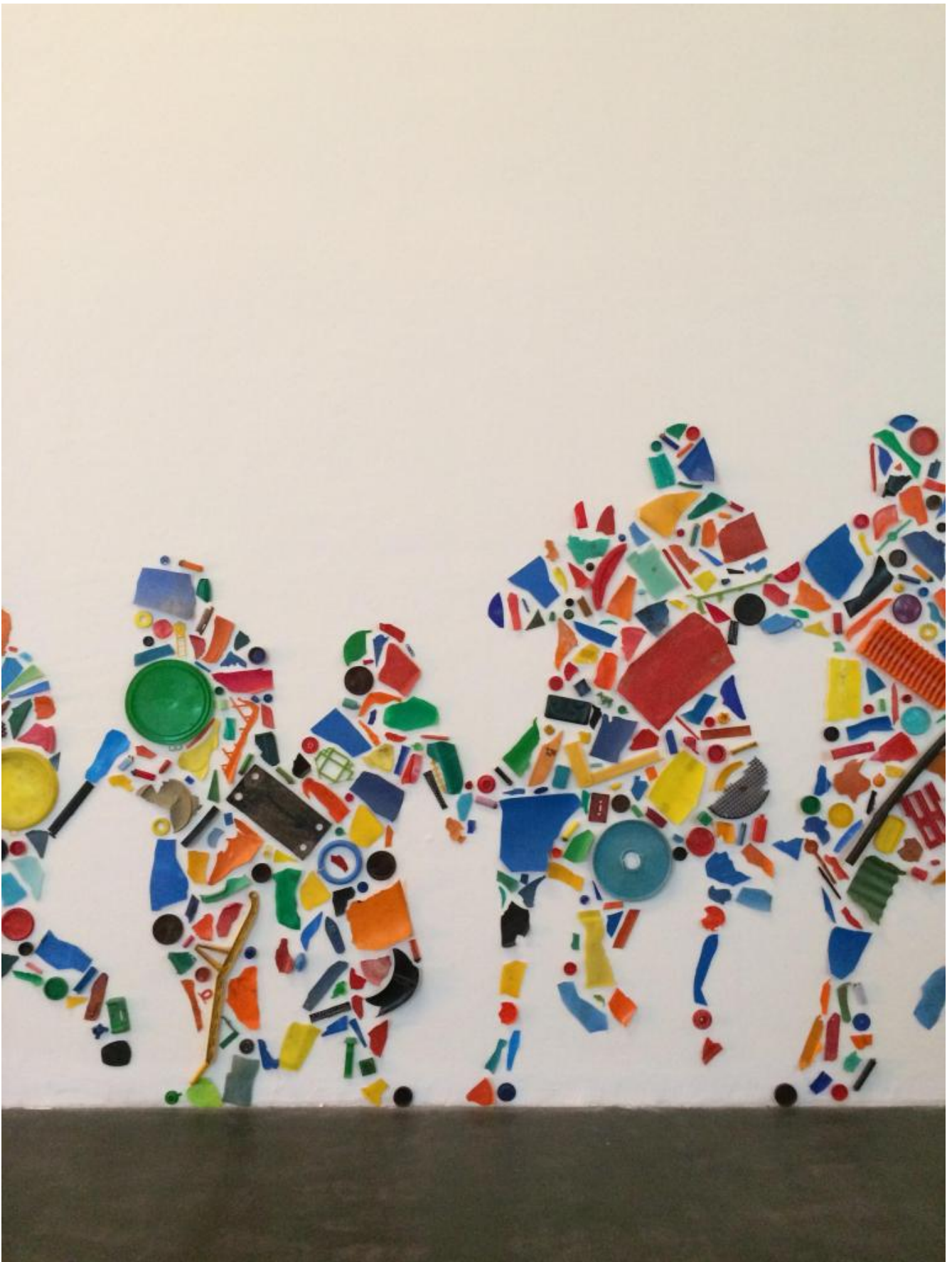
Tony Cragg, Riot (1987).