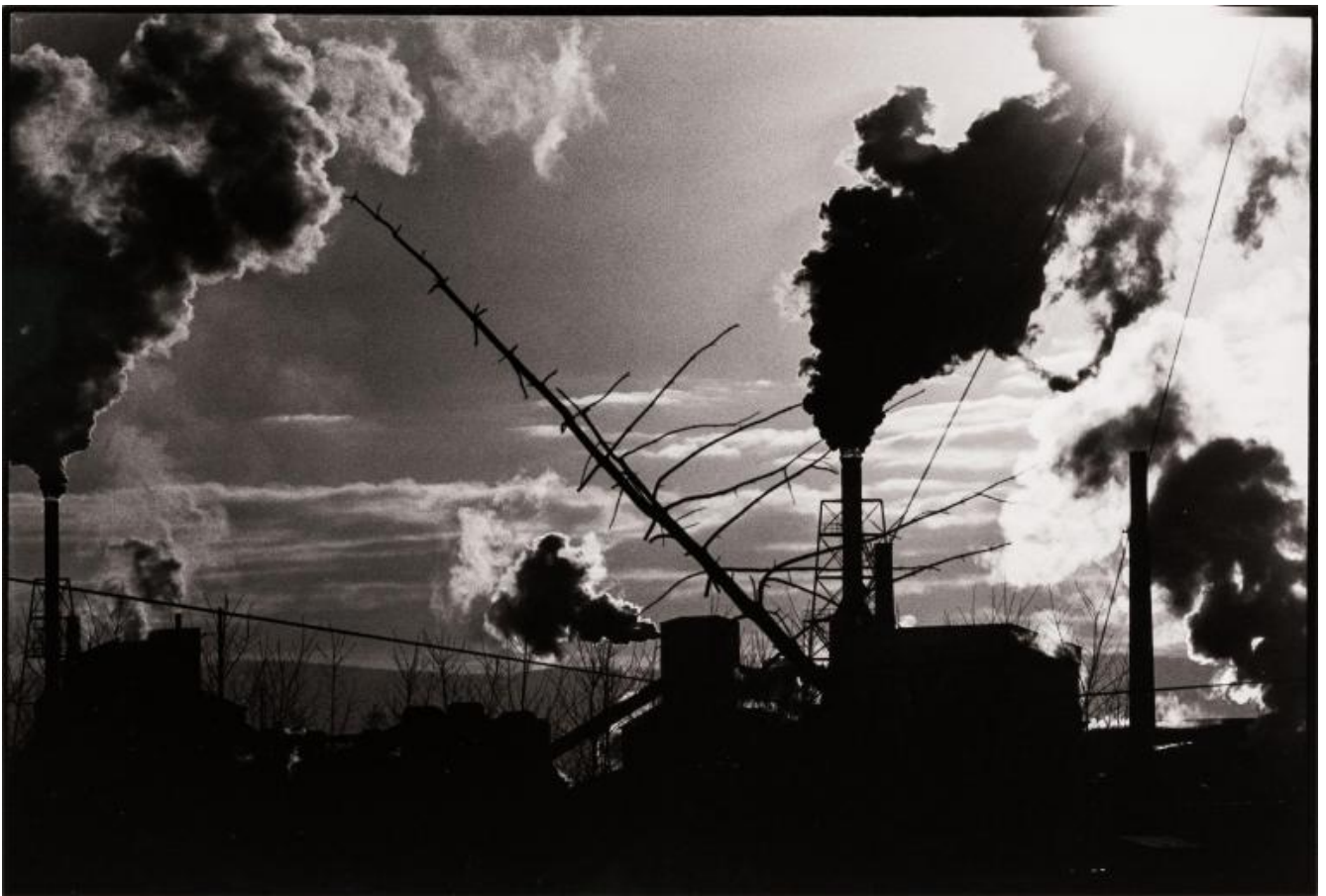
Masahisa Fukase, Nayoro, 1978