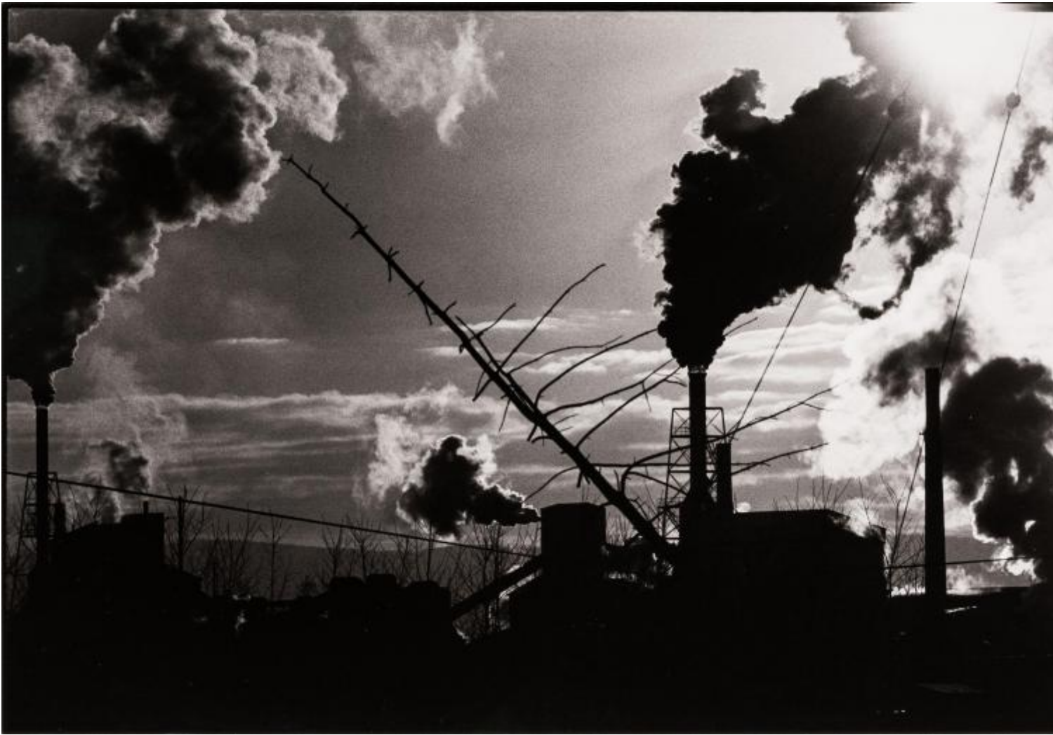
Masahisa Fukase, Nayoro, 1978 © Masahisa Fukase Archives.