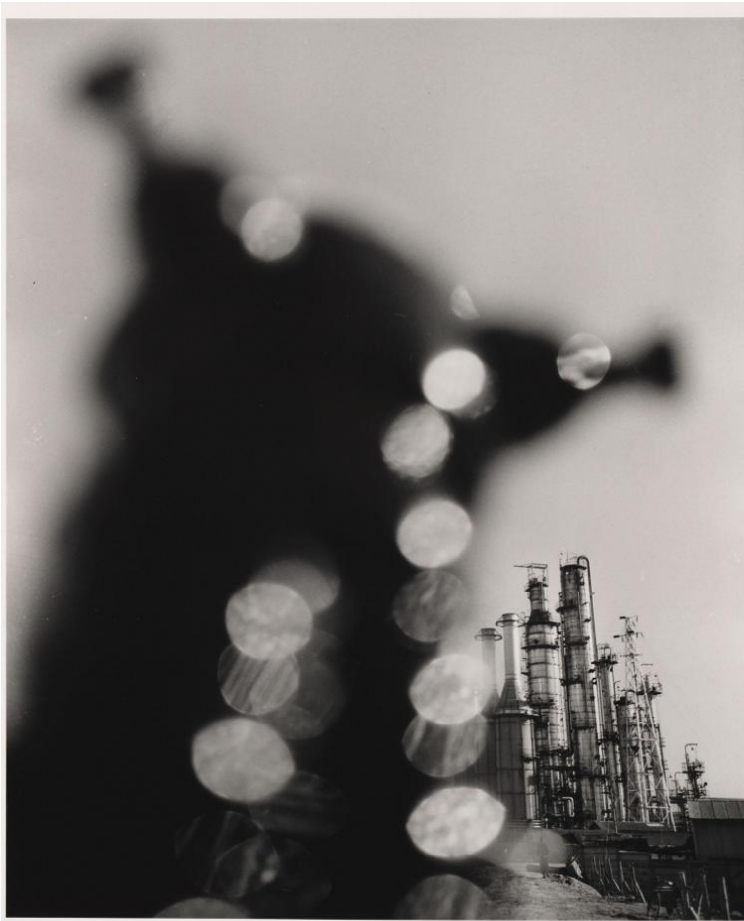
Shomei Tomatsu, Impianto petrolchimico. Yokkaichi, Mie, 1960