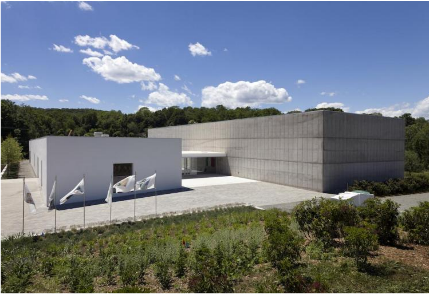
Magazzino Italian Art, Cold Spring, New York. Courtesy Magazzino Italian Art, New York.