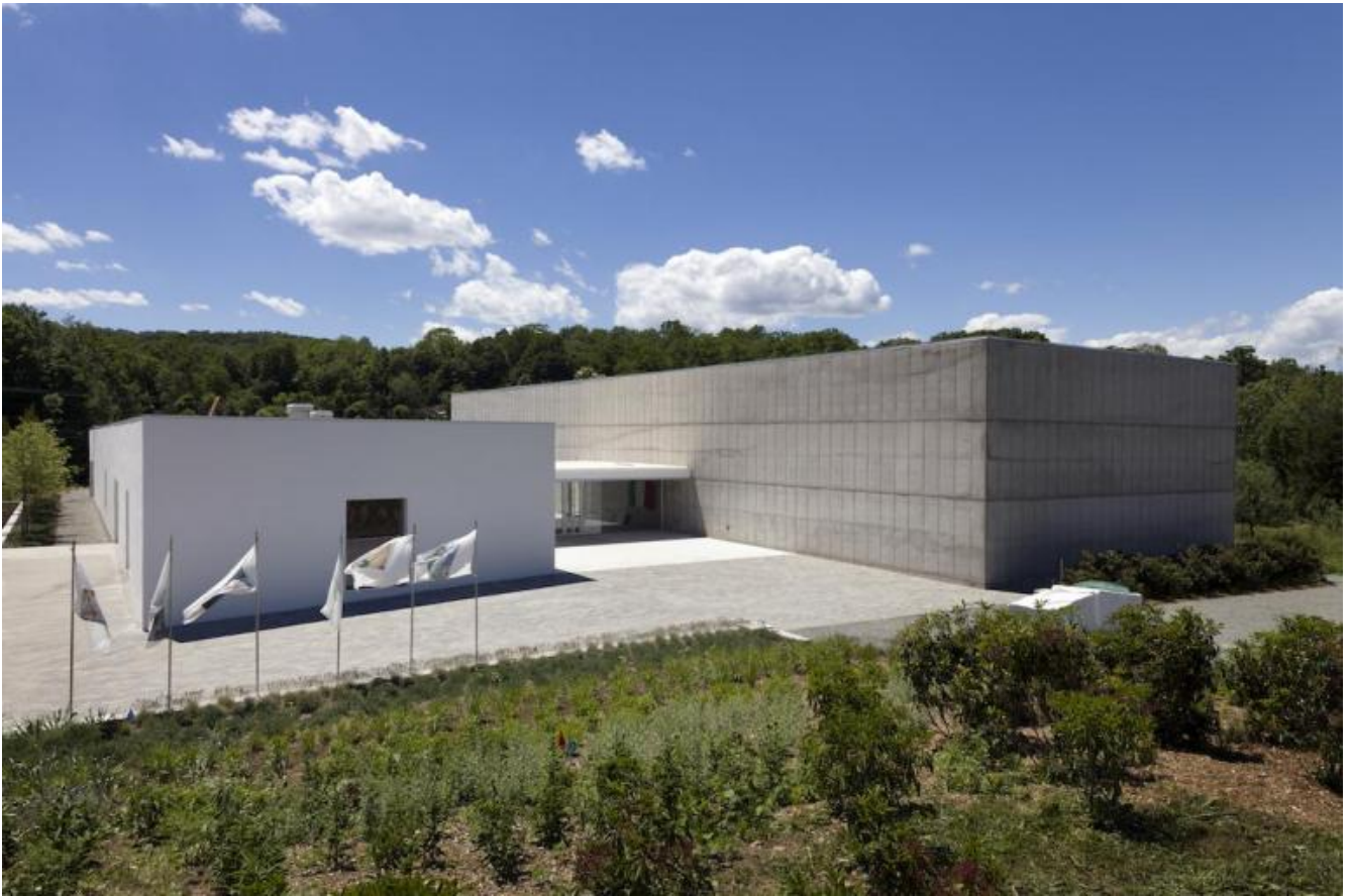
Magazzino Italian Art, Cold Spring, New York.