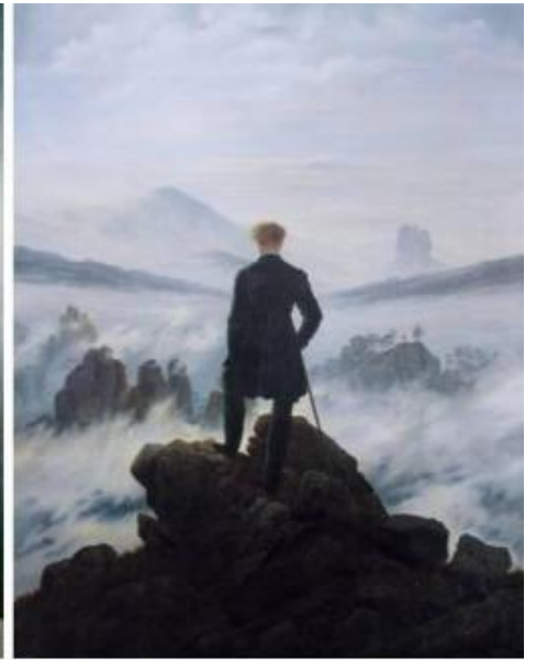
Caspar David Friedrich, Monaco in riva al mare, 1808, Berlino, Altenationalgalerie; Il viandante sul mare di nebbia, 1818, Amburgo, Kunsthalle.

Keplero ritorna nel saggio di Di Napoli, associato ad Apollonio di Perga e al suo famoso trattato sulle Coniche, a proposito della costruzione di molti paesaggi del pittore tedesco che si reggono su “una struttura compositiva basata sui due rami contrapposti della stessa iperbole, uno che delimita la forma del cielo, l’altro quella della terra”. Queste due realtà, contigue ma separate, alludono simbolicamente ai due ambiti della conoscenza umana: la terra, ovvero la prossimità , è riferibile alla conoscenza sensoriale; mentre il cielo, ovvero la lontananza , rimanda invece alle esperienze estetiche e mistiche e quindi a una conoscenza di tipo spirituale. Quest’impiego costruttivo dell’iperbole nei quadri di Friedrich risulta il modo più efficace per tradurre visivamente la sua poetica della “bifocalità”, ovvero della convivenza tra uno sguardo fisico ed uno sovranaturale, facendo convivere nel luogo della sua pittura l’esperienza terrena con quella che la trascende.