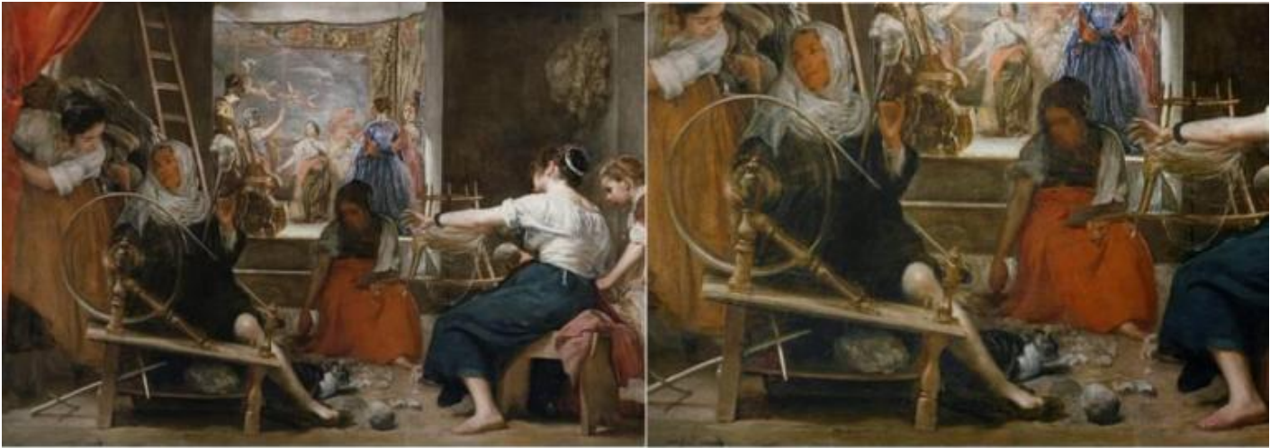
Diego Velázquez, Las hilanderas o il mito di Aracne , 1657, Madrid, Prado; a destra: dettaglio della ruota dell'arcolaio, ritratta in modo che ne suggerisca il movimento rotatorio.

“Eppur si muove”, verrebbe da esclamare; nonostante non si tratti del nostro pianeta, il curioso effetto visivo desta in noi una grande sorpresa, perché siamo perfettamente coscienti che si tratta di un'immagine bidimensionale e dunque giocoforza statica essendo solo una superficie dipinta.