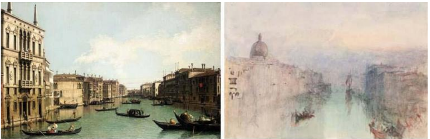
Giovanni Antonio Canal (il Canaletto), Il Canal Grande da Palazzo Balbi, 1728, collezione privata; Joseph Mallord William Turner, Braccio superiore del Canal Grande con san Simeone Piccolo al crepuscolo, 1840, Venezia, Museo Correr

Lo sguardo dall'alto di Tullio Pericoli non fa che confermare che “il vero medium della visione è la distanza: si vede solo ciò che non è contiguo all'occhio”. Questo moderno maestro del paesaggio, nel suo disegnare crittogrammi che svelano le fenditure del suolo o ancora i dorsali collinari, oppure le trame cromatiche generate dal susseguirsi degli appezzamenti dei coltivi, coglie e ci mostra frammenti di infinito nel finito, e nel mentre induce emozioni in chi li guarda, rende omaggio alla bellezza, perché “ L'arte del pittore è l'arte di vedere il bello ” (Gaston Bachelard).