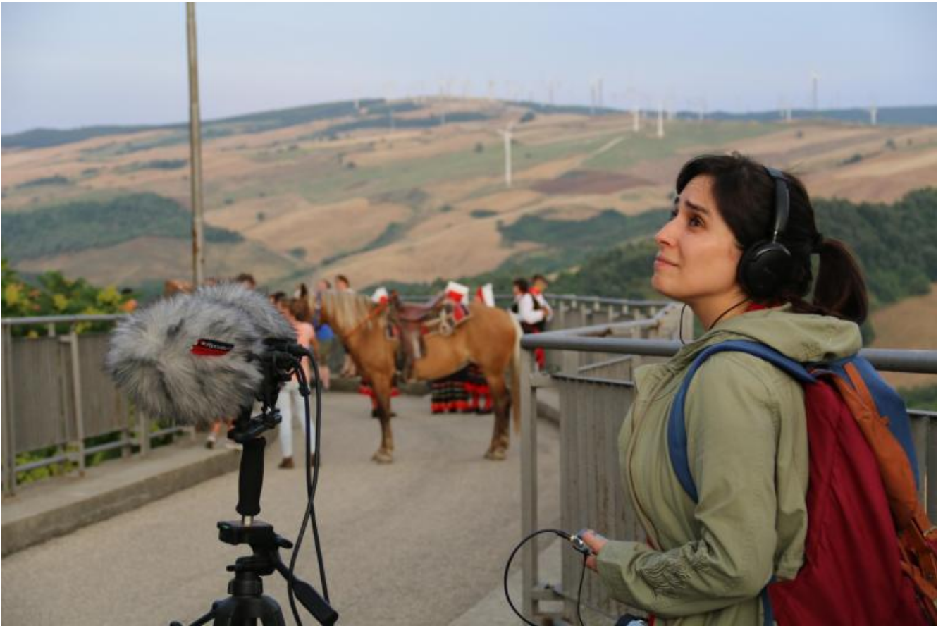
Liminaria 2016.

Nel primo capitolo la pratica dell'ascolto viene esaminata attraverso una attenta discussione delle attuali teorie sul suono: dalla sonic philosophy di Christoph Cox al materialismo sonoro di Luc Döbereiner, dalla prospettiva contestuale e non cocleare dell'ascolto di Seth Kim-Cohen all'approccio (post-)fenomenologico dei Sonic Possible Words di Salomé Voegelin, dal sonic nomad di Budhaditya Chattopadhyay all'acustemologica di Steven Feld riletta da Anja Kanngieser, tale dibattito permette di mettere in discussione l'interpretazione strettamente musicologica delle pratiche estetiche legate al suono producendo nuovi punti di vista/ascolto. In gioco vi sono le possibilità e le modalità di definizione dell'odierna arte sonora, terza arte che, nata nell'interstizio tra musica e arte visiva, non è più né la prima né la seconda, ma un nuovo e specifico campo disciplinare le cui pratiche richiedono urgentemente nuove teorizzazioni.