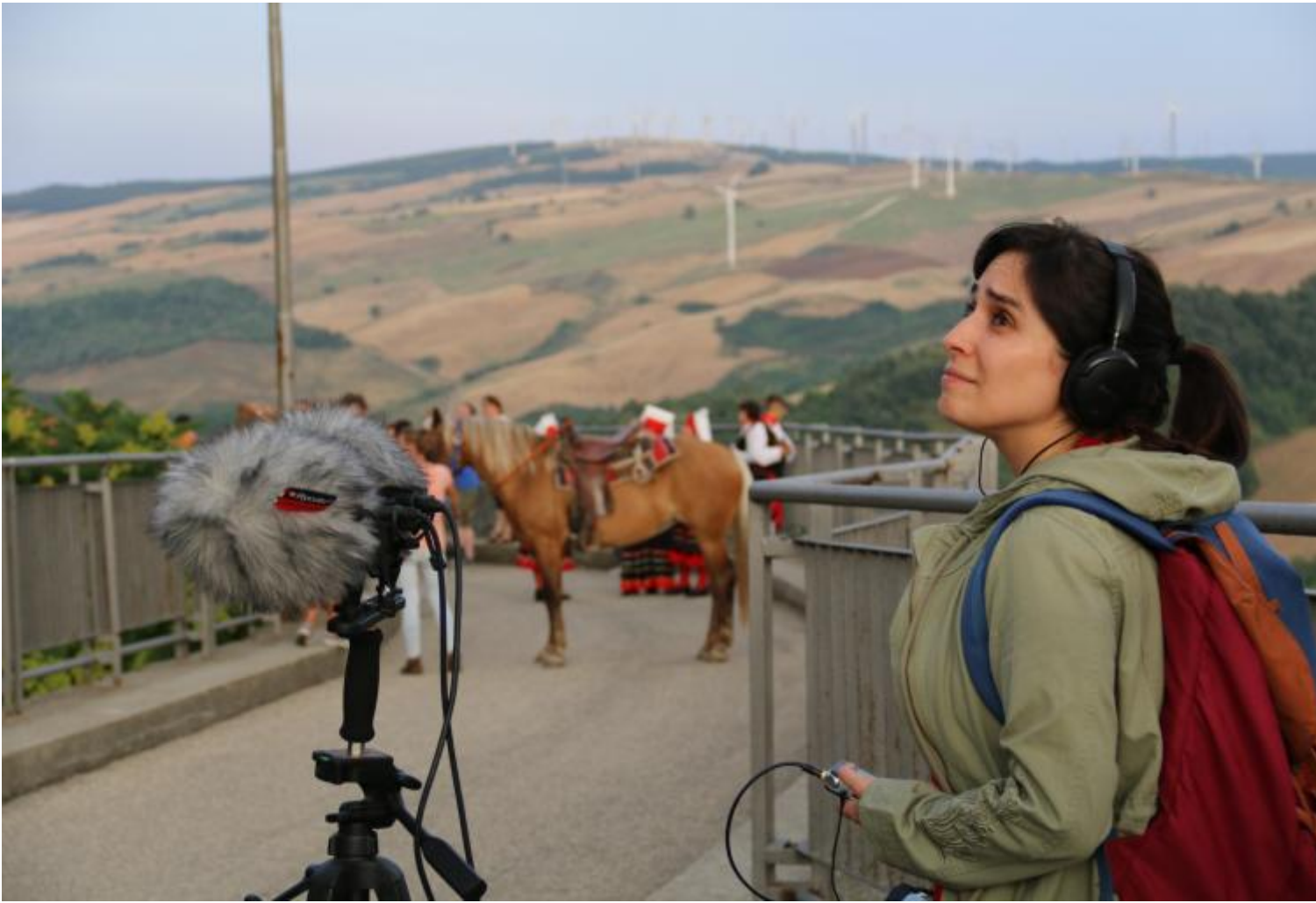
Liminaria 2016, ph Giuseppe Ricci.

Nel primo capitolo la pratica dell'ascolto viene esaminata attraverso una attenta discussione delle attuali teorie sul suono: dalla sonic philosophy di Christoph Cox al materialismo sonoro di Luc Döbereiner, dalla prospettiva contestuale e non cocleare dell'ascolto di Seth Kim-Cohen all'approccio (post-)fenomenologico dei Sonic Possible Words di Salomé Voegelin, dal sonic nomad di Budhaditya Chattopadhyay all'acustemologica di Steven Feld riletta da Anja Kanngieser, tale dibattito permette di mettere in discussione l'interpretazione strettamente musicologica delle pratiche estetiche legate al suono producendo nuovi punti di vista/ascolto. In gioco vi sono le possibilità e le modalità di definizione dell'odierna arte sonora, terza arte che, nata nell'interstizio tra musica e arte visiva, non è più né la prima né la seconda, ma un nuovo e specifico campo disciplinare le cui pratiche richiedono urgentemente nuove teorizzazioni.