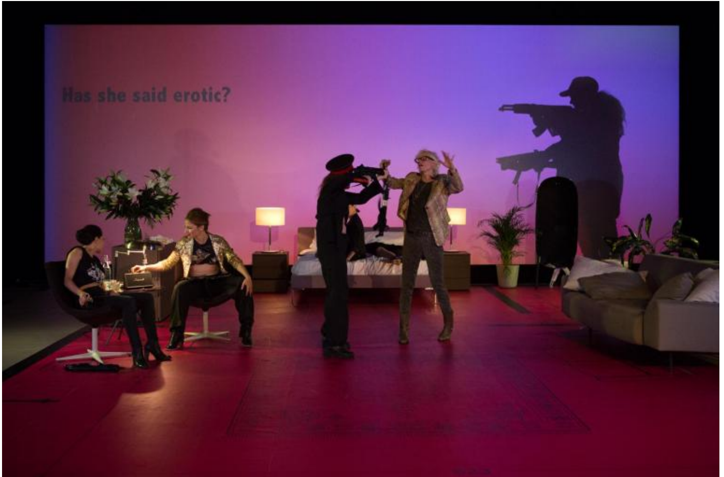
Motus, Über Raffiche, ph. DIANE Ilaria Scarpa, Luca Telleschi

nel violento scarto tra le due figure (talmente antitetice da indurre qualche spettatore a domandarsi se si tratti di una effettiva identità) risiede l'intelligente denuncia di ambigue e scivolose dinamiche di sguardo: lo spettatore si trova inevitabilmente indotto, dopo aver osservato le immagini e i video proposti dell'artista, a ripensare da un'altra prospettiva alla violenza di cui ha sentito parlare nei primi istanti dello spettacolo. E viene così chiamato a riconoscere in se stesso, prima ancora che negli altri, l'attuarsi involontario di schemi di giudizio sessisti ed eteronormativi.