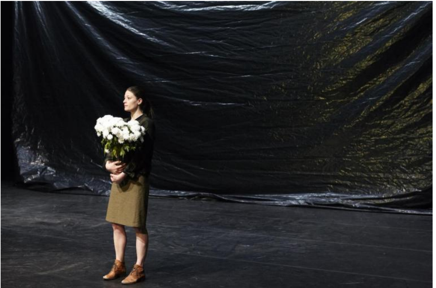
Nathalie Béasse, Le bruit des arbres qui tombent

Nella pièce più recente, Le bruit des arbres qui tombent , siamo in un viaggio nella memoria, nell'infanzia, ancora in relazioni familiari che richiamano certi toni crepuscolari del Giardino dei ciliegi o i paesaggi stratificati di Annie Ernaux, con un retrogusto poetico o poeticistico che può anche far venire alla mente certe atmosfere del Favoloso mondo di Amélie .