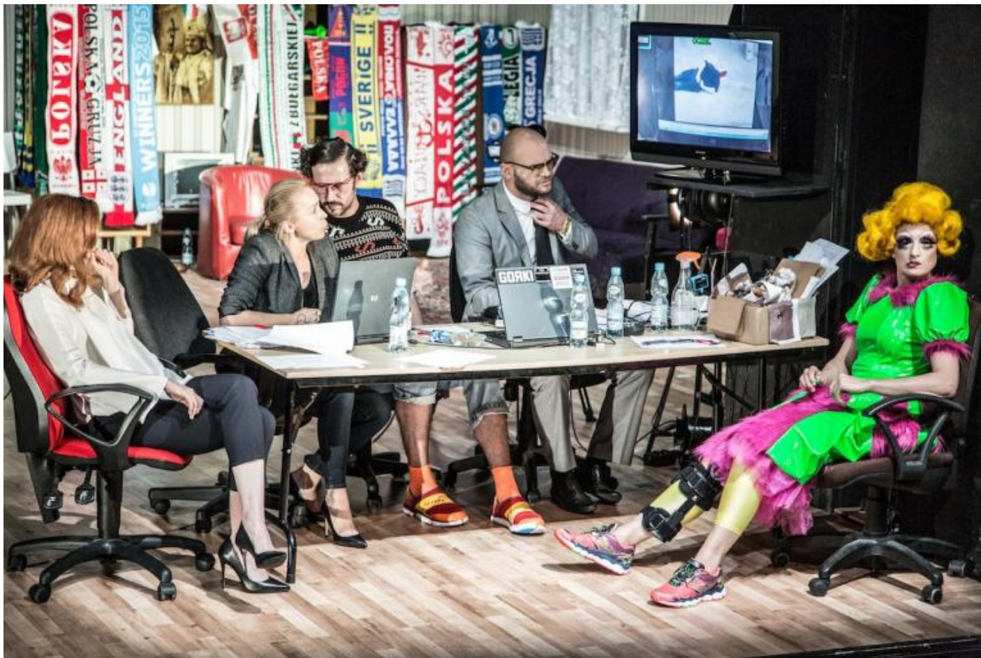
La rabbia di Elfriede Jelinek, regia di Maja Kleczewska

ad Avignone, tutta la saga degli Atridi attraverso opere differenti, con precipitazioni, psicanalitiche e non solo, nelle ansie, nei conflitti dei rapporti familiari di oggi. Condensazione di segni, metonimia e metafora in funzione di un espressionismo esistenziale.