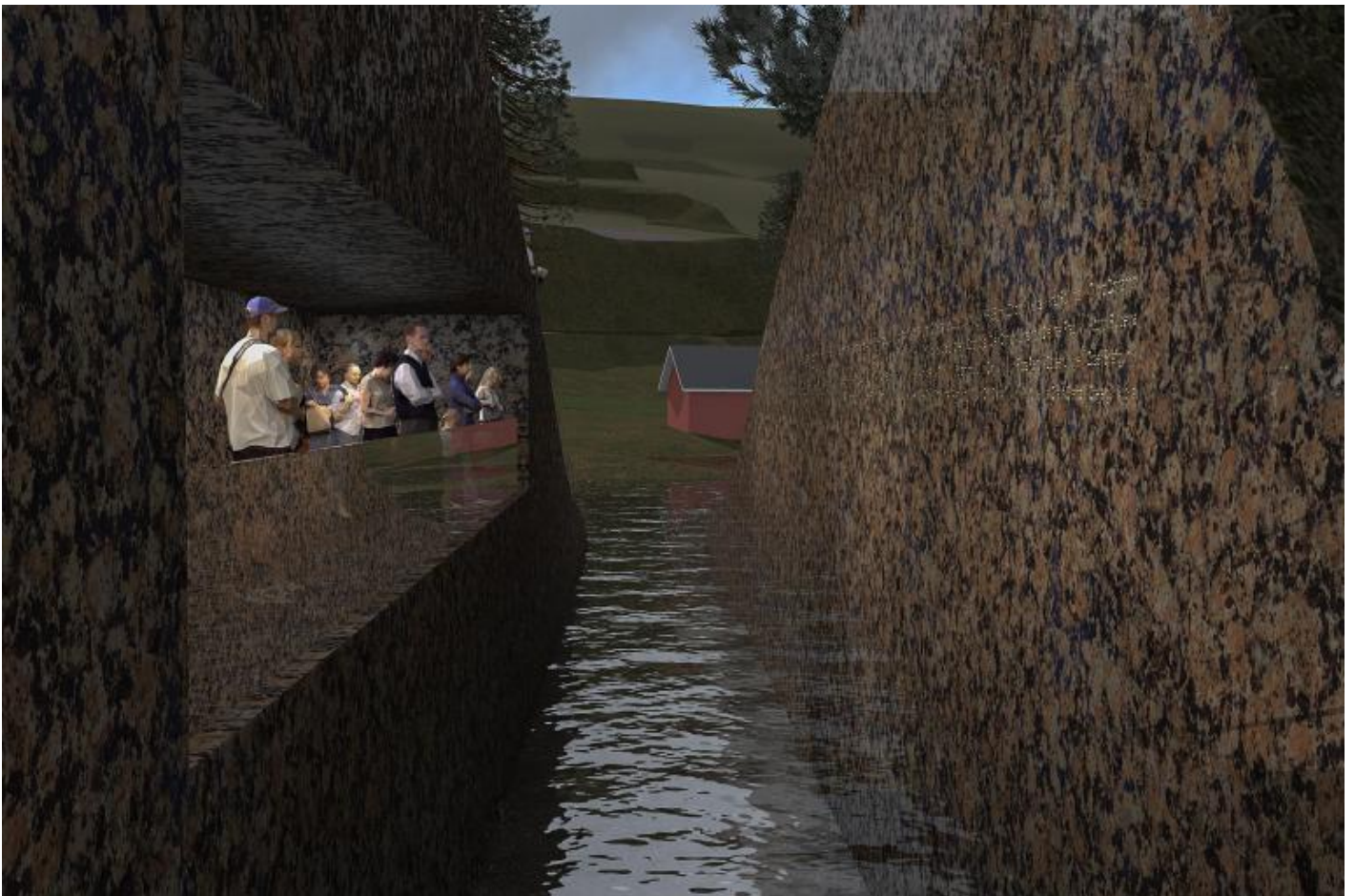
Progetto di Memorial Wound, alla fine del tunnel.