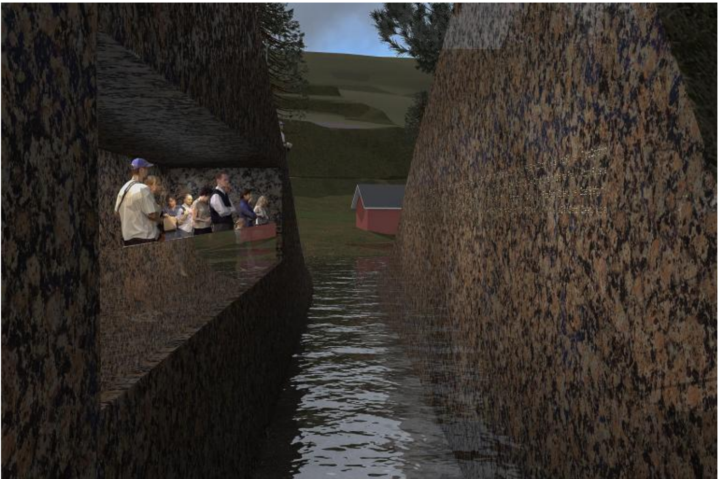
Progetto di Memorial Wound, alla fine del tunnel.