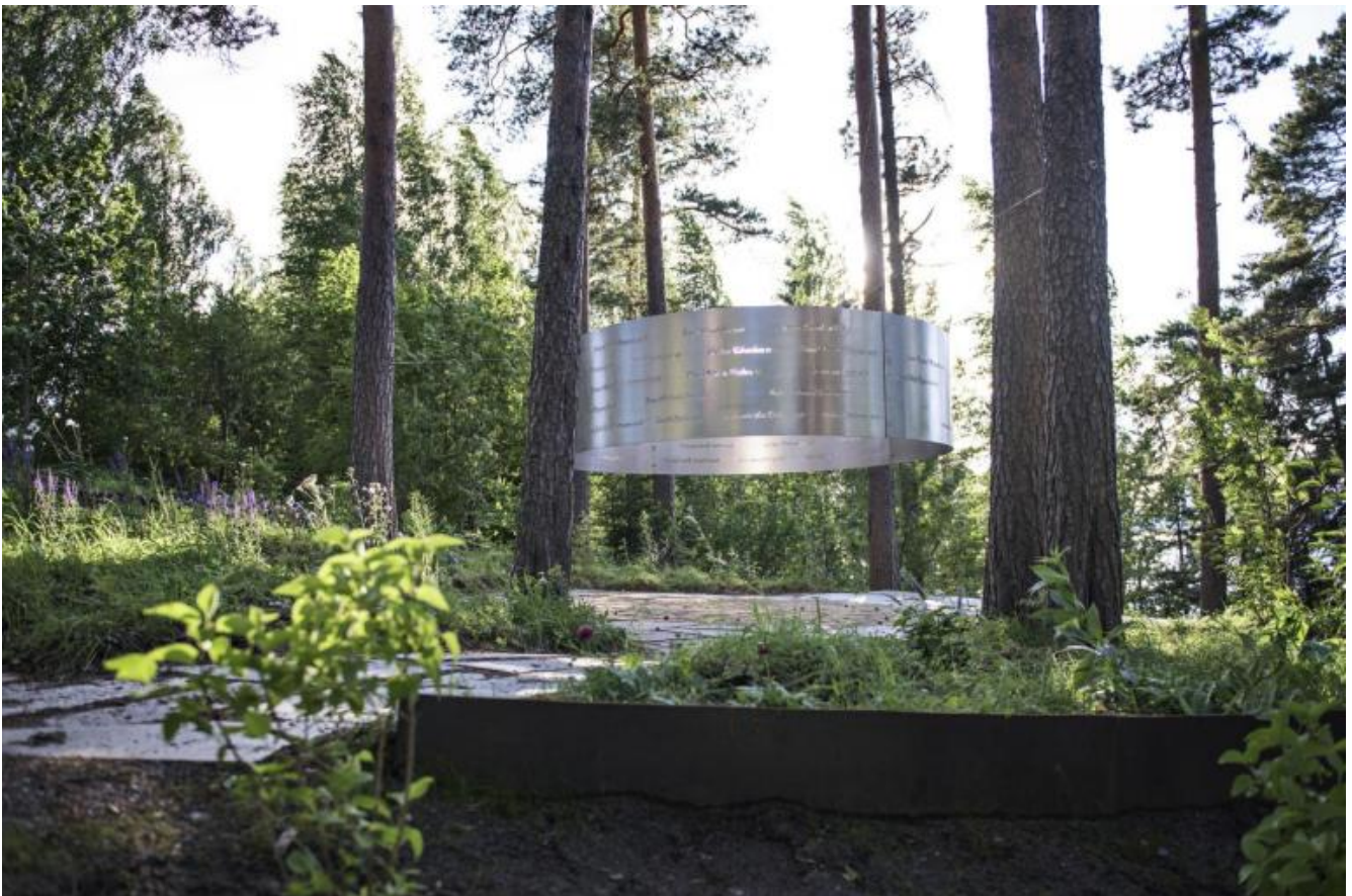
Memoriale sull'isola di Utoya.

Ora, Memory Wound non appartiene propriamente a questa casistica, in quanto pensato non per l'isola di Utøya ma per il promontorio di Sørbråten. Dahlberg si allontana dal sito del trauma, dis-identificando, sebbene con una minima traslazione geografica, spazio ed evento, muovendosi in sostanza, ecco il secondo spostamento, dal sito al luogo . E' il risultato, forse il compromesso, tra due esigenze specifiche: da un parte, non dimenticare quanto è accaduto sull'isola di Utøya, non ricordarsene solo il 22 luglio in occasione dell'anniversario; dall'altra, rispettare la sacrosanta volontà dei locali di continuare a vivere, così come quella dei giovani di riappropriarsi dell'isola senza trasformarla in un cimitero inviolabile.