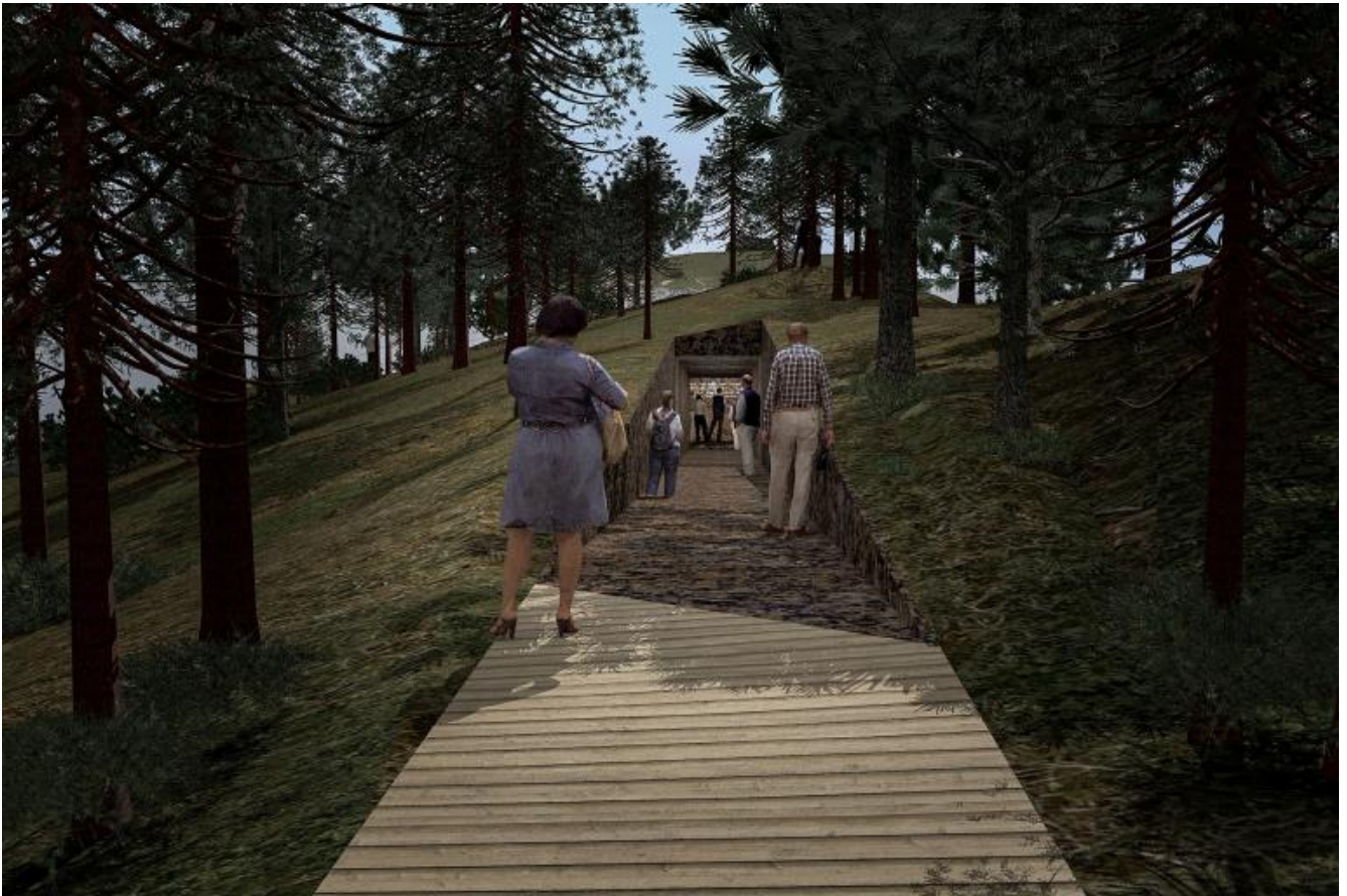
Progetto della passeggiata verso Memory Wound.

La terra divelta - 1000 metri cubi di pietra, alberi e piante - sarà la materia di un secondo memoriale al centro amministrativo di Oslo dove, poco prima della strage sull'isola, un'autobomba innescata da Breivik fece otto vittime. Dahlberg intende incidere, su circa duemila piastrelle nere e in ordine sparso, non solo i nomi delle 77 vittime dell'attacco ma quelle di tutti i cittadini norvegesi registrati all'anagrafe quel fatidico 22 luglio 2011. Si tratta di più di cinque milioni di norvegesi, cinque milioni di testimoni di quanto accaduto. Nella piazza di Oslo manca il nome del terrorista, in accordo e rispetto verso i familiari e gli amici delle vittime.