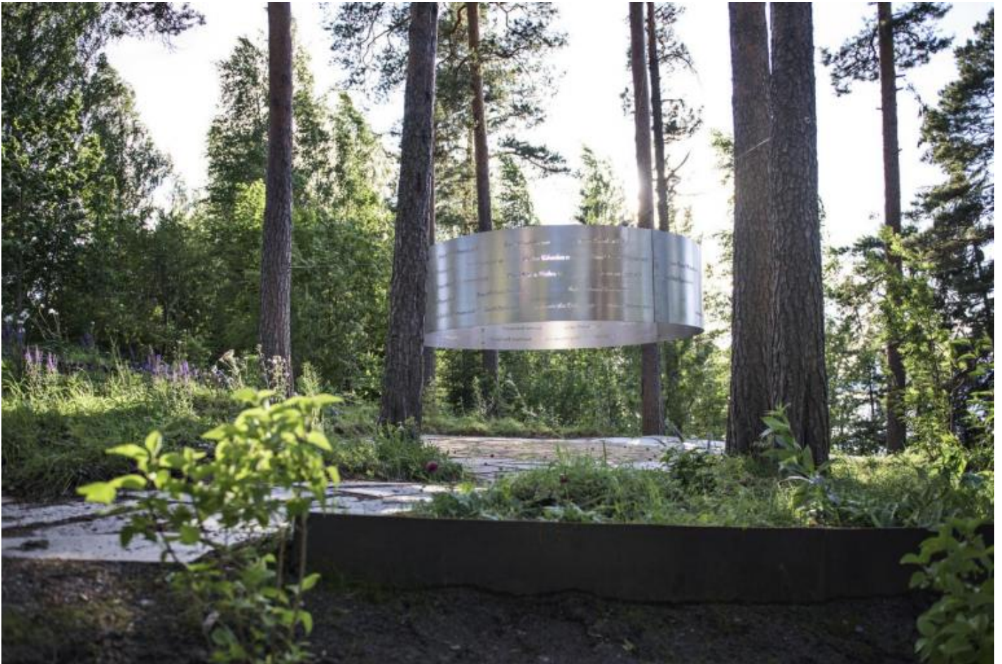
Memoriale sull'isola di Utoya.

Ora, Memory Wound non appartiene propriamente a questa casistica, in quanto pensato non per l’isola di Utøya ma per il promontorio di Sørbråten. Dahlberg si allontana dal sito del trauma, dis-identificando, sebbene con una minima traslazione geografica, spazio ed evento, muovendosi in sostanza, ecco il secondo spostamento, dal sito al luogo . E’ il risultato, forse il compromesso, tra due esigenze specifiche: da un parte, non dimenticare quanto è accaduto sull’isola di Utøya, non ricordarsene solo il 22 luglio in occasione dell’anniversario; dall’altra, rispettare la sacrosanta volontà dei locali di continuare a vivere, così come quella dei giovani di riappropriarsi dell’isola senza trasformarla in un cimitero inviolabile.