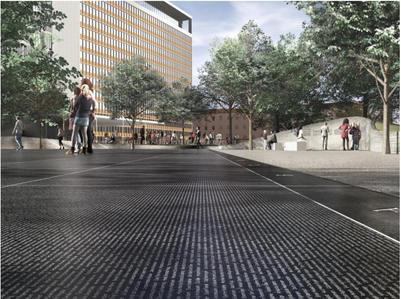
Progetto del Memorial di Oslo.

Il memoriale è insomma un forum indirizzato e dedicato non solo a chi ha perso la vita ma all'insieme della comunità e alle loro responsabilità nel processo testimoniale e memoriale. I nomi delle vittime sono resi riconoscibili da uno spazio vuoto che li incornicia, considerato poeticamente come una nuvola, un cuscinetto d'aria o un respiro che si fa materia. "Riconoscere il vostro nome inciso sulla pietra vuol dire diventare consapevoli che esistevi il 22 luglio 2011; il fatto che sei in grado di recarti qui e di cercare adesso il tuo nome, attesta che sei ancora in vita".