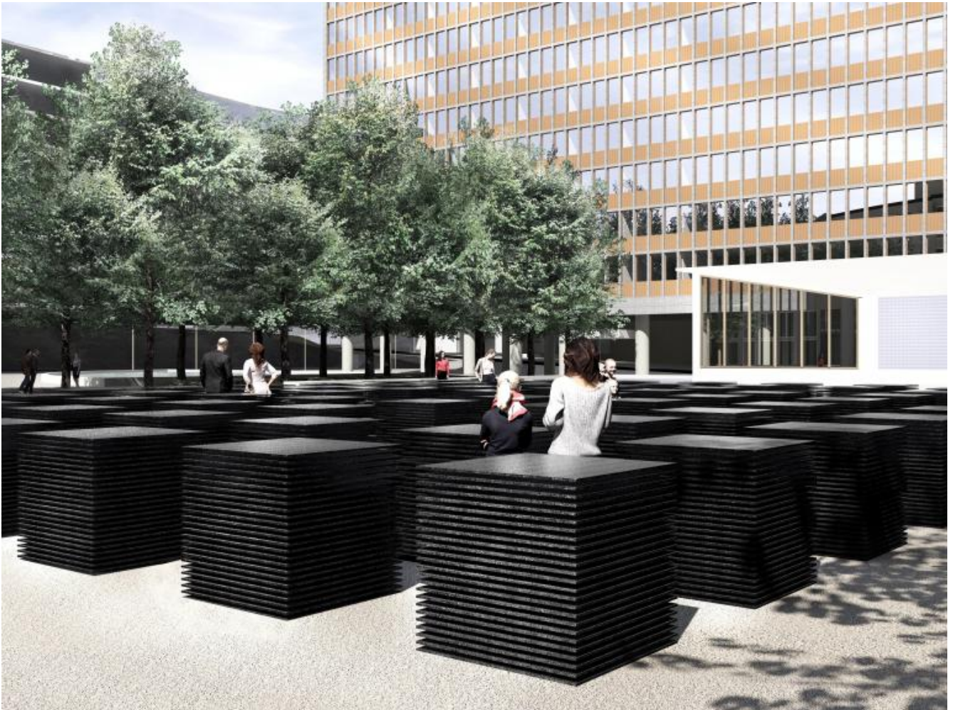
Progetto del Memorial di Oslo.