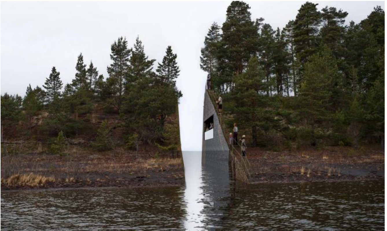
Progetto del Memory Wound.

Ergere un muro forse? o, al contrario, renderlo così discreto da lasciarlo inabissarsi nel terreno? Un memoriale in negativo, in cui del muro non resta che una cavità. Alla commissione Dahlberg finisce per sottoporre un progetto insolito: tagliare, dall'estremità della penisola Sørbråten, una fetta di terra lunga quaranta metri e larga tre, un'area di circa 4000 metri quadrati. Per arrivarci immagina un percorso - forse un tentativo di narrativizzare la memoria traumatica - che, dal parcheggio, attraversa il bosco con curve dolcemente sinuose, fino a un tunnel che si arresta bruscamente sul taglio. I nomi delle vittime sono incisi sull'altro lato del promontorio, visibili e leggibili da chi si è spinto fin qui ma per sempre irraggiungibili. Un senso di impotenza che inscena, spazializza l'esperienza della perdita.