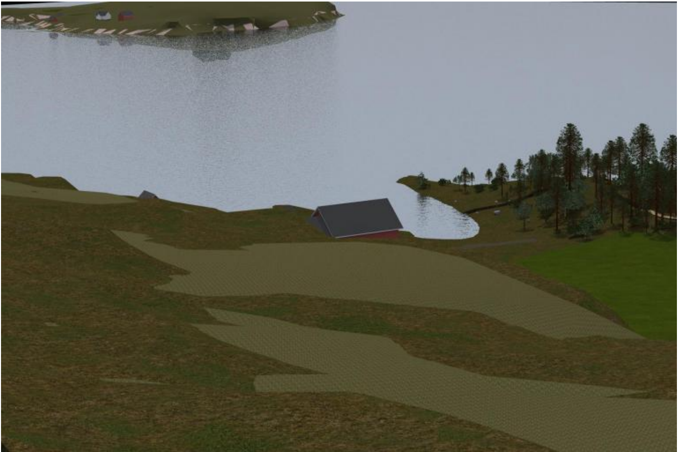
Sorbraten dall'alto, progetto.

Collassando passato e presente, il coinvolgimento psico-fisico sarà totale, al punto che non si sarà più “davanti al dolore degli altri” (Susan Sontag) ma “dentro”. Una mimesi patemica volta alla produzione della memoria del trauma, a restituire il passato nella sua vivida autenticità. Questo il senso del progetto di Dahlberg nella sua portata più radicale.