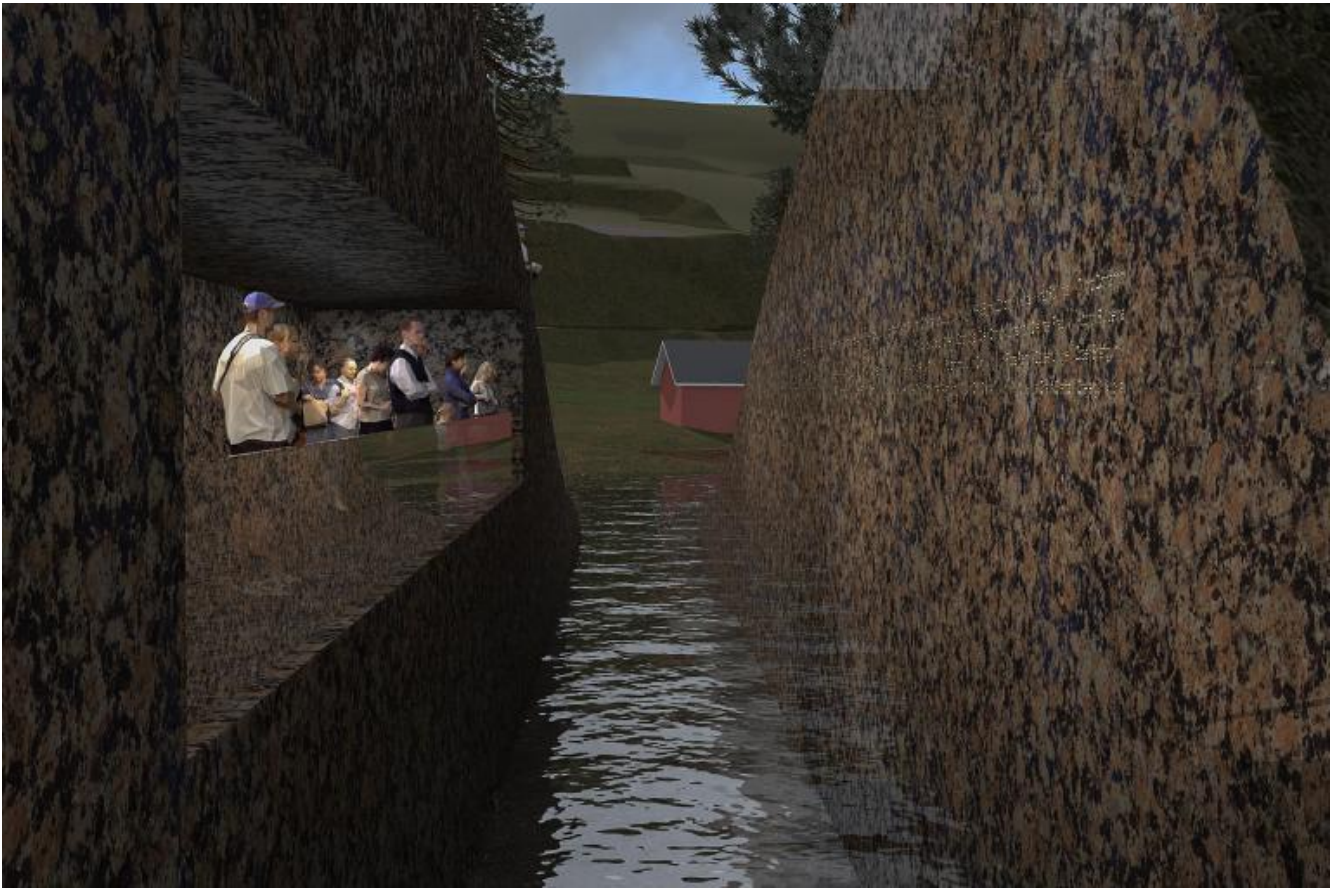
Progetto di Memorial Wound, alla fine del tunnel.