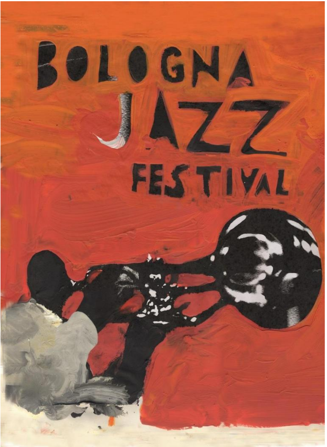
Gianluigi Toccafondo, Bologna Jazz