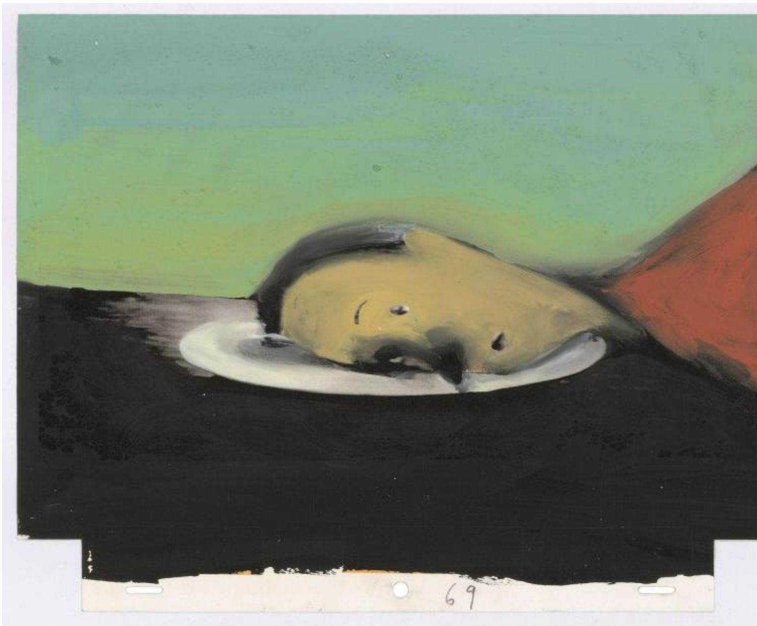
Gianluigi Toccafondo, Pinocchio 1999 (disegno per il cortometraggio).