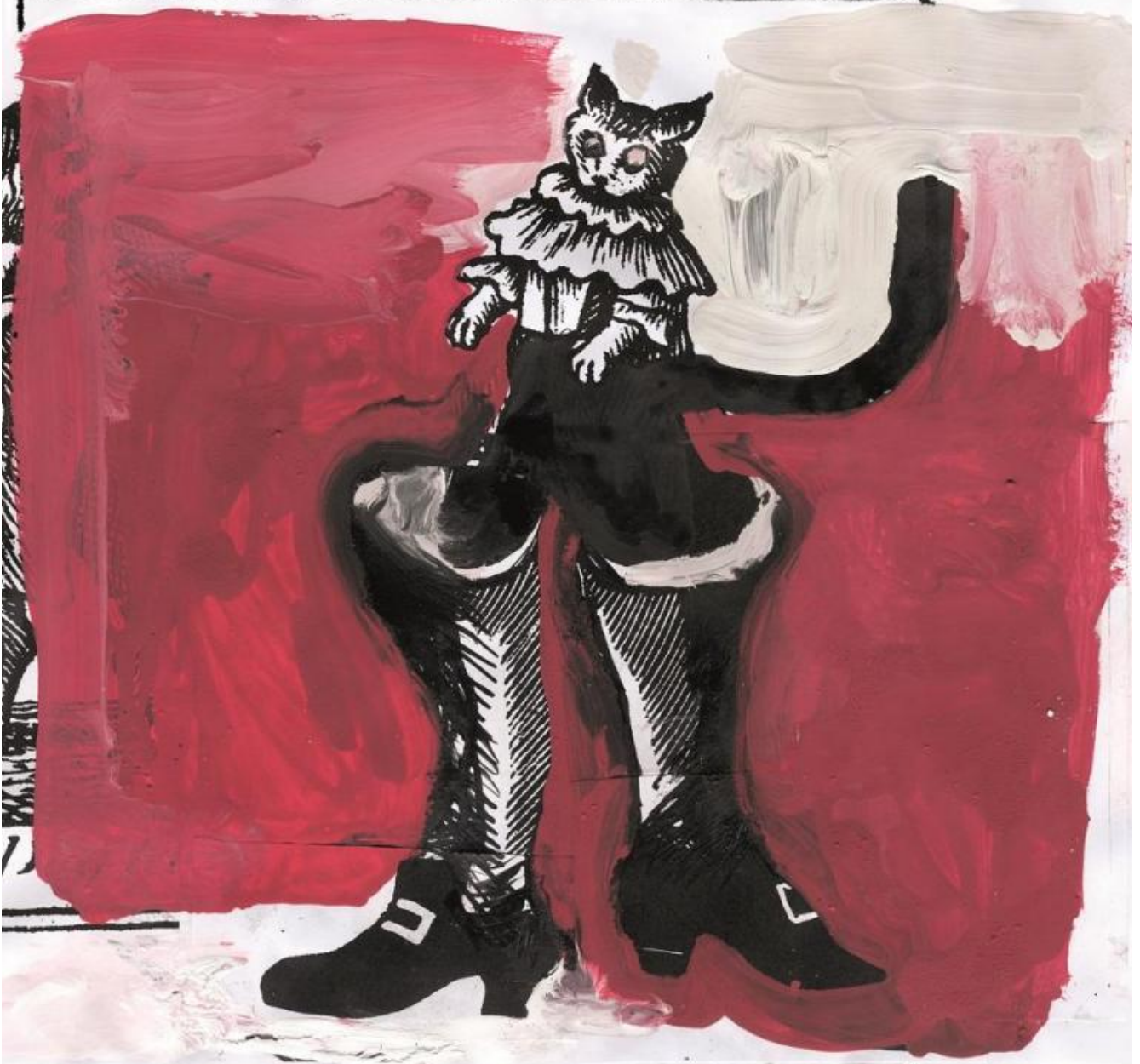
Gianluigi Toccafondo, Favola del gattino che voleva diventare il gatto con gli stivali , 2017 (copertina)