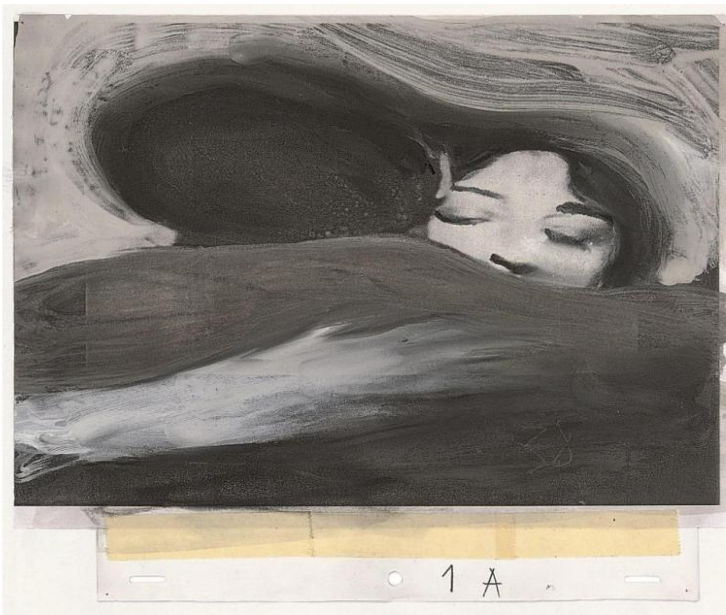
Gianluigi Toccafondo, Essere morti o essere vivi è la stessa cosa

modificare, contro voglia, per accontentare i suoi lettori, delusi da un lieto fine mancato. Un volume illustrato (con DVD) è stato pubblicato a Logos, nel 2011.