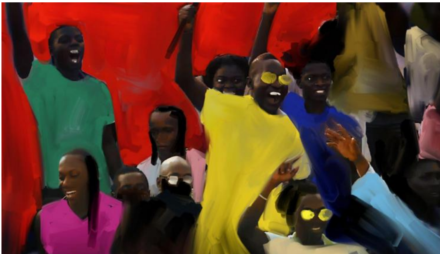
Gianluigi Toccafondo, C'mon tigre

Certo, ci sono anche videoclip musicali: un esempio? Per il primo singolo dei C'mon Tigre , è uscito il coloratissimo Fédération Tunisienne de Football (2014): si tratta di un'avvincente partita nel deserto del nord, popolato da una un bestiario africano (cammelli, giraffe ed elefanti) con tigre , che i calciatori giocano danzando. La perizia con cui rende ogni movimento è unica, tanto che sono riconoscibili stili diversi, passi precisi e coreografie iconiche. Artista del movimento, artista del mutamento.