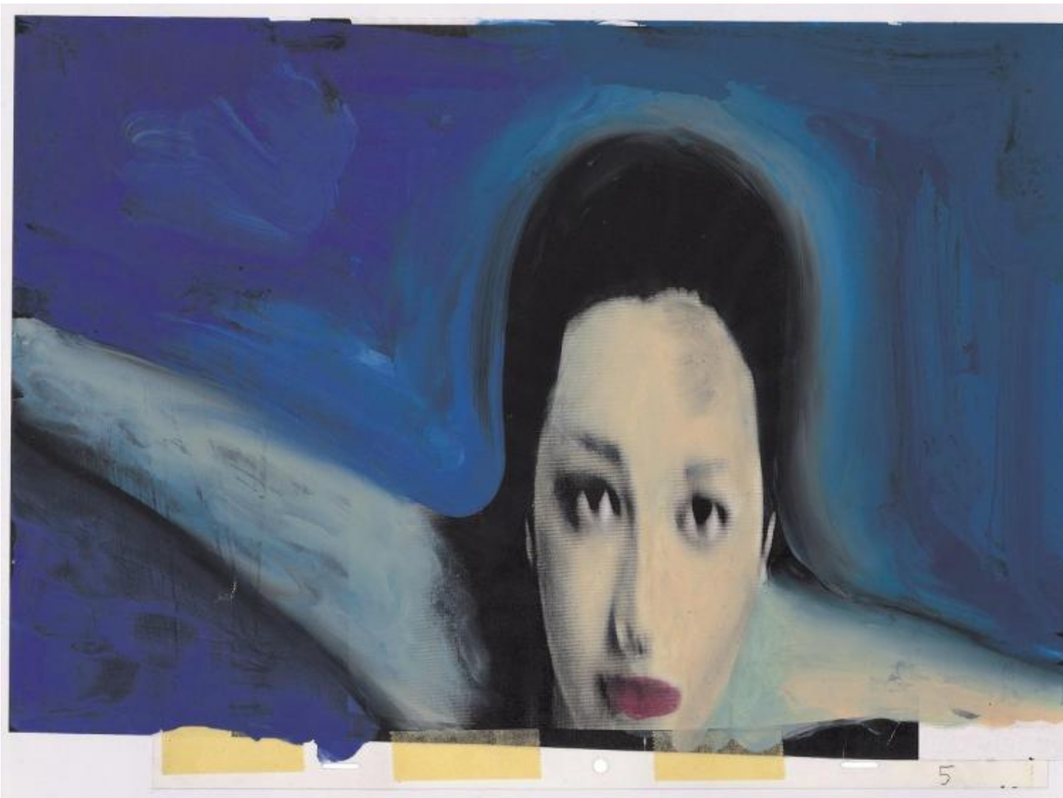
Gianluigi Toccafondo, La Biennale di Venezia con Asia Argento e Marco Giusti , 1999 (sigla per la 56 mostra d'arte cinematografica)

Non potevano mancare, in questa vastissima panoramica modenese, anche i lavori pensati per il cinema, in particolare la sigla della 56° Mostra d'arte cinematografica di Venezia , nel 1999 – con Asia Argento e Marco Giusti, e la sequenza animata dei titoli di testa per Robin Hood di Ridley Scott e la collaborazione come aiuto-regista di Matteo Garrone in Gomorra (2008).