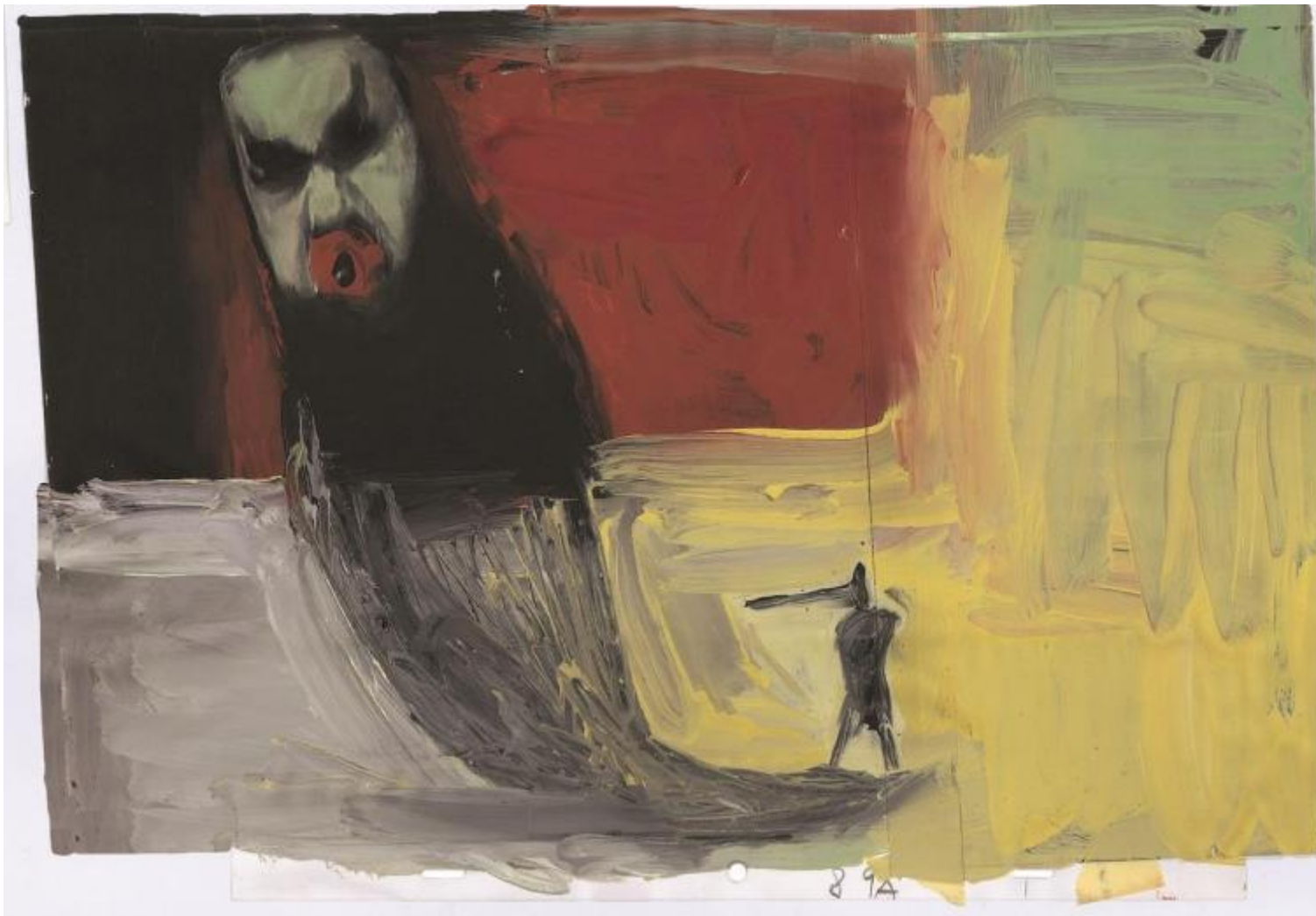
Gianluigi Toccafondo, Pinocchio 1999 (disegno per il cortometraggio)

Toccafondo ha iniziato a lavorare su questo autore nel 2009, per un'opera commissionata dalla Biblioteca Delfini , depositaria del Fondo Delfini , in parte ancora inedito: rapito e affascinato da questa figura, studiando le carte e i materiali d'archivio e intervenendo su di essi, ha realizzato un affresco digitale di 130 metri quadrati dedicato allo scrittore, i cui disegni originali sono esposti in sala. Ha lavorato inoltre sulle favole dello scrittore partenopeo Gianbattista Basile, Lo cunto de li cunti , edite intorno al 1635. Ha illustrato Jolanda, la figlia del Corsaro Nero di Emilio Salgari (Corraini, 2006), e La favola del pesce cambiato di Emma Dante (L'arboreto, 2007), per molti anni ha disegnato anche le copertine di Fandango libri (tipo, questa) come il logo animato e la sigla della casa di produzione e distribuzione cinematografica Fandango film .