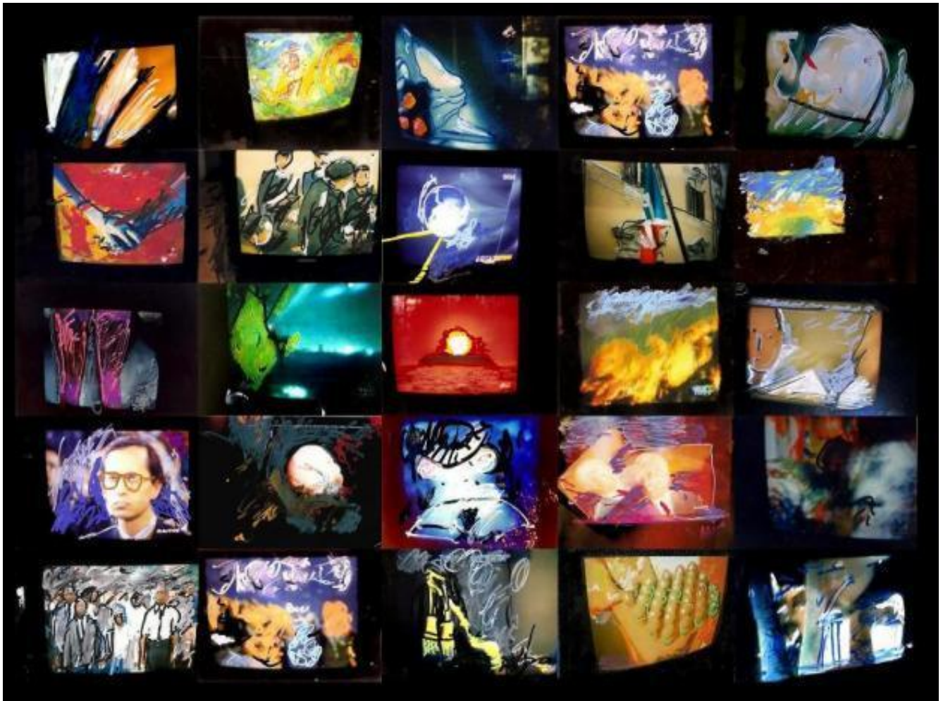
Mario Schifano, Schermi TV 70's

Alcuni di questi, è stata una gioia ritrovarli. Mentre osservo, penso a una coincidenza, a una specie di riconoscimento : i colori e lo stile dei manifesti lucchesi suggeriscono immagini che il mio occhio ha registrato di recente; sono gli schermi televisivi di Mario Schifano, tra cui le nove opere di Paesaggio TV in mostra #TV70 alla Fondazione Prada (di cui si è già scritto qui ).