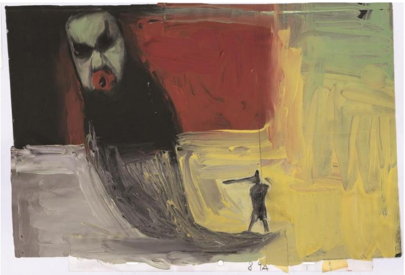
Gianluigi Toccafondo, Pinocchio 1999 (disegno per il cortometraggio)

Toccafondo ha iniziato a lavorare su questo autore nel 2009, per un'opera commissionata dalla Biblioteca Delfini , depositaria del Fondo Delfini , in parte ancora inedito: rapito e affascinato da questa figura, studiando le carte e i materiali d'archivio e intervenendo su di essi, ha realizzato un affresco digitale di 130 metri quadrati dedicato allo scrittore, i cui disegni originali sono esposti in sala. Ha lavorato inoltre sulle favole dello scrittore partenopeo Gianbattista Basile, Lo cunto de li cunti , edite intorno al 1635. Ha illustrato Jolanda, la figlia del Corsaro Nero di Emilio Salgari (Corraini, 2006), e La favola del pesce cambiato di Emma Dante (L'arboreto, 2007), per molti anni ha disegnato anche le copertine di Fandango libri (tipo, questa) come il logo animato e la sigla della casa di produzione e distribuzione cinematografica Fandango film .