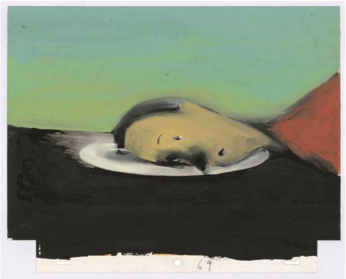
Gianluigi Toccafondo, Pinocchio 1999 (disegno per il cortometraggio).

ragazzi (è stato il primo vero libro che abbia letto interamente da sola, seienne) sia in realtà un romanzo millepiani, con molteplici pieghe e trappole anche per adulti, ambiguo, terrificante e violento, in una parola, macabro .