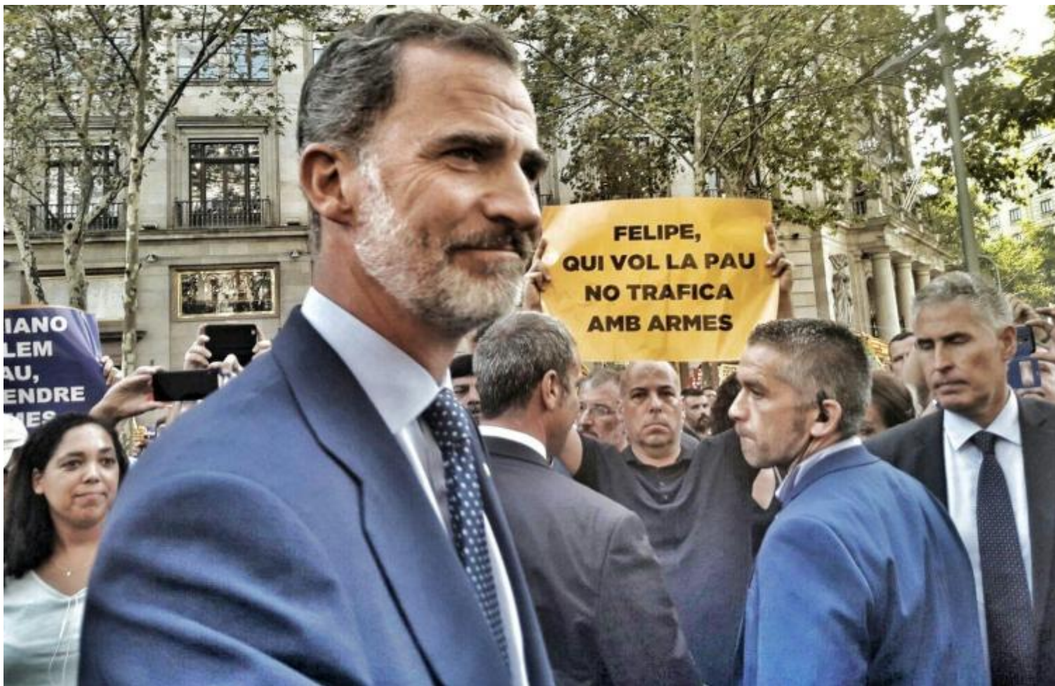
__title__ Passeig de Gracia - entrata a Piazza Catalunya. Sabato 26 Agosto, h. 17.50. "Felipe, chi vuole la pace non traffica con le armi."

È interessante essere qui in questo momento e non lo si può né vivere né raccontare senza ricordarsi che Barcellona sta in Catalunya, Catalunya sta in Spagna e che la generazione di Ada Colau è figlia di una dittatura: Felipe VI è figlio del Re Juan Carlos che è rimasto in carica al fianco del dittatore Francisco Franco fino al giorno della sua abdicazione, avvenuta il 19 Giugno 2014. Due anni fa.