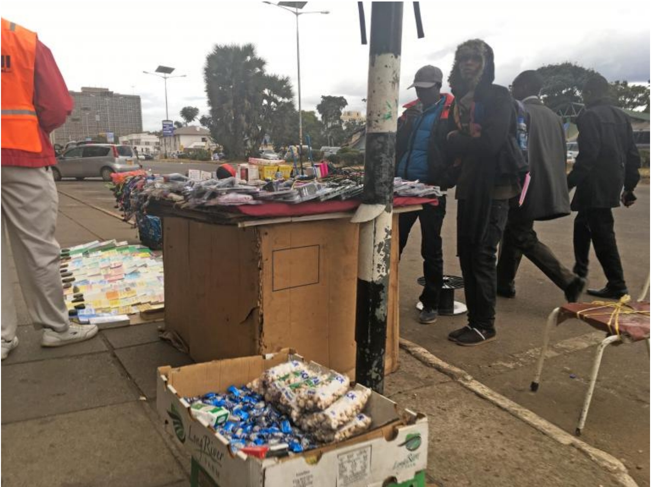
Harare city.

Sono convinto che la concezione africana dello spazio possa convivere con quella occidentale, così da creare nuovi spazi da cui tutti possano trarre vantaggio. Basta trovare un punto d'accordo e attivare i giusti meccanismi finanziari.