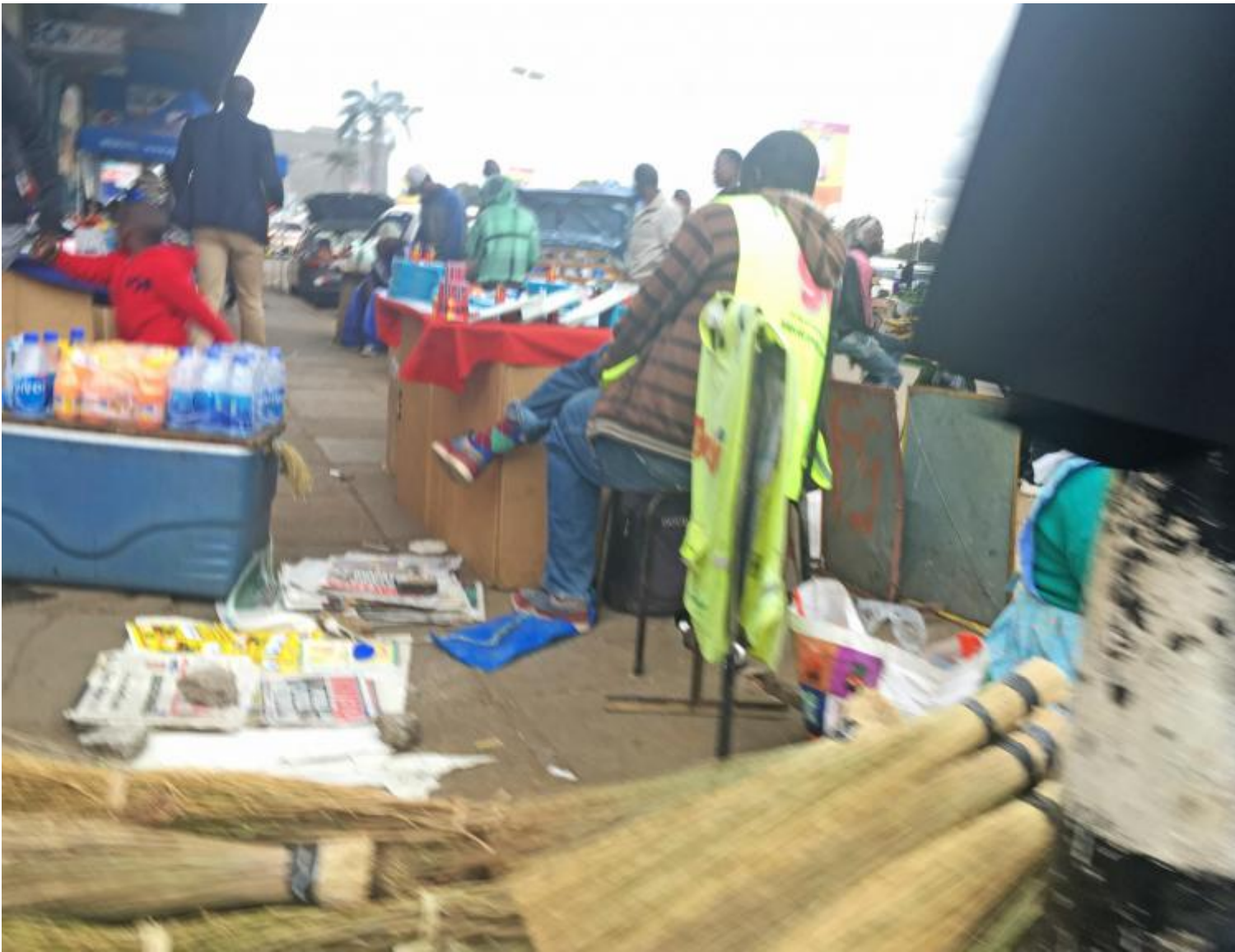
Harare city.

Ciò che si vede oggi nel centro della città è una distorsione di questa concezione dello spazio. In una situazione economica in cui il denaro scarseggia, molti si sono dati al commercio, occupando spazi liberi, marciapiedi e strade. Se da un lato questo ha portato ad avere prodotti agricoli e vestiti a buon mercato, dall'altro ha generato una totale assenza di regole, per cui parcheggiare – ad esempio – può diventare un incubo. L'abbondanza di spazio si è trasformata in una forma di sfruttamento spaziale che è incompatibile con territori ad alta densità abitativa.