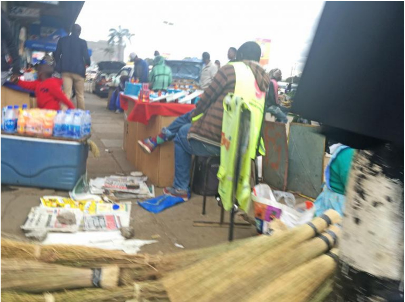
Harare city.

Ciò che si vede oggi nel centro della città è una distorsione di questa concezione dello spazio. In una situazione economica in cui il denaro scarseggia, molti si sono dati al commercio, occupando spazi liberi, marciapiedi e strade. Se da un lato questo ha portato ad avere prodotti agricoli e vestiti a buon mercato, dall'altro ha generato una totale assenza di regole, per cui parcheggiare - ad esempio - può diventare un incubo. L'abbondanza di spazio si è trasformata in una forma di sfruttamento spaziale che è incompatibile con territori ad alta densità abitativa.