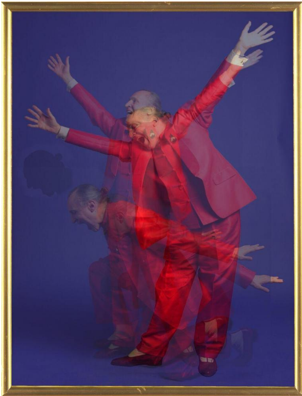
Luigi Ontani, Lombrofago serie anamorpse , 2008.

Lo spazio-spirale della rampa di Palazzo Carpegna non è solo, però, un'allegoria del Tempo. È anche un'interpretazione radicale dello Spazio. In una delle carte che ancora oggi continuano a venire in luce, preziosa testimonianza live di quella Roma barocca all'apice della sua potenza, il padre filippino Virgilio Spada – che fu elesimoniere segreto e consigliere artistico di Innocenzo X e Alessandro VII, connaisseur d'architettura e architetto dilettante lui stesso, e che di Borromini fu per decenni il grande protettore – racconta che una volta, davanti all'altare di San Pietro che si veniva allora costruendo, a denti stretti il Bernini gli confessò che «il solo Borromino intendeva questa professione, ma che non si contentava mai, e che voleva dentro una cosa cavare un'altra, e nell'altra l'altra senza finire mai». È un'osservazione acuta, che fa intuire l'introversione psicologica sottesa alla maniacalità microscopica di Borromini: alcuni dei suoi capolavori, come San Carlino alle Quattro Fontane, Sant'Agnese in Agone a Piazza Navona e la stessa Sant'Ivo alla Sapienza, sperimentano soluzioni rivoluzionarie proprio facendo forza sulla torturante