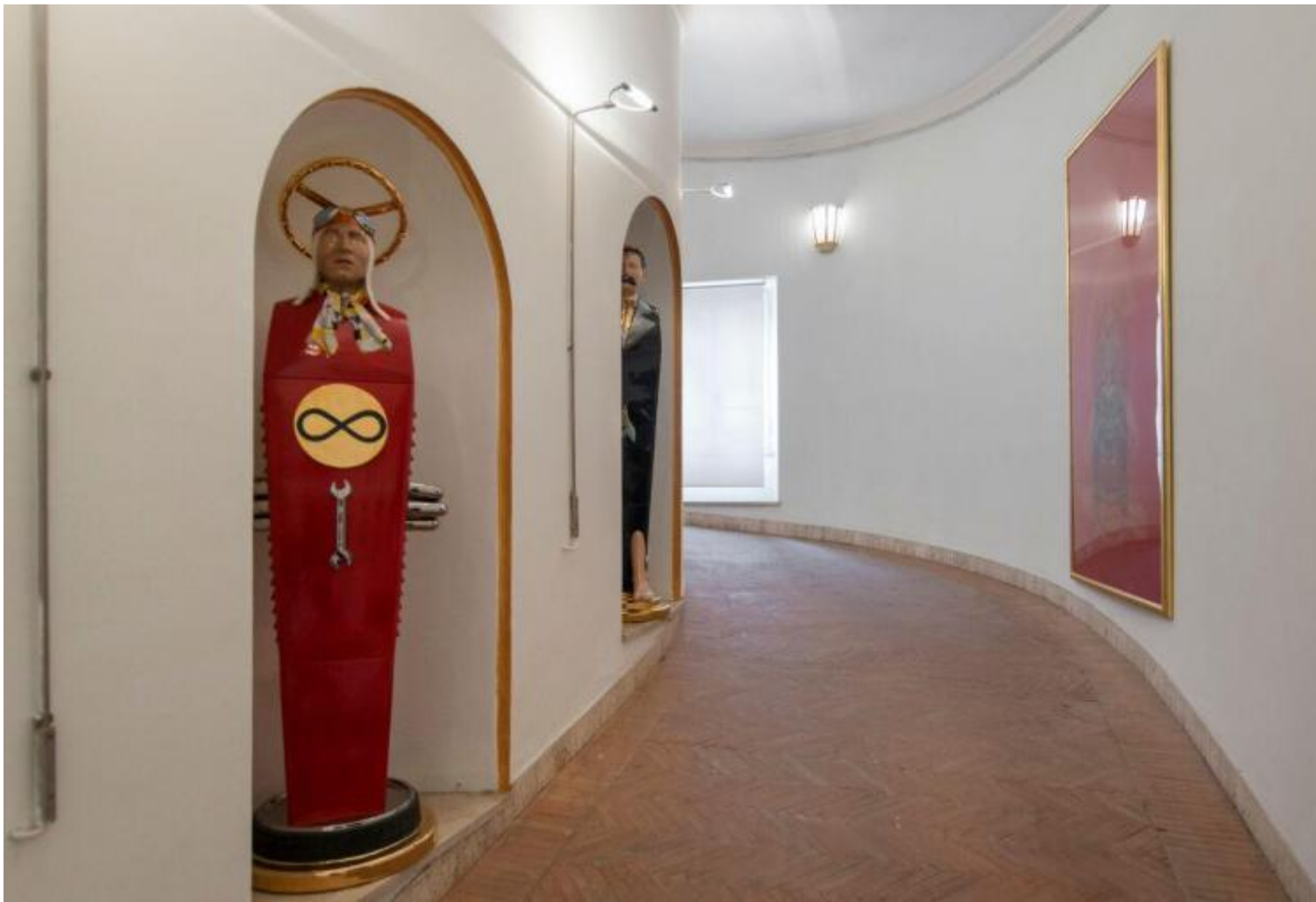
Luigi Ontani all'Accademia di San Luca, Rampa di Palazzo Carpegna

Sulla faccia esterna della spirale sono collocati i fantasmagorici autoritratti «lenticolari», che anamorficamente deformano tratti e gesti a seconda dell'inclinazione del nostro sguardo (vi spicca – ulteriore spirale ascensionale – un Io-Colonna Traiana) e su quella interna, come detto, le ErmEstEtiche: che riprendono la forma originaria di pilastri quadrangolari sormontati da una testa umana (in origine quella del dio Hermes, da cui prendono il nome), muniti di brevi appendici laterali nonché di un membro itifallico frontale. Ma dagli anni Novanta Ontani ha preso a produrne – coi fidi artigiani delle ceramiche Gatti di Faenza – in forma anfibologica, a sua volta anamorfica diciamo, cioè bifronti: «immagini di unione-opposizione di molteplici caratteri, immagini bifronti di personaggi celebri, di associazioni mentali, di maschere famose», scrive Ester Coen in catalogo, le ErmEstEtiche ibridano così ambiti diversi e distanti con quelli che sono dei veri e propri calembours visivi – equivalenti iconici dei mots-valise che Ontani impiega, ogni volta, per intitolare i propri lavori.