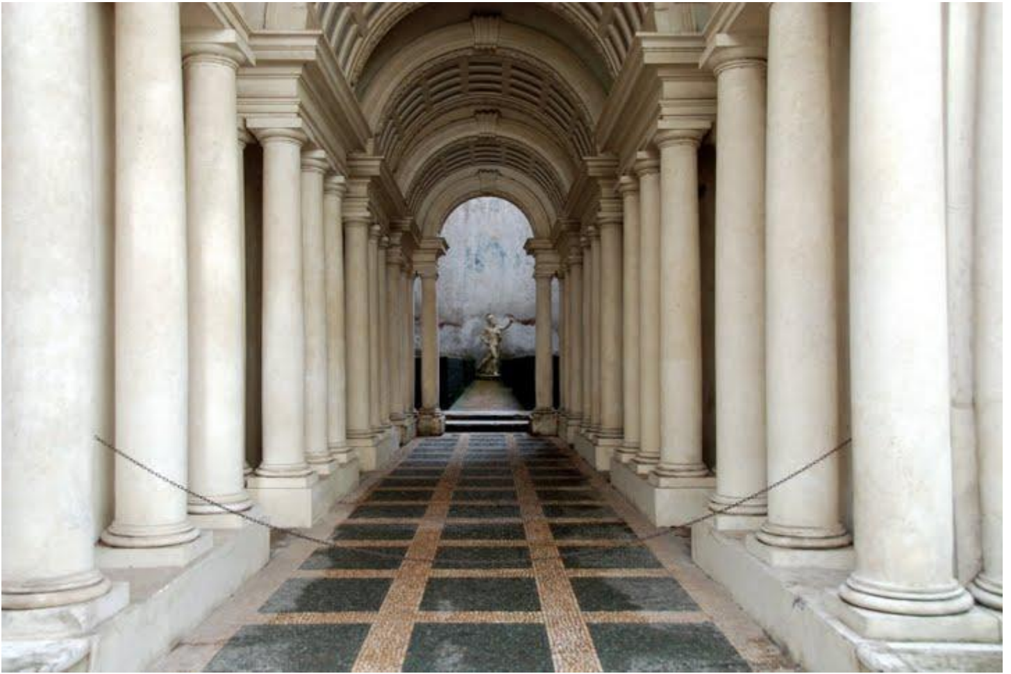
Francesco Borromini, Palazzo Spada, galleria prospettica, 1652-1653.