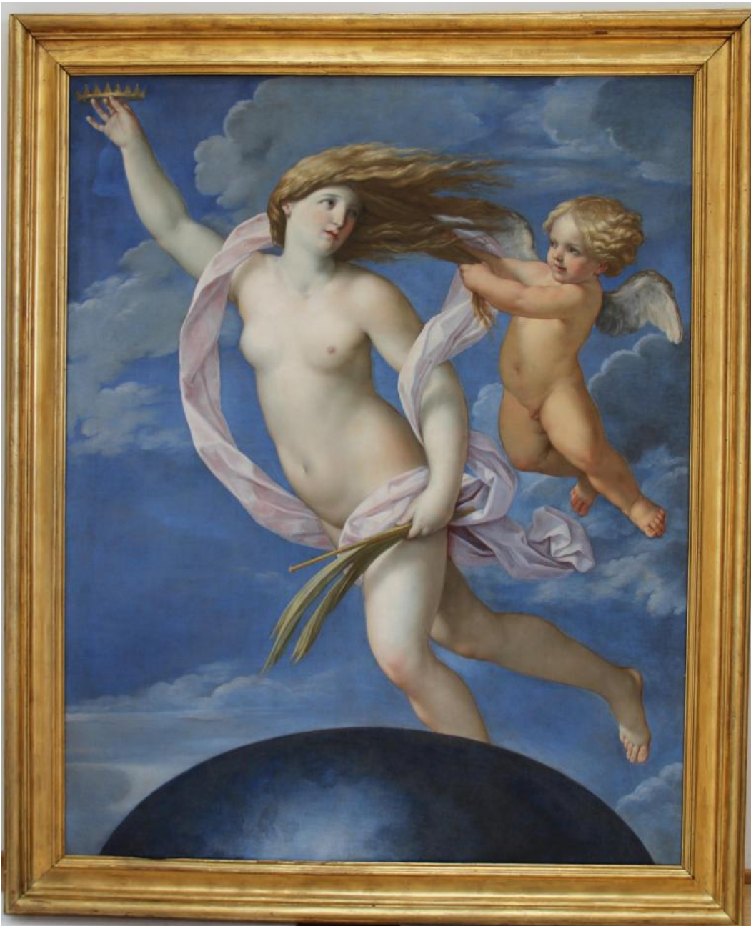
Guido Reni, Fortuna con la corona in mano, 1637 circa.

Sulla parete con affissi i ritratti dei passati Accademici (non manca Bernini, a contraggenio nello spazio dominato dal rivale), emblematicamente Ontani – che Accademico non è – si è sostituito a un oscuro Jean-François de Troy settecentesco con un proprio Io-San Sebastiano del '75 (anch'esso d'après Guido Reni). È la sua vera passione, del resto, questa enciclopedica e auto-enciclopedica; nel 2003 aveva dichiarato su Alias , a Federico de Melis: «ho scelto di fare della mia vita pittura, e della performance pittura, non per vivere l'oblio ma per resuscitare la storia dell'arte, della favola, della mitologia, dell'allegoria, del folklore, dell'iconologia».