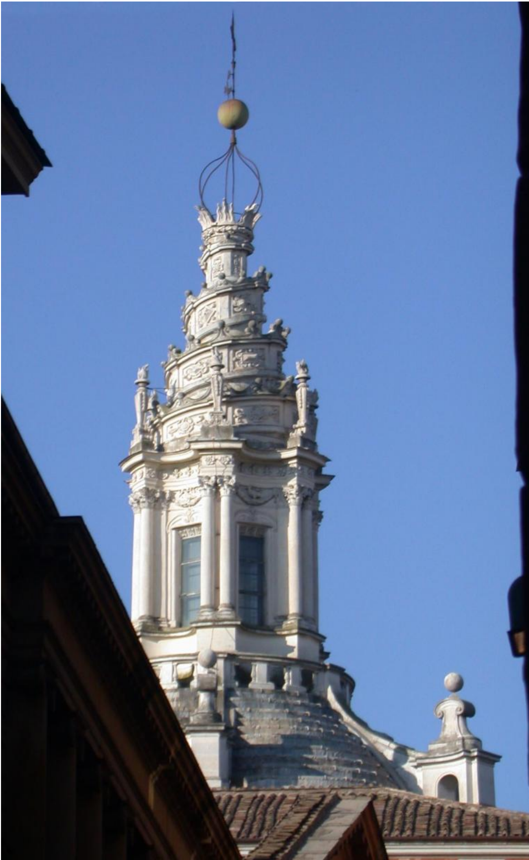
Francesco Borromini, Sant'Ivo alla Sapienza, 1642-1660.

Verrebbe da pensare che Borromini rispondesse con questo artificio – già vagheggiato da Leonardo – agli spazi contingentati in cui gli toccava in sorte di operare, nella complessa alchimia “politica” delle commesse di quella Roma barocca chiaroscurata d’inganni (o che, piuttosto, solleticavano una fantasia, la sua, di per sé