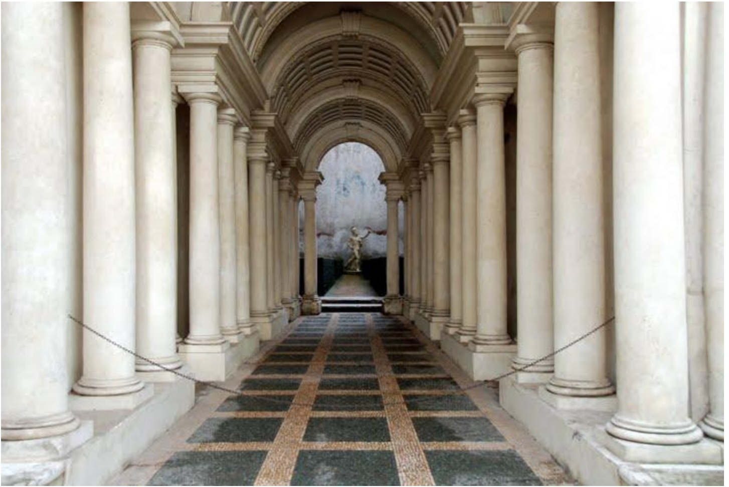
Francesco Borromini, Palazzo Spada, galleria prospettica, 1652-1653.