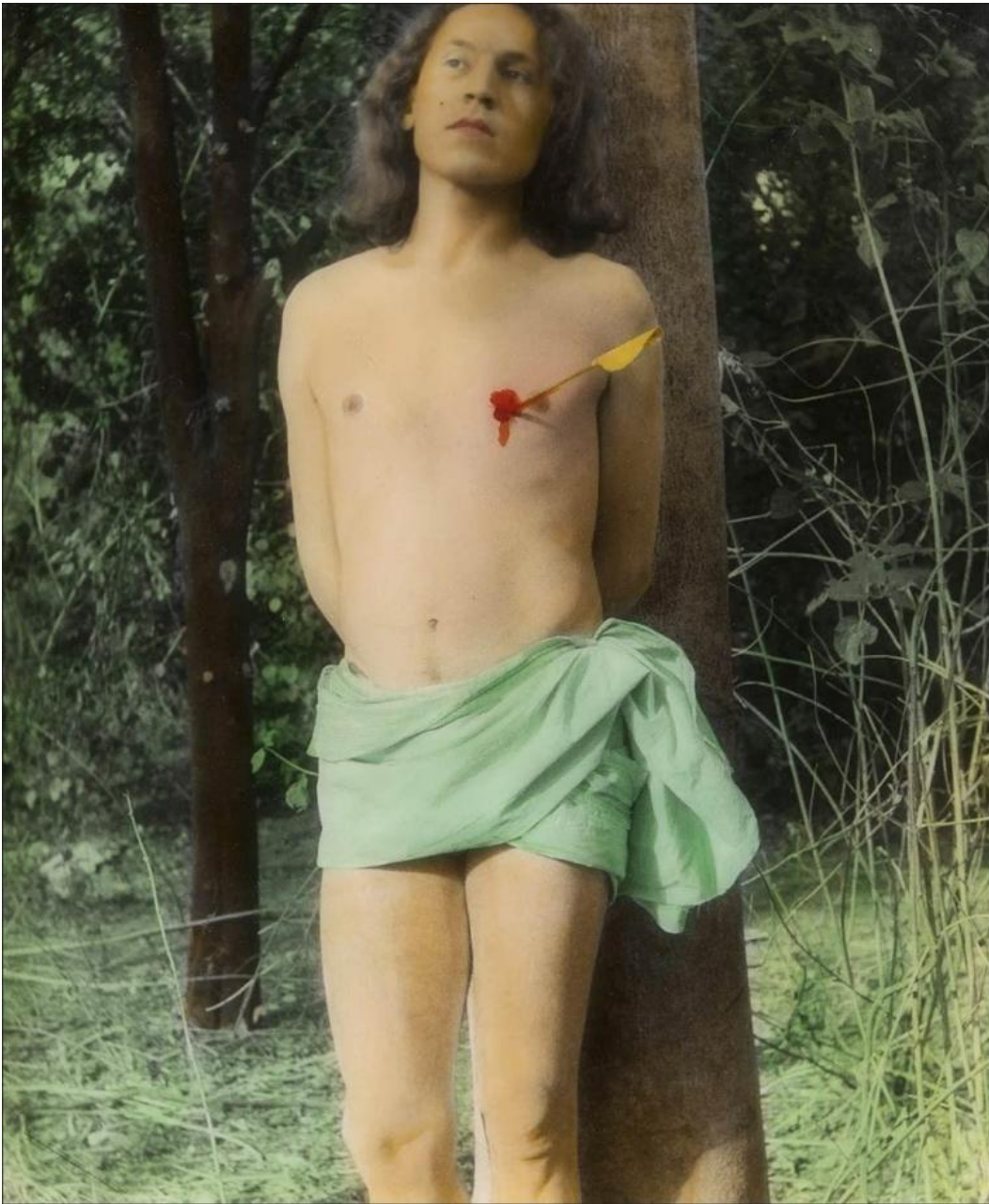
Luigi Ontani, San Sebastiano, 1975

Ma allora è proprio nel mirabolante allestimento della rampa elicoidale che va indicato il vero highlight della mostra.