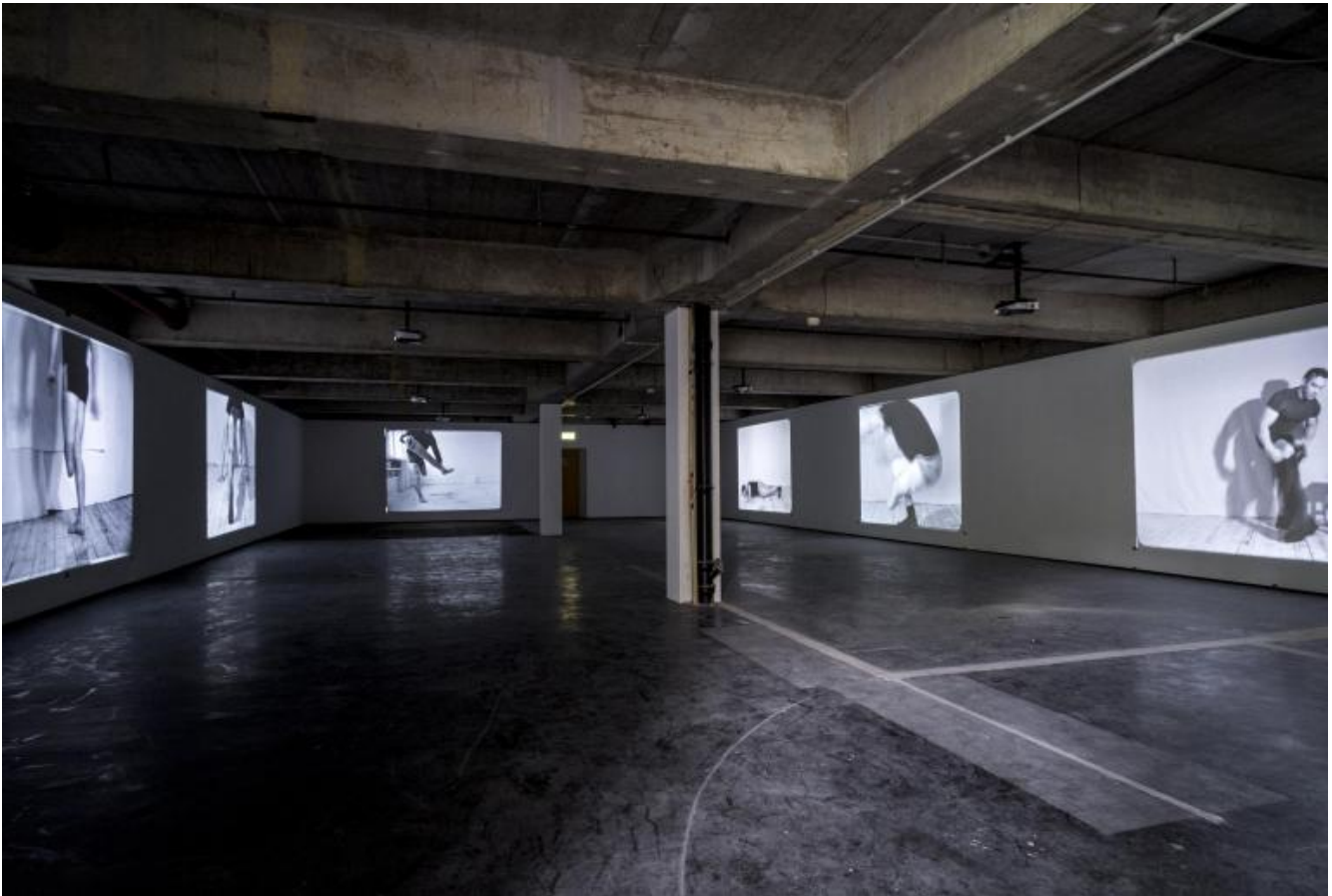
Artur Żmijewski, Realism , 2017

Non mancano ovviamente tra i 160 artisti invitati personalità dotate di quella forza di “insubordinazione poetica” così ricercata dai curatori. Oltre a diversi e oramai abituali recuperi di figure minori o dimenticate – ad esempio le singolari trasposizioni sonoro-cromatiche di Ivan Wyshnegradsky, i collage colorati di Elisabeth Wild, le sculture organiche di Alina Szapocznikow, l'artista polacca sopravvissuta alla Shoah e scomparsa nel 1973 – alcuni artisti sembrano in grado di confrontarsi col difficile, indispensabile esercizio di fondere densità espressiva e urgenza politica. Citerei ad esempio il video dell'israeliano Roe Rosen, The Dust Channel (2016), che mescola in forma di operetta noir la singolare ossessione domestica per gli aspirapolvere di una coppia borghese, found footage con spezzoni pubblicitari (della marca cult Dyson) e pornografici e riferimenti metaforici alla politica israeliana nei confronti dei rifugiati: la polvere da aspirare è il diverso da eliminare e insieme quella del deserto dove sorge il principale centro israeliano di detenzione per rifugiati politici. In modo acuto, il video Byzantion (2017) di Romuald Karmakar riflette a sua volta sui divergenti destini storici dell'Europa mettendo icasticamente a confronto la versione greca e quella slavonica dell'inno sacro della chiesa ortodossa Agni Parthene eseguito da due