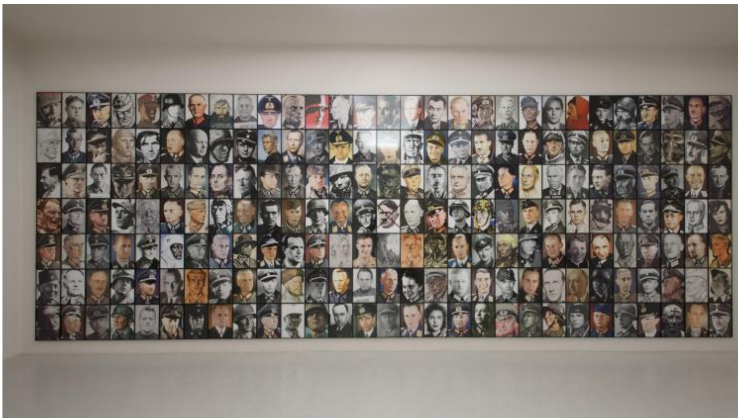
Piotr Uklański, Real Nazis, 2017