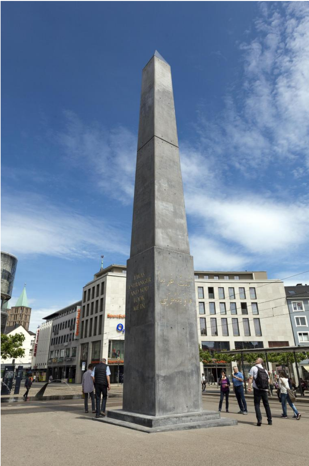
Olu Oguibe, Monument for strangers and refugees, 2017

Far emergere la colpa è possibile solo convocando il passato come testimone a carico. Di qui l'onnipresenza a documenta 14 - ma è un tratto comune a tante esposizioni internazionali degli ultimi anni - dell' archivio come oggetto e come metodologia di ricomposizione della memoria storica, una presenza tanto più determinante se fosse andato in porto il progetto di esporre nella sua interezza la