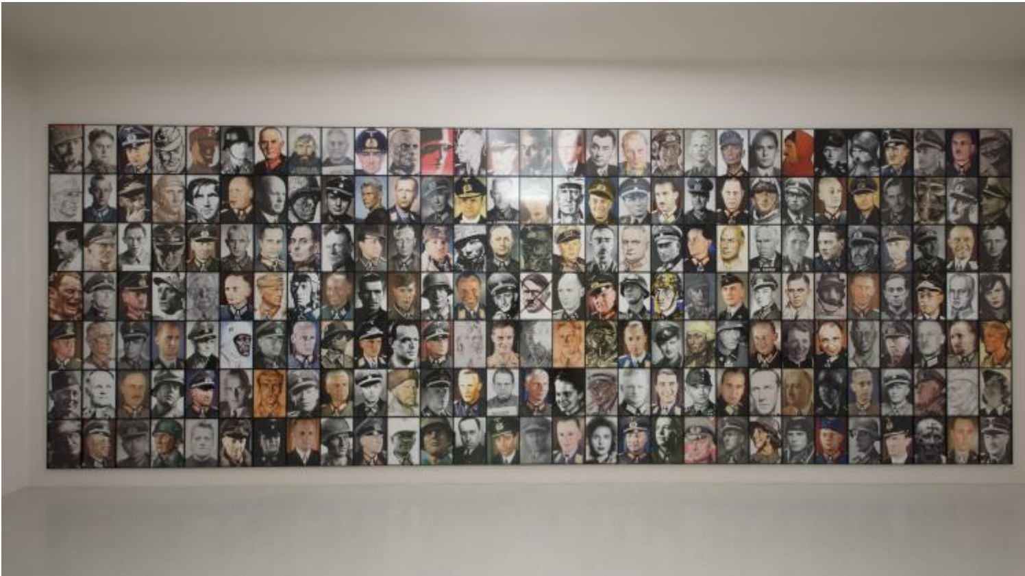
Piotr Uklański, Real Nazis, 2017

(un tema polemico già peraltro ampiamente sfruttato durante il periodo più intenso della crisi greca del 2015). Senza contare l'inclusione di opere del nonno di Hildebrand Gurlitt, il pittore di paesaggi Louis, e della sorella, l'artista espressionista Cornelia, la memoria storica è richiamata in modo esplicito in numerosi lavori esposti nella Neue Galerie, a partire dalla vasta installazione di Maria Eichhorn, Rose Valland Institute (2017), vero e proprio archivio in progress di documenti riguardanti opere d'arte confiscate dai nazisti ai proprietari ebrei. Riferimenti al nazismo sono ancora ad esempio nei lancinanti disegni di Władysław Strzemiński ispirati dalla distruzione del ghetto ebraico di Łódź ( Deportations , 1940), in cui la figura umana si dissolve in profili fratti e irriconoscibili, o la beffarda e insieme minacciosa serie di ritratti fotografici di gerarchi nazisti ( Real Nazis , 2017) di Piotr Uklański, immagini spesso incongruamente patinate o glamour, tratte da foto ufficiali o copertine di riviste, che richiamano un'altra sua opera, il ciclo The Nazis (1999), ironica galleria di celebri attori interpreti di film di guerra in costume. La serie include, a sorpresa, il ritratto in uniforme da aviatore di Joseph Beuys, ed è esposta – un vero colpo basso – proprio a fianco della sala della Neue Galerie in cui è presentata una delle più famose installazioni dell'artista tedesco, The Pack (1976).