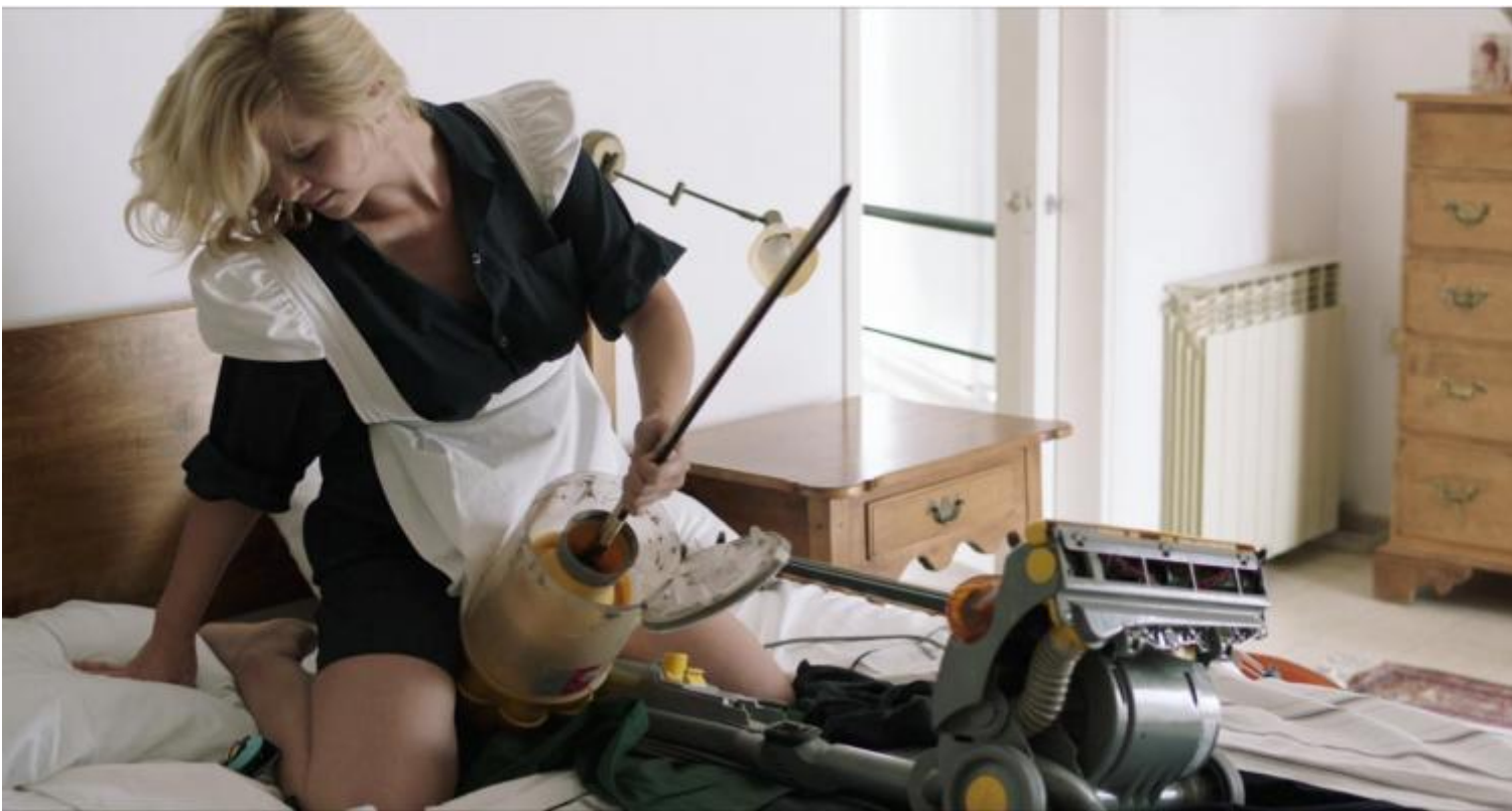
Roe Rosen, The Dust Channel , 2016

fondere densità espressiva e urgenza politica. Citerei ad esempio il video dell'israeliano Roe Rosen, The Dust Channel (2016), che mescola in forma di operetta noir la singolare ossessione domestica per gli aspirapolvere di una coppia borghese, found footage con spezzoni pubblicitari (della marca cult Dyson) e pornografici e riferimenti metaforici alla politica israeliana nei confronti dei rifugiati: la polvere da aspirare è il diverso da eliminare e insieme quella del deserto dove sorge il principale centro israeliano di detenzione per rifugiati politici. In modo acuto, il video Byzantion (2017) di Romuald Karmakar riflette a sua volta sui divergenti destini storici dell'Europa mettendo icasticamente a confronto la versione greca e quella slavonica dell'inno sacro della chiesa ortodossa Agni Parthene eseguito da due cori monastici. Più ellittica, ma proprio per questo più potente, è infine la videoinstallazione di Artur ?mijewski, Realism (2017), in cui sei proiezioni in bianconero mostrano altrettanti uomini con arti amputati, vittime di incidenti o forse di guerre senza nome, mentre eseguono in silenzio esercizi fisici in spogli ambienti domestici. La disadorna semplicità dell'installazione nell'ambiente bianco e grigio, la sottaciuta eppure palpabile durezza dei sei brevi video, la loro composta ed esigente frontalità, ne fanno uno dei lavori più coerenti e riusciti di questa edizione di documenta.