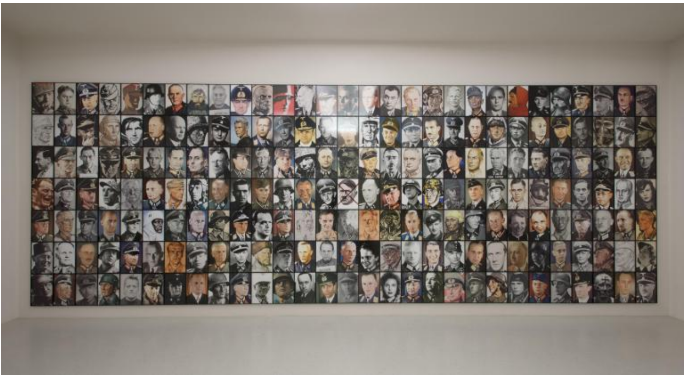
Piotr Uklański, Real Nazis , 2017

intenso della crisi greca del 2015). Senza contare l'inclusione di opere del nonno di Hildebrand Gurlitt, il pittore di paesaggi Louis, e della sorella, l'artista espressionista Cornelia, la memoria storica è richiamata in modo esplicito in numerosi lavori esposti nella Neue Galerie, a partire dalla vasta installazione di Maria Eichhorn, Rose Valland Institute (2017), vero e proprio archivio in progress di documenti riguardanti opere d'arte confiscate dai nazisti ai proprietari ebrei. Riferimenti al nazismo sono ancora ad esempio nei lancinanti disegni di Władysław Strzemiński ispirati dalla distruzione del ghetto ebraico di Łódź ( Deportations , 1940), in cui la figura umana si dissolve in profili fratti e irriconoscibili, o la beffarda e insieme minacciosa serie di ritratti fotografici di gerarchi nazisti ( Real Nazis , 2017) di Piotr Uklański, immagini spesso incongruamente patinate o glamour, tratte da foto ufficiali o copertine di riviste, che richiamano un'altra sua opera, il ciclo The Nazis (1999), ironica galleria di celebri attori interpreti di film di guerra in costume. La serie include, a sorpresa, il ritratto in uniforme da aviatore di Joseph Beuys, ed è esposta - un vero colpo basso - proprio a fianco della sala della Neue Galerie in cui è presentata una delle più famose installazioni dell'artista tedesco, The Pack (1976).