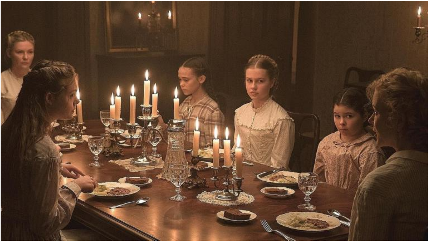
Sofia Coppola, The Beguiled.

Ma forse, ancor più che per la sua volontà di incantarci, il film di Coppola, premiato per la regia a Cannes, è interessante perché riadatta la storia del libro di Cullinan dialogando però, secondo una sofisticata trama intertestuale di riprese e rovesciamenti, anche con il primo film (1971) tratto da The Beguiled , realizzato da Don Siegel e interpretato da Clint Eastwood.