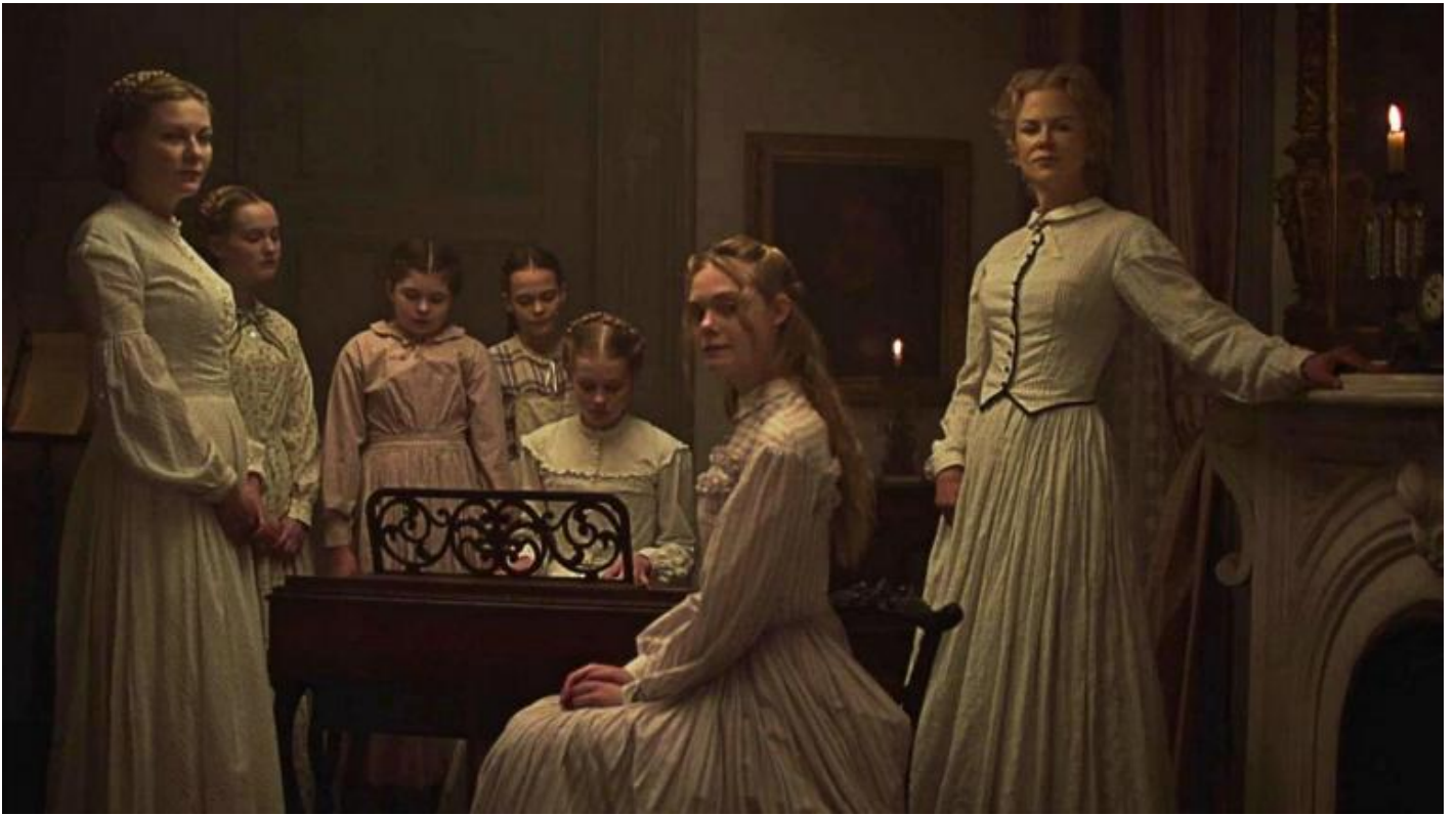
The Beguiled (2017).

Una specie di esagono, complicato dall'arrivo di John, che di nuovo, come nel romanzo, resta l'oggetto magico e misterioso, quello che alla fine sarà estromesso per rimettere in posa il gruppo: