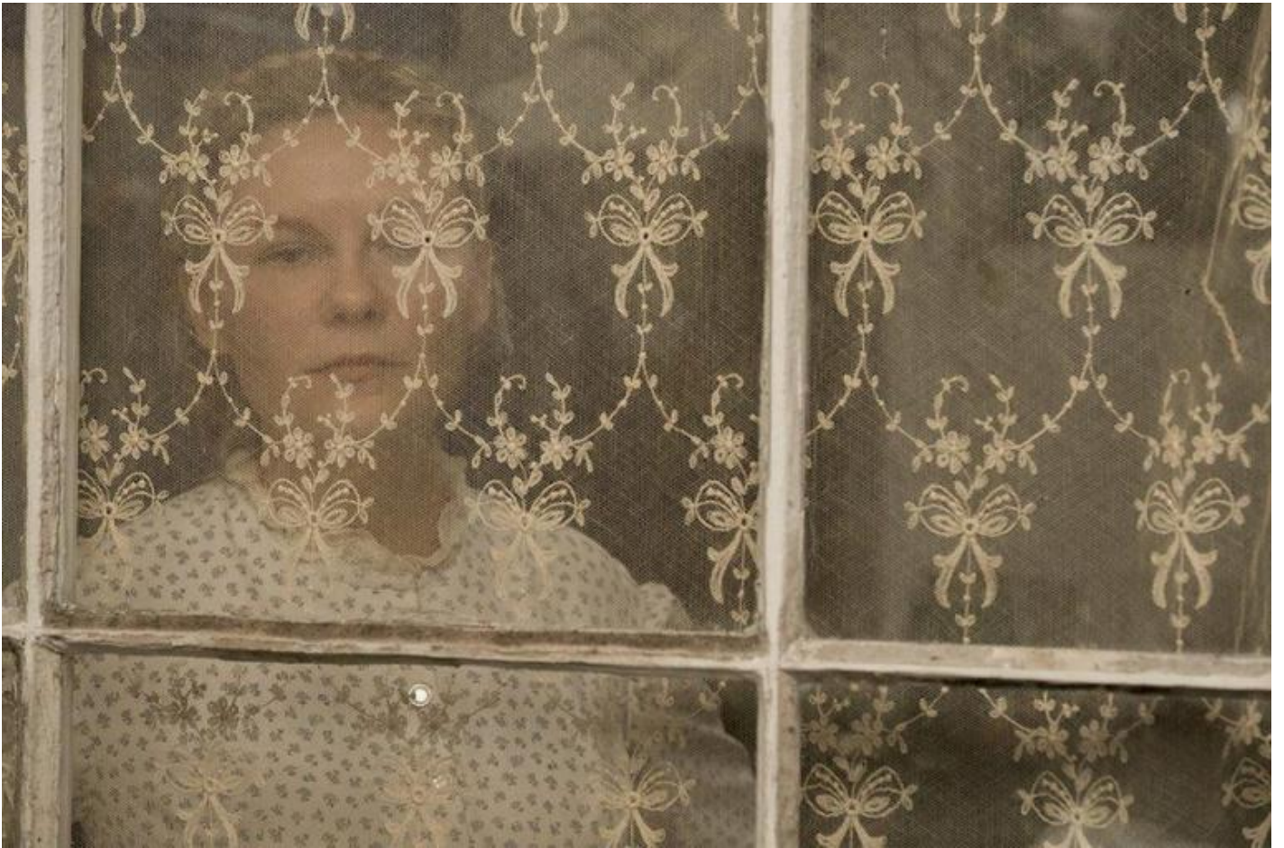
Sofia Coppola, The Beguiled (2017).

o ancora al contrario, da sfumature di penombra che raccontano attraverso i grigi l'incombenza plumbea della guerra o dal bagliore delle candele in notturna: