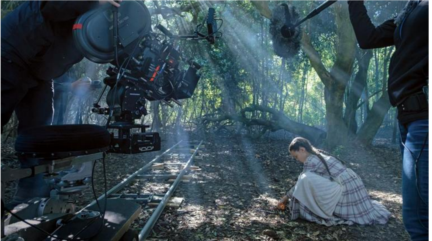
The Beguiled (2017) foto di scena © Ben Rothstein / Focus Features.

The Beguiled di Sofia Coppola, tratto dal romanzo omonimo, è un'opera che non si smetterebbe mai di ammirare, perfino a costo di annoiarsi, non fosse altro che perché questo film raggiunge forse il punto più alto di quella che sembra essere una delle cifre stilistiche più personali dell'opera della regista, vale a dire l'attenzione a usare il linguaggio del cinema per simulare la vita come grande situazione figurativa. Fotografia e regia portano a risultati straordinari il lavoro sull'immagine, con la cura degli arredi, dei costumi, la composizione dei corpi (che fa ripensare a certe tele di John Singer Sargent, o anche a Picnic at Hanging Rock , di Peter Weir), o per la scelta di costruire il senso drammatico della scena modulando gli effetti di una luce naturale: usando fasci luminosi che delineano una specie di corridoio di vapori dentro la boscaglia