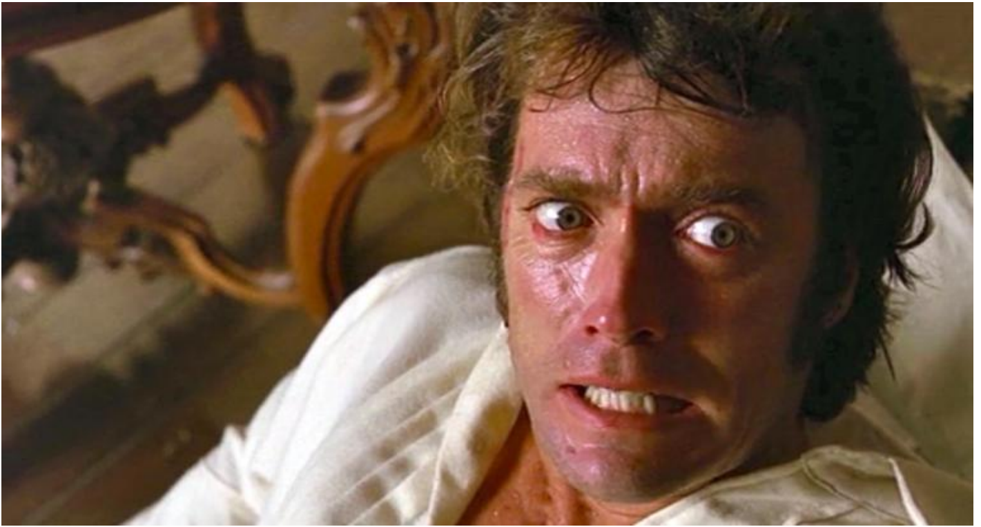
Clint Eastwood in The Beguiled (La notte brava del soldato Jonathan) di Don Siegel, 1971.