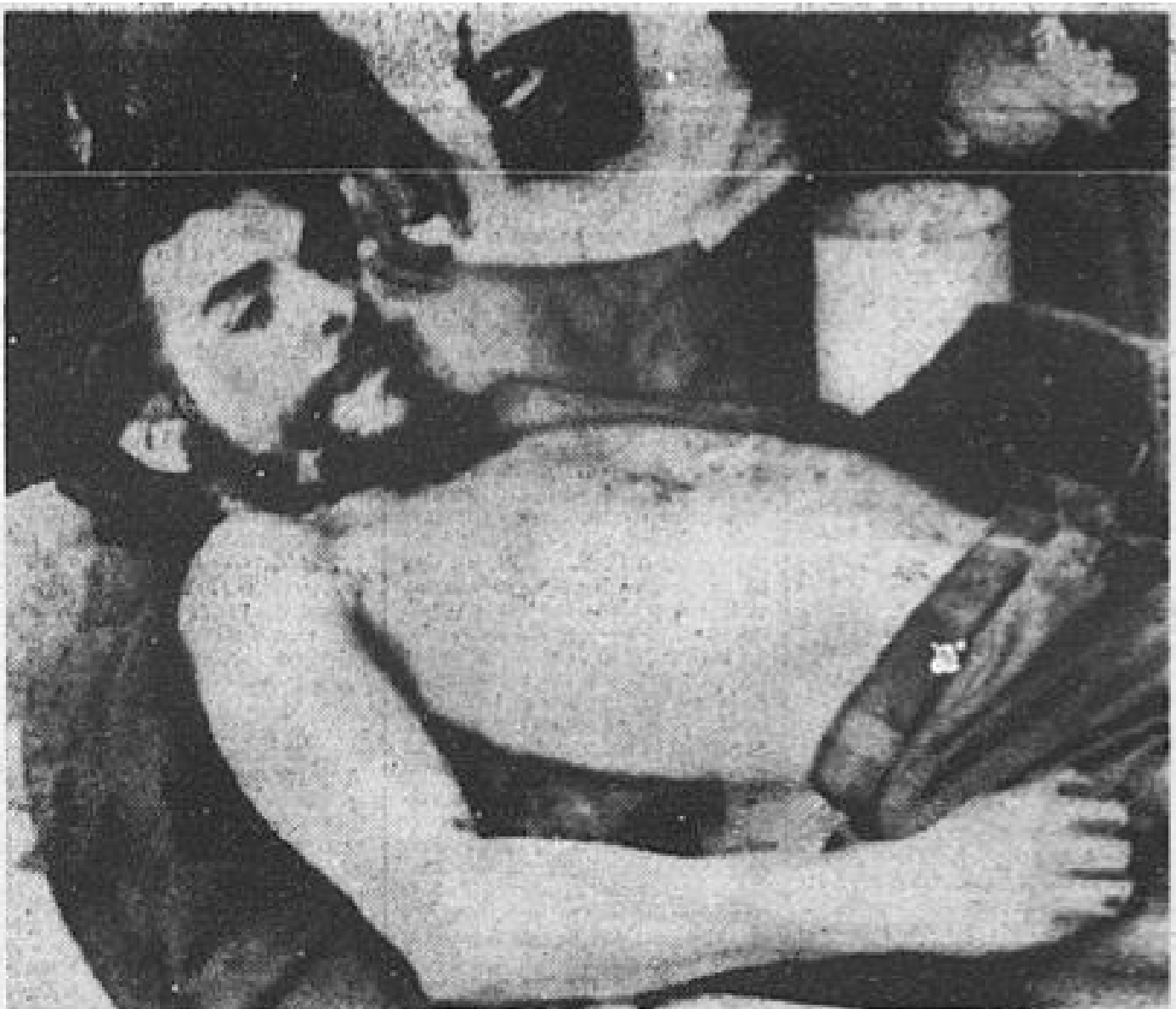
Questo sarebbe il corpo di Ernesto «Che» Guevara ucciso in Bolivia. Il drammatico primo piano è stato ripreso durante la visita alla salma che alcuni giornalisti hanno compiuto, a Vallegrande, su invito delle autorità boliviane

Un elicottero arriva da La Higuera con il cadavere di Che Guevara. Quando il corpo viene portato dalla pista di atterraggio all'ospedale di Nuestra Señora de Malta a Vallegrande, la gente è già assiepata lungo la pista di atterraggio e, poco dopo, fuori dall'ospedale. Ci sono già dei fotografi. Qualcuno scatta una foto alla barella con alcuni militari in posa: il braccio sinistro del Che oscilla verso terra. Non c'è immagine del trasporto di un morto – dai sarcofagi romani con Meleagro, alle Vittime del lavoro di Vincenzo Vela (1882) – in cui manchi questo dettaglio; alcuni storici dell'arte, per questo, lo hanno chiamato “braccio della morte”.