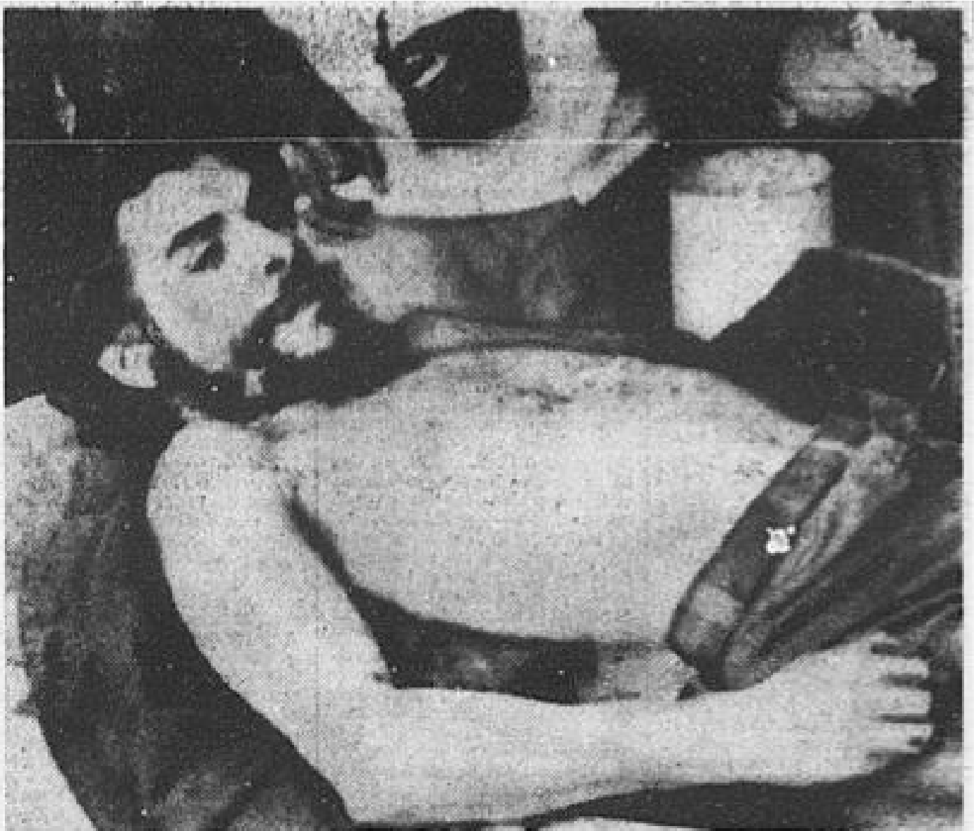
Questo sarebbe il corpo di Ernesto «Che» Guevara ucciso in Bolivia. Il drammatico primo piano è stato ripreso durante la visita alla salma che alcuni giornalisti hanno compiuto, a Vallegrande, su invito delle autorità boliviane

Un elicottero arriva da La Higuera con il cadavere di Che Guevara. Quando il corpo viene portato dalla pista di atterraggio all'ospedale di Nuestra Señora de Malta a Vallegrande, la gente è già assiepata lungo la pista di atterraggio e, poco dopo, fuori dall'ospedale. Ci sono già dei fotografi. Qualcuno scatta una foto alla barella con alcuni militari in posa: il braccio sinistro del Che oscilla verso terra. Non c'è immagine del trasporto di un morto – dai sarcofagi romani con Meleagro, alle Vittime del lavoro di Vincenzo Vela (1882) – in cui manchi questo dettaglio; alcuni storici dell'arte, per questo, lo hanno chiamato “braccio della morte”.