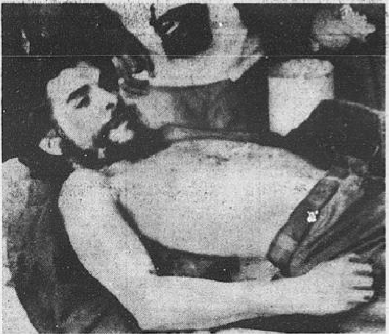
Questo sarebbe il corpo di Ernesto «Che» Guevara ucciso in Bolivia. Il drammatico primo piano è stato ripreso durante la visita alle salme che alcuni giornalisti hanno compiuto, a Vallegrande, su invito delle autorità boliviane

Un elicottero arriva da La Higuera con il cadavere di Che Guevara. Quando il corpo viene portato dalla pista di atterraggio all'ospedale di Nuestra Señora de Malta a Vallegrande, la gente è già assiepata lungo la pista di atterraggio e, poco dopo, fuori dall'ospedale. Ci sono già dei fotografi. Qualcuno scatta una foto alla barella con alcuni militari in posa: il braccio sinistro del Che oscilla verso terra. Non c'è immagine del trasporto di un morto - dai sarcofagi romani con Meleagro, alle Vittime del lavoro di Vincenzo Vela (1882) - in cui manchi questo dettaglio; alcuni storici dell'arte, per questo, lo hanno chiamato "braccio della morte".