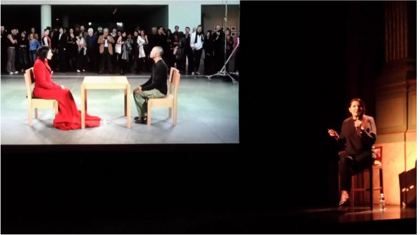
Lecture di Marina Abramović? con la proiezione di alcune fotografie scattate nel corso della performance The Artist is Present eseguita al MoMa di New York nel 2010.

Nella filosofia della Stoà , come si diceva, lo stesso pneuma che anima il mondo anima anche il corpo, un corpo perciò senza limiti e confini , ma già con Marco Aurelio Antonino, e prima ancora con Posidonio, il termine pneuma ( soffio, respiro, spirito vitale ) subisce una mutazione semantica. Nel medio stoicismo viene introdotto un dualismo tra la parte superiore dell'anima e quella inferiore, animale, sensuale e corporea. Al formarsi di questa diversa concezione del pneuma concorre anche lo sviluppo della medicina, in seno alla quale la pneumatologia era stata ulteriormente rielaborata: al soffio vitale era stata sottratta ogni funzione che non fosse puramente fisiologica. Nel suo bellissimo saggio, Tasinato analizza la deprecazione del respiro ( pneuma ), che si accompagna alla stigmatizzazione di quanto nell'esistenza vi è di transitorio. Da qui in avanti lo spirito si emanciperà dal corpo: "sangue guasto, ossicini, intrico sottile di nervi, venuzze, arterie", animato da un "soffiuccio" destinato a disperdersi.