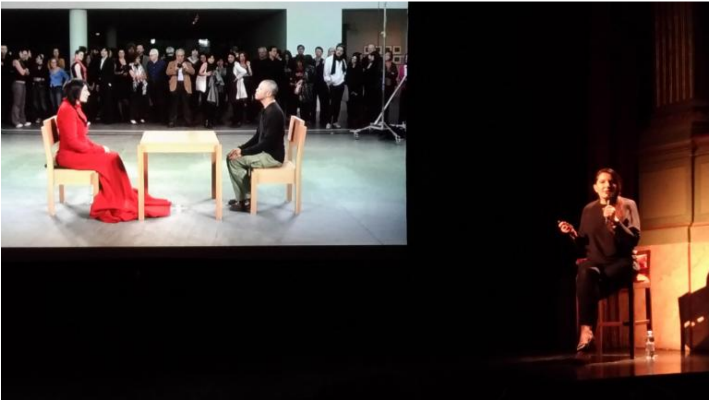
Lecture di Marina Abramović? con la proiezione di alcune fotografie scattate nel corso della performance The Artist is Present eseguita al MoMa di New York nel 2010.

Nella filosofia della Stoà , come si diceva, lo stesso pneuma che anima il mondo anima anche il corpo, un corpo perciò senza limiti e confini , ma già con Marco Aurelio Antonino, e prima ancora con Posidonio, il termine pneuma ( soffio, respiro, spirito vitale ) subisce una mutazione semantica. Nel medio stoicismo viene introdotto un dualismo tra la parte superiore dell'anima e quella inferiore, animale, sensuale e corporea. Al formarsi di questa diversa concezione del pneuma concorre anche lo sviluppo della medicina, in seno alla quale la pneumatologia era stata ulteriormente rielaborata: al soffio vitale era stata sottratta ogni funzione che non fosse puramente fisiologica. Nel suo bellissimo saggio, Tasinato analizza la deprecazione del respiro ( pneuma ), che si accompagna alla stigmatizzazione di quanto nell'esistenza vi è di transitorio. Da qui in avanti lo spirito si emanciperà dal corpo: "sangue guasto, ossicini, intrico sottile di nervi, venuzze, arterie", animato da un "soffiuccio" destinato a disperdersi.