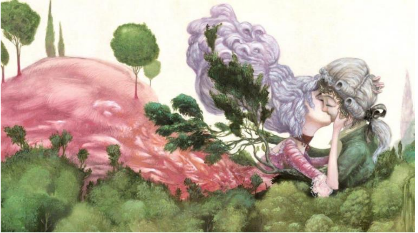
Illustrazione di Roger Olmos.

Romanzo storico sui generis quant' altri mai, germinato da un' invenzione fantastica, con aperture utopiche di formidabile attualità (Cosimo pubblica un Progetto di Costituzione per Città Repubblicana con Dichiarazione dei Diritti degli Uomini, delle Donne, dei Bambini, degli Animali Domestici e Selvatici, compresi Uccelli Pesci e Insetti, e delle Piante sia d'Alto Fusto sia Ortaggi ed Erbe ), Il barone rampante è anche un' allegoria dell' impegno camuffata da allegoria del disimpegno: dalla quale, date alla mano, si può desumere una rivendicazione orgogliosa. Di fronte all' emergenza storica, tra i più pronti a rispondere, tra i più reattivi e consapevoli, ci sarà proprio chi a suo tempo avrà saputo sottrarsi all' opaca vischiosità dell' esistente – la «bonaccia» che paralizza la flotta dell' ammiraglio Drake –: chi avrà opposto a un' inerte, avvilita stagnazione la volontà di fare attrito. Così il rampante Cosimo, giunto all' età di Calvino, suonerà dall' alto di un fico la carica contro gli sbirri venuti a riscuotere le imposte, e i vendemmiatori insorgeranno al grido di Ça ira!