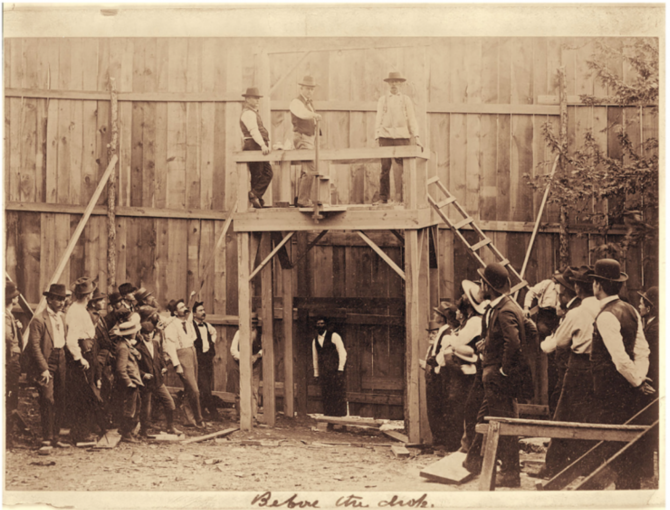
Ken Gonzales-Day, Erased Lynchings.

Per non citare il caso più controverso, quello di Colbert. A lui sono dedicati una statua e una sala all'Assemblée nationale; un'ala al Ministero dell'economia; licei, strade e persino un software per favorire il rientro delle imprese in Francia, chiamato Colbert 2.0. Colbert – quello vero – il colonialista autore del Codice nero che considerava gli schiavi beni mobili, fondatore della Compagnia delle Indie occidentali, è commemorato come grande economista francese del XVII secolo. Simile il caso di Jules Ferry che, se istituisce l'educazione laica, gratuita e obbligatoria per tutti, difende al contempo la colonizzazione. Diciassette porti in Francia parteciparono alla tratta dei neri, 1.3 milioni tra il XVII secolo e l'abolizione del 1848, senza contare il numero incalcolabile di quanti furono uccisi durante la cattura. Per non citare la guerra in Algeria, una ferita ancora aperta: il generale Dugommier, schiavista e proprietario di una piantagione in Guadaloupe, che ristabilisce l'ordine in Martinica contro i coloni recalcitranti alla Rivoluzione, ha una strada, una stazione della metro e una targa al Panthéon di Parigi. O il generale Gallieni, legato ai massacri in Indocina.