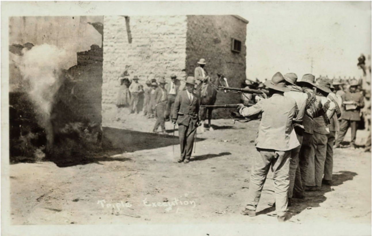
Ken Gonzales-Day, Erased Lynchings.

Vale la pena di riportarne degli stralci: “Queste statue non sono solo pietra e metallo. Non sono giusto ricordi innocenti di una storia benigna. Questi monumenti celebrano intenzionalmente una Confederazione falsa e sterilizzata, nella piena ignoranza della morte, della schiavitù e del terrore che rappresentano”. I monumenti sono stati eretti lì non per adornare le piazze ma per incutere timore ai cittadini neri: “Questi monumenti festeggiano intenzionalmente una Confederazione immaginaria e sterilizzata. Dopo la Guerra civile, queste statue erano parte di quel terrorismo quanto una croce in fiamme nel giardino di qualcuno; sono stati eretti intenzionalmente per inviare un messaggio forte a chiunque cammini al loro cospetto per ribadire chi comandava ancora in questa città”. Allo stesso tempo, “la storia non può essere cambiata. Non può essere rimossa come una statua. Ciò che è fatto è fatto”. “Per questo oggi reclamiamo questi spazi per gli Stati Uniti d’America. Perché siamo una nazione, non due; indivisibile con libertà e giustizia per tutti (...) e non per qualcuno”.