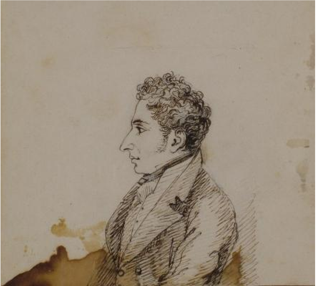
Leopardi, ritratto di Biagio Marini.

meglio, all'abiezione. Situazione che ha una via d'uscita paradossale: un'intimità con il sentimento della propria alterità intesa come inettitudine che si configura come estremo atto di onestà intellettuale e morale, unica forma di esistenza e di libertà possibile e abitabile.