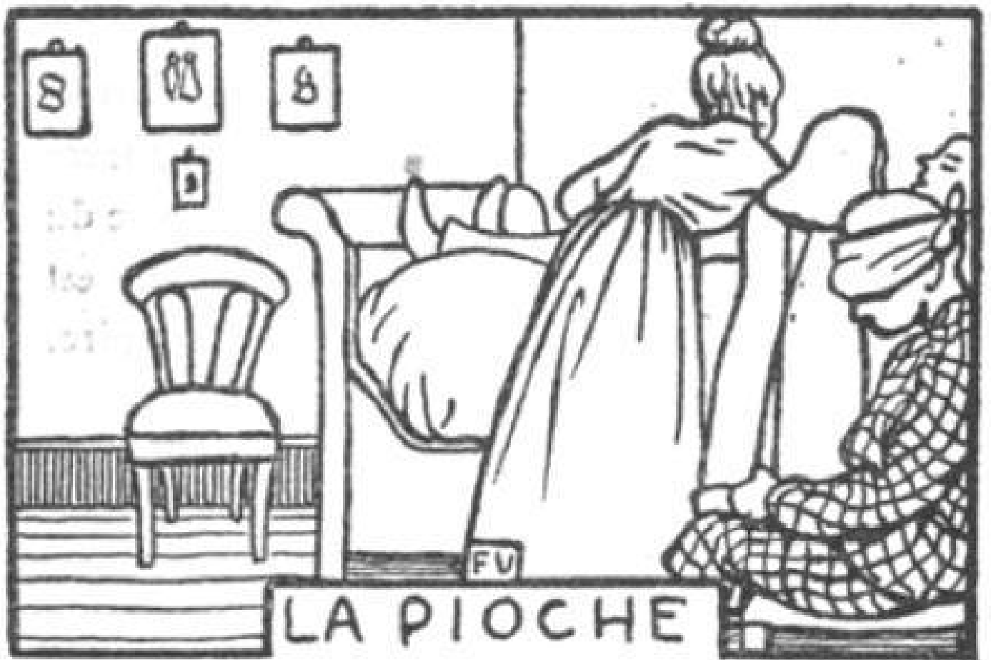
Pel di carota, illustrazioni di Felix Vallotton Flammarion, 1902.