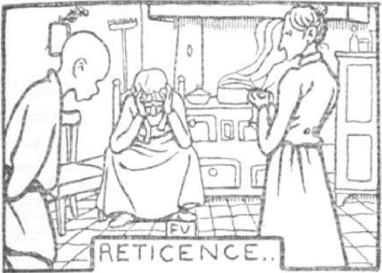
Pel di carota, illustrazioni di Felix Vallotton Flammarion, 1902.

Quest'estate mentre riflettevo su questo tema mi sono trovata a leggere le biografie di Franz Kafka e Giacomo Leopardi, scrittori per i quali l'età infantile si configura come laboratorio esemplare di quelle che furono tutte le vicende biografiche successive. Le due famose lettere al padre di cui sono autori, entrambe mai consegnate ai diretti interessati, ma finite nei libri di storia della letteratura, sono probabilmente il resoconto più lucido, doloroso ed esaustivo dell'esperienza della propria alterità rispetto alle personalità dei padri, alle loro aspettative, alla loro presenza nell'ordine familiare e in quello esistenziale dei figli. In entrambe le lettere, esattamente come succede in Pel di Carota , la tragedia dell'inadeguatezza, dell'inefficienza alla vita così come si è chiamati a impersonarla secondo chi l'ha data, il padre (e anche la madre, nel caso di Leopardi e Renard), appare unilaterale: quello che per i figli fu il dramma della vita, per i padri (o le madri) è un evento marginale, sostanzialmente invisibile o crudelmente ordinario. È nell'ordine delle cose sia non dare riconoscimento all'alterità del figlio sia trascurare come inesistenti le conseguenze di questa indifferenza, atto che si traduce per il figlio in una condanna all'inesistenza o,