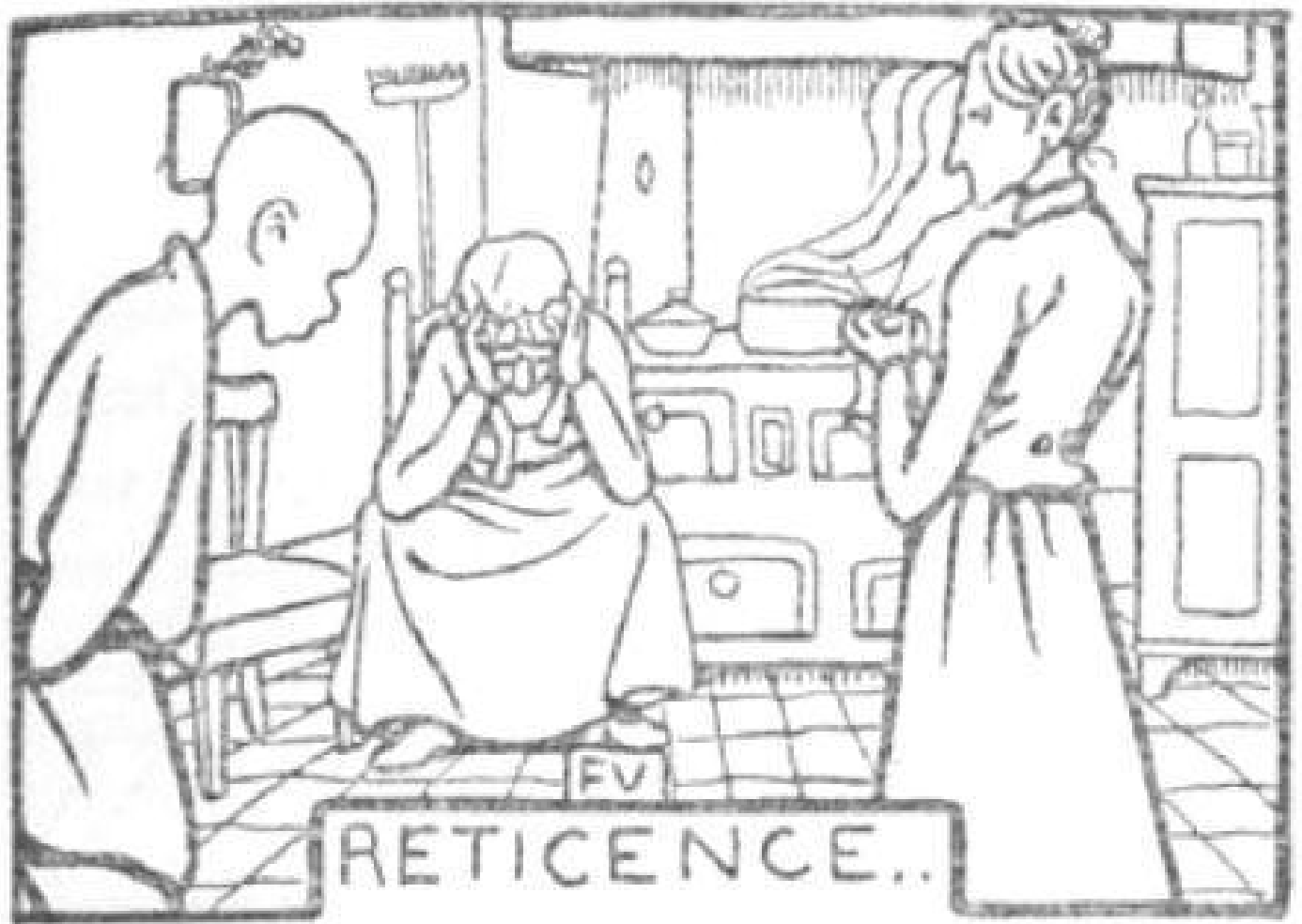
Pel di carota, illustrazioni di Felix Vallotton Flammarion, 1902.