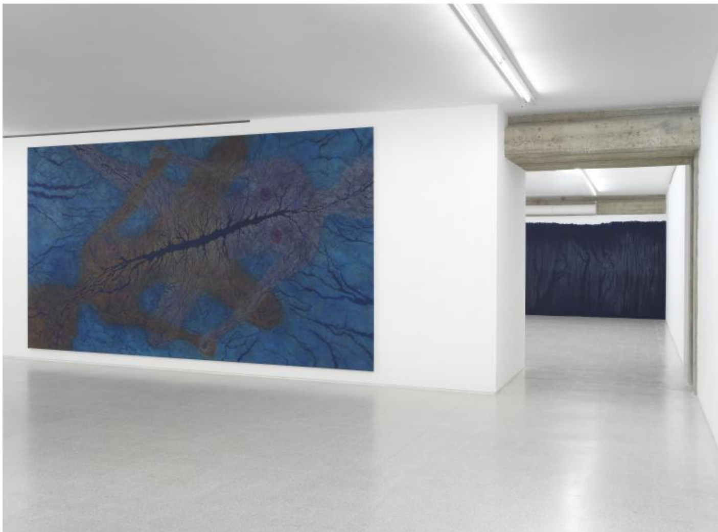
Luisa Rabbia Love Veduta di mostra alla Collezione Maramotti, 2017 / Exhibition view at Collezione Maramotti, 2017

La relazione tra spazio empirico, tangibile della tela, e spazio interno della rappresentazione rimanda inoltre alla lezione di Agnes Martin, artista amata da Rabbia e la cui presenza aleggia tra le tele. Tra le due artiste non si può parlare di rapporto di filiazione né di citazionismo, piuttosto si tratta di mondi contigui che risuonano l'uno nell'altro, accomunati da una volontà di scarnificazione dell'opera tesa a far emergere una verità profonda, universale e a tratti scandalosa.