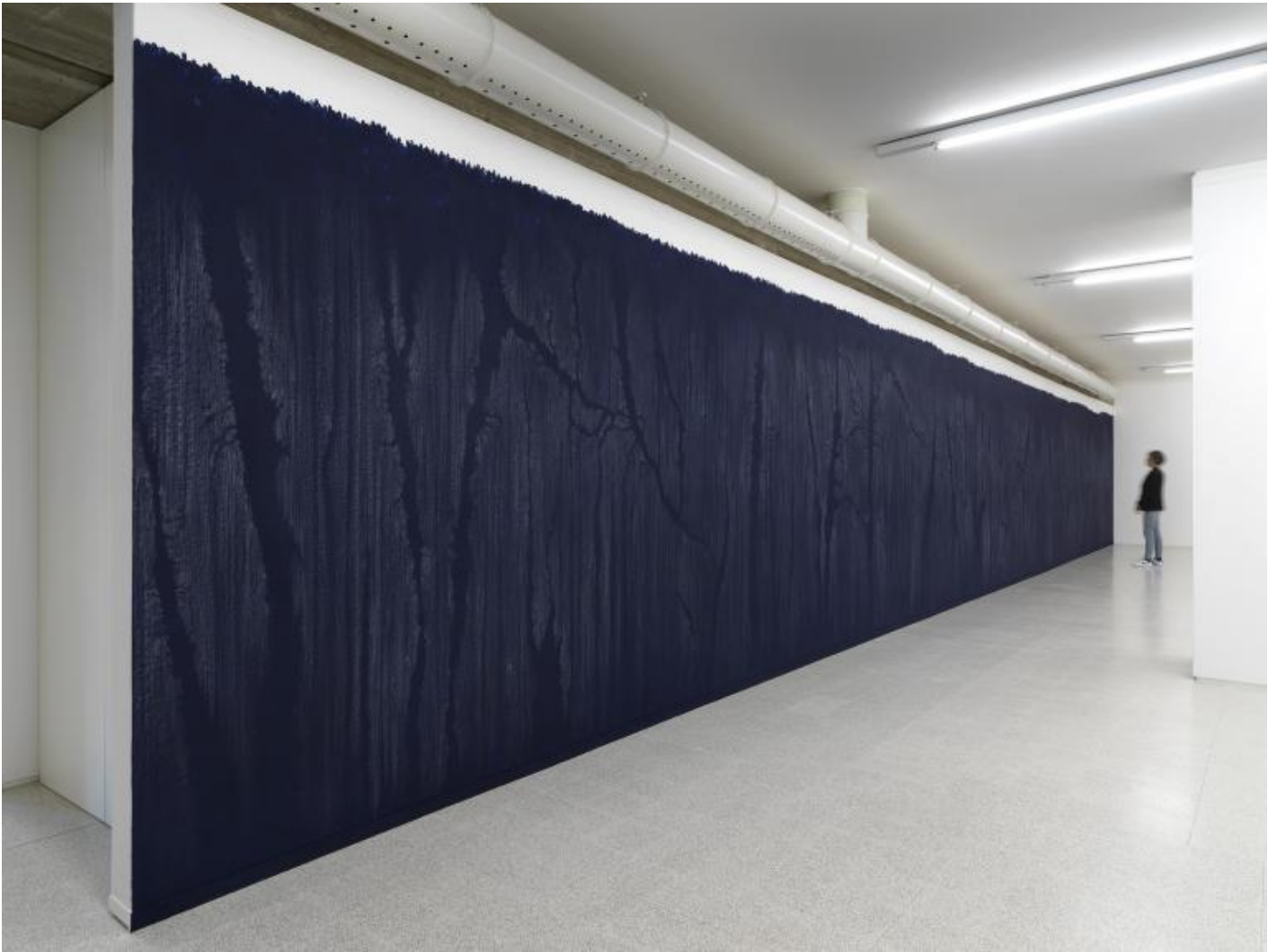
Luisa Rabbia Another Country 2017 pastello a cera, acrilico / wax pastel, acrylic 2,56 x 17,28 metri site specific per Collezione Maramotti / site specific for Collezione Maramotti

Pur avendo sperimentato linguaggi differenti, che spaziano dal video alla scultura, il medium d'elezione di Luisa Rabbia è il disegno, con la sua forza segnica e la relazione diretta con il gesto. Se è convenzione identificarlo come disciplina concettuale per eccellenza, nel lavoro di Rabbia esso è anche traccia del corpo, prediletto per la sua forza espressiva a fronte della sua scabra specificità. Proprio per questa virtù, l'artista lo elegge a linguaggio primario durante il primo periodo dell'esperienza negli Stati Uniti, dove le contingenze la portano a prediligere un medium leggero, che le consenta una gamma espressiva vasta ma senza la necessità di ampi spazi d'installazione o tempi di produzione estesi. In fondo, una semplice penna blu e un foglio di carta possono generare interi mondi.